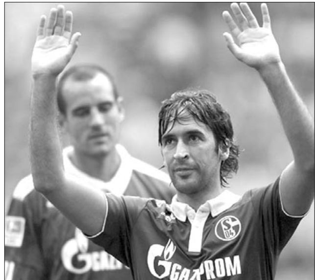
A Schalke 04 csatáraként is megtalálta a góllövő cipőjét Raúl

A francia Ligue 1 12. fordulójának szombati eredményei: AC Arles-Avignon–SM Caen 3-2, Girondins Bordeaux–Valenciennes 1-1, St-Étienne–Lorient 1-2 (!), Sochaux–AJ Auxerre 1-1, Stade Rennes–Olympique Lyon 1-1. ◀