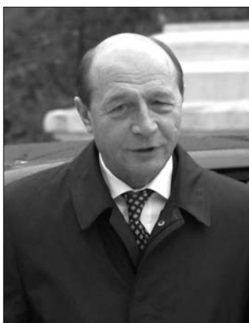
Traian Basescu

A civil szervezetek emlékeztetnek arra, hogy korábban az ál-