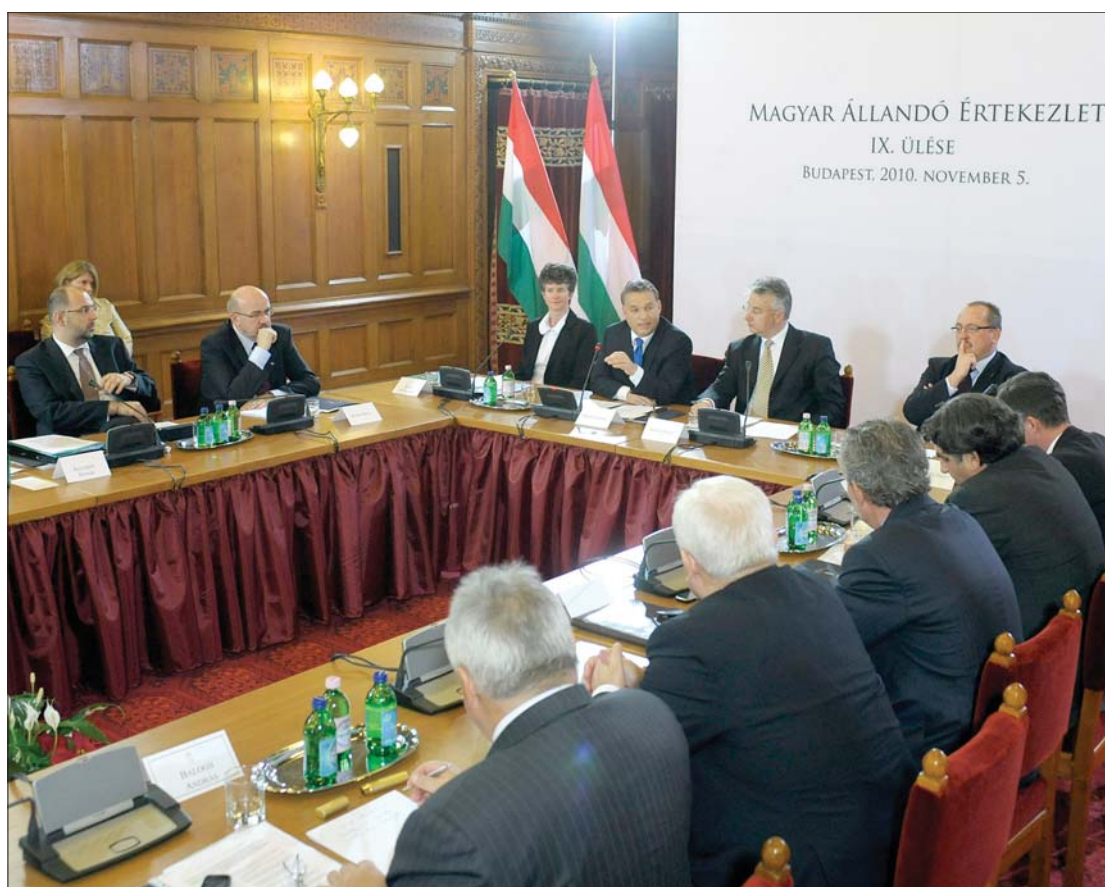
Szolidaritás az erdélyiekkel. A MÁÉRT zárónyilatkozata sürgeti a román oktatási törvény elfogadását