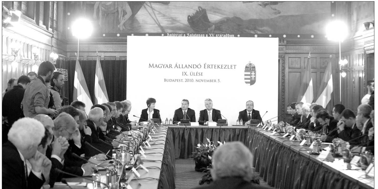
Hat éves szünet után először hívta össze a budapesti kormány a Magyar Állandó Értekezletet. A zárónyilatkozatot mindenki aláírta