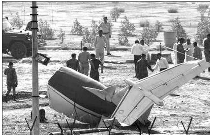
A pakisztáni légitársaságban darabokra hullott a repülőgép

Felszállás után rövid idővel kénytelen volt visszafordulni és leszállni a szingapúri reptéren a Qantas ausztrál légitársaság Boeing 747-es gépe pénteken. A Szingapúrba tartó repülő fedélzetén 431 ember utazott. A pilóta azért fordult vissza a géppel, mert az egyik motor hibáját észlelte. A Qantas légitársaság egy másik, Airbus A380-as típusú gépe csütörtökön hajtott végre kényszerleszállást a szingapúri repülőterén, mert az egyik hajtóműve felrobbant. ◀