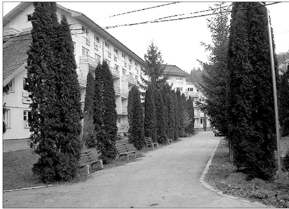
A kis intézmények „ügyeskednek”. A kovásznai szívkórház külföldről vár pácienseket

A profil kiszélesítésében bízik a Szatmár megyei Avastújváros kórházának vezetője is: ez az intézmény regionális feladatot kíván ellátni. Nagykárolytal vagy Tasnáddal ellentétben az avasi kisváros önkormányzata nem vette át a kórházat, mert itt nemcsak a helyi lakosokat, hanem a teljes avasi régió betegeit kezelik. A kórház működtetését a megyei önkormányzat vette át, tekintettel arra, hogy Szatmár megye lakosságának 18 százalékáról ebben az intézményben gondoskodnak. ◀