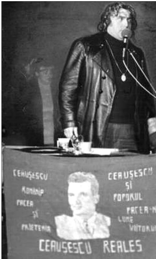
Adrian Păunescu több mint 1600 rendezvényének egyikén. A főszereplő nem a folkzene volt, hanem Nicolae Ceaușescu

Păunescu földi pályafutása végeztével is hat: halála, temetése most ugyanolyan hisztériát váltott ki országos szinten, mint a diktátort, a kommunizmust dicsőítő rendezvényei, versei annak idején a stadionokban. ◀