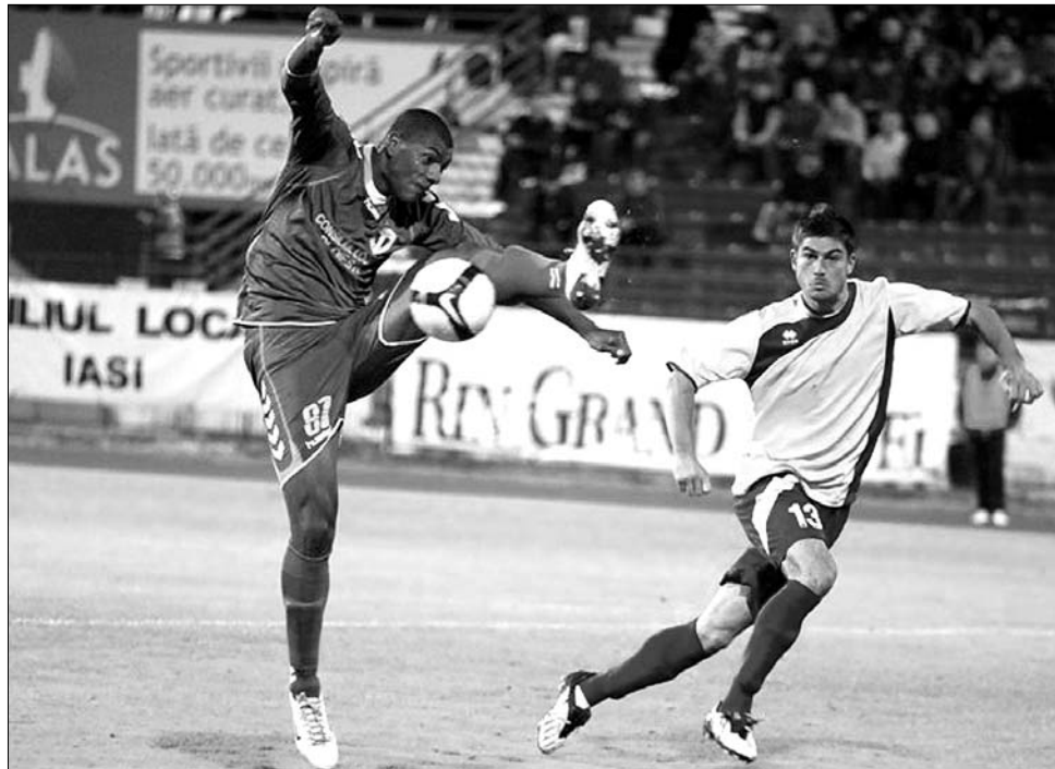
Nagyszebenben némi meglepetésre az újonc Voința 1-0-ra legyőzte a Petrolul Ploiești-et