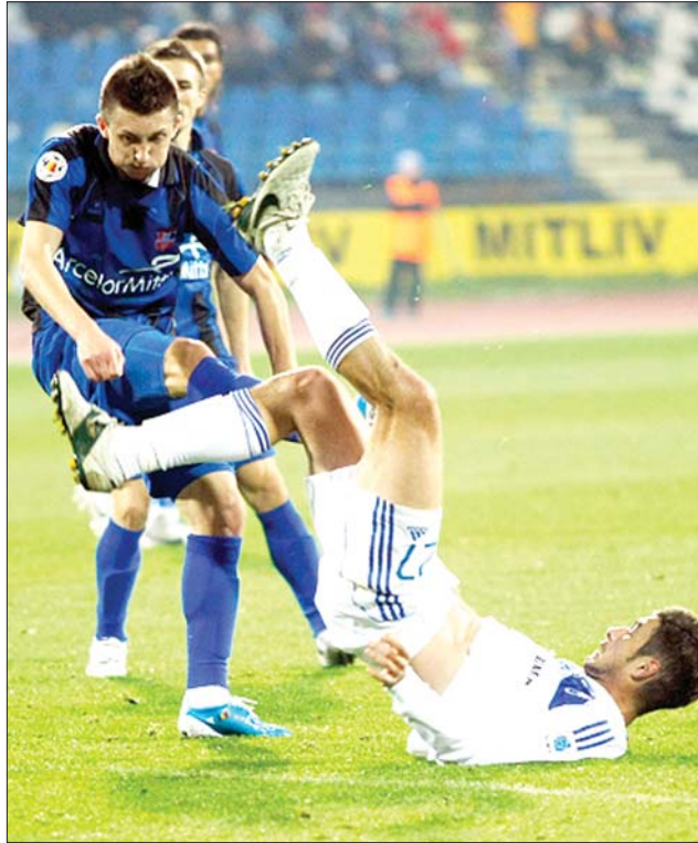
A galaciak (kék mez) két vállra fektették a Craiovát is