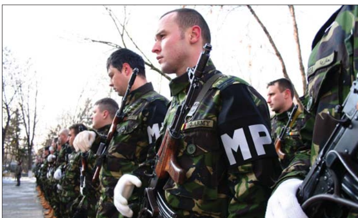
Romániának csak „papíron” van elegendő hivatásos katonája