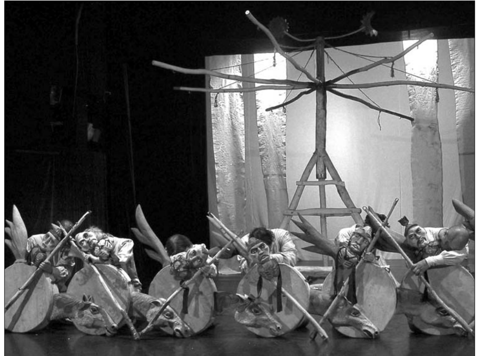
A nagyvárad Liliput társulat a Csillaglépő Csodaszarvast adja elő a kolozsvári bábfesztiválon

A seregszemle több helyszínen is zajlik, így a Puck Bábszínház termén kívül a városi Katonakör, az Állami Magyar Opera, a Kolozsvári Állami Magyar Színház, valamint a román Nemzeti Színház épületé-