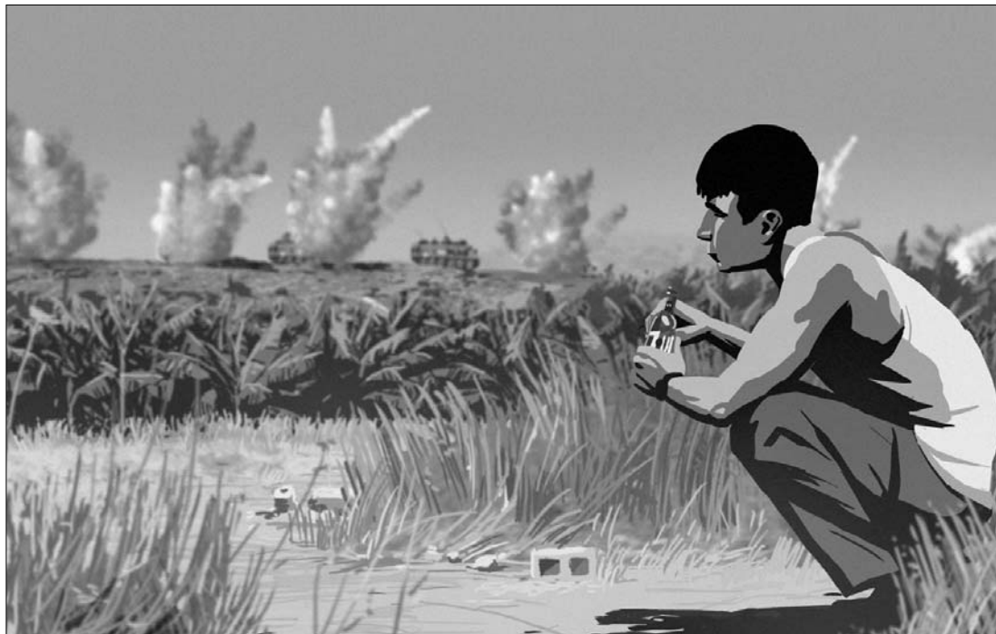
A nagyvárad 3. Metrion Animációs Filmfesztivált az izraeli Ari Folman Libanoni keringője nyitja