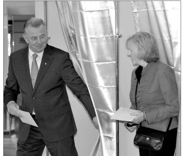
Magabiztosság. Schmitt Pál államfő és felesége voksol

A részvételi arány az országra vetítve ezúttal is igencsak hullámzó volt, és általában nem is mondható túlzottan magasnak. Ennek az adatnak azonban most csak a statisztika szempontjából van különösebb jelentősége, hiszen egyfordulós választásról van szó, és az nyer, aki a legtöbb szavazatot kapja, nincs érvényességi küszöb. ◀