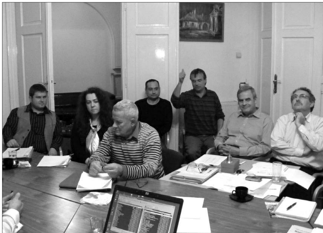
Kupaktanács az EMNT-nél. Új erdélyi magyar pártot alapítanak Tőkés László európai parlamenti képviselő hívei

„Populista és demagóg azoknak a szemlélete, akik szerint az egység szaporodással oldható meg” – reagált az EMNT pártalapítási szándékára tegnap Kelemen Hunor. Az RMDSZ-es kulturális miniszter úgy véli, a szövetségben minden feltétel adott ahhoz, hogy az egységet megteremtsék, de ezt nem új magyar politikai párt létrehozásával lehet megvalósítani. „A felvidéki példa kell a szemé előtt lebegjen azoknak, akik 2010-ben új pártot alapítanak” – fejtette ki Kelemen, aki ugyanakkor meg van győződve arról, hogy az RMDSZ 2012-ben is bekerül a parlamentbe, még akkor is, ha az új párt alapítása veszélyt is jelent. ►