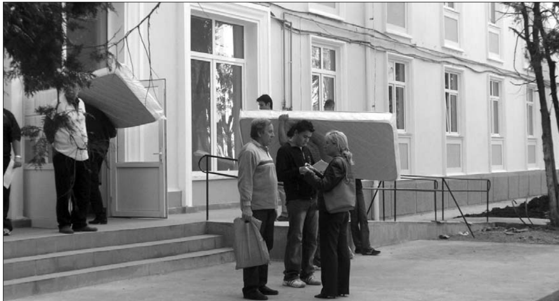
Hajtóvadászat folyt a kollégiumi helyekért, sokak továbbtanulása múlhat ezen a ma kezdődő tanévben.

„Nem mindegy, hogy havi nyolcvan vagy nyolcszáz lejt fizet az ember a lakhatásért. Aki nem akar drága albérlésbe kerülni, öszszekötötést keres és fizet, feltéve, ha nem teljesít rendkívül jól az egyetemen. Érdem szerint ugyanis nagyon nehéz kollégiumi férőhelyet kapni” – teszi hozzá a fel-