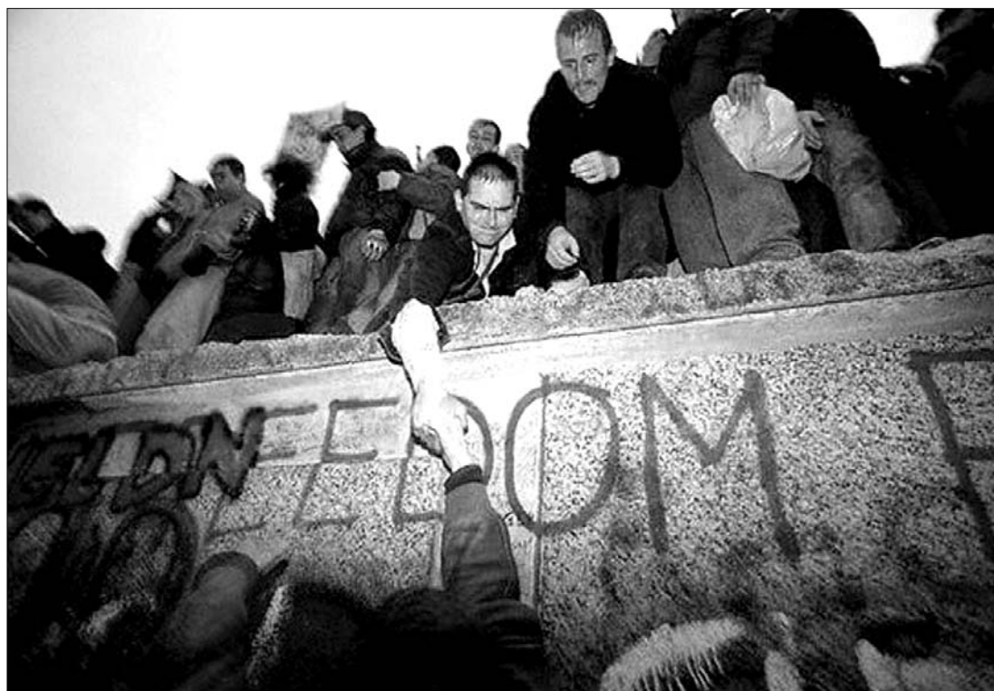
Minden a berlini fal lebontásával kezdődött. Most attól tartanak, hogy újabb, másféle megosztottság következik