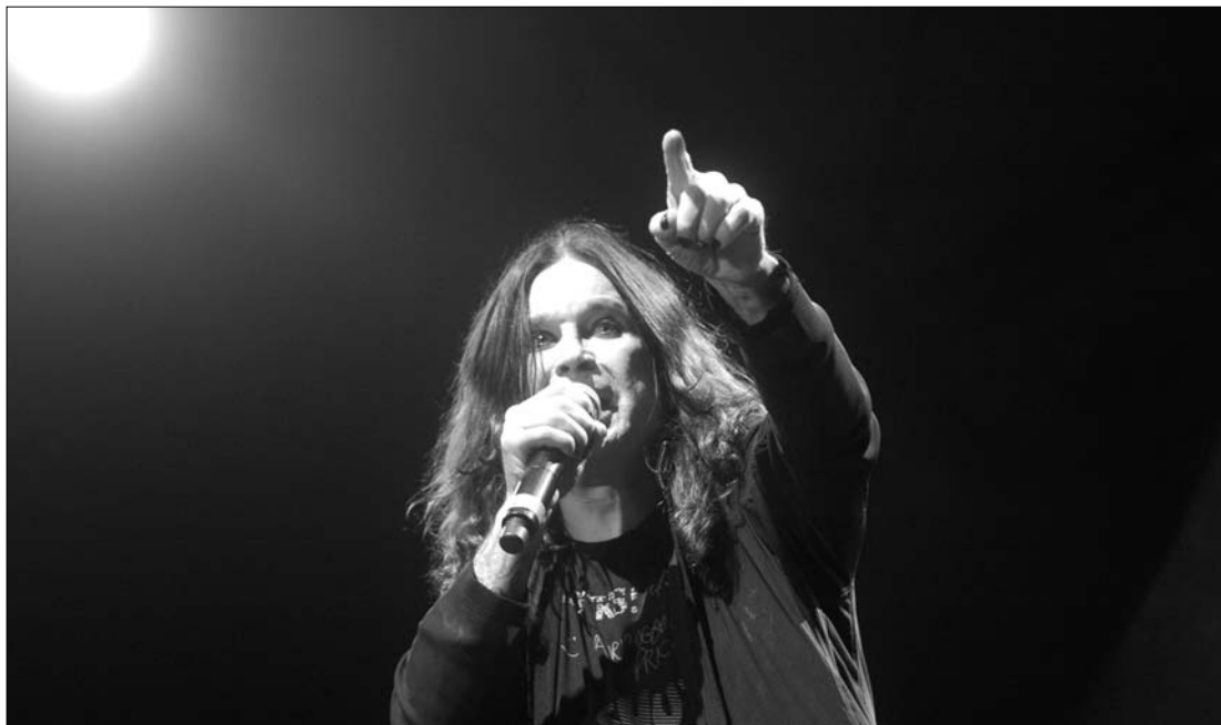
Ozzy Osbourne szombati koncertjén Bukarestben bizonyította, méltó a „legendás” jelzőre

felcsendültek a legújabb, Scream című albumának dalai, köztük a Let Me Hear You Scream és a Mr. Crowley is. De a rajongók az énekes legörültebb korszakából is hallhattak dalokat, köztük a Fairies Wear Boots , a The Road to Nowhere és a Suicide Solution . A közel kétórás show-t, melyen a szervezők bejelentéséhez híven felvonultatták az énekes „szólólemezeinek visszatérő szereplőit, legyen az ördög, angyal, rém vagy pedig szellem” – a Paranoid című dallal zárta Ozzy. ◀