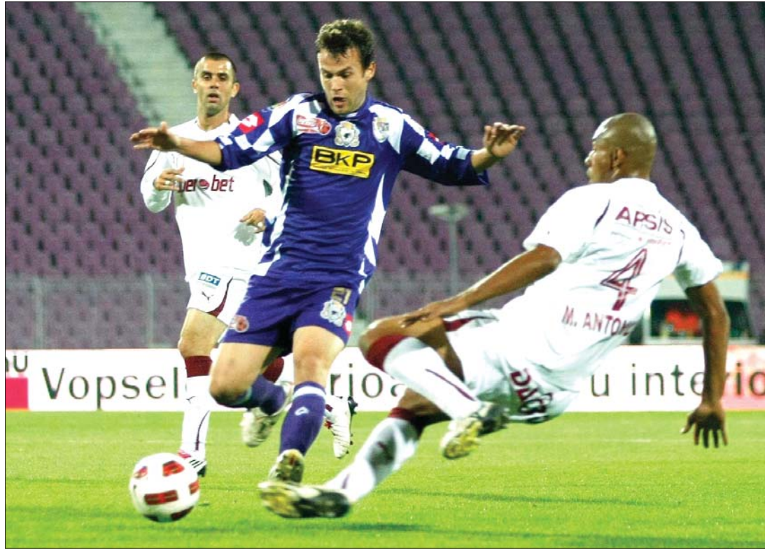
A temesváriak (kék mez) megfordították a bukaresti vasutasok idegenbeli góljával indult mérkőzést