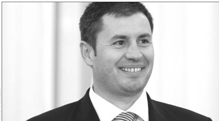
Traian Igaş belügyminiszter, a „médiamogul-ellenes” kórus új tagja

„Két mogul és két politikus összefogott az államelnök felfüggesztése érdekében, fityet hányva az alkotmányra és az ország érdekeire. Azok a mogulok és politikusok nincsenek tekintettel a történelem tanulságaira” – idézte Emil Boc hétvégi nyilatkozatát az Agerpres . A miniszterelnök kifejtette: a külföldi befektetők hiányáért, az ország negatív megítéléséért azoknak a médiatársítóknek a tulajdonosai felelősek, amelyek a politikai instabilitást akarják, és ezért akár az államfő fel-