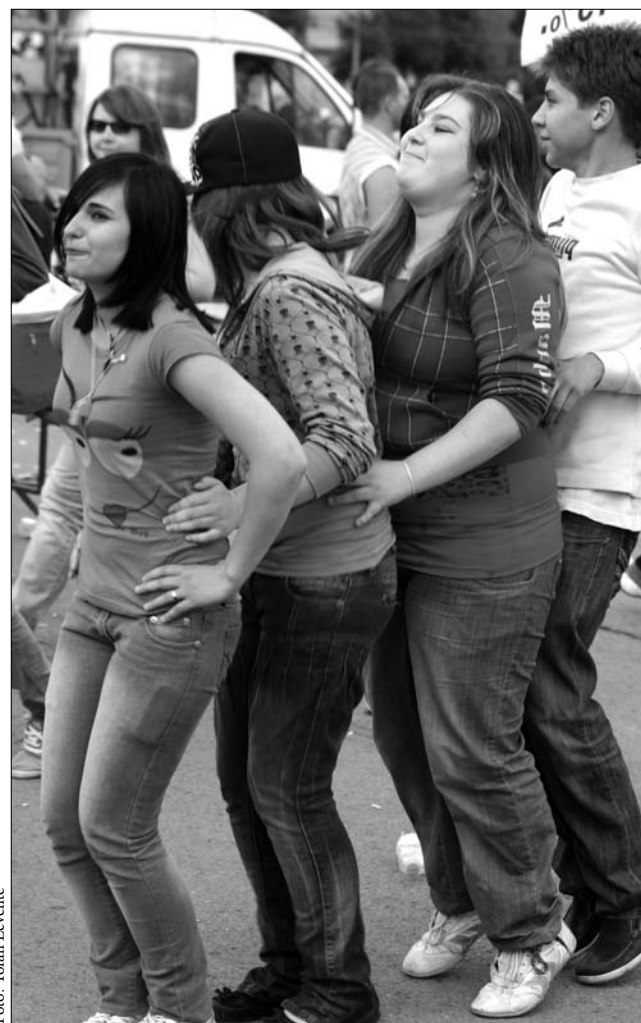
„Pingvintáncba fulladt” tüntetés a bukaresti kormánypalota előtt

Petcu és Hossu szerint egyébként állandó jellegű megmozdulásokat kellene szervezni, Bukarest fontos tererein, útkereszteződéseinél, elzárni főútvonalakat, európai országutakat, Baci elnyúló, munkalassítást javasol, a munkahelyi rendszabályok tiszteletben tartása mellett: így például, stratégiai pontokon, naponta néhány percre le kellene állítani az áramszolgáltatást, a városoknak, rendőröknek pedig a csomagok, autók elhúzódozó átkutatásával, vizsgálattal kellene kizökkenteniük a dolgok menetét normális kerékvágásából. ◀