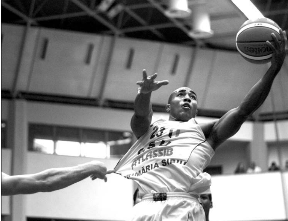
Hiába a szebeniek idegenlégiósának igyekezete, a házigazdák kikaptak a ploiești-iektől

A hetedik helyen zárt Oroszország női kosárlabdaválogatottja a Csehországban rendezett világbajnokságon, miután a tegnapi helyosztón 87-76-ra legyőzte Dél-Koreát. A többi mérkőzés, így a Csehország–Egyesült Államok döntő is, lapzártánk után fejeződött be. A házigazda csehek 81-77-re múlták felül a fehéroroszkokat az elődöntőben, míg az amerikaiak a spanyolokat verték meg 106-70-re.