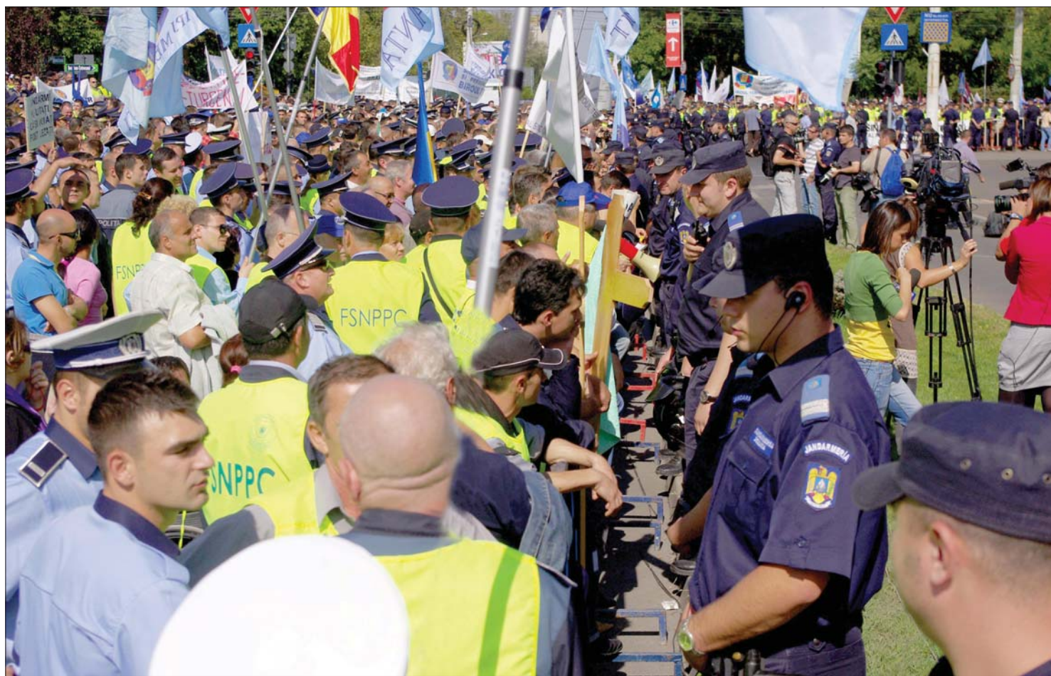
„Gyere ki, te ocsmány dög!” Így invitálták párbeszédre a Cotroceni-palota előtt tüntető rendőrök Traian Băsescu államfőt

Traian Băsescu nem kér többé rendőri védelmet a hétfégi elnökellenes tüntetés miatt