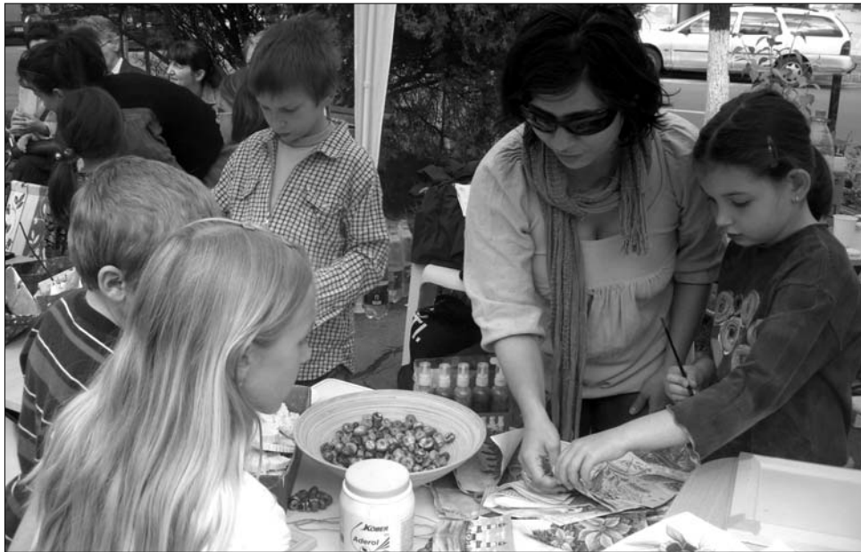
Szakemberek, pedagógusok vezetik a különböző készségfejlesztő foglalkozásokat

Az október 11-én kezdődő foglalkozások keretében az óvodásoknak általános képességfejlesztő csoportot indítanak, ahol a kicsiket játékosan tanítják angolul, fejlesztik a zenei hajlamukat, a rajzkészséget, de barkácsolás, gyerektorna és környe-