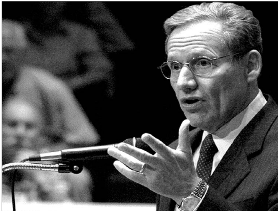
Robert Woodward – a Fehér Ház „réme”

Woodward amolyan vonakodó háborús elnökként állítja be Obamát, aki több csapatot akar kiküldeni, de nem áll szándékában „hosszú távú államépítésbe kezdeni”, mert „semmi esetre sem fogok dollármilliárdokat kiadni”. Elvégre minden a választók szavazatairól szól, s ezt jól