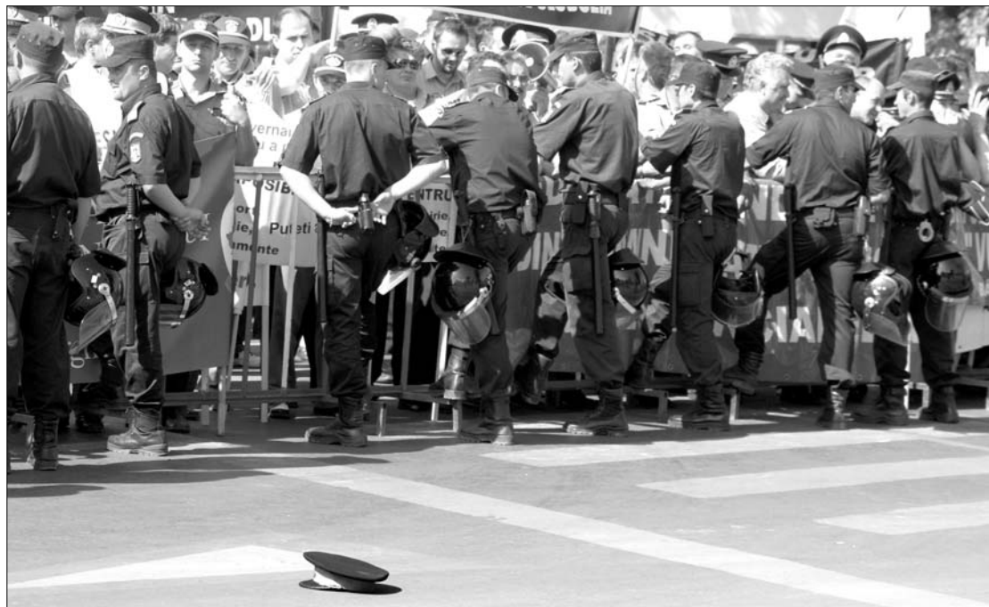
Az elnöki hivatal előtt tüntető rendőrök egységsapkájukat a földre, illetve a palota udvarára dobálták

Băsescu bejelentésére reagálva tegnap Crin Antonescu, az ellenzéki Nemzeti Liberális Párt (PNL) elnöke bejelentette, kezde-