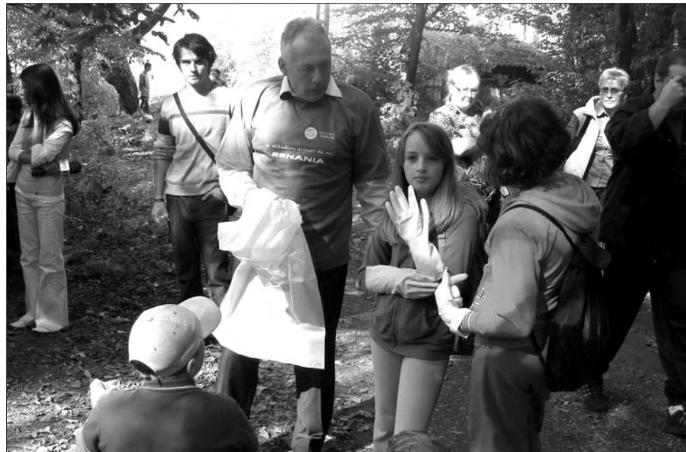
Borbély László környezetvédelmi miniszter Marosszentgyörgyön vett részt a takarításban.

Kolozs megyében 11 ezer önkéntes jelentkezett az akcióra. A program koordinátorai által verbuvált csapatok a kora reggeli órákban a város különböző pontjain látták neki a takarításnak. „Nagyon örülök, hogy ma itt lehetek ezekkel a csodálatos emberekkel, és valami nagyon fontosat csinálhatok. Azt hiszem, itt ma valóban egy életerős civil összefogásnak vagyunk a tanúi: nem mindegy, hogy szemetes vagy tiszta országban, megyében, városban lakunk. Nem könnyű munka, sokszor gyomorforogató látványban van részünk, de annál jobb érzés tudni, hogy megtisztítjuk a szem-