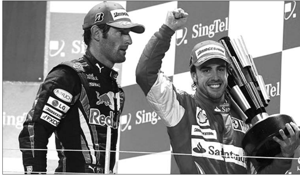
Fernando Alonso (jobb) rajt-cél győzelmet aratott a Forma 1 idei 15. versenyén