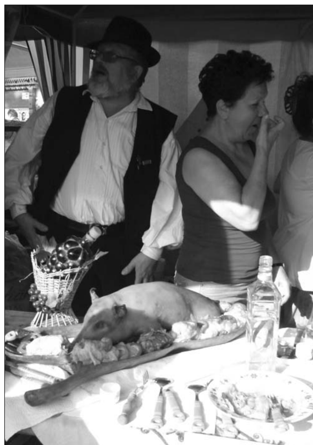
Terülj, terülj asztalkám Parajdon.