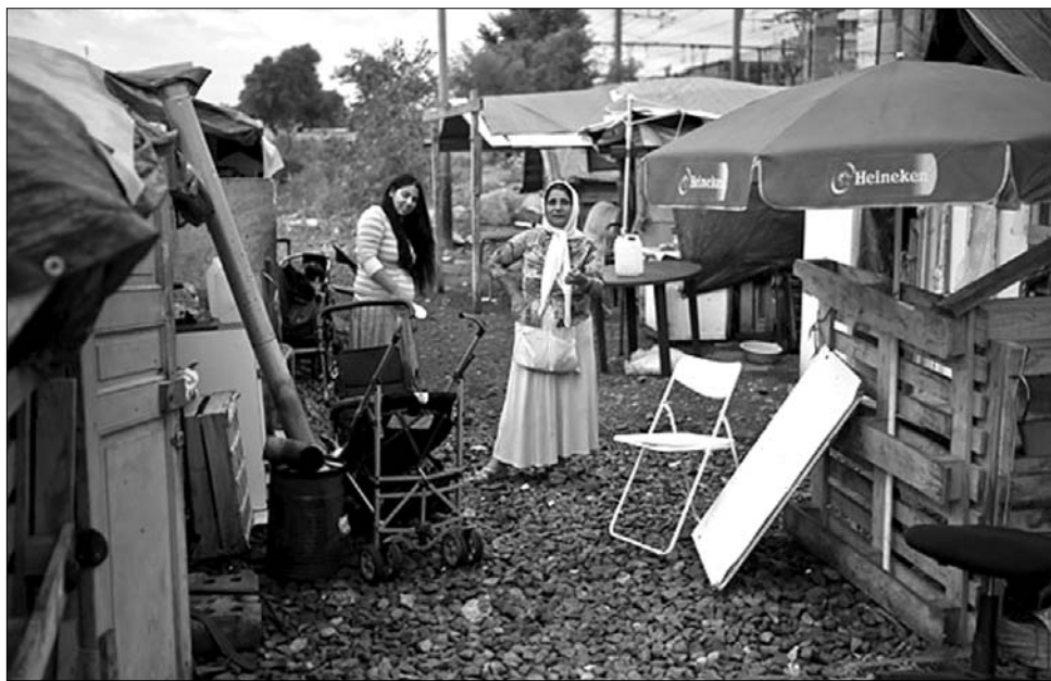
Roma csendélet – valahol egy nyugat-európai város határában létesített illegális telepen

hez jussanak.” Európában azonban „nem lehet helye a rasszizmusnak és az idegengyűlöletnek”. Augusztus eleje óta szófiai kormányzati adatok szerint mintegy negyven bolgár romát utasítottak ki Franciaországból, miközben a hazatoloncoltak túlnyomó többsége (a számuk nyolcezerre tehető) romániai eredetű. Talán ez a nagy különbség a legfőbb indoka annak, hogy a bolgár kormány gyakorlatilag üdvözölte Párizs lépéseit. „A jog a szabad költözködéssel nem jelenti egyúttal a letelepedési jogot is” – jelentette ki Nikolaj Mladenov külügyminiszter a bolgár állami rádióban; szerinte ugyanis a romák beleegyezése a hazatérésre a francia lépés jogszerűségét igazolja. (A szófiai kormány a 2011-re várható schengeni belépést hozta fel visszafogottságának indokául.) Eközben Szófiában nagyjából százötven roma tiltakozó gyűlést szervezett a francia nagykövetség épülete elé, hogy Nicolas Sarkozynek címzett levélben ítéljék el az elnök és kormánya „diszkriminációs politikáját”. A tüntetők pártját fogta a szocialista köztársasági elnök,