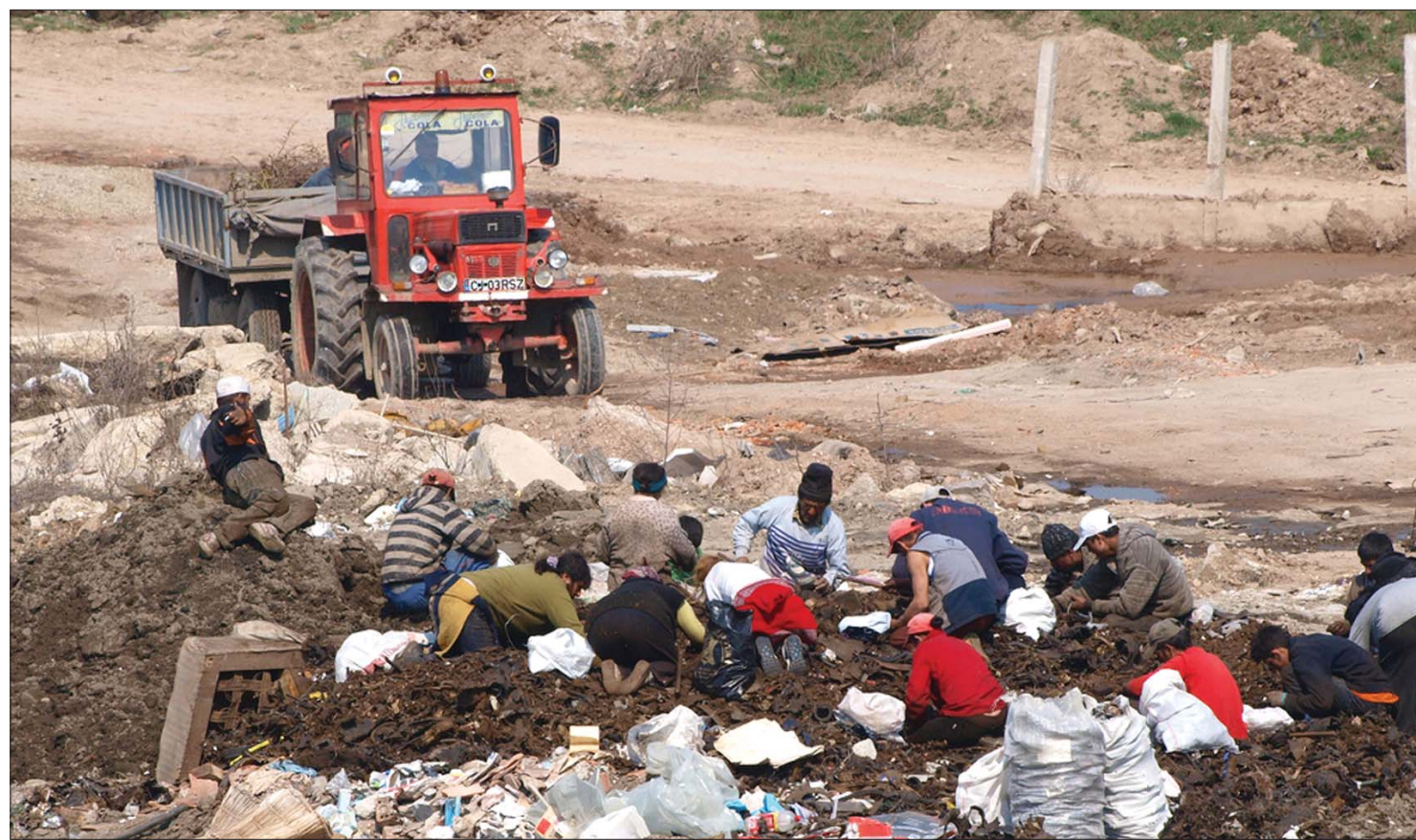
„Kincsesváros-brand”. A kolozsvári Patarét cigánytelepéről a svájci Blick bulvárlap két újságírója közölt riportot a múlt héten