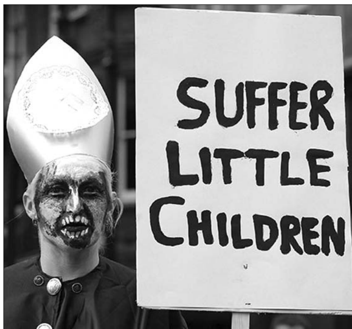
VI. Benedek nagy-britanniai látogatásán egymást követték a tüntetések

VI. Benedek pápa, aki négy napos állami látogatáson tartózkodik Nagy-Britanniában, szombaton először az angol-walesi katolikus közösség londoni főtemplomában, a Westminster székesegyházban mutatott be misét. A szertartáson elmondott homíliájában külön kitért a katolikus papok által a korábbi évtizedekben elkövetett visszaélésekre, kijelentve: mélyesen sajnálja a történeteket. A sértetteket ártatlan áldozatoknak, a visszaéléseket pedig „elmondhatatlan, megvetendő bűnök” nevezte, amely szavai szerint „szégyent és megaláztatást” hozott az egész egyházra. Londoni kommentárok szerint ez volt az eddigi legerőteljesebb bocsánatkérő megnyilvánulás a pápa részéről az egyházat világszerte megrázó visszaélési botrány kibukkanása óta.