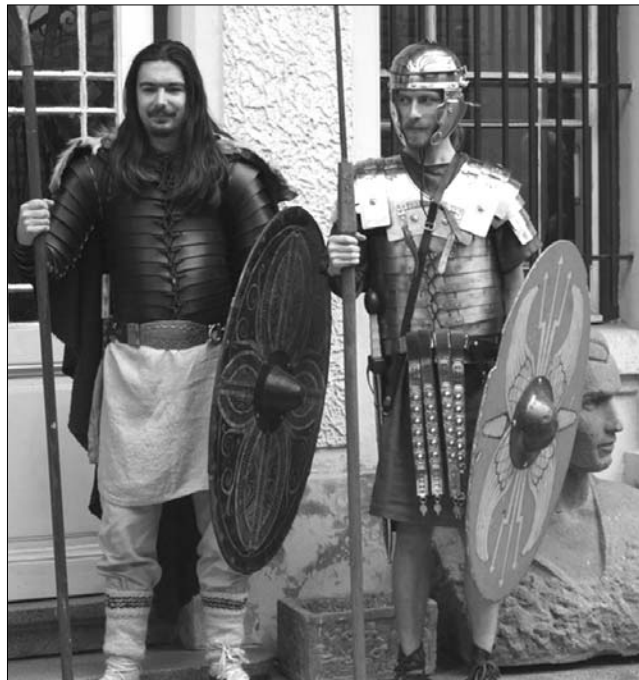
Bronzkori népek katonái Székelyudvarhelyen