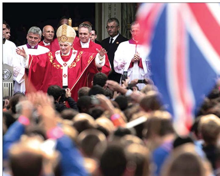
A pápa Londonban kért bocsánatot a pedofília áldozataitól

▶ Megkövette szombati londoni miséjén a katolikus egyházfő az egyházi személyiségek szexuális visszaéléseinek egykori gyermekáldozatait, és a nap folyamán személyesen találkozott is a visszaélések elszennvedőinek egy csoportjával. Késő este tízezrek előtt tartott szabadtéri misét a Hyde Parkban. VI. Benedek pápa, aki négy napos állami látogatáson tartózkodik Nagy-Britanniában, szombaton először az angol-walesi katolikus közösség londoni főtemplomában, a Westminster székesegyházban mutatott be misét. A szertartáson elmondott homíliájában külön kitért a katolikus papok által a korábbi évtizedekben elkövetett visszaélésekre, kijelentve: mélységesen sajnálja a történeteket. 2. oldal ▶