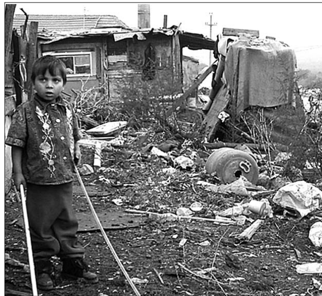
A romastratégiák továbbra is csak papíron léteznek, a nyomor marad