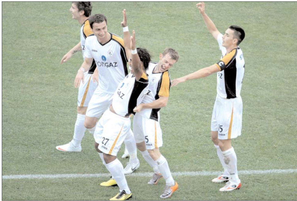
A továbbra is remekül szereplő Gaz Metan újabb három pontot gyűjtött be a Liga 1-ben

Ma Besztercei Gloria-Brassói FC és Steaua-Astra Ploiești mérkőzéseket rendeznek. ◀