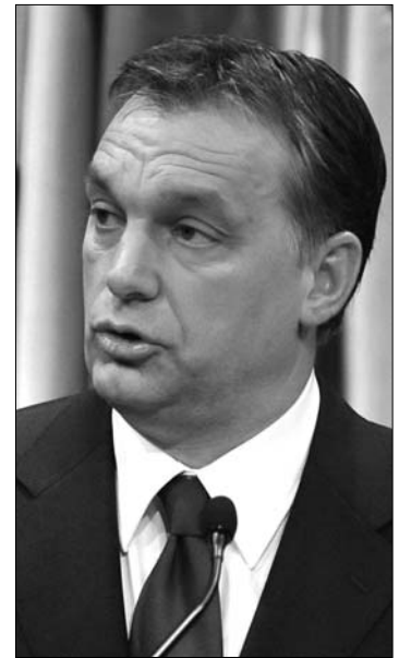
Orbán Viktor kormányfő

► Elfogadom, hogy a bűnözők között bizonyos vonásokkal rendelkező emberek nagyobb számban vannak, mint mások, de minden olyan megnevezés ellen tiltakozni fogok, amelyből az következne, hogy azért, mert az ember valaminek születik, potenciális bűnözővé is vált – jelentette ki tegnap az országgyűlésben Orbán Viktor. A magyar miniszterelnök hétfőn, a napirend előtt elhangzottakra reagálva a „cigánybűnözés” kifejezéssel kapcsolatban – a mondandóját kifejezetten a Jobbiknak szánva – leszögezte: a kormány szerint nem kell eltagadni a valóságot, azt a politikának meg kell neveznie; de mivel embereket neveznek meg, a legnagyobb körültekintéssel kell eljárni. „Egy polgártársunkkal szemben sem lehet származása, életútja, szociális helyzete megnevezése miatt méltánytalanságot elkövetni” – szögezte le. ◀