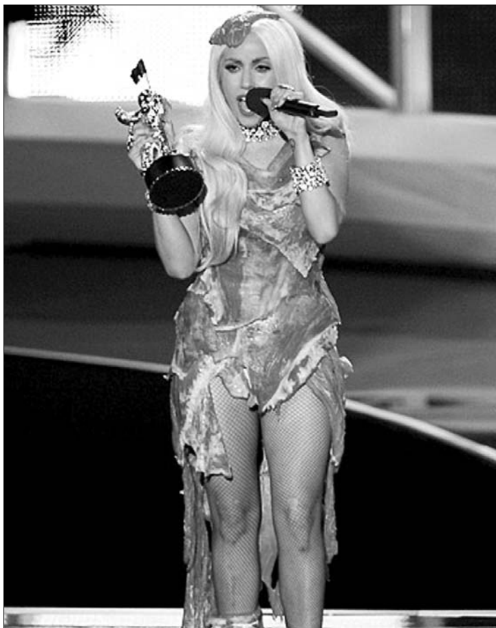
Lady Gaga húszletekből komponált „ruhakölteményt” öltött

pők tettek teljessé. A 24 éves New York-i énekesnő a legjobb női klip, a legjobb popklip, a legjobb táncos videó, a koreográfia, a rendezés és a vágás díját is begyűjtötte. Ezen felül a Telephone című, Beyoncéval forgatott klipért kiérdemelte a legjobb közös munkáért járó elismerést is. Az ezüstösen csillogó, Holdra lépő űrhajóst mintázó díj történetében 1987-ben Peter Gabriel állította be a rekordot: a brit rockzenész kilenc szobrot kapott Sledgehammer című klipjéért. Gaga a norvég A-ha együttes sikerét ismételte meg, amely 1986-ban vehetett át nyolc díjat. Lady Gagán kívül egyedül Eminem tudott duplázni. ◀