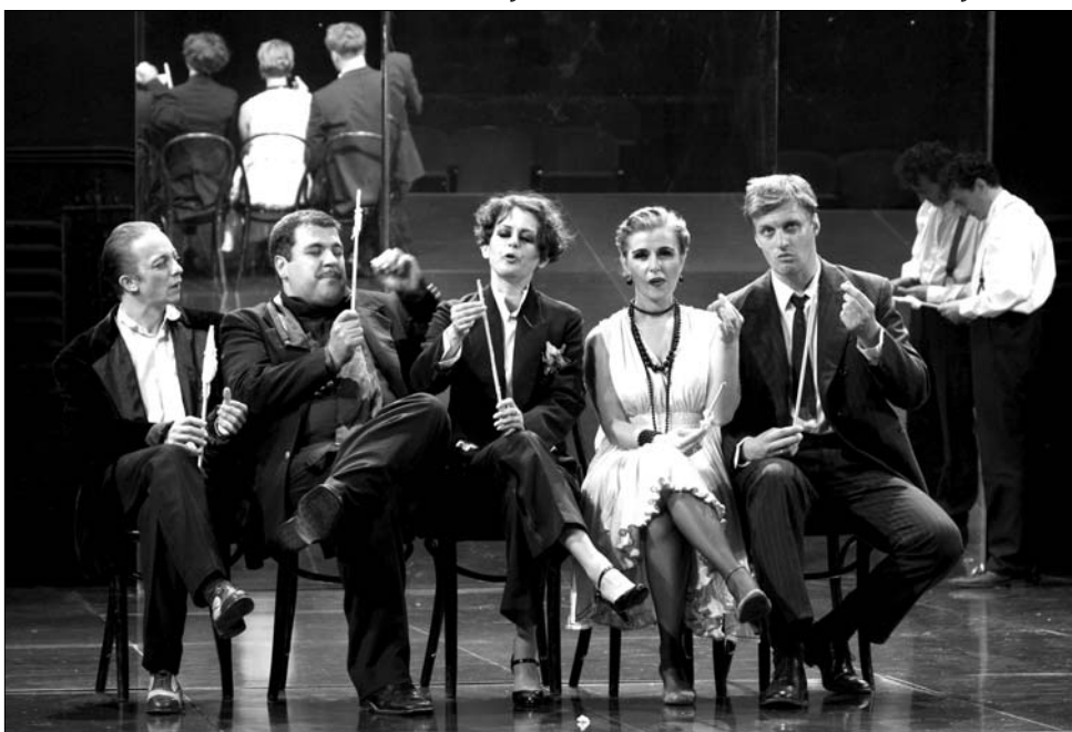
Az elmúlt évadok sikeres előadásai is láthatók lesznek az új sepsiszentgyörgyi évadban.

Bocsárdi lapunk arra a kérdésre, hogy az önkormányzat nyár eleji bizalmatlankodása mennyire viselte meg, röviden így válaszolt: „Ha a javaslatokat elfogadják és beleegyeznek abba, hogy a magam választotta munkatársakkal dolgozzam, akkor több időm marad az alkotásra is”. Amint arról lapunkban beszámoltunk Bocsárdi ösztön versenyvizsga nélkül maradhatott a sepsiszentgyörgyi színház igazgatója, miután az elmúlt öt évben folytatott tevékenységét vizsgáló bővített bizottság engedékenyebb volt, mint az első, amely nem adott neki elég nagy jegyet ahhoz, hogy folytathassa munkáját. ◀