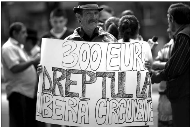
300 eurót kaptak a franciáktól az „önként” hazatelepülő romák

prefektúráknak minden kedden e-mailben kell jelentést küldeniük a minisztériumba az előző héten a megyéjükben kezdeményezett felszámolási eljárásokról. „Az illetékes prefektusoknak meg kell arról győződniük, hogy a felügyeletük alá tartozó területen hetente legalább egy jelentős művelet (kiürítés, felszámolás, kiutasítás) történt, elsősorban a romákat érintően.”