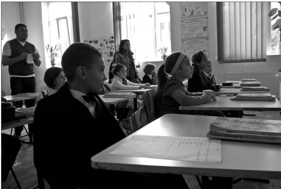
Nehéz tanév elé néznek idén a diákok és a pedagógusok is

Az idei tanévkezdés egyik legfontosabb kérdése, hogy hosszas várakozás után életbe lép-e az oktatási reformot előirányzó törvénycsomag. Markó korábbi közlése szerint az RMDSZ megállapodott a Demokrata-Liberális Párttal: ha nem gyorsul fel az oktatási törvénytervezet vitája, a kabinet sürgősségi kormányrendelettel fogadhatja el a jogszabály decentralizációra vonatkozó részét, és ennek nyomán az iskolák átkerülhetnek az önkormányzatok hatáskörébe. A kormányfő helyettes emlékeztetett arra, hogy az oktatási intézmények decentralizációja, akár-