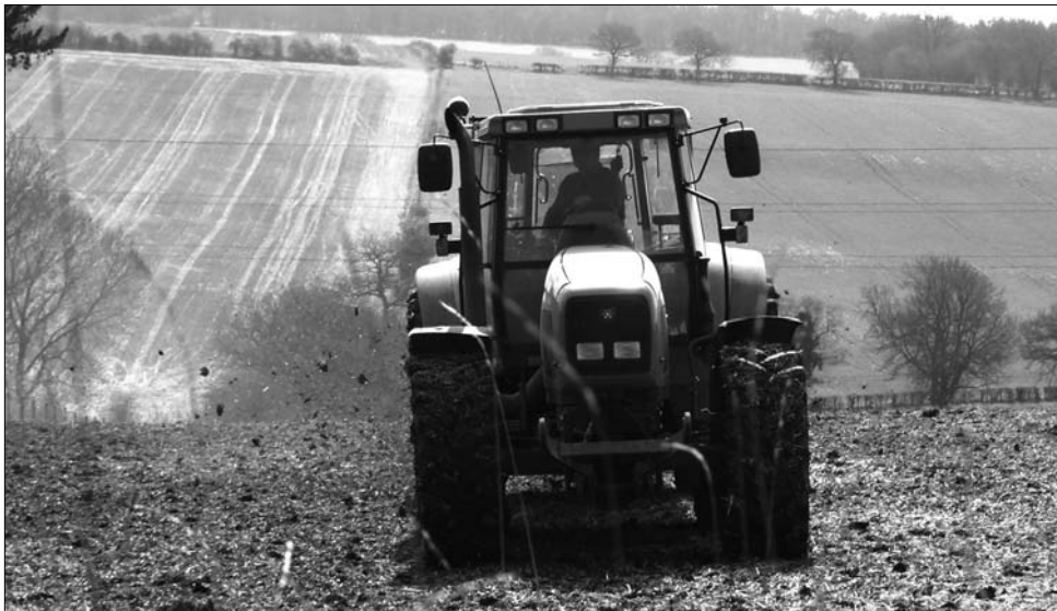
Romániában három millió hektár terület még nem látott traktort

A miniszter nem részletezte, azt, hogy mikor lépnének érvénybe a büntetések. „Konzultálnunk kell még a pénzügyminisztériumi kollégákkal. Az már szinte biztos,