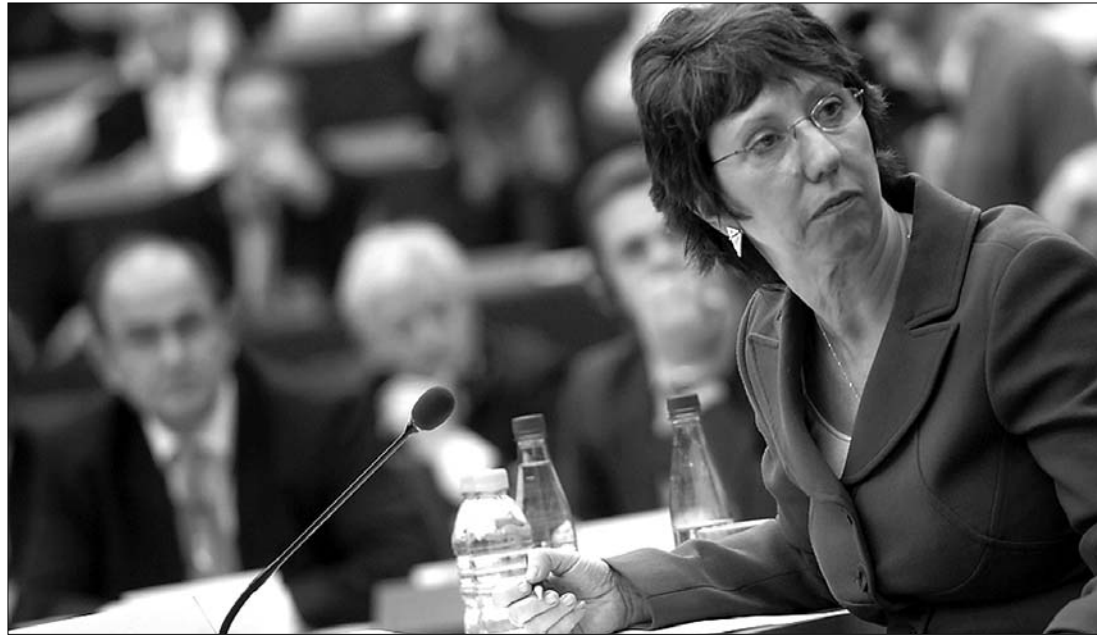
A külügyminiszterek tanácsa Catherine Ashton uniós „külügyminiszter” elnöklete alatt ülésezett Brüsszelben