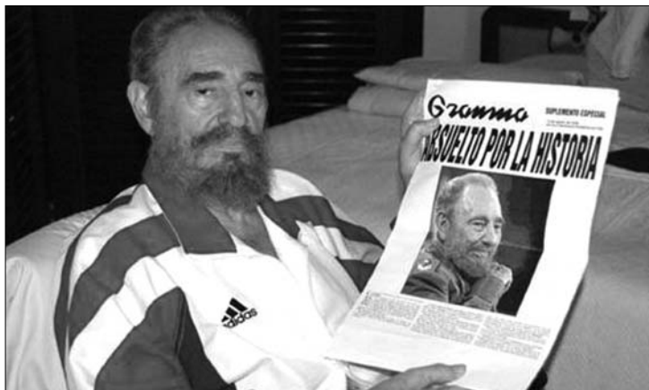
Az újságírók félreértelmezték a szavaimat – mondta Castro