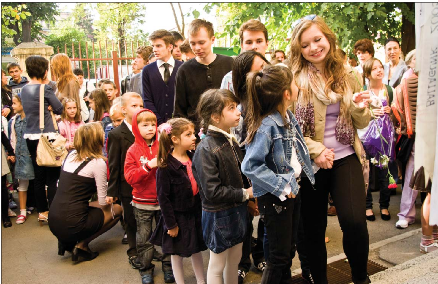
Tanévnnyitó a bukaresti Ady Endre Líceumban. Országszerte hárommillió diák kezdte el tegnap az oktatást

A pedagógusok szociális gondjai rányomták bélyegüket a tegnapi iskolakezdésre