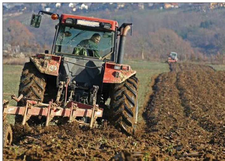
Romániában 300 millió hektár termőföld megműveletlen

▶ Hektáronként 50-60 euró büntetéssel sújtaná Valeriu Tabără mezőgazdasági miniszter azokat a gazdákat, akik nem gondozzák és nem takarítják parlagon hagyott földjeiket. Korábban a tárca pótadót helyezett kilátásba a megműveletlen területekért. 6. oldal ▶