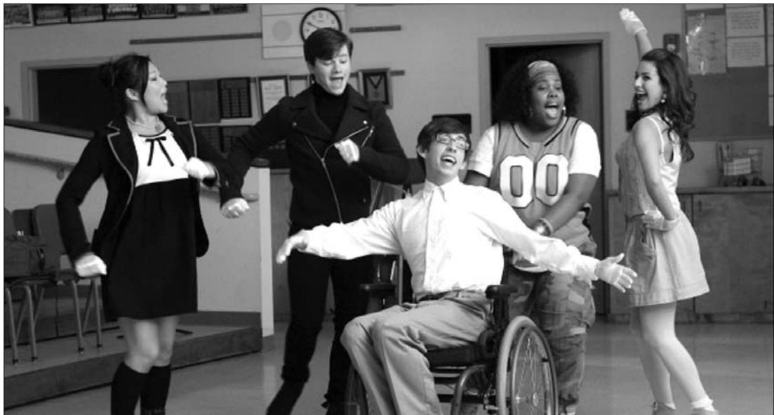
Az amerikai tévés évad nagy sikert hozó gimis musicalsorozata, a Geel indítja az őszi sorozatszezont az RTL Klubon

Hétfőtől a csatorna éterbe küldi a Dr. Cson című sorozat harmadik évadját, majd hétvégétől a várva várt Smith című krimisorozatot is megkapjuk. Utóbbiban olyan neves (sorozat)színészek tűnnek fel, mint például, Shohreh Aghdashloo, Simon Baker, Chris Bauer, Ray Liotta, Virginia Madsen, Johnny Lee Miller és Amy Smart. Szeptember 4-én és 5-én szintén sorozatdebütte számíthatunk, a Merlin kalandjai és a 24-et helyettesítő Human Target (Tökéletes célpont) kerül képernyőkre.