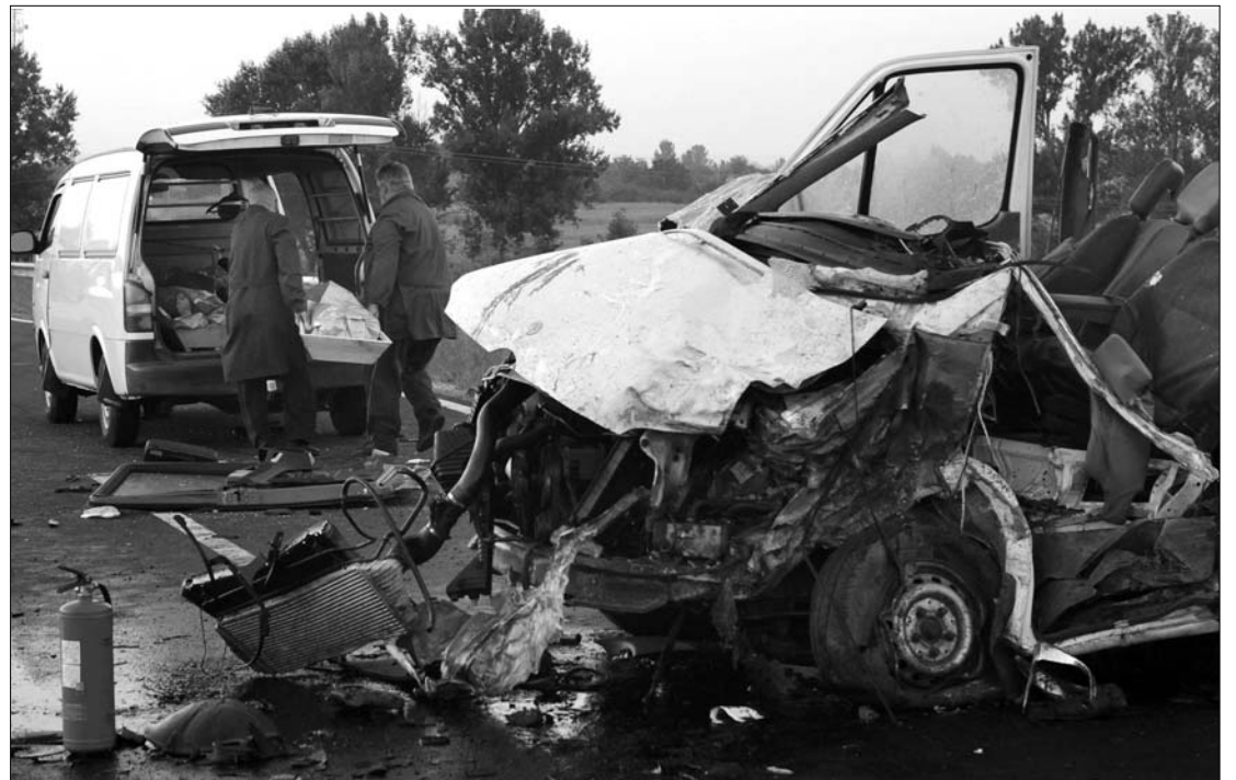
A moldovai mikrobusz és a román kamion frontálisan ütközött Biharkeresztes és Ártánd között

ból áttért az út menetirány szerinti bal oldalára, ahol belerohant a vele szemben szabályosan közlekedő mikrobuszba. Egy súlyos sérültet a debreceni Kenézy kórház baleseti sebeszetére szállítottak, ám utóbb belehalt sérüléseibe. Egy másik súlyos és két könnyű sérültet pedig a berettyóújfalui kórházba vittek a mentők – közölte a mentőszolgálat ügyeletes. ◀