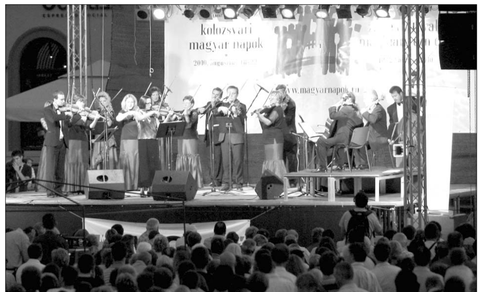
A rendezvénysorozatot záró koncert nagyszámú érdeklődőt csalogatott ki a kolozsvári Főterre

A filharmónia koncertjével érték véget a Kolozsvári Magyar Napok