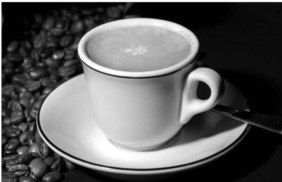
Csupán Európában többmilliárd dolláros bevételt „kavargatnak” a kávépiaci szereplők

A házi vagy irodai, minőségi kávékészítés olyan népszerűsége tette szert, hogy néhány valóságos státuszszimbólumnak számít egy-egy