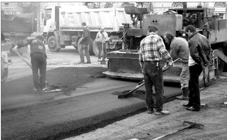
A por elszáll, az aszfalt megmarad – a városrehabilitációért mindenki hajlandó „szenvetni”

A Ziarul Financiar az e-licitatie.ro közbeszerzési árveréseket nyilvántartó portál adataira hivatkozva közölte a legnagyobb adósságokkal rendelkezők listáját. Eszerint az euróhiteltek tekintetében két erdélyi megyeközpont, Brassó (14 millió) és Nagyvárad (5,7 millió) önkormányzata vezet a rangsort. Ezzel szemben a fővárosban és környékén jobban kedvelik a lejáratú kölcsönöket: a legnagyobb összegekre bukaresti kerületek polgármesteri hiva-