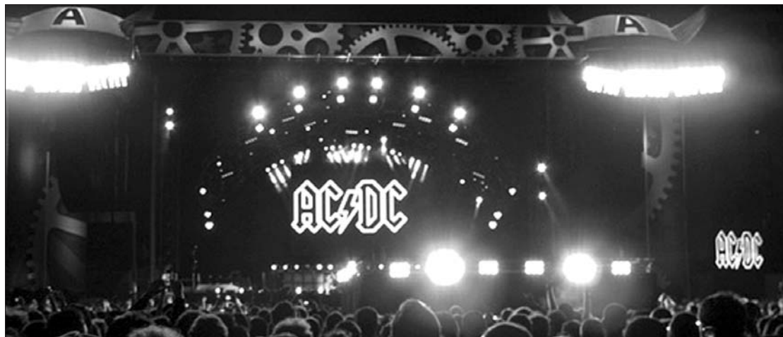
A showbiznisz felhőtlen szórakozást ígér – nyaralás helyett sokan a reflektorok árnyékában „hűsölnek”

Bár a gazdasági válság ellenére elmaradt a bukaresti B'estFest, a fővárosban két nagy fesztivált is rendeztek. A Ciuc Summer Fest tulajdonképpen a B'estFest utódja, a három fesztiválnap alatt hetven együttest sorakoztatott fel, költségvetése pedig meghaladta a kétfélmillió eurót. Hasonló kaliberű a Sonisphere fesztivál (Tuborg fesztivál), a D&D East-Entertainment és Marcel Avram által szervezett rendezvényen több mint 2,5 millió euróból gazdálkodtak – a szervező cég adatai szerint tavaly közel hétfélmillió eurós volt a forgalma.