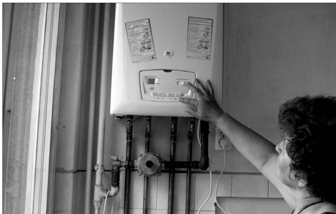
Sok lakásban csak „porfogó” a hőközpont, mivel az illetékes vállalat nem siet el a gázorák felszerelését

A hőközpontokat forgalmazó országos nagyvállalkozások nem készlekednek elindítani a „kazánroncs” programot, melynek keretében belül szeptember elejétől év végéig jelentős árengedmények várják azokat, akik a távfűtésről való leválás mellett döntenek. Az incont.ro információi szerint az egyik piacvezető, az Ariston Thermo Romania eladásai megduplázódásával számol az idén. Miután tavaly huszonhétezer falra szerelhető hőközpontot forgalmazott a cég, 2010-ben ötvenezres eladásra számítanak, mely nem kevesebb, mint 33 millió eurós forgalmat jelentene. Az ágazatban jártas szakemberek úgy látják, a saját fűtésre berendezkedőket nemcsak az anyagi okok, hanem a megnövekedett önállóvá válási vágy, illetve komfortigény is motiválják.