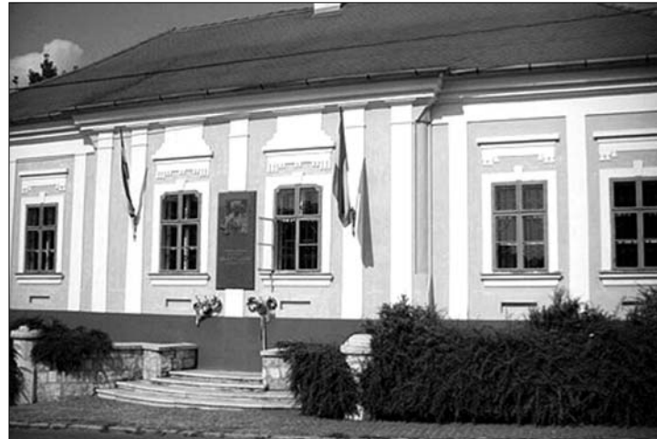
Kossuth Lajos monoki szülőháza mégsem lehet bejelentett lakcím

Wetzél Tamás leszögezte: a polgármesternek és a képviselő-testületnek a döntéshez nem volt joga, hiszen a személyi és lakcímnnyilvántartásról szóló 1992. évi törvény a jegyző felelősségébe utalja a lakcímbjelentéssel kapcsolatos hatásköröket. A jegyző ebben az esetben tipikus államigazgatási hatáskört lát el, és kötelezettsége a lakcím valóságának ellenőrzése – mondta. Hozzátette: a személyi- és lakcímnnyilvántartás alapnyilvántartás, ennek megfelelően nagyon fontos, hogy pontos adatokat tartalmazzon. Jogi szempontból tehát ez nonszensz, ahogyan a józan ész szempontjából is, hiszen a kezdeményezés azt jelenthetné, hogy