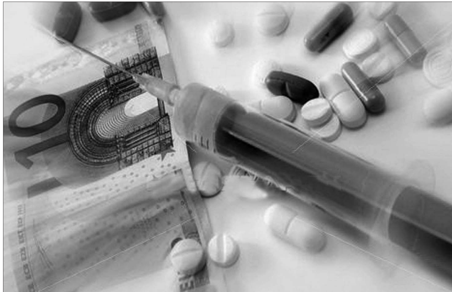
Még több vért pumpálnak a magánsectorba: a hazai egészségügyi ágazatnak idén akár húsz százalékát is a privátok fedhetik le