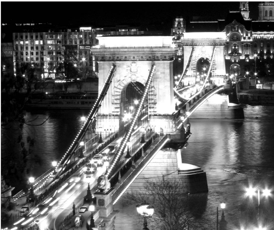
Megszorítások nélkül is fényárban. Budapest bízik abban, hogy az IMF nélkül is kitalál a „sötétből”

Minden jel arra mutat, hogy a Valutaalap elveszíti a csatát, és ezt kezdi is belátni. „Ténylegesen nincs ránk most szükségük” – idézte a Magyarországról távozott küldöttség vezetőjét, Christoph Rosenberget a francia Le Monde című lap, amely cikkében azt elemezte, hogy Budapestnek megvannak-e az eszközei a „szabaduláshoz” az IMF költségvetési szigorítól. Ráadásul a magyar kormány és minden képviselője mindvégig azt hangoztatta – és hangoztatja ma is –, hogy a 2008 őszén vállalt ideai 3,8 százalékos, illetve a jövőre előírt 2,8 százalékos hiány-célt minden körülmények között tartani fogja, bár az még a leggazdagabb EU-tagországokéhoz képest is példátlanul szigorú. Cserébe azt kéri csupán, hogy maga szabhasza meg, milyen eszközökkel éri ezt el – elsősorban a magyar lakosságot súj-