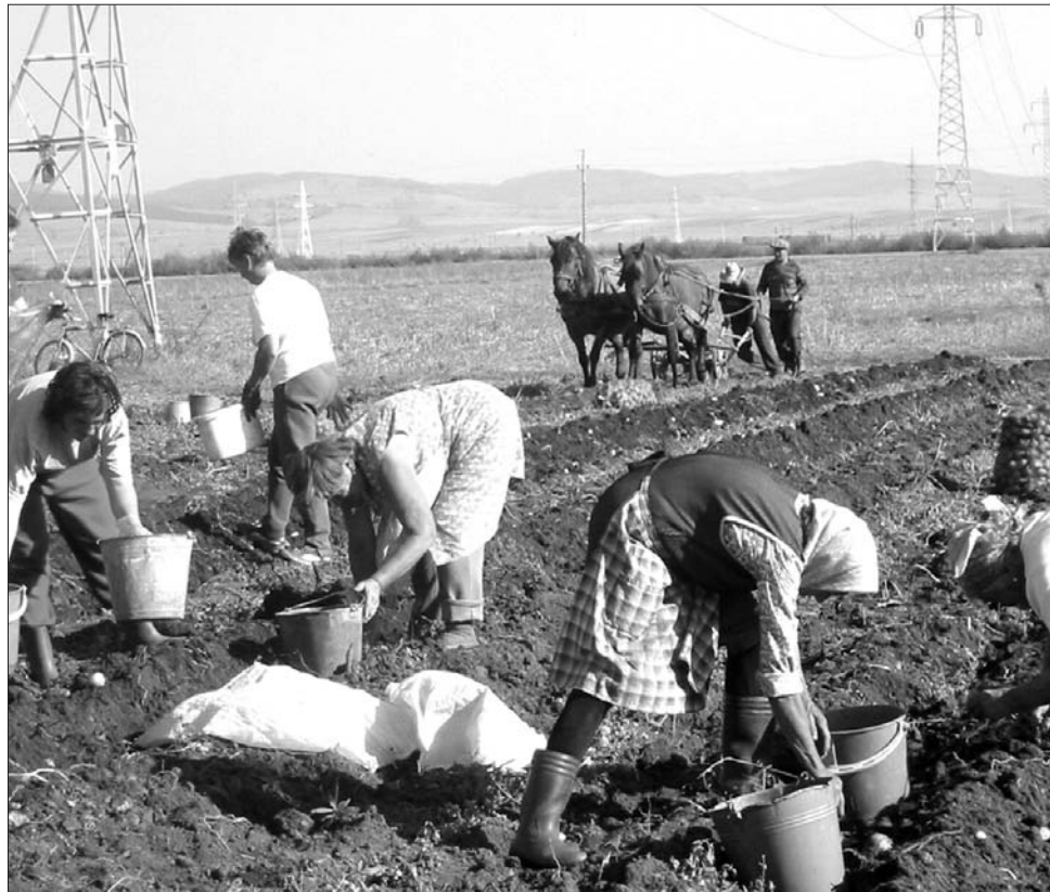
Az értékesítési gondok miatt a búza javára szorulhat vissza a székelyföldi krumplitermelés

dokkal küszködnek, a „székely valutával” beültetett területek évről évre csökkennek – figyelmeztetnek a szakemberek, rámutatva, a gazdák emiatt egyre inkább a gabonatermesztés felé fordulnak.