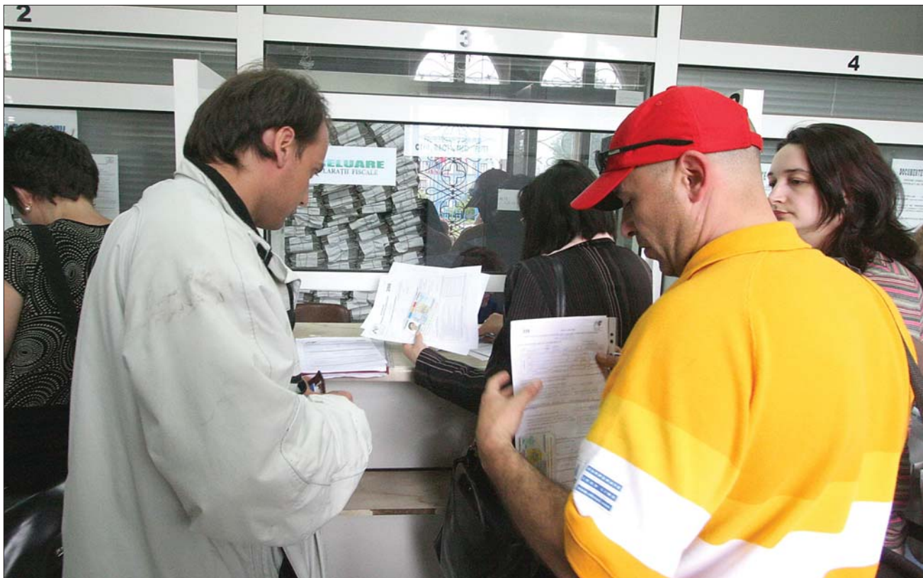
Egy ország réme: a hivatalok megrohamozását idéznék elő a törvényszöveg visszasságai. Ez akár havi ötvenezer kérvényt is jelenthet