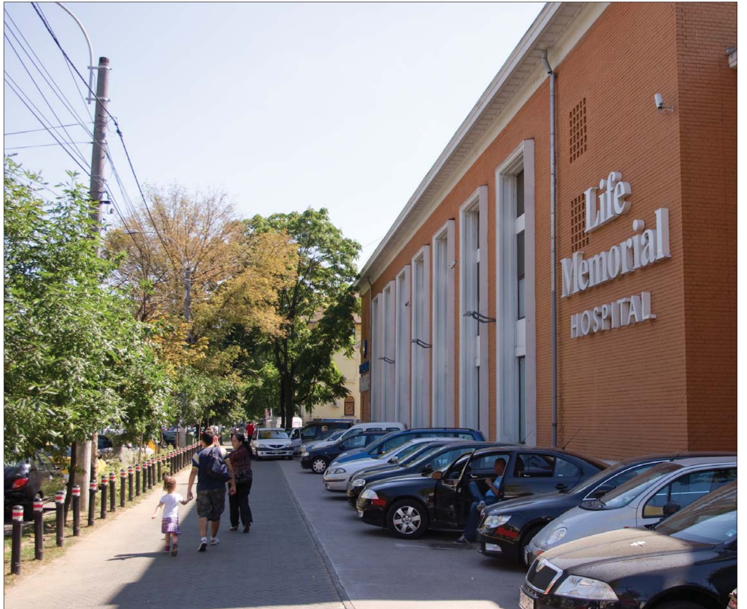
Románia legnagyobb magánklinikája a bukaresti Life Memorial Hospital. „In memoriam” román közegészségügy?

Veszélybe került a romániai magán- és közegészségügy eddigi szimbiózisa