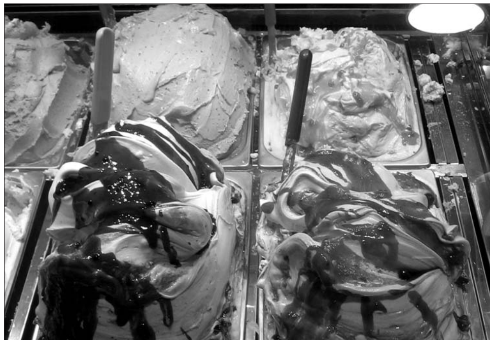
Bár a fagyialadásra legoptimálisabb a tartós meleg, a hűtőládák télen sem tétlenkedhetnek

– Ami az ízeket illeti, nincs nagy változás, ma is a csokoládé és a vanília a legkelendőbb. Mivel nálunk még nem beszélhetünk fagyaltfogyasztási kultúráról, sajnos csak a nyári hónapokban van úgynevezett szezonidő. A fagyit a meleghez, a nyárhoz társítják az emberek, így