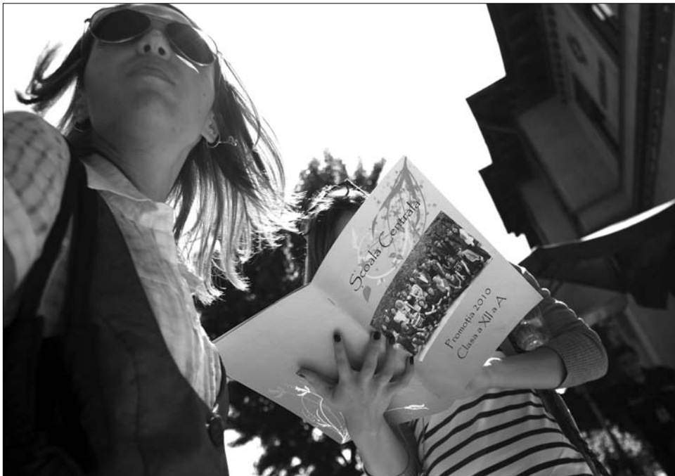
A végzősök abban bíznak, hogy a júliusnál könnyebb lesz az őszi, pótrendszert