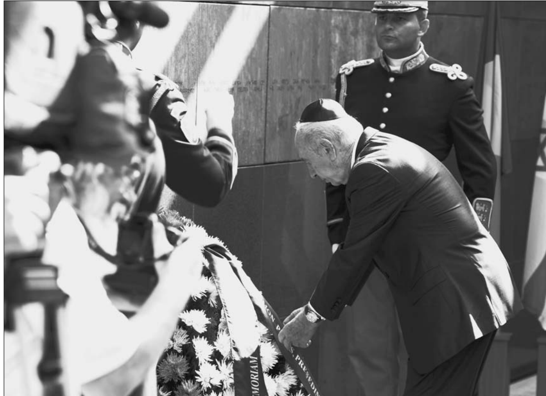
Peresz Bukarestben koszorúz. Szerinte Románia már nem az az ország, amely elkövette a szörnyűségeket

Az izraeli államfő pénteken, látogatásának második napján, a bukaresti holokauszt-emlékműnél tett látogatása során már szóvá tette a második világháború idején elkövetett romániai tömegmészárlásokat is, és megköszönte Romániának, hogy elismerte világháborús történelmének kegyetlenségeit. Hangsúlyozta, hogy a mai Románia már nem az az ország, amely a második világháborúban elkövette ezeket a szörnyű tetteket, hanem demokratikus és szabad állam. ◀