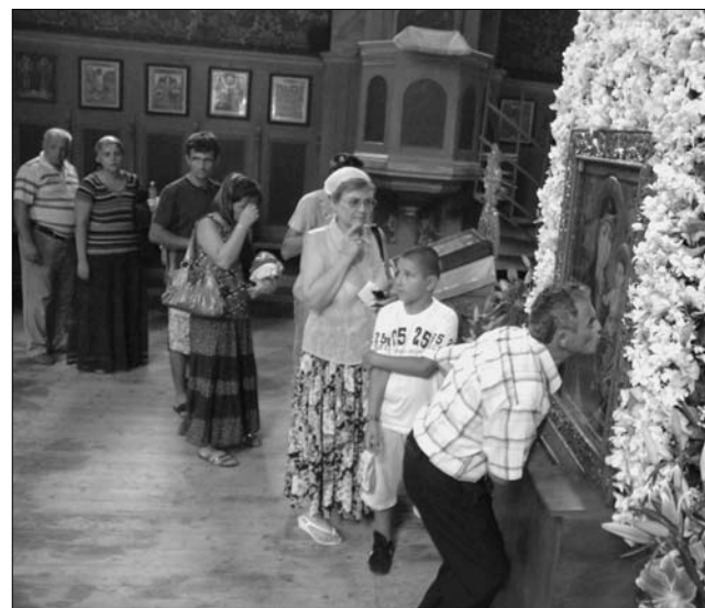
Mária ikonja előtt a hívek a Kolozs megyei Füzesmiklósán.