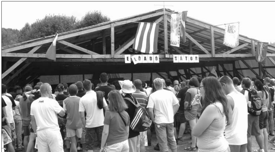
Ottthonra találtak Vona Gábor hívei a gyergyószentmiklósi táborban