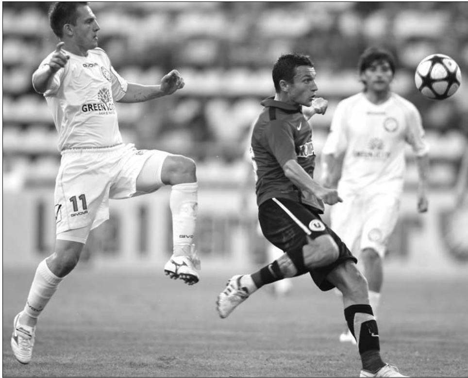
Az újonc Kolozsvári U győzött Urziceni-ben, ahol összeomlani látszik a bajnoki ezüstérmes

Első győzelmét aratta a bajnokságban a Gloria, a