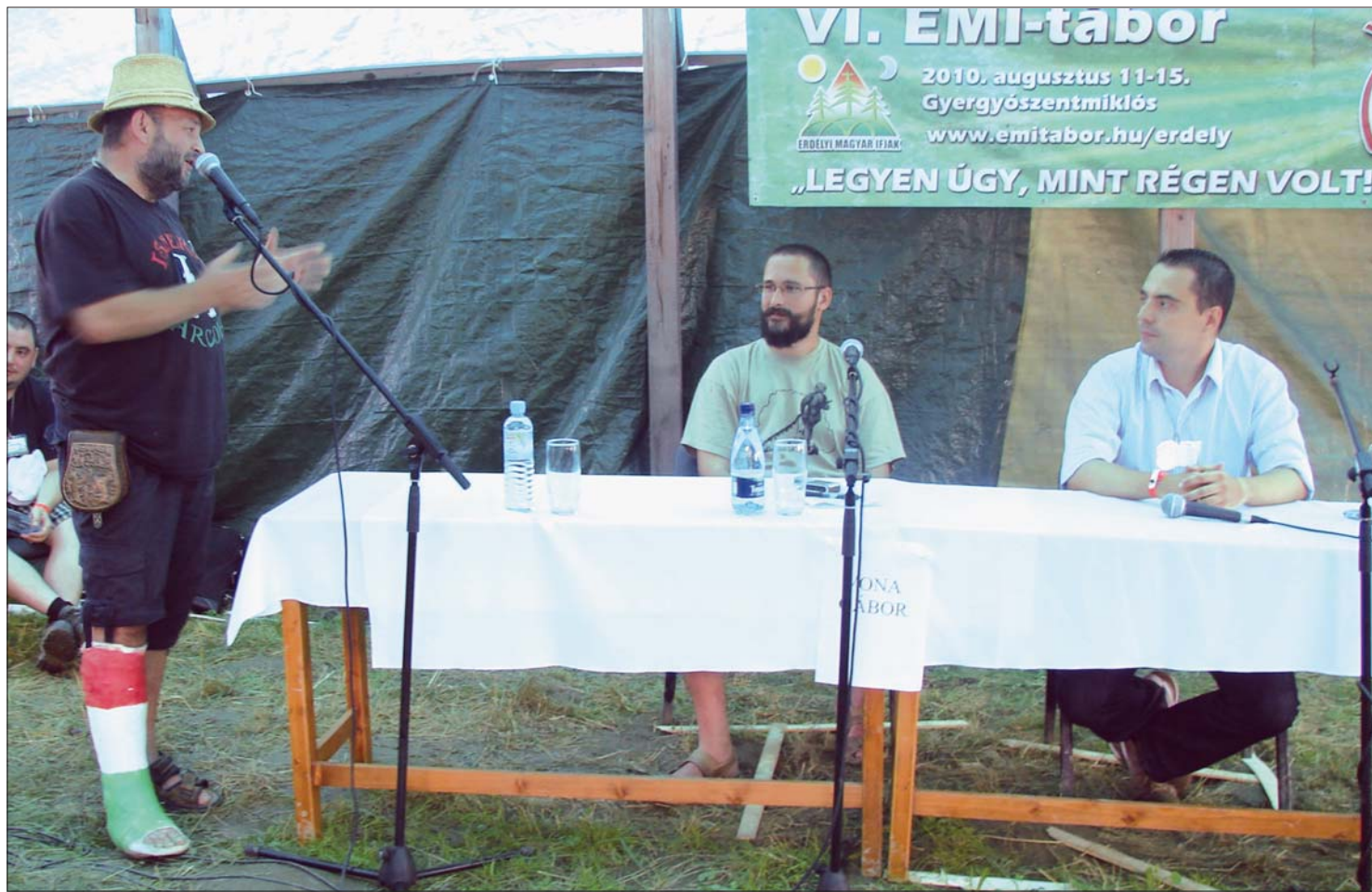
Vona Gábor, a Jobbik Magyarországért Mozgalom elnöke (jobbra) az EMI-táborban szavazati jogot is ígért a székelyeknek

A magyarság politikai központjává változtatnák Székelyföldet Vona Gáborék