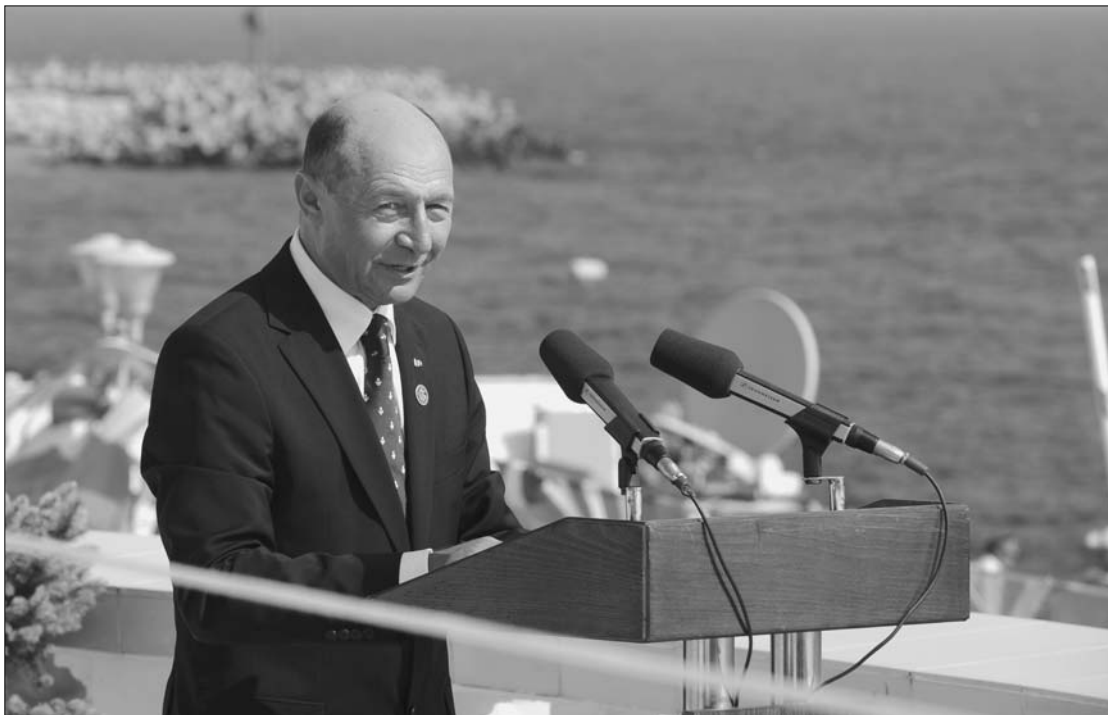
Az államfő és a tenger. A volt hajóskapitány Traian Băsescu ezúttal nem fogadták szívesen Konstancán.