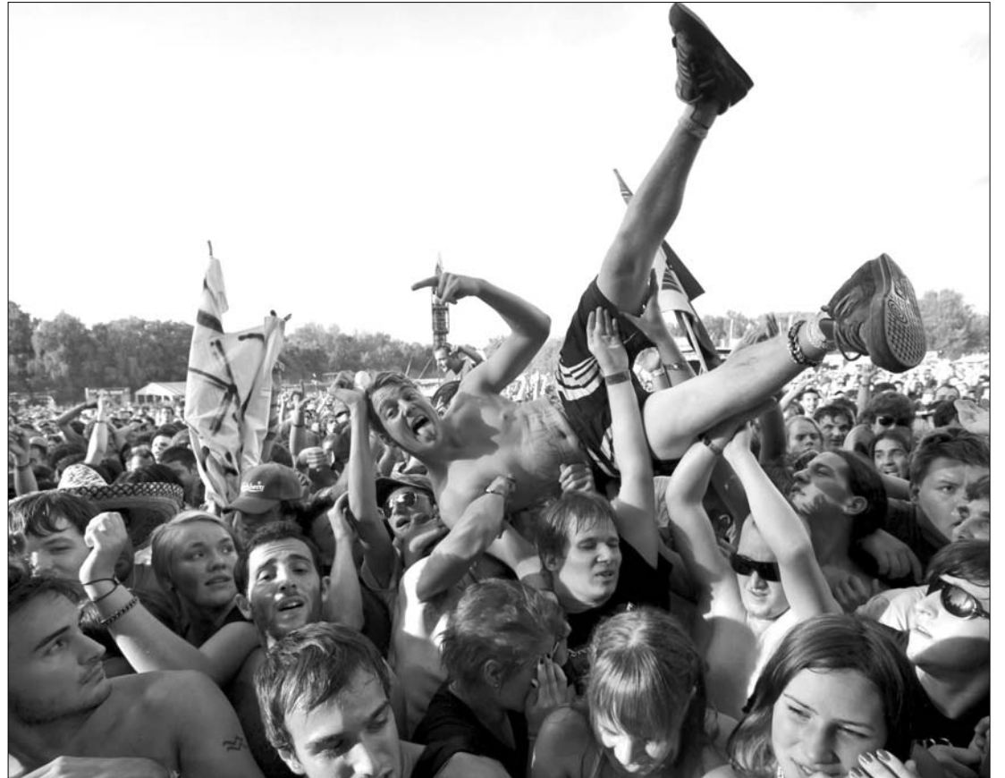
A Sziget Fesztivál bulizói mátlól átadják helyüket a takarítóknak, színpadszerelőknak, kertészeknek

Véget ért a tizenharmadik Sziget, a fesztiválkapukat az egyik legjobban várt együttes, a brit Muse zárta. Koncertjük után már készülődnek a szemétszedők, kertészek, hogy újjávarázsolják a hajógyári-szigetet.