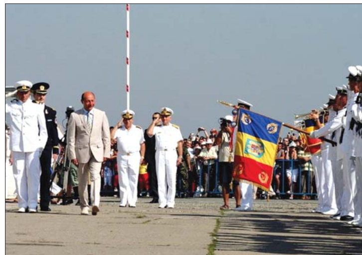
Tiszteletadás. A hallgatóságától nem ezt kapta az államfő

tott ünnepi beszédet. Az államfő szolidaritást kért hallgatóságától „a válságos időszak átvészelésére”. 3. oldal ▶