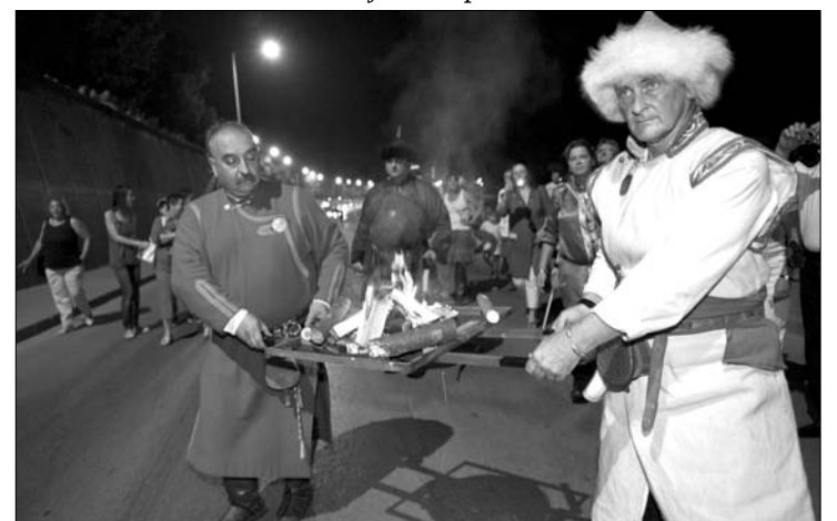
Keleti irányból, fáklyás tution hozták a fényt a hétvégén Szegedre