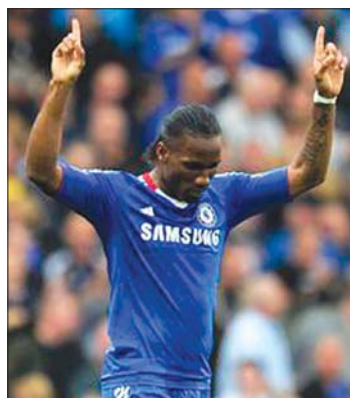
Malouda kettőt is rúgott

A francia Ligue 1-ben második mérkőzését is elvesztette az Olympique Marseille, a címvédő a Valenciennes otthonában kapott ki 3-2-re. Az AS Monaco-Montpellier HSC találkozót