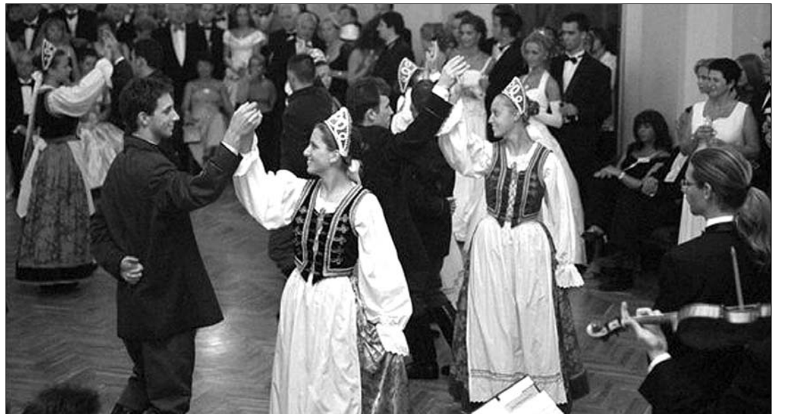
A balatonfüredi Anna-bál mintájára rendezik meg először az Anna-napi mulatságot Vásárhelyen