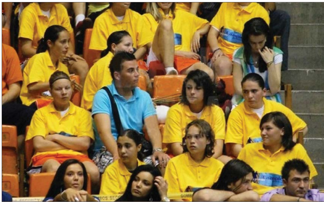
A City'us-ból Muncipiumi SK-vá alakult marosvásárhelyi női labdarúgó csapat örömet szerzett szurkolóinak

augusztusban rajtol, amikor hét négyes csoportban selejteznek, a javarészt bajnoki ezüstérmes csapatok. A 4. csoport tagjaként, a vásárhelyiek 5-én az FCF Juvisy Essonne-nal, 7-én a Breidablikkel, 10-én pedig az FC Levadia Tallinn-nal mérkőznek, biztos továbbjutó csak a körmérkőzés győztese. A 23 nemzet országos bajnoka, köztük az MTK Hungária FC, a legjobb 32 között kapcsolódik be a küzdelembe, innen pedig már egyenes kieséses rendszerben folytatják a csapatok. ◀