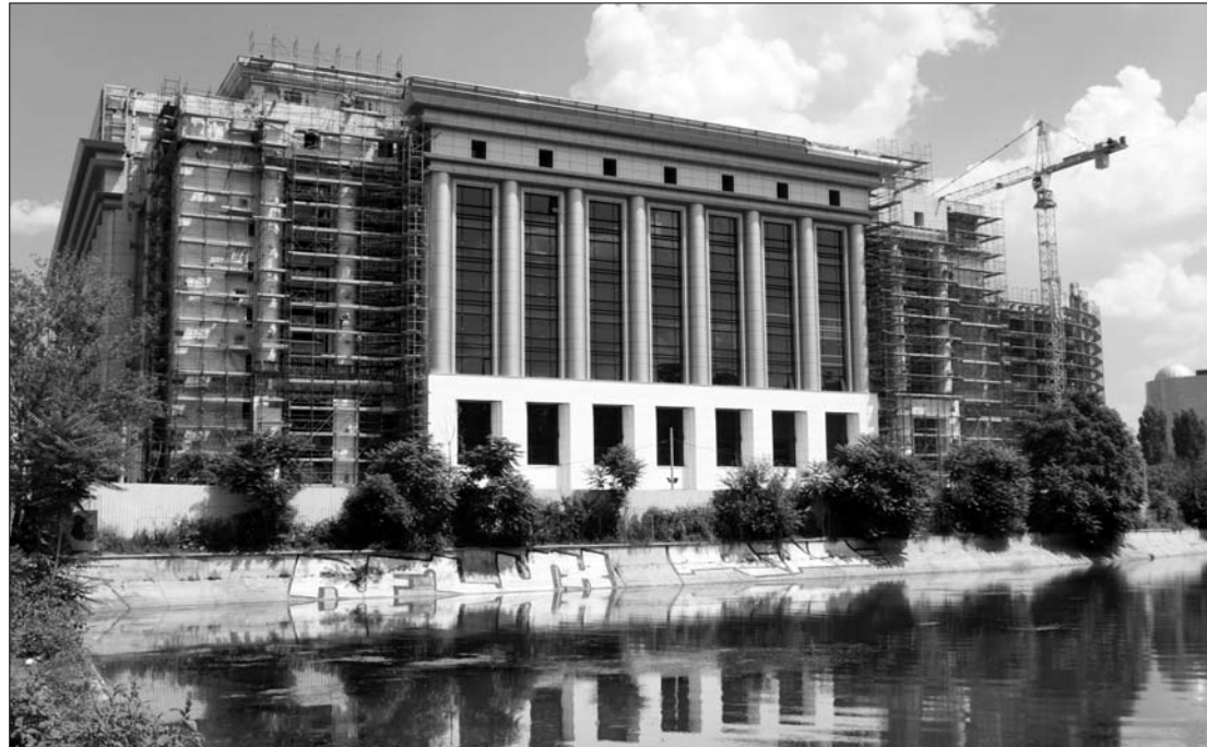
A Nemzeti Könyvtár egyfajta multikulturális központ szerepét fogja betölteni, amint elkészül