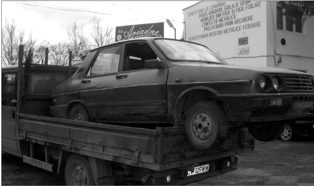
A hivatalos adatok szerint az új személygépkocsikat vásárlók közül a Daciát keresték a legtöbben