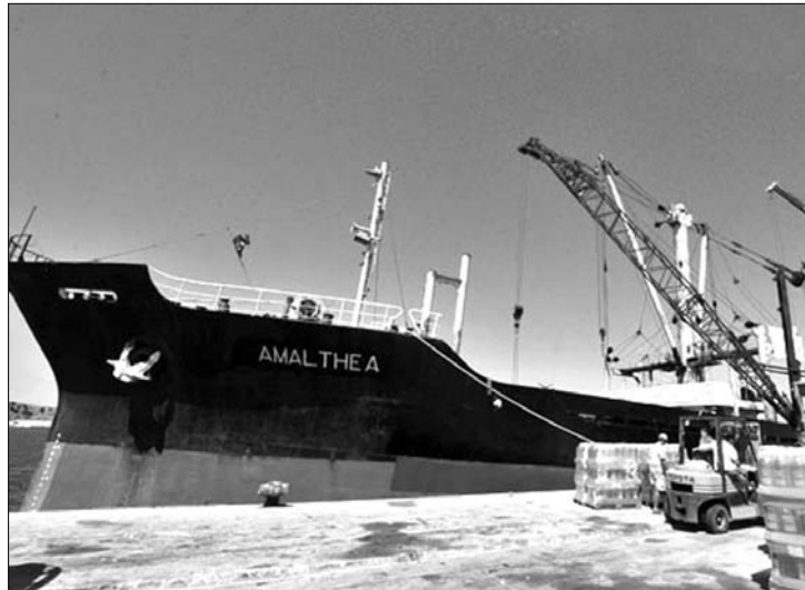
Az Amalthea nevű hajó moldovai pavilon alatt indult Gáza felé

A szállítmányt összegyűjtő líbiai Kadhafi Alapítvány honlapján közölte: a szervezők eltökélt szándéka, hogy eljussanak a Gázai övezetbe. „Mindenekelőtt az a legfontosabb, hogy eljussunk a Gázai övezetbe, ha azonban ez nem lehetséges, akkor senkinek