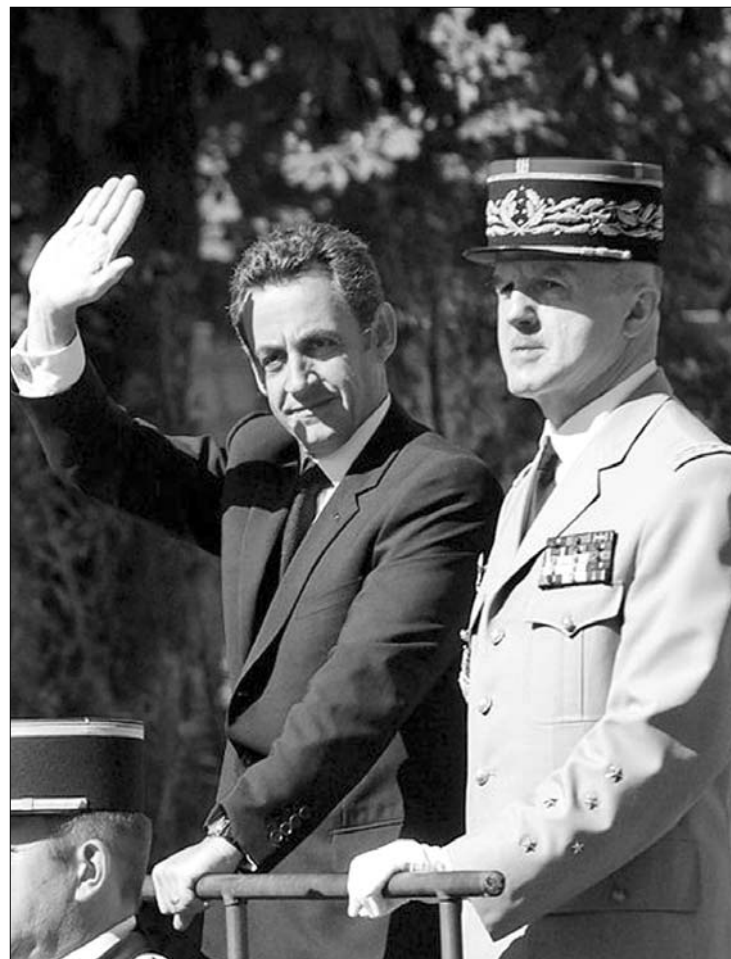
Nicolas Sarkozy francia államfő a katonai parádé élén

A nemzeti alakulatokat négyezer francia légiós, szárazföldi és lovas katona követte. Utánuk következtek a haditechnikai eszközök. A közel 4 millió euróba (1,1 milliárd forintba) kerülő díszszemlélt 38 helikopter és az afrikai nemzeti zászlókkal érkező ejtőernyősök zárták a Concorde téren. Az államfő döntésének értelmében a válság miatti költségvetési szigor részeként idén elma-