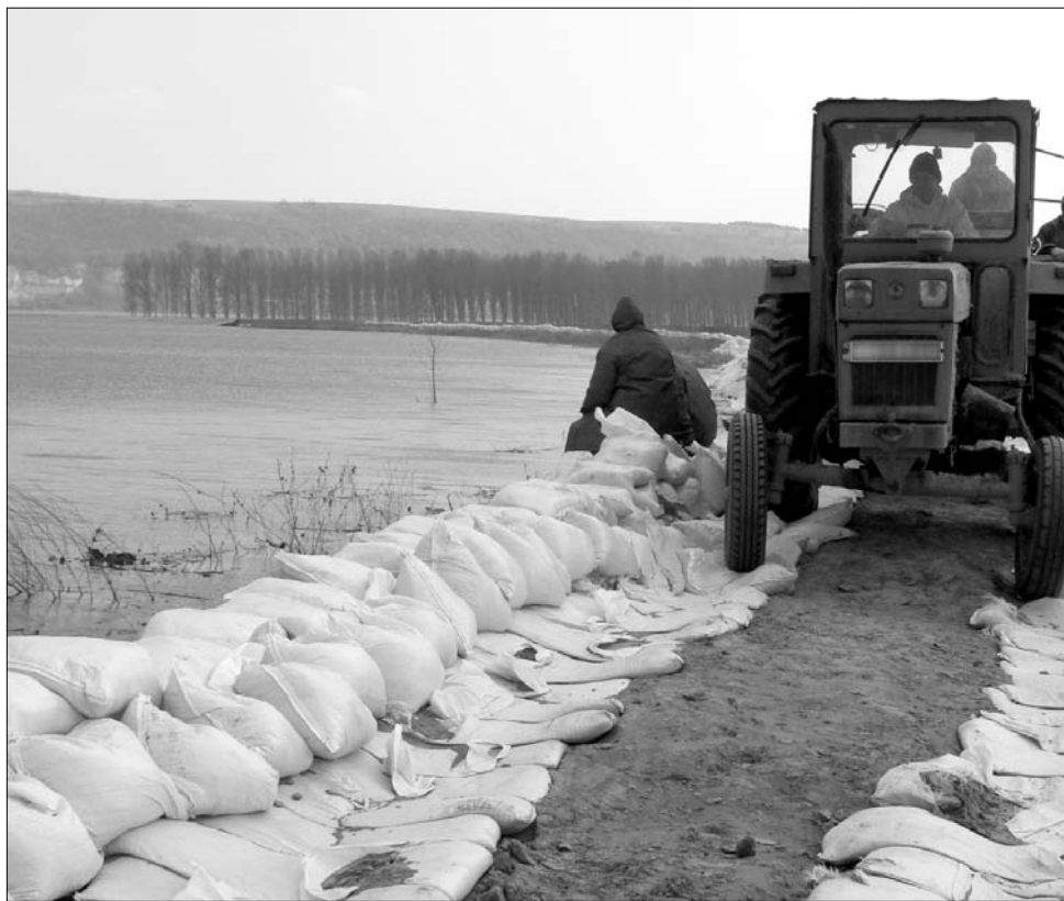
Az áradások a szakszerűtlenül kiépített árvízvédelmi rendszerek miatt következtek be

A szakadással fenyegető gátat átszakították, hogy a következő felhőszakadáskor ne ismétlődjön meg a nehezen elhárítható veszélyhelyzet, de így is megtörténhet, hogy a megduzzadt Szemerja pataka kilép a medréről és elárasztja a házakat. A polgármester szerint a város csatornázása sem bírja meg az ekkora vízmennyiséget, mert nem ekkorára volt tervezve. Számítások szerint a város 230 utcáját ellátó csatornarendszer áttervezése és kivitelezése mintegy 300 millió euróba kerülne, ennyi pénzre erre a célra pedig soha nem lesz a városnak. ◀