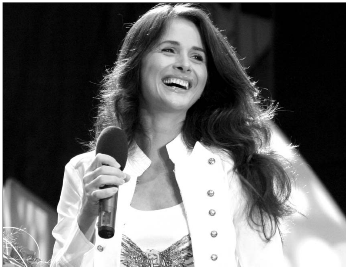
Mădălina Manole énekesnő tegnap, 43. születésnapján önként vetett véget életének