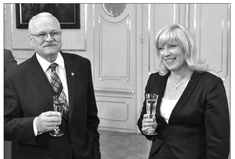
Ivan Gasparovic államfő gratulált Iveta Radičová kormányfőnek

Az SDKU kezében lesz a pénzügy, az oktatásügy, a külügy és az igazságügy; az SaS fogja vezetni a védelmi, a munkaügyi, a kulturális és a gazdasági tárcát. A KDH adja a belügyminisztert, az egészségügyi minisztert és a közlekedési minisztert. A Híd a mezőgazdasági és a környezetvédelmi minisztériumot fogja ve-