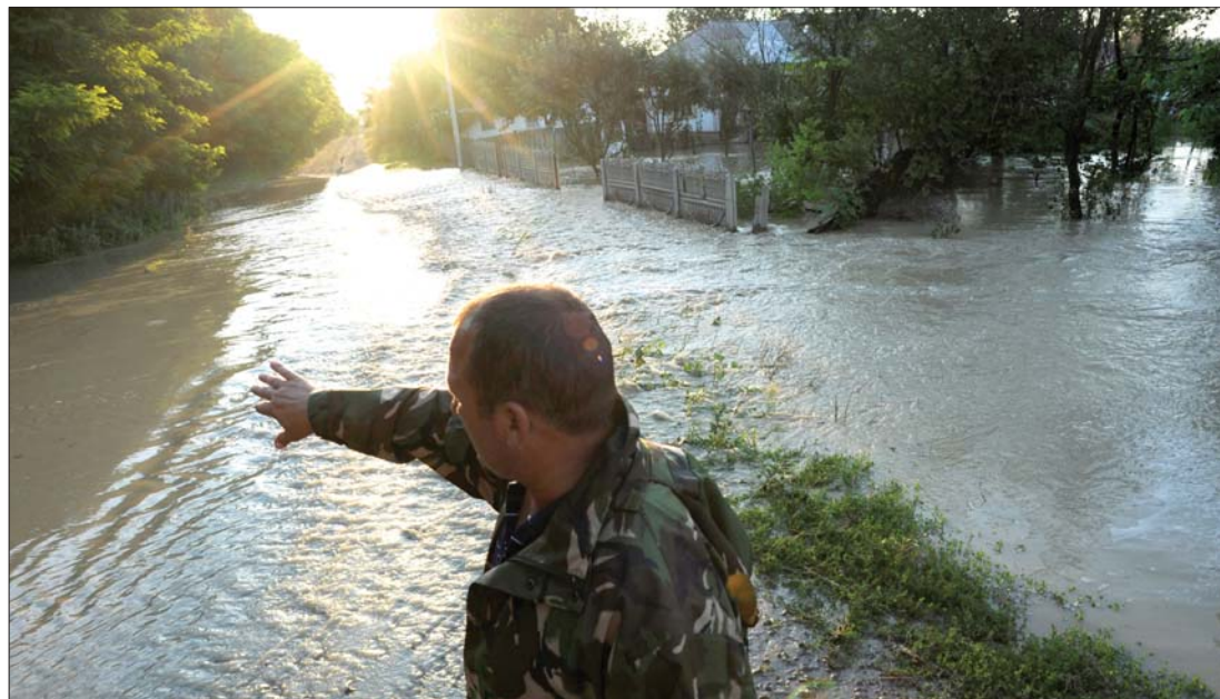
A Prut folyó a hétvégén sorra öntötte el az útjába kerülő moldovai településeket

got: a katasztrófa sújtotta területeken egymást váltják az elnöki ígérek és szidalmak. 7. oldal ▶