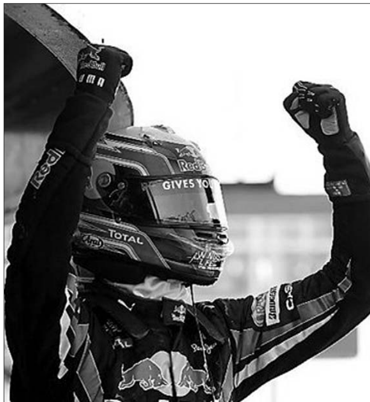
Mark Webber, a Red Bull Racing veterán pilótája

► A címvédő spanyolok két nap után 0-3-ra álltak a házigazda franciákkal a férfi tenisz-Davis-kupa Világcsoporthoz tartó negyeddöntőjében, s ezzel búcsúztak az idei sorozattól. Nagy küzdelemben dőlt el az első két pont sorsa, Gael Monfils 7-6 (3), 6-2, 4-6, 5-7, 6-4-re verte David Ferrert, Michael Llodra pedig 6-7 (5), 6-4, 6-3, 7-6 (2) arányban Fernando Verdascót. A párost is Guy Forget tanítványai nyerték. A franciák végül 5-0-ra nyertek miután Gilles Simon 7-6 (4), 7-6 (7)-re verte Nicolas Almagrót, Benneteau pedig 7-6 (3), 6-4-re Lopezt. A chilei Coquimbóban a vendég csehek nem hibáztak az első három mérkőzésen: Ivo Minnar-Nicolas Massu 6-0, 6-2, 6-3, Jan Hajek-Paul Capdeville 6-0, 6-2, 6-3, Lukas Dlouhy, Jan Hajek-Jorge Aguilar, Nicolas Massu 7-6 (3), 6-3, 3-6, 6-3. A magyar csapat a kiesés ellen harcolt az euro-afrikai zóna II. csoportjában, miután a márciusi első fordulón 4-1-re kikapott az észtektől Tallinnban. Gödöllőn, 4-1-re nyertek a házigazdák, akik megőrizték helyüket a csoportban. ◀