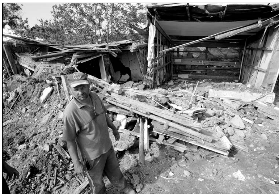
Apadnak a hazai folyók: nyomukban helyrehozhatatlan árvíz károk

A hétfőn Elena Udrea, a fejlesztési minisztérium tárcavezetője nyilatkozatban összegezte az ideai árvizek részleges mérlegét. Ennek megfelelően a megáradt folyók július 6-ig 3483 ingatlanra tettek kárt, 731 híd omlott le. A közutak állapota is aggasztó: 360 kilométernyi megyei út súlyosan megsérült, 34 kilométer teljesen járhatatlanná vált. A községi utak esetében 1139 kilométert ért súlyosan az áradás. A július 6-ig okozott károk összege eléri a 247 millió lejt, azaz 58,4 millió eurót. ◀