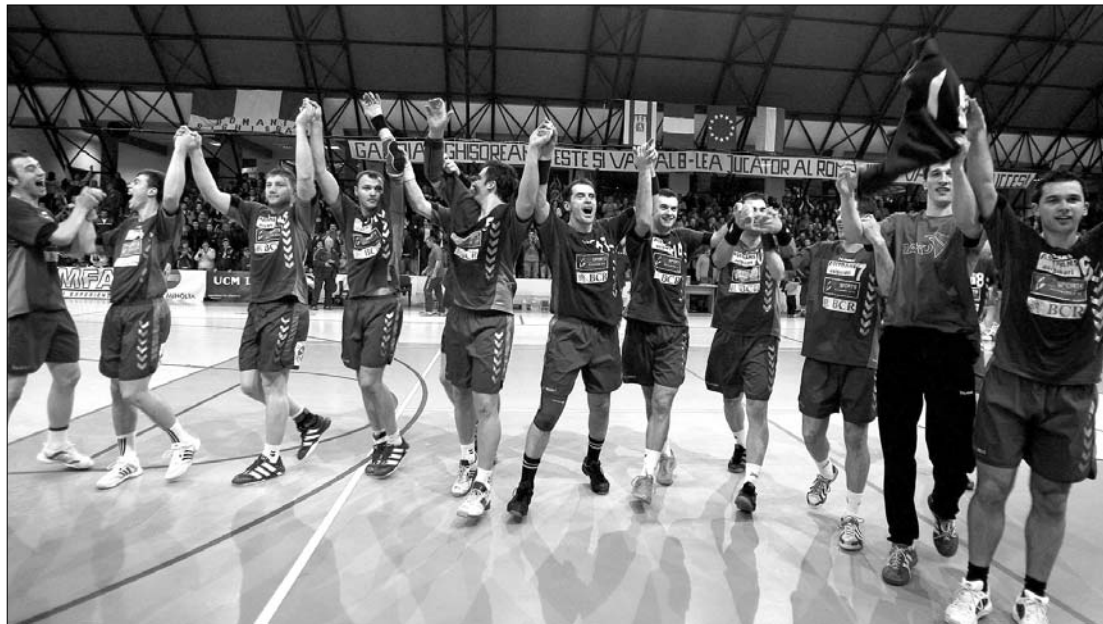
A román válogatottnak Horvátországgal, Dániával, Szerbiával, Algériával és Ausztráliával kell megküzdenie

Kisorsolták a 2011-es férfi világbajnokság mérkőzéseit