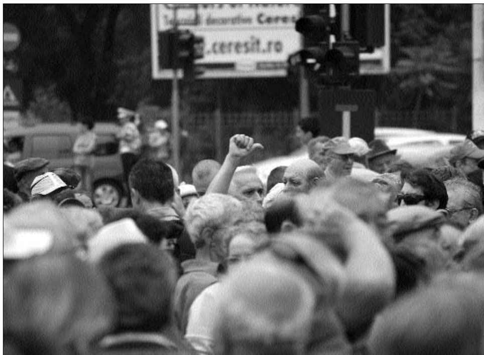
Tüntetés Cotroceni-ben. Traian Băsescu már többször magára haragította a nyugdíjasokat.

Gazdasági megfigyelők mindebből arra a következtetésre jutottak, hogy a jegybanki elnök a pénzromlás elleni hosszú és az utóbbi években sikeresnek mutatózó kezdelme után most ismét beletörődött az infláció gondolatába. Ahhoz azonban, hogy valóban az infláció legyen a „kisebbségi rossz” több feltételnek is teljesülnie kell. Az első természetesen az, hogy a „még kisebb rosszak” kivitelezhetetlennek bizonyuljanak, de fontos az is, hogy a pénzromlás egyszámjegyű legyen, vagyis a pszichikailag még elviselhető tíz százalék alatt maradjon. ◀