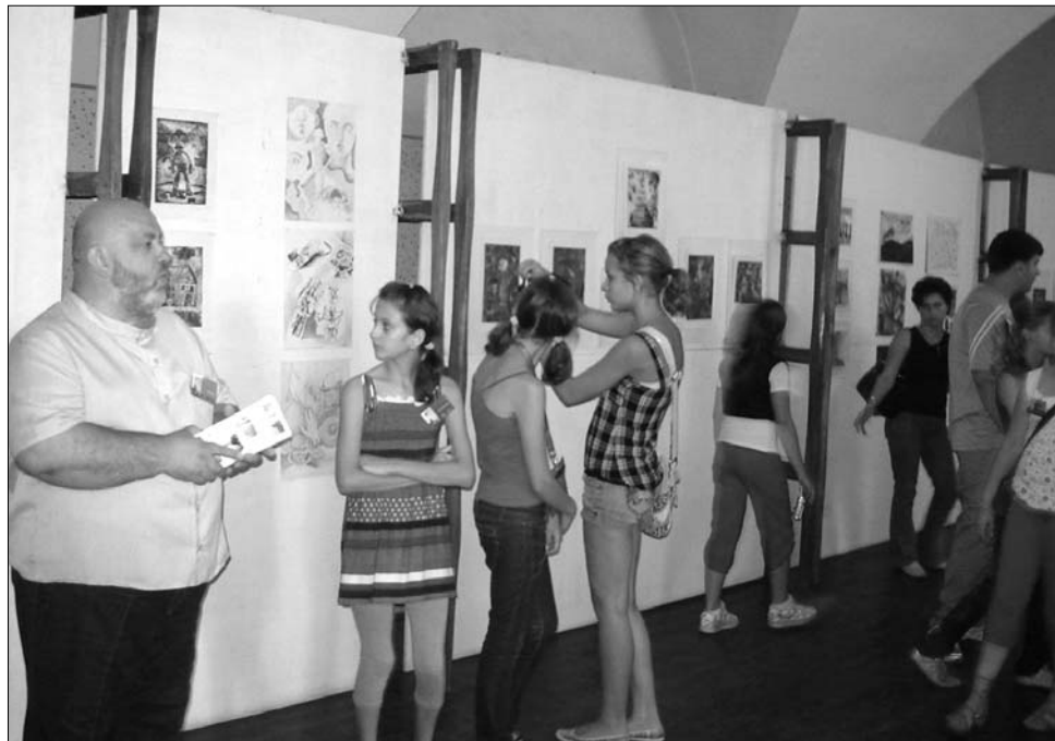
Az idei ifjúsági táborlakók az előző évek terméseivel is megismerkedhettek

lesznek, az oktatók közül Alexandru Juga a bizánci, és ennek vetületében az ortodox ikonfestészet rejtelmibe kalauzolja el a résztvevőket. A tanulás mellett a táborlakók kirándulhatnak is, ismerkedhetnek a környékkel, annak kultúrájával, illetve a nagyenyedi és torockói közösségekkel. A táborban szerzett élményeket július 18-án, az Inter-Art Alapítvány galériájában, záró kiállításon tárják majd a kíváncsiak elé. ◀