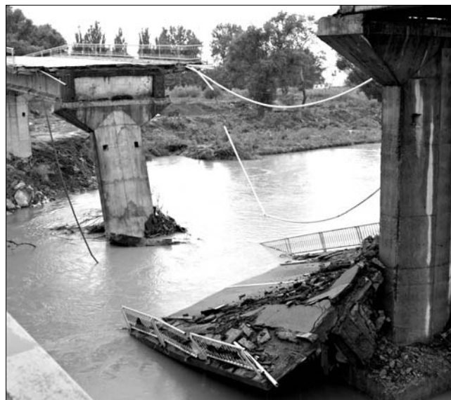
Nem tudni, miből folynak a helyreállítási munkálatok

Újabb húsz embert telepítettek ki a katasztrófa-elhárítás munkatársai az ország árvíz sújtotta területeiről: kilencven települést árasztott el a víz tegnap. A helyzet súlyosságát jelzi, hogy országsszerte három-ezer szakember dolgozik folyamatosan az árvíz-károk enyhítésén, valamint az árvízvédelmi rendszerek megerősítésén: tűzoltók, katonák, rendőrök és csendőrök dolgoznak a gátakon. Galacon sikerült befejezni a hét elején elkezdett, Emil Boc által megígért ideiglenes védőgátat, amely úgy tűnik, sikeresen ellenáll az áradó Dunának.