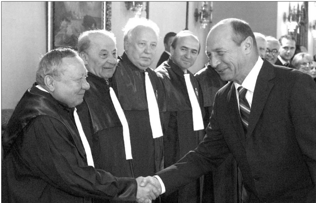
Hiába a nyájas parolázás, ezúttal az Alkotmánybíróság döntése nem az államfőnek kedvezett

Az államfő szerint nagyon magas a családok száma, ezért újra kell vizsgálni az idő előtti nyugdíjaztatásokat. „Gyanúsán magas a 40-45 évesen nyugdíjazottak száma. Nem az én tisztem ezzel foglalkozni, de az eddig átnézett tizenkétezer dosszié közül mintegy háromezer esetben újrazvizsgálást kért a szakbizottság” – mondta Băsescu. Hozzátette: hasonló a helyzet a szociális segélyezettek esetében is. Kiterjedt családok élnek gyereknevelési támogatásból, eszközük sincs dolgozni menni. „Az elszegényedés túl a munkát is egyre jobban megvetik” – summázott az elnök, aki szerint ez tarthatatlan helyzet, ugyanis ha ezt folytatják, akkor tönkremegy az ország. ◀