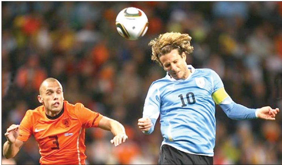
Diego Forlán, az „uruk” üdvöskéje (világoskék mez) hiába alakított ismét nagyot

Huszonöt győztes csata, s az afrikai seregszemlén hat siker után Hollandia harmadszor jutott be világbajnoki döntőbe. S ha 1974-ben, az NSZK-ban, a házigazdák 2-1-re, négy évvel később, Argentínában, szintén a házigazdák 3-1-re nyertek a holland labdarúgás talán legjobb nemzedékének krémje ellen, most eljött a harmadik neki-rugaszkodás ideje. Tény, hogy a tegnapi második elődöntőt megelőzően háromból két esély volt arra, hogy vadonatúj világbajnokot ünnepelethessünk, mint ahogy sporttörténelmi esemény az is, hogy immár biztosan először nyer európai csapat Európán kívül aranyérmet. E 19. világbajnokságon Európa