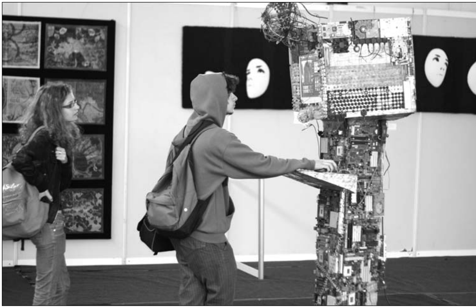
Az interaktív, hulladékokból készült alkotások egy új irányzatot képviselnek

A kerámiaázást elsősorban, mint funkcionális tárgyal-