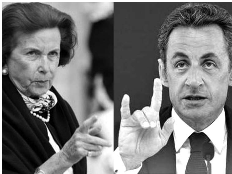
Valami büzlük a parfümparban... Az adakozó Bettencourt asszony és az újabb botrányba keveredett Sarkozy

A tanú közvetett bizonyítékot is említ: azt állítja, hogy ebből az összegből származik egy százezer eurót tartalmazó bankszámla Svájcban. Ezt a pénzt Bettencourt vagyongazdálkodója, Patrice de Maistre adta át