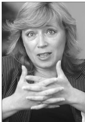
Iveta Radicová kormányfőjelölt

A Szlovák Demokratikus és Keresztény Unió (SDKU), a Szabadság és Szolidaritás (SaS), a Kereszténydemokrata Mozgalom (KDH) és a Híd alkotta négypartii koalíciónak együttesen 79 képviselője van a 150 tagú parlamentben. Az új kormány megalakulásával kapcsolatban