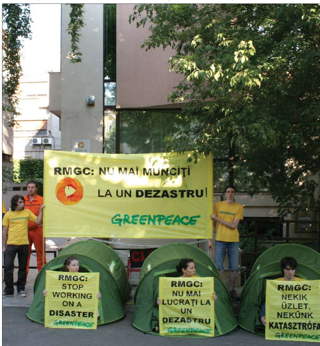
Az aktivisták lezárták a verespataki aranykitermelést tervező RMGC bukaresti székházának bejáratait.

▶ Az illetékesek sem tudják pontosan, rendelkezik-e jogszabály a lejárt gyógyszerek tárolására és begyűjtésére vonatkozóan, pedig a régóta fiókban hanyódó pirulát kidobni veszélyes. A patikák többsége elzárkózik attól, hogy átvegye a használaton kívüli gyógyszereket. Sok helyen azonban tudják: nem csak hasznos, de kötelező is megfelelően kezelni a veszélyes hulladéknak számító készítményeket. Életbevágóan fontos – figyelmeztetnek a szakemberek – hogy a lejárt nyugtatók, fogamzásgátlók szereket, antibiotikumok ne a lefolyókba, ne a szeméttárolókba kerüljenek, az emberek kérjenek szakszerű segítséget a megsemmisítéshez. 7. oldal ▶