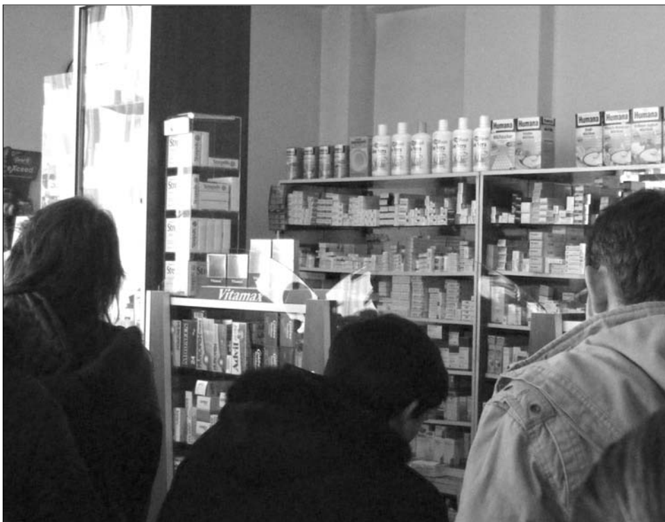
Kevesen tudják: érdemes bevinni a gyógyszertárakba a lejárt szavatosságú gyógyszereket

A kolozsvári patikusok viszont megerősítették: kijelölt gyógyszertárak vannak a készítmények gyűjtésére, és nagyon szigorú szabályok szerint kötelesek is átvenni ezeket a termékeket. Külön jegyzőkönyv szerint rögzíteni kell, milyen hatóanyagot tartalmaznak a feleslegessé vált gyógyszerek, és a tárolás, illetve elszállítás ennek megfelelően történik. A begyűjtésért felel az átvevő gyógyszerész, az adminisztrációért, a szállításért és tárolásért a gyógyszertár vezetője is: évente kétszer jelentést kötelesek tenni az ilyen módon kezelt hatóanyagokról.