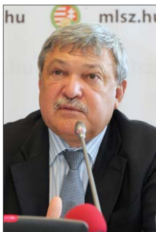
Csányi Sándor

Vizi E. Szilveszter akadémikus, az MTA korábbi elnöke 84, Kovács Árpád, az Állami Számvevőszék koráb-