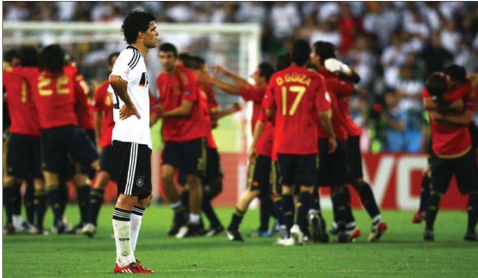
Ballack-bánat. Két évvel ezelőtt, az Európa-bajnokságon a spanyolok legyőzték a németeket