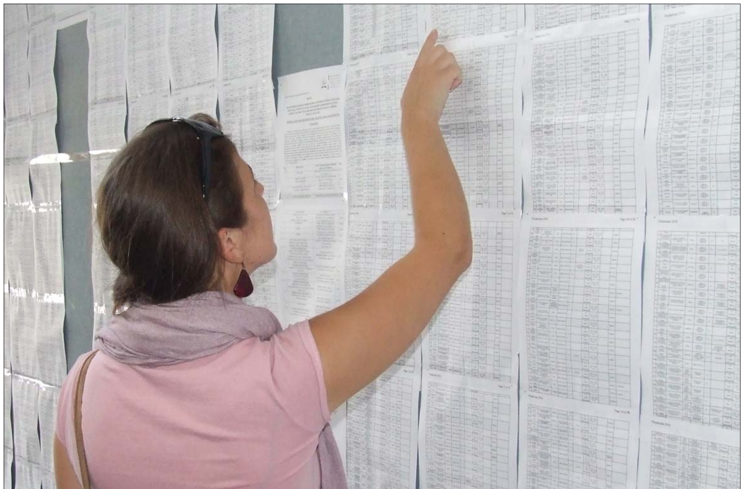
A címzetes és a helyettes tanári állások elosztásához nyaranta versenyvizsgáznuk kell az azokra pályázó pedagógusoknak

A bércsökkentés ellenére hatalmas a túljelentkezés a pedagógusi posztokra