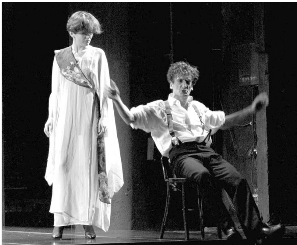
A sepsiszentgyörgyiek A mizantróp című előadása a kisvárdai fesztivál fődíját nyerte el idén

A nagyváradi nézőket megkérdezve kiténik, hogy még nem sikerült közös nevezőre jutniuk az új irányzatokkal. „Mi az utóbbi pár évben már egyáltalán nem járunk színházba, annyira leromlott az előadások minősége. A 90-es években volt a legélvezetesebb a műsorstruktúra, amikor repertoáron volt többek között a Dés László-, Geszti Péter-féle Dzsungel könyve , amelyet négyezer is megnéztünk, valamint Örkény Isten hozta őrnagy úr című darabja Sinkovits Imre vendég szereplésével. Ezek kitérő darabok voltak, akkoriban igazán jó volt színházba járni Nagyváradon” – osztotta meg véleményét lapunkkal egy színházrajongó. ◀