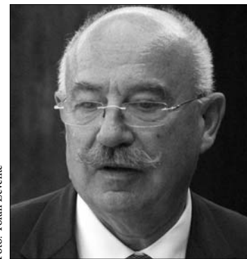
Martonyi János külügyminiszter

miniszter, hozzátéve, hogy emellett eleget tettek egy alapvető választási ígéretüknek is. „Már korábban jeleztük Szlovákiának, hogy minden vitás kérdéssről késszék vagyunk tárgyalni” – mondta. Megjegyezte, hogy nagyon régen nem volt ekkora nézetkülönbség a szomszédos országok között, mint most, az állampolgársági törvény kapcsán. „Romániával, Szerbiával és Horvátországgal is sikerült megértetni, hogy a magyar gondolkodásból hiányzik mindenféle területi megfontolás, nem foglalkozunk határokkal, de sok szeretnénk foglalkozni az emberek jogaival, nyelvi identitásával, közösségi tudatával” – mondta az interjúban a magyar külügyminiszter. ◀