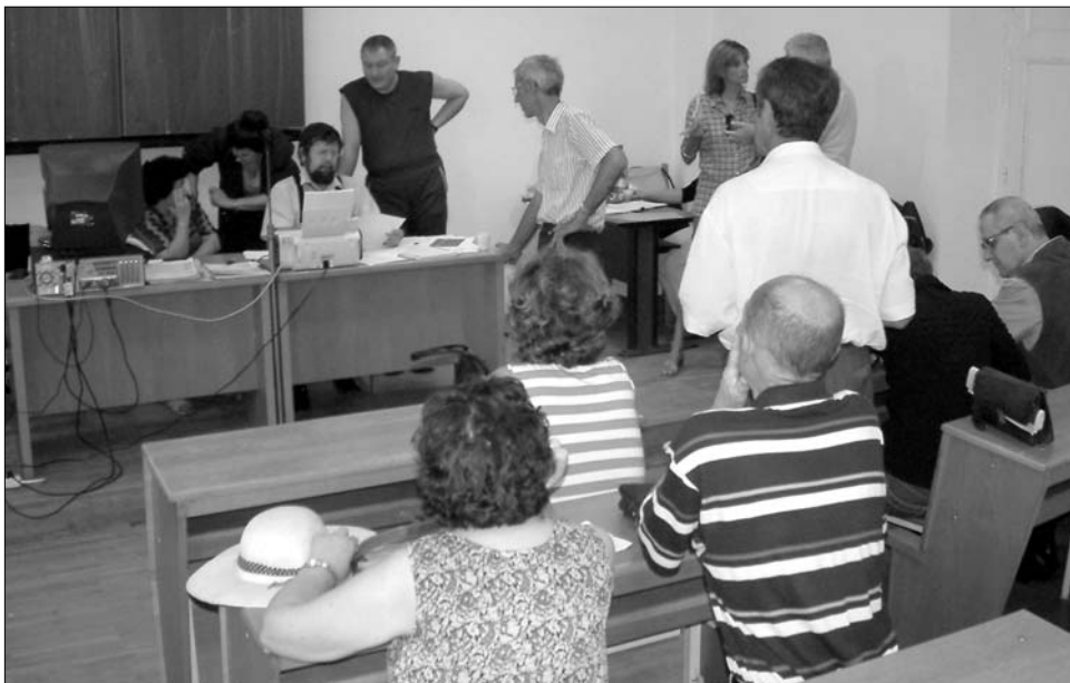
A 25 százalékos fizetéscsökkentés nem szegte kedvét a hazai pedagógustársadalomnak.

Hargita megye az országos átlag alatt marad, itt 521 helyre csupán 774 pedagógus pályázik; igaz, a címzetes posztok száma itt is aránytalanul alacsony: 91 tanár juthat a sokak által csu-