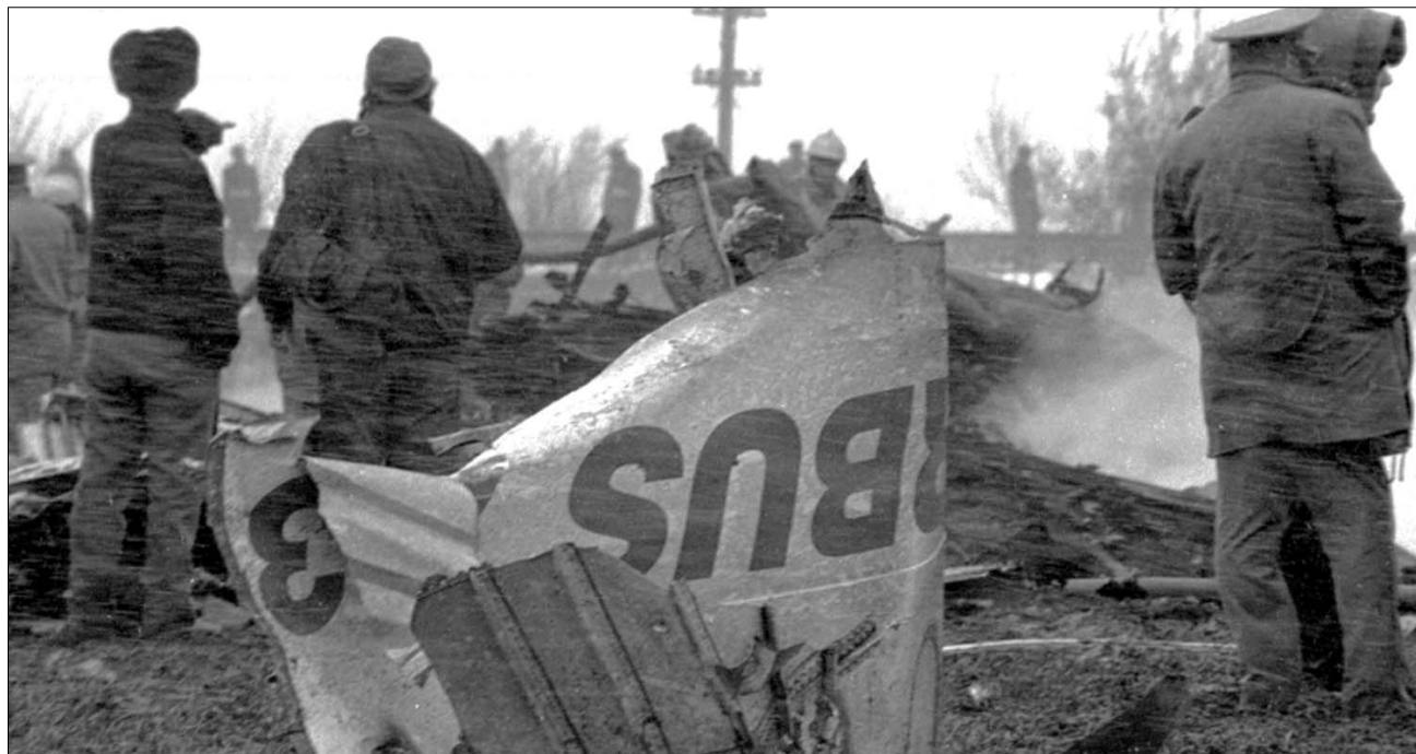
Balotești, 1995 márciusa: a legsúlyosabb romániai légikatasztrófában hatvan személy halt meg

Az tény, hogy a történetek után Románia létrehozta saját légiflottáját a hivatalos személyek szállítására, addig ugyanis ezeket a gépeket szovjet pilóták vezették. ◀