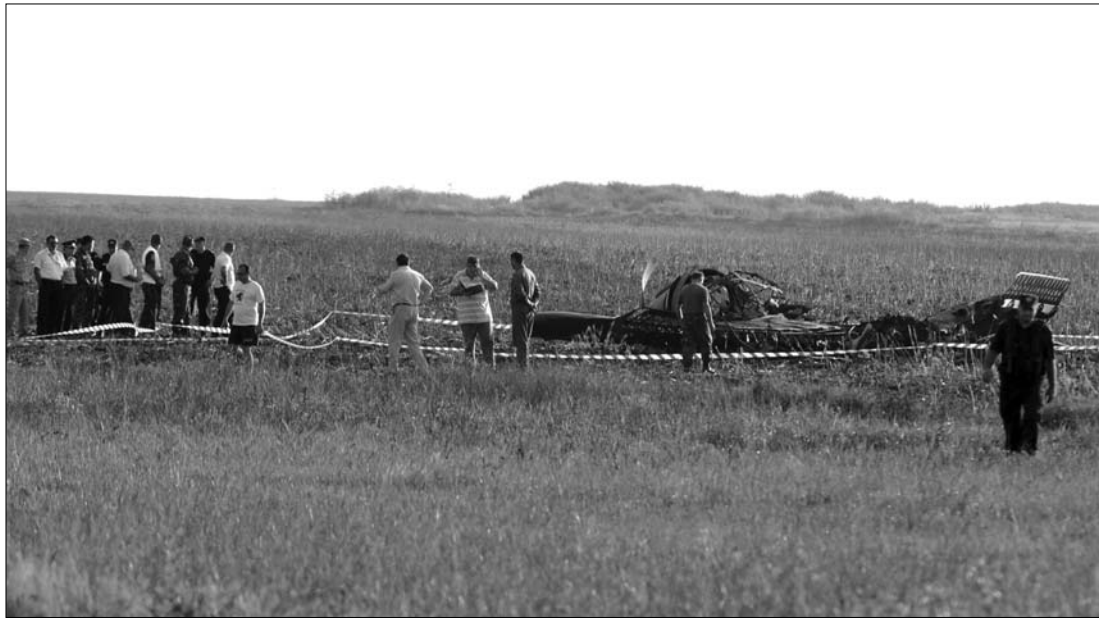
A gép motorja nem a levegőben, hanem a földhöz csapódáskor gyulladt ki