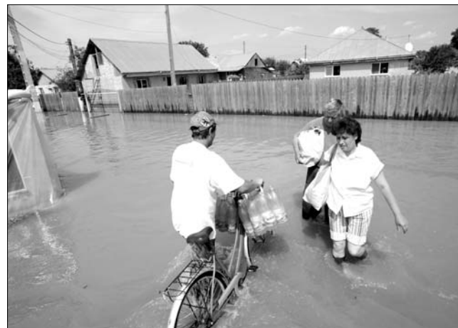
A Szeret és a Prut vízállása is rekord szintet ért el.

gyarázat arra, hogyan érhető el az árvíz ilyen mértékű” – nyilatkozta az államfő, aki a kérdésben „technikailag felkészült emberként” foglalt állást. A hétvégén éles támadások érték Traian Băsescu az árvíz által tragikusan sújtott Săucești-en, ezért tegnap – immár harmadszor – tért ide vissza a politikus, és sürgős beruházásokra, például a csatorna-rendszer korszerűsítésére és kiterjesztésére tett ígéretet. A hétvégén nemzetközi árvízlátogatók is Romániába utaznak: ide érkezik a rendkívüli helyzetekért, humanitárius segítségért és nemzetközi együttműködésért felelős európai biztos, Kristalina Georgieva is. A biztos jelezte, körvonalazódik az a nemzetközi összefogás, amelynek célja a romániai árvíz-károk enyhítése. Segítő szándékát jelezte többek között Magyarország is, annak ellenére, hogy néhány hete ugyanilyen mértékű természeti katasztrófa sújtotta a szomszédos államot. Szintén kiveszi a részét a kárelhárításból Lengyelország is: a következő napokban 23 katasztrófaelhárítási szakértőt küldenek Romániába. ◀