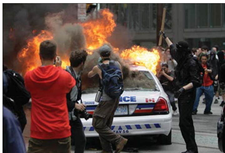
Forrt az utca Torontóban a G20-ak találkozójának ideje alatt

▶ Randalírozók csaptak össze Torontóban rendőrökkel szombaton a fejlett és a dinamikus fejlődő országok (G-20) vezetőinek csúcstalálkozója elleni tüntetésen. A nézeteltérések nemcsak az utcát jellemezték. 2. és 4. oldal ▶