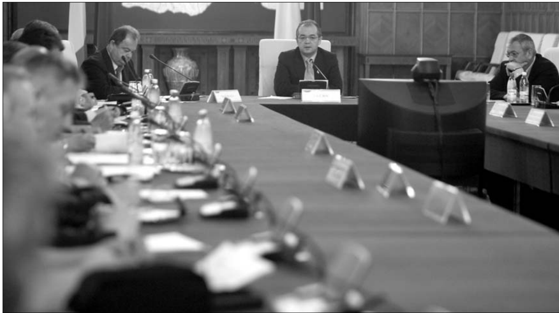
A taláros testület döntése után a kormány két rendkívüli ülést is tartott a hétvégén

A kormány már másnap megoldást talált a nyugdíjak csökkentésének megtiltására. Rendkívüli ülésén az áfa 24 százalékra való megemeléséről határozott. A kabinet azt is eldöntötte, hogy a személyi jövedelemadó és a társasági adó nem változik. Emil Boc miniszterelnök szerint az