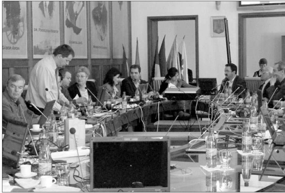
Az ellehetetlenüléstől tart a megszorító intézkedések miatt a sepsiszentgyörgyi önkormányzat

Meg nem erősített információk szerint az egyik gyermek szemtanúja lehetett testvére halálának, és megpróbált elmenekülni. A kislány halálának oka, a törvényszéki orvos első jelentése szerint, a nyakukon ejtett mély vágott seb. Az ügyben jelenleg is nagy erővel folytat nyomozást a rendőrség. Az Unitárius Egyház Képviselő Tanácsának elnöksége tegnap közleményben reagált a történetekre. A testület idegösszeomlással magyarázza a lelkész brutális tettét, együttérzéséről és támogatásáról biztosította a hátramaradt anyát. Meg nem erősített sajtóinformációk szerint Cseh Dénest a gyilkosság elkövetése előtti időszakban a marosvásárhelyi pszichiátrián kezelték. A lelkész jelezte elöljáróinak, hogy túlterhelt és szabadságra lenne szüksége, de a kérelmés elbírálására már nem került sor. ◀