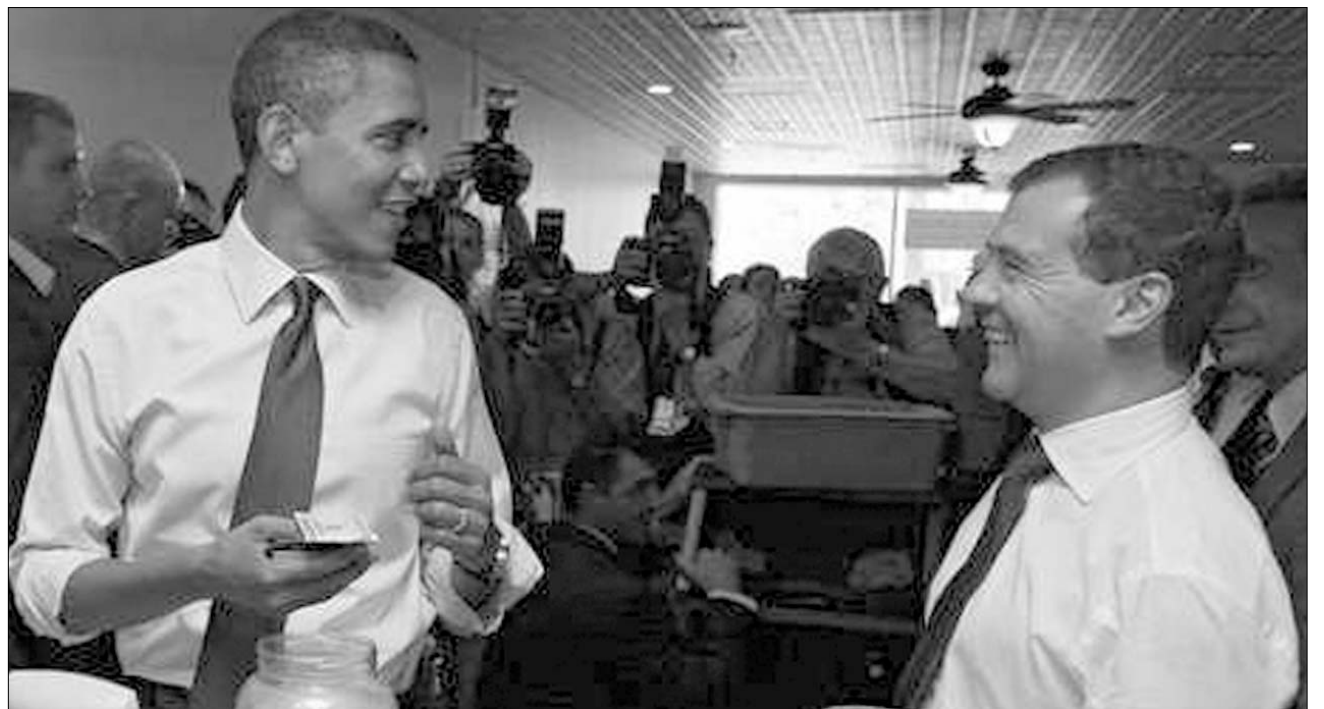
Obama: volt két hamburgerem... Virginiai gyorsbűfébe ugrott be az amerikai és az orosz elnök

A G8-ak találkozója – túl Észak-Korea és Irán megintésén, Hegyi-Karabah helyzetének rendezésén, továbbá Izrael felszólításán a gázai konfliktus kezelésére – kevés eredményt mutathat fel. A döntés ugyanis a jelenleginél szigorúbb és az egész vi-