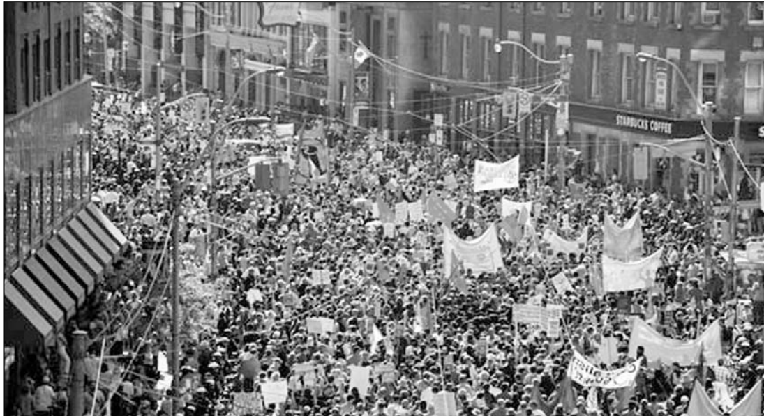
A G20-ak találkozója idején a tüntetők ezreinek többsége békésen tiltakozott a kanadai városban