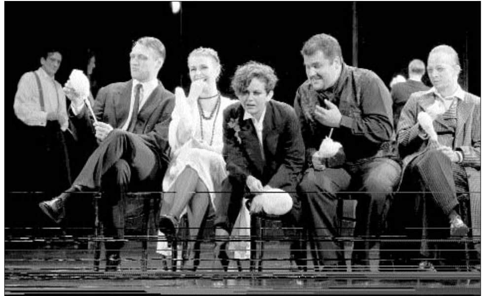
A sepsiszentgyörgyi társulat A mizantróp című előadásért hozta el a fesztivál fődíját

Szombaton este mindenki úgy búcsúzott egymástól: jóvőre veletek ugyanitt. ◀