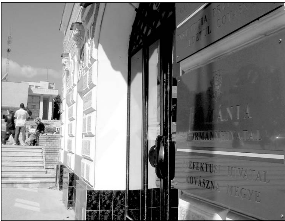
Nem taktikáznak a leépítéssel Háromszéken: a prefektúra alkalmazottainak negyede távozik