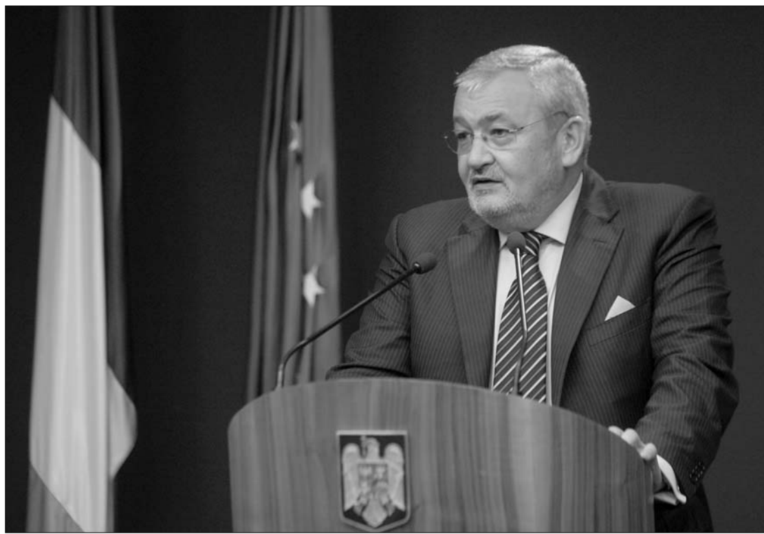
Sebastian Vlădescu pénzügyminiszter arra számít, hogy a talárosok a kormány pártját fogják

szinten”. Arra a pontosítást kérő újságírói kérdésre, hogy ez az eredeti szintre való visszatérést vagy további csökkentést jelent, nem óhajtott válaszolni. Annyit viszont elmondott, hogy a nyugdíjakat a jövő évi költségvetési törvény határozza majd meg. Vlădescu levélben figyelmeztette a parlament házelnökeit, elképzelhető, hogy az állami költségvetés jövőre sem lesz olyan „állapotban”, hogy át lehessen utalni azokat az összegeket, amelyek kipótolhatják a társadalombiztosítási büdzsét. Ezért – mondta a pénzügyminiszter – a kormány fenntartja magának azt a jogot, hogy a nyugdíjpontról értéket az államkasszába befolyt összegek függvényében évente módosítsa. ◀