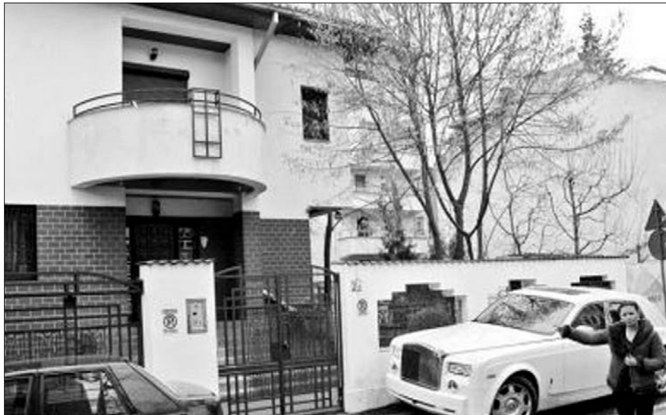
Bukarest, Primăverii negyed: Dan Diaconescu olcsóbbik, 500 ezer eurós villája

Az ingatlanok mellett kétmillió eurós jachtot, 385 ezer eurós Rolls Royce Ohantom, 340 ezer eurós Rolls Royce Droghed, 200 ezer eurós Bentley Flying Spur gépkocsit, továbbá két helikoptert mondhat magáénak.