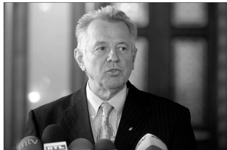
A Fidesz támogatásával Schmitt Pál házelnökből államfő lehet

Az LMP arra kéri a Fidesz–KDNP-t, tegyék lehetővé, hogy Sólyom Lászlót is jelölhessék köztársasági elnöknek – mondta tegnap budapesti sajtótájékoztatóján Schiffer András. A frakcióvezető kijelentette, hogy az LMP választmánya és frakciója egyhangúlag támogatná az államfő újráválasztását, de kevés a képviselőjük ahhoz, hogy Sólyom Lászlót jelölhessék. Elmondta, hogy más frakciók támogatását is várják az államfő jelöléséhez. Kitért arra is, hogy kíváncsiak Schmitt Pál és Balogh András elképzeléseire is, ezért az LMP frakciója szeretné őket is meghallgatni még az elnökválasztás előtt.