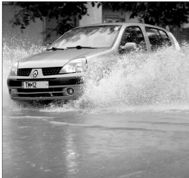
Továbbra sem enyhül a pusztító erejű kora nyári árvíz

útlezárást rendeltek el, a vonatok pedig több órát késtek. Neamț megyében átszakadt egy védőgát, emiatt kétszáz személynek kellett elhagynia otthonát. Temes megyében, ahol több mint egy hete folyamatos az árvízi készültség, átáztak a vasúti sínek, jelentősen akadózik a forgalom. A Marosvásárhelyről Budapest felé tartó nemzetközi vonat mozdonyára ráesett egy fa: a szerelvény körülbelül négy órán át vesztegelt, amíg helyreállították a közlekedést. A balesetben senki nem sérült meg. ◀