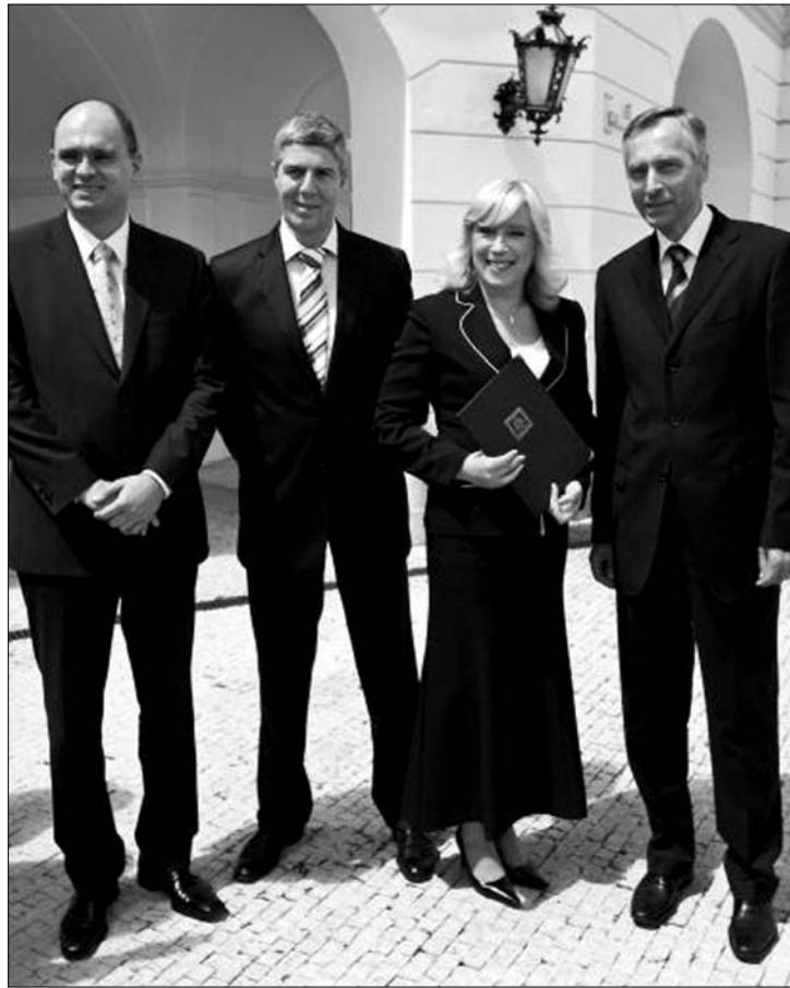
Kormányzásra kész az ellenzéki koalíció Iveta Radicová vezetésével

„Nagy megtiszteltetés ez számomra” – mondta újságíróknak