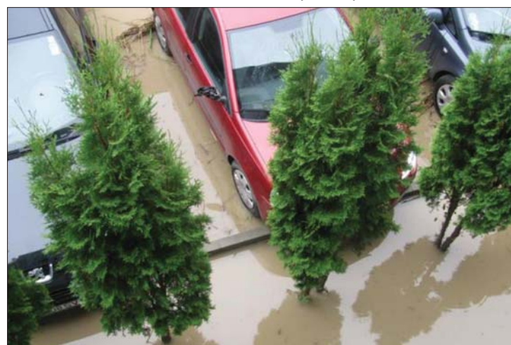
A víz tegnapra már Kolozsvár lakónegyedeinek parkolóit is ellepte

▶ Újabb áldozata van az árvizeknek: tegnap egy Fehér megyei nőt sodort el az ár. Szakértők szerint a következő napokban nemcsak a kármentés és a bajba jutottak védelme jelent komoly feladatot, oda kell figyelni a járványveszélyre is. 7. oldal ▶