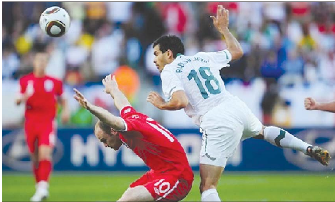
Alacsonyan szállt Wayne Rooney (piros mez), az angol válogatott mégis nyert a szlovén csapat ellen.

Ezzel a nyolcadöntőknek már két párosítása megvan, Argentína Mexikóval, a Koreai Köztársaság pedig Uruguay együttesével találkozik a legjobb 16 között. ◀