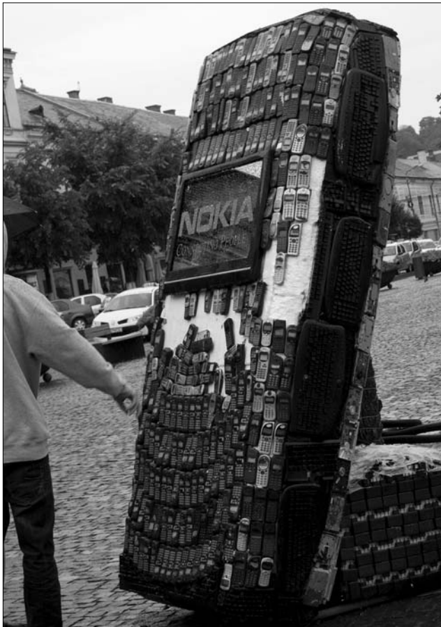
Hulladéktelefonokból és billentyűzetekből épített Nokia

A szobrok összhangban vannak a fesztivál gondolatosságával, amelyet a Városi Kultúráért Európai Alapítvány (European Foundation for Urban Culture) szervez, először a kincses városban. A képzőművészeti alkotások mellett június 17-e és 27-e között különböző országokban készült filmeket tekinthetnek meg az érdeklődők. A filmek globalizáló korunk egyik nagy kihívását emelik ki, a mindent elárasztó szemét és annak feldolgozásának problémáit.