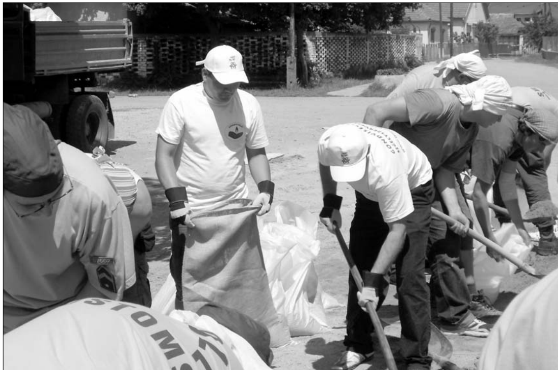
A magyarországi árvízkarosultakon próbálnak segíteni a Romániából érkezett önkéntesek

► Tizennégy önkéntes tűzoltó érkezik holnap Romániából az árvíz sújtotta magyarországi térségbe, ahol több napon át szivattyúzzák a vizet az elárasztott területekről. Az árvíz sújtotta térségbe látogatnak a segélyezésben együttműködő erdélyi szervezetek képviselői is, és 3-4 kisbusznyi gyorssegélyt (tartós élelmiszer, ásványvizet, tisztító- és fertőtlenítőszerket, takarókat) visznek magukkal. Az erdélyi szervezetek továbbra is pénzsegélyeket gyűjtenek, továbbá hasznos természetbeni adományok (pl. épületanyag) felajánlását is várják. A rendelkezésükre bocsátott anyagi javak célba juttatását országos hatókörű magyarországi segélyszervezetekkel együttműködve biztosítják. „Az erdélyi magyarok hetek óta megrendüléssel követik a magyarországi helyzetet. Szomorú tapasztalatoknak főként a székelvöldiek vannak birtokában: még elevenen él bennük a 2005. évi udvarhelyszéki árvíz borzalma” – áll abban a közleményben, amelyet tegnap juttatott el szerkesztőségünkbe az Erdélyi Magyar Nemzeti Tanács (EMNT), a Magyar Ifjúsági Tanács (MIT), az Erdélyi Magyar Ifjak (EMI) és a Gondviselés Segélyszervezet. Mint arról tájékoztattunk, az első