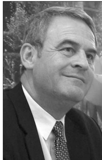
Tőkés László EP-képviselő

„Megtiszteltetés számomra, hogy egy ilyen fontos tisztségre jelöltek. Azon fogok munkálkodni, hogy az európai értékek alapján kiszélesítsük és erősítsük a magyar-román együttműködést. Amennyiben megválasztanak, azon leszek, hogy a temesvári forradalom értékeit, szellemiségét képviseljem a jövőben is” – nyilatkozta Tőkés László a frakciószavazás után. ◀