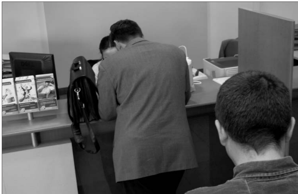
Hátat fordított a kormány a bankoknak. Eltörölte az előzetes visszatérítési illetéket a hitelek egy részére

a kölcsön adminisztrálására, folyószámla-adminisztrálásra, biztosításra is például. A kérelem leadását követően hatvan napon belül a banknak meg kell mondania, hogy a felmutatott dokumentáció alapján az ügyfél hitelképesnek tartja-e. A területet szabályozó európai uniós előírás – számolt be a Mediafax – a jelzálogfedezett hitelek esetében (például ingatlanalapú hitel) engedékenyebb volt, a szigorúbb feltételeket az év elején a kormány dolgozta ki. ◀