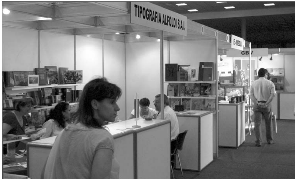
Az Alföldi nyomda visszajáró kiállítónak számít a tegnapi megnyílt bukaresti könyvvásáron.