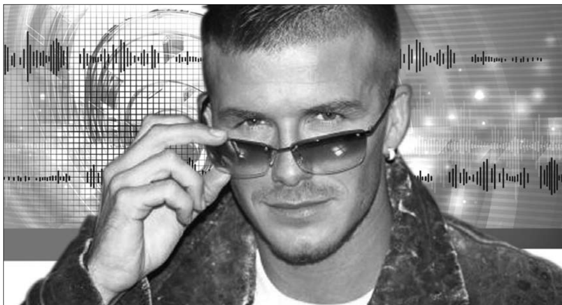
A gyepről a számítógépek képernyője elé igazolt David Beckham. A futbalvéré alatt a Yahoo! színeiben blogol

A tervek szerint Beckham nem csak szakértelmével fogja kommentálni a meccset, de a fociörülteknek személyesen fog válaszolgatni a Yahoo! Answers , a Y!Mail és a Y!Messenger csatornákon. A rajongókkal való kapcsolattartáson túl részt vesz a Yahoo! bizonyos kulcspiaccain futó nyári