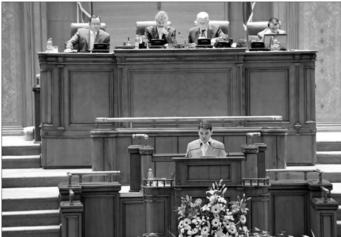
Dan Şova PSD-alelnök a 17 oldalas bizalmatlansági indítvány rövidített változatát olvashatta csak fel

„A bizalmatlansági indítvány célja leállítani a szociális népiért, amelyet a bér- és nyugdíjcsökkentés eredményezne” – olvasott fel Şova a bizalmatlansági indítványból, mely arra hívja fel a figyelmet, hogy a végrehajtó hatalom a Cotroceni-palotában található, Emil Boc miniszterelnök Traian Bănescu államfő „lakája”. Ezt a tételt megerősít