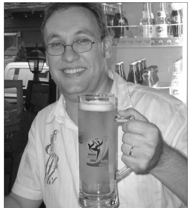
A vébé körüli „giccsüzletből” Afrika nem profitál