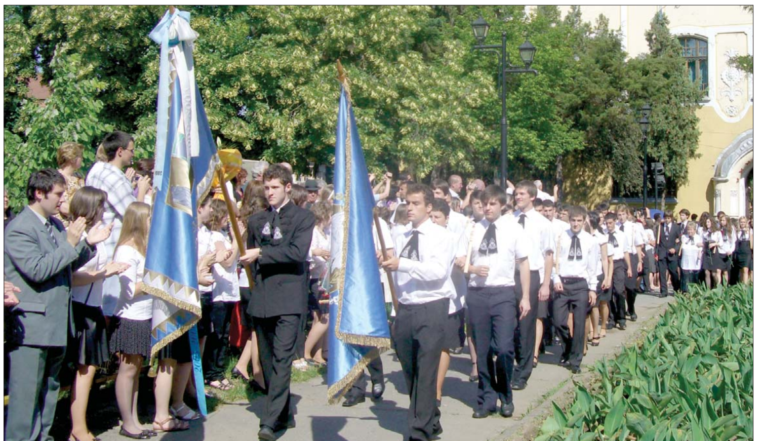
Mennyibe kerül egy kicsengetés? Sok száz erdélyi társukkal együtt a marosvásárhelyi Bolyai Farkas Líceum végzős diákjai tegnap ballagtak el

Igazi erőpróba az idén az érettségi, a szülőknek legalábbis. Az idei maturandusok hozzátartozói a válság ellenére is mélyen a zsebükbe nyúlnak – derül ki a tegnapi ballagási ünnepségeken készült körképünkből. Nem csak a ballagásra tervezetett egyedi öltöny, a bankettre megrendelt márkás koktéluha, a gondosan szervezett bankett és az utolsó kicsengetésre kibélelt ajándékboríték emészt fel jelentős összegeket, de sokba kerül az érettségizető tanároknak szóló protokoll és a tanári karnak szánt ajándék is: egy egész tanéven át gyűjtenek rá a vizsgáktól megszeppent végzősök. Az utolsó kicsengetést több száz eurós kiadás teszi emlékezetessé. 7. oldal ►