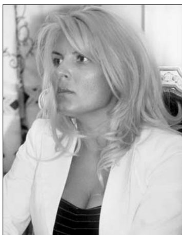
Elena Udrea miniszter

Udrea magyarázata szerint a CNI felszámolására azért van szükség, hogy a kormány eloszlassa a közpénzek elköltésével kapcsolatos gyanakvásokat. A miniszter azt is közölte, arra kéri majd a PD-L vezetőséget, szólítsa fel a párt politikusait, hogy válasszanak üzleti ügyeik és a politikusi hivatásuk között. A demokrata-liberálisok két minisztere, Adriean Videanu gazdasági, illetve Vasile Blaga belügyi tárcavezető váratlanul felkarolták Udrea utóbbi javaslatát. „Valóban szét kellene választani az üzleti életet a politikától. Ha politikus cége köt szerződést az állammal, az valóban gyanakvásokra adhat