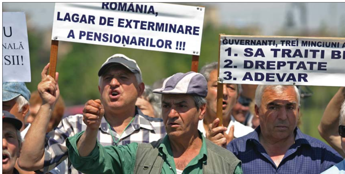
Több tucat nyugdíjas tüntetett tegnap a munkaügyi minisztérium és a parlament épülete előtt

▶ Se saját pártja, se a koalíciós partnerek nem tudták meggyőzni tegnap Traian Băsescu államfőt, hogy „csiszoljon” a megszorító intézkedéseket szentesítő döntéseken. Így aztán a kormány által ma elfogadásra kerülő IMF-szándéknyilatkozat és a ma vagy holnap a parlament elé bocsátott törvénytervezet várhatóan az eredeti bejelentés szerinti, 25 százalékos bércsökkentést és 15 százalékos nyugdíjcsökkentést tartalmazza majd. 3., 6. és 7. oldal ▶