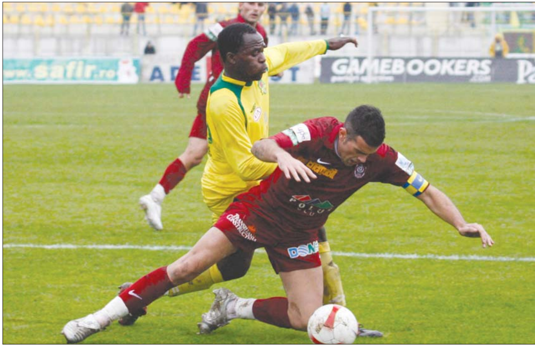
Ősszel Vasluiban megbottlott a CFR, Kolozsváron remizett a visszavágón, most viszont győzni akar