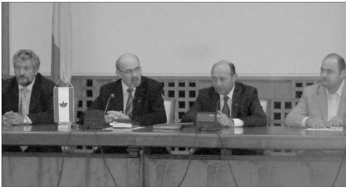
RMDSZ-harapófogóban Băsescu. Fekete Szabó András, Markó Béla és Olosz Gergely vette közre az elnököt

A Demokrata-Liberális Párt (PD-L) honatyáit arra figyelmeztette Băsescu, hogy nem várhatják el a nyugdíjasoktól a 15 százalékos áldozatot, ha ők maguk nem járnak elől jó példával, vásárlás el állítva az üzleti vállalkozással is rendelkező minisztereket és közméltóságokat. „Ha ezt nem teszik meg, akkor semmiellők pártja lesztek” – fogalmazott az államfő, felszólítva volt párttársait, hogy ne folya- modjanak közvetítők, strómanok bevetéséhez az állammal kötendő szerződések megnyeréséhez. Az egyik érintett PD-L-s politikus, Adriean Videanu gazdasági miniszter a találkozót követően egyetértett az államfő azon kérésével, hogy a vállalkozó politikusok ne kössenek szerződéseket az állammal, de kitérő választ adott arra a kérdésre, hogy hajlandó lenne-e lemondani cégéről a politizálás kedvéért. Az ügy érdekessége, hogy az államfővel való találkozó előtt Elena Udrea