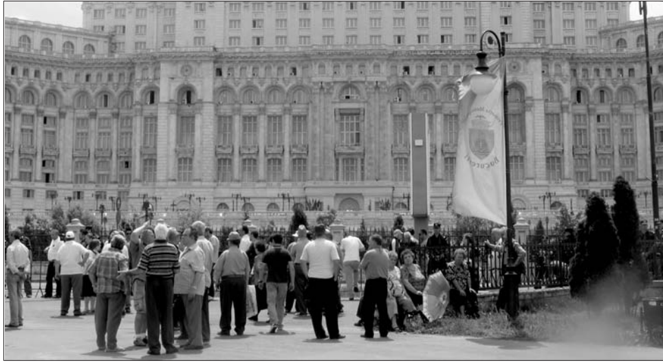
A parlament előtt kérték jussukat tegnap a nyugdíjsökkentés ellen tiltakozó nyugdíjasok

► Élő láncot alkotva demonstrált néhány tucat kétségbeesett nyugdíjas tegnap a Munkaügyi Minisztérium előtt a nyugdíjak tervezett csökkentése ellen. Az egy órás tüntetés résztvevői kilátásba helyezték, nem csak szimbolikusan, hanem konkrétan is oda-láncolják magukat a szaktárca vagy a parlament épületéhez, ha követeléseiket figyelmen kívül hagyja a kormány. Az elégedetlenkedők képviselőit végül Mihai Şeitan munkaügyi miniszter fogadta, a megbeszélés