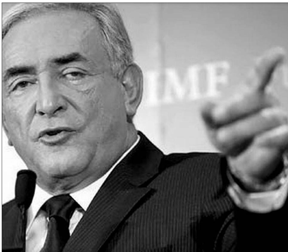
Dominique Strauss-Kahn IMF-vezér. Ujjal mutatott a felelősökre

A Konzervatív Párt elnöke, Daniel Constantin azt állítja, hogy a válságkezelés teljes téves módjával „az államfő és kormánya” teljes mértékben hitelét vesztette, mind a hazai, mind a nemzetközi közvélemény előtt. ◀