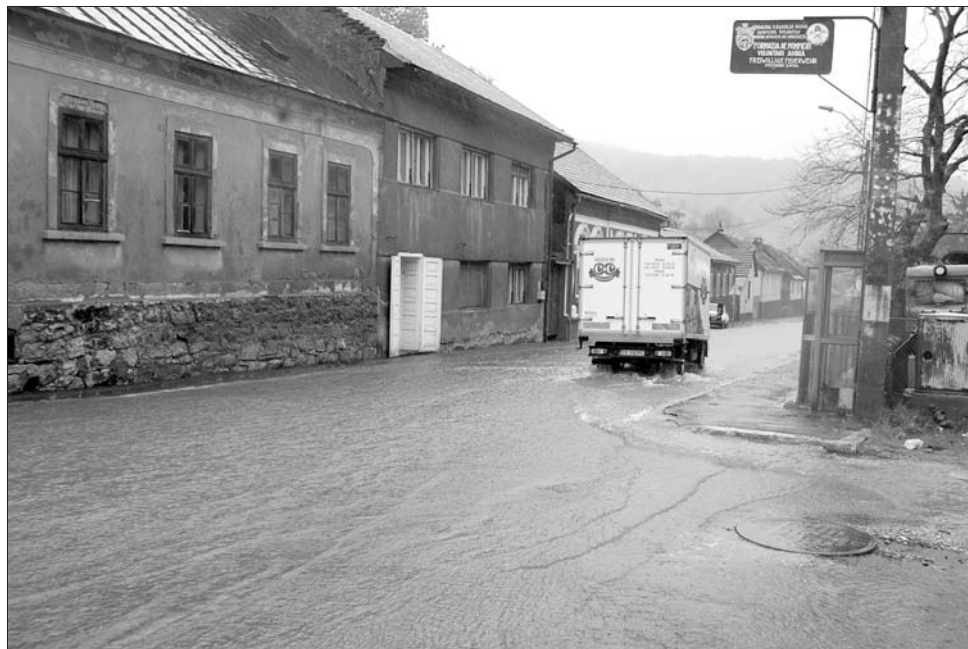
Megrongálta az utakat a hirtelen lezúduló nagy mennyiségű víz Krassó-Szörény megyében.

Evakuálásra került sor viszont a Krassó-Szörény megyei Nérasolymoson, ahol 29 gyereket kellett kitelepíteni. Az árvíz sújtotta roma telepet a lakók a Néra folyó árterületére építették, a házak többsége olyan rossz minőségű, hogy az áradás pillanatokon belül életveszélyessé tette azokat. A katasztrófaelhárítás szakemberei az érintetteket a helyi iskola tornatermében szállásolták el. Erdély nyu-