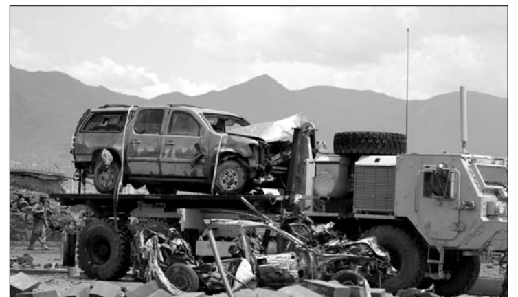
Legkevesebb öt külföldi katona vesztette életét a merényletben

tént, de a környéken más kormányzati épületek is vannak, a közelben található a parlament is. Claudio Glaentzer, Olaszország amerikai nagykövete a Sky TG24 televíziónak nyilatkozva azt mondta, hogy a támadás célpontja egy amerikai katonai konvoj volt. Idén már valamivel több, mint kétszáz NATO-katona vesztette életét afganisztáni hadműveletekben: az ISAF ezzel a legsúlyosabb időarányos veszteséget szenvedte el a harcok több mint nyolc évvel ezelőtti kezdete óta. A merénylet elkövetését a tálib mozgalom vállalta magára. ◀