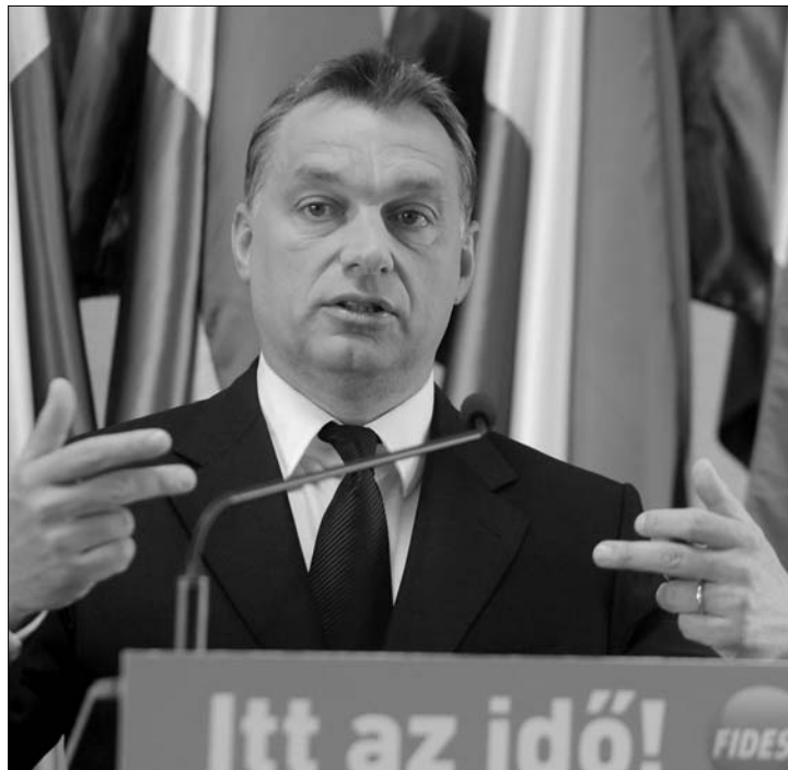
Orbán Viktor szerint Szlovákia provokálja Magyarországot

„Az állampolgárságról szóló magyar döntés jogalapja a nemzetközi jogban vitathatatlan: az állam szuverenitása alapján szabadon határoz állampolgárságra