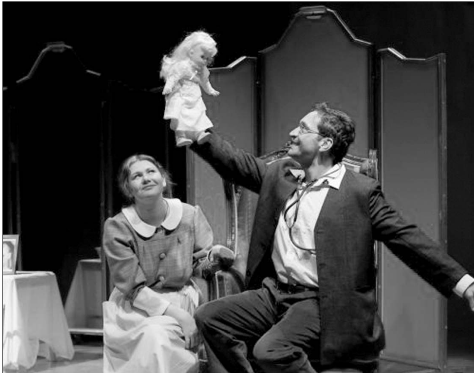
A kolozsváriak a Suttogások és sikolyok című Bergman-adaptációval lesznek jelen

„Idén 5,8 millió eurós keret állt rendelkezésünkre megszervezni a világon harmadik leghíresebb színházünnepet” – ismertette a részleteket Chiriac, kiemelve, hogy az említett összeghez a művelődési minisztérium 238 ezer euróval (másfél millió lejjel) járult hozzá. A színházfesztivált bemutató sajtóértekezleten jelen volt Kelemen Hunor kulturális miniszter is, aki elmondta, a minisztérium tisztában van a nagyszebeni rendezvény fontosságával, éppen ezért szorítottak ki másfél millió lejt az eleinte csak egymillió támogatás helyett. „A Nagyszebeni Nemzetközi Színházfesztivál lehetőséget