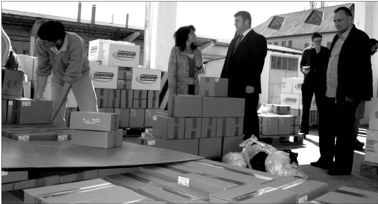
Negyven termék indult el két hete Hargita megyéből a magyarországi Cora-üzletekbe. Az áruházlánc választott