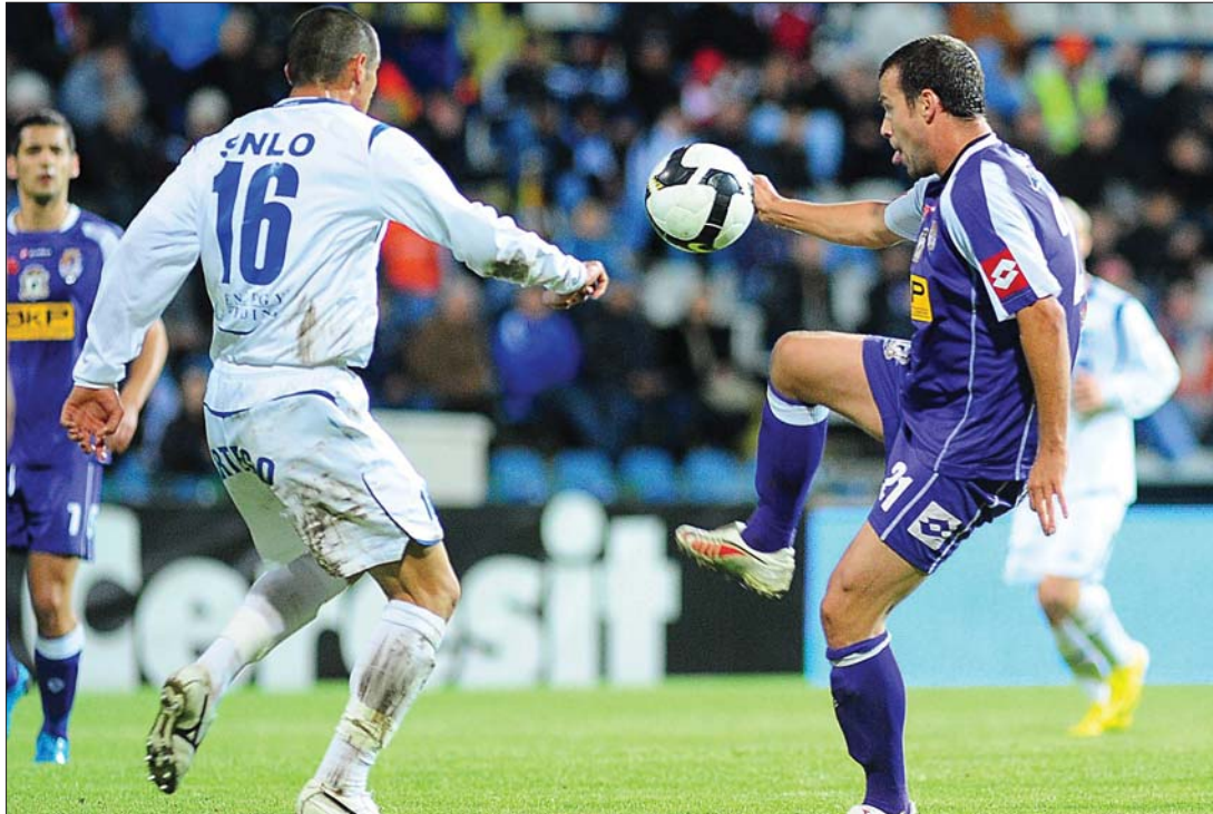
A temesváriak eldekezték Tg. Jiuban, de győzni nem tudtak a kieső helyen álló házigazdák ellen.

Aradon rendezik ma 19 órától a másodosztályú labdarúgó-bajnokság második csoportjának rangadóját, az UTA-Kolozsvári Universitatea-mérkőzést. A találkozót még a 27. fordulóból használták el, s a feljutást jelentő helyekért zajlik a csata. Szintén ma pótolják be a Temeskovács-Otopeni-viadalt, ez 18 óra- kor kezdődik.