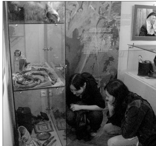
A kiállítás a gyermekek körében nagyon népszerű

A Tűz őrzője címet viselő tárlat egy színes szönyegekkel bélelt sátorral indít, majd sorra mutatja be azokat a tárgyi emlékeket, amelyek a szibériai népcsoport életvitelének hétköznapjaihoz, szokásaihoz, hiedelmvilágához tartoznak. A tárlókban a bogószedő kosártól, a különböző alapanyagokból készült amulettekig, a védőszellem kabátkáijáig, medvebocsféjek, szellemsapkák, halszobrocskák, valamint szintén a nomád