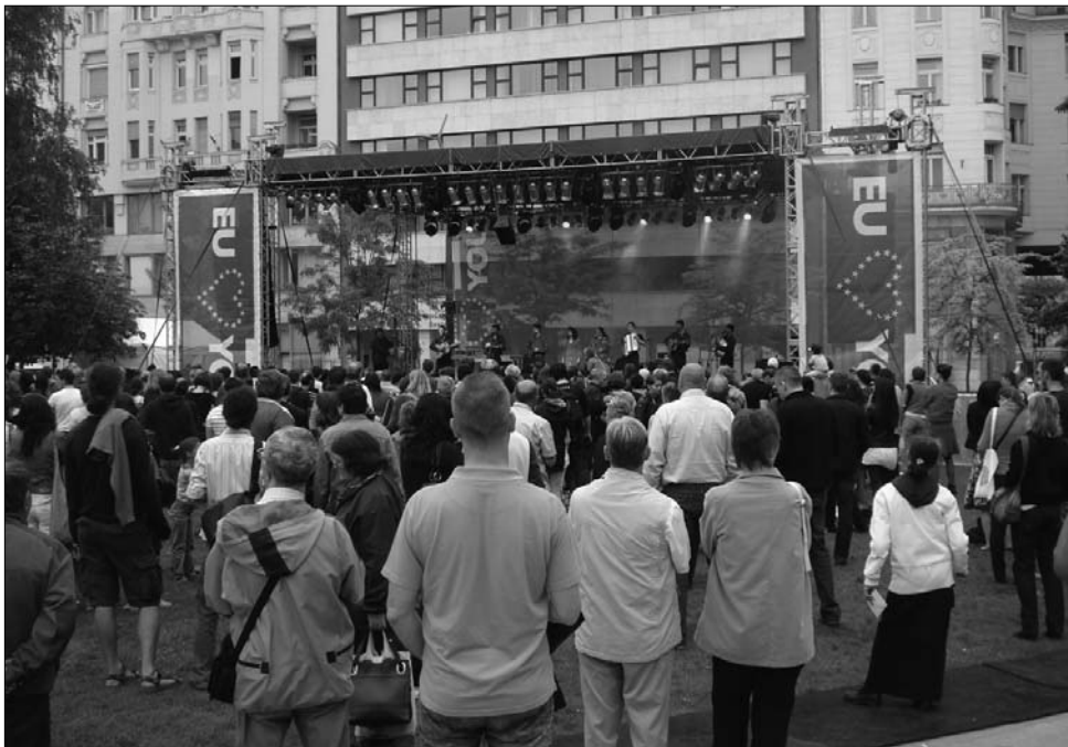
A pesti Erzsébet téren összegyűltek szórakoztatásáról a civil szervezetek és koncertek gondoskodtak

Öt középiskola részvételével szervezett május 9-én, Európa-napján vetélkedőt a csíkszeredai polgármesteri