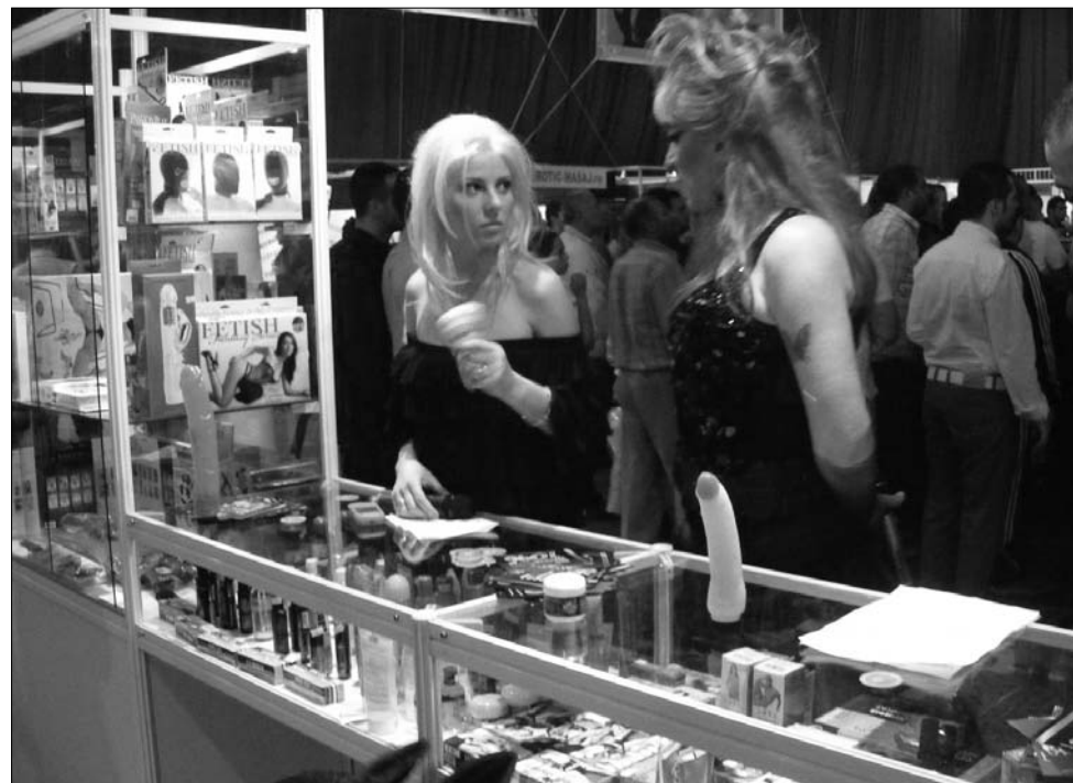
Mi szem, szájnak ingere... Pillanatkép a bukaresti erotika kiállítás és vásárról