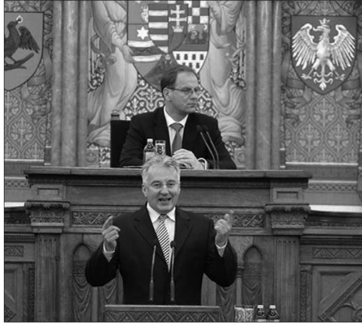
Semjén Zsolt: legfontosabb ügyem a kettős állampolgárság megadása

Semjén Zsolt a Hír TV műsorában a kettős állampolgárság megadását élete legfontosabb ügyének nevezte. Tájékoztatása szerint a román példát követik majd – amely előtt „megemelte a kalapját” –, azaz egyéni kérelem alapján, gyorsított eljárással megadják az állampolgárságot annak, akinek magyar identitása van. Ilyen megítélés alá az eshet, aki valamilyen szinten tud magyarul, a történelmi Magyarországról származik, vagy vélelmeshetően innen vándorolt el a történelem folyamán. „Ha Románia kiterjeszthette az uniót kívüli Moldova Köztársaság polgárait a román identitás alapján a román állampolgárságot, akkor Brüsszel se szólhat egy szót se, ha a felvidéki és erdélyi magyarság is megkapja az állampolgárságot” –