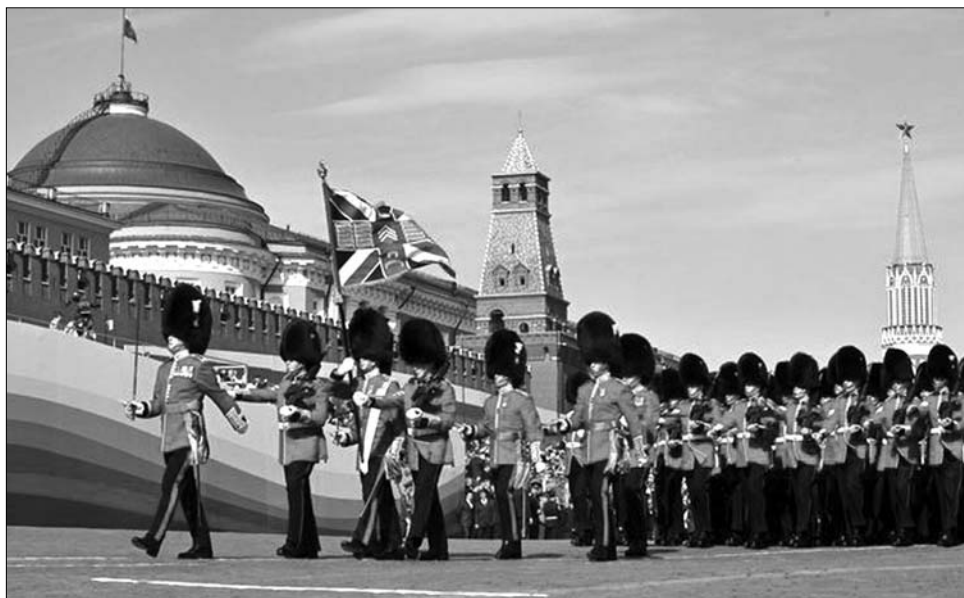
Nem őrségváltás a Buckingham-palota előtt: a felvétel a győzelelnapi moszkvai katonai parádén készült

A nagy történelmi megbékélésen – Charles de Gaulle és Konrad Adenauer kézfo-gásán, valamint az 1984. szeptember 22-i jeleneten, amikor a verduni emlékün-