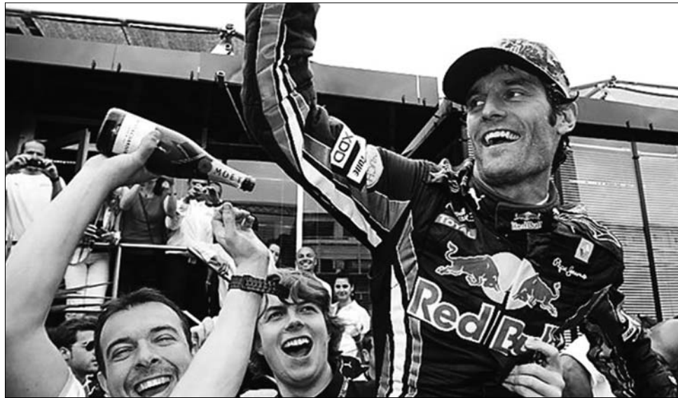
Mark Webbert ünnepelték tegnap Barcelonában, ahol rajt-cél győzelmet aratott

A száguldó cirkusz élő legendája, Michael Schumacher viszont most jól autózott. A Mercedes hétszeres világbajnok német pilót