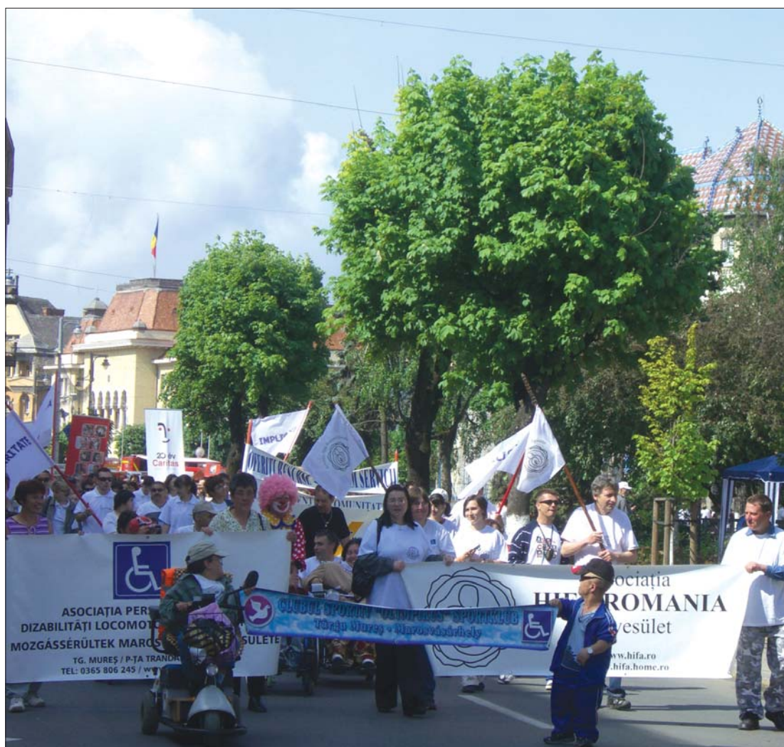
Civil szervezetek mustrája Marosvásárhelyen. Az első sorokban a mozgássérültek vonultak

▶ Fontos, hogy a külvilág összefüggő régióknak lásson egy területet, de ennél sokkal lényegesebb, hogy az ott lakók magukat egységként „éljék meg”, azaz legyen identitástudatuk – hangzott el a Romániai Magyar Közgazdász Társaság által szervezett, a régiók átrajzolásáról szóló beszélgetésen. A jelenlévők egyetértettek abban, hogy a jelenlegi felosztás nem működik hatékonyan, kevés pénz tudott lehívni Románia. Vitába szálltak azonban Csutak Istvánnal az általa kidolgozott regionális felosztás kapcsán, amelyet az RMDSZ törvénytervezet formájában már a parlament elé is terjesztett, sőt már a szenátus el is fogadta. 6. oldal ▶