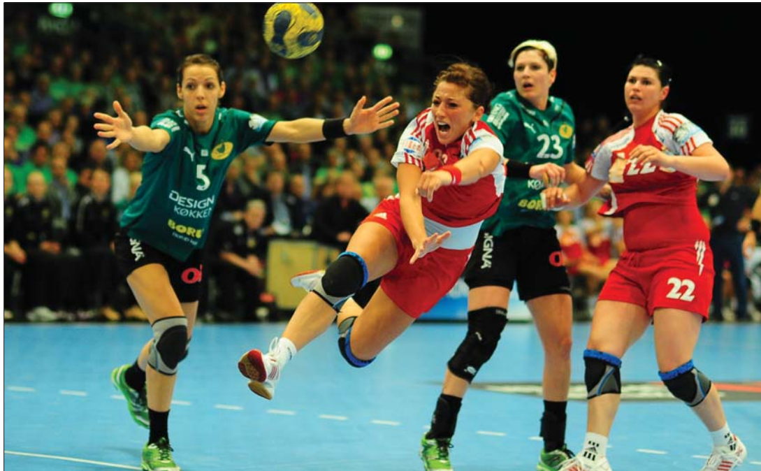
Dániában eljátszotta az eszéit az Oltchim. Bravúr kellene a Bajnokok Ligája győzelemhez

A nagyarányú vereség miatt az Oltchimnak valódi bravúrt kellene végrehajtania a bukaresti visszavágón ahhoz, hogy elhódítsa a serleget. Ennek ellenére nem akarják feladni a harcot, és mindenképp emelt fővel akarják zárni a sorozatot. „Rendkívül