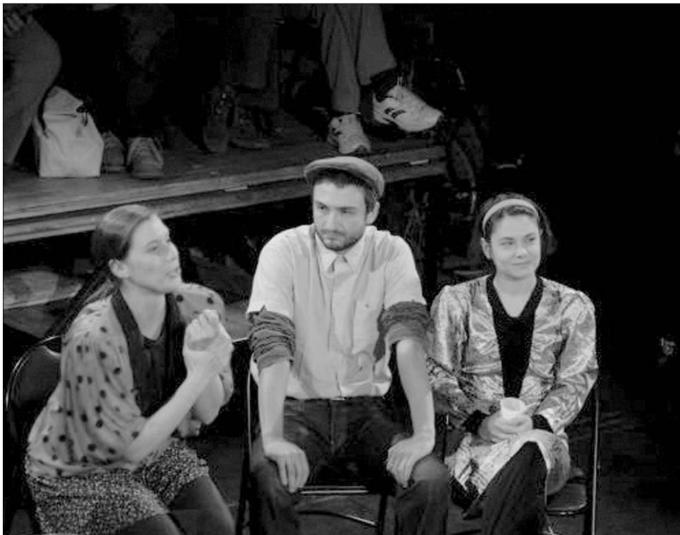
A 20/20 című román–magyar koprodukció tegnap Debrecenben volt látható