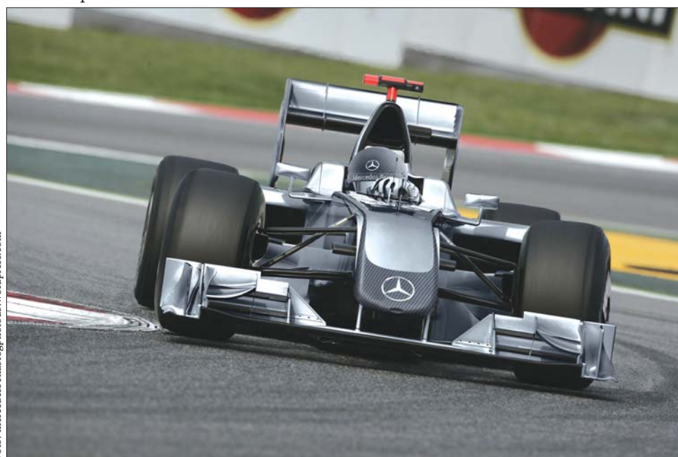
Michael Schumacher hétvégén ismét rajthoz áll, de immár a Mercedes volánja mögött

Amint arról korábban már beszámoltunk, az idei szezonról új pontozási rendszert vezetnek be, és az eddigi nyolc helyett az első tíz helyezett kap pontokat: a győztes 25-öt, a többiek sorrendben 18, 15, 12, 10, 8, 6, 4, 2 és 1 pontot. A hétvégén rajtoló szezonban megszűnik a versenyek alatti tankolás, keskenyebbek lesznek az első abroncsok, és az időmérő utolsó szakaszában szereplő pilótáknak ugyanazzal a szett gumival kell elkezdeniük a futamot, amelyikkel a legjobb időt futották. A szombati kvalifikációs edzést érinti, hogy mostantól már nem kell üzemanyagot számolni az utolsó etapban. ◀