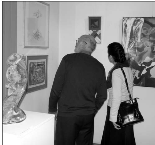
A temesváriak munkáit április 10-ig lehet megtekinteni Budapesten