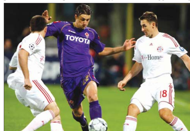
Hiába a „lilák” három gólja, a Bayern jutott tovább

65. percben Robben egy remekbeszabott találattal „továblította” a münchenieket. A londoni összecsapáson az ágyúsok valósággal meg-