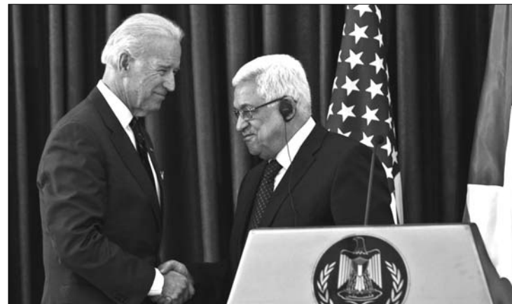
Joe Biden amerikai alelnök Mahmúd Abbász palesztin elnökkel találkozott

tervek szerint a következő hetekben kezdődnek amerikai közvetítéssel. Mahmúd Abbász palesztin elnökkel közösen tartott sajtóértekezletén Biden mindkét felet felszólította, hogy tartózkodjon az olyan lépésektől, amelyek hatására fellángolhatnak az ellentétek. „Mindkét félnek olyan légkör kialakítására kell törekednie, amely segíti, és nem megnehezíti a tárgyalásokat” – hangsúlyozta az USA alelnöke, és hozzátette: „Az izraeli kormány tegnapi döntése, miszerint új lakások tervezésébe kezd Kelet-Jeruzsálemben, aláásza a bizalmat, azt a bizalmat, amelyre most szükségünk van ahhoz, hogy sikeres tárgyalásokat kezdjünk, és folytassunk.” ◀