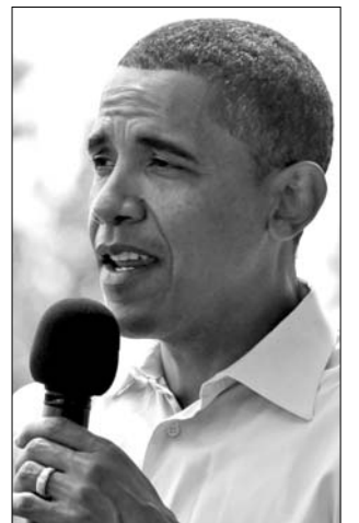
Barack Obama

Az azonban változatlanul kérdéses, hogy a Fehér Ház