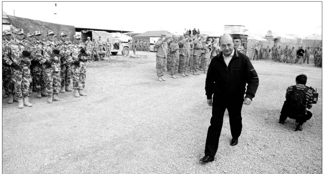
Az államfő szándékai szerint jelenlétével akarta megerősíteni az otthoniak szolidaritását a katonákkal

Az államfő Kandahárban tárgyalt Stanley McCristal tábornokkal, az Afganisztánban állomásozó NATO-csapatok parancsnokával is. Arra kérte a katonai vezetőt, hogy lássa el több harcokcsival a román alakulatokat, melyek létszáma a közeljövőben 600 fővel bővülni fog. Románia jelenleg 1020 katonát állomásoztat Afganisztánban, ebből 982 katonát a NATO vezetése alatt álló nemzetközi biztonsági erő (ISAF) kötelekében, 38-at pedig az Egyesült Államok vezette koalíciós erők tagjaként. ◀