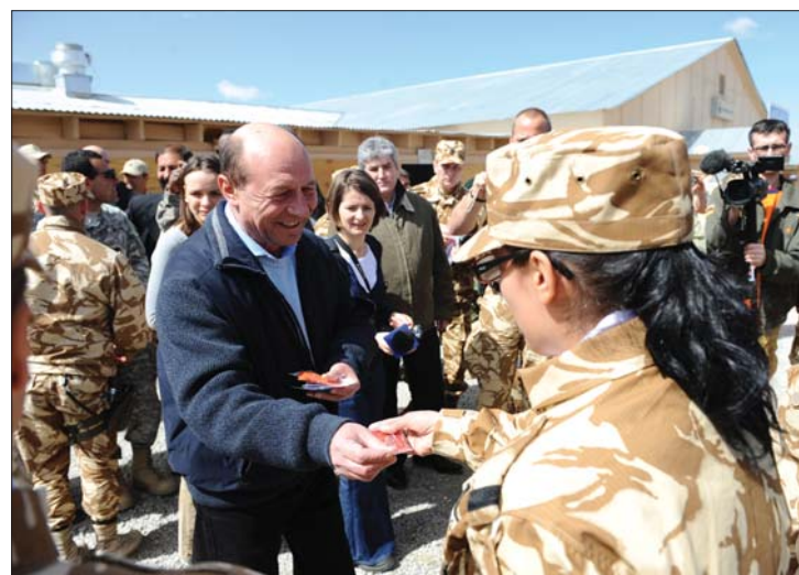
Traian Bănescu kiténtetéseket adott át a román katonáknak

szolgálatot teljesítő román katonákat kereste fel, és az otthoniak szolidaritásáról biztosította őket. 2. oldal ▶