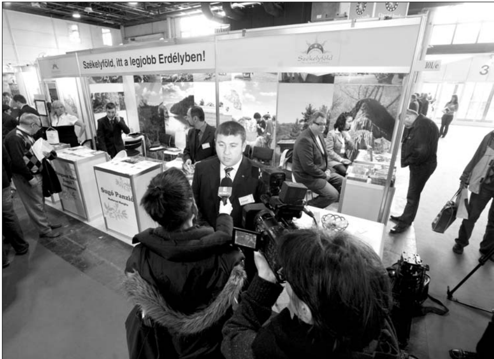
Borboly: Székelyföld turisztikai kínálata három helyen van jelen a budapesti vásáron

A magyarországi Hungexpo nevű kiállítókomplexumban való jelenlétre a pénzügyi rész vevő vállalkozók, illetve a Hargita, Kovászna és Maros megyei önkormányzatok adták össze. „Ez az adófizetőknek nem jelent nagy anyagi terhet. A Hargita megyei önkormányzat húszezer lejt, azaz ötezer eurót fektetett a programba, és a többi megyék is – részvételük méretének függvényében – hozzájárultak a költségekhez” – nyilatkozta Borboly. A tizenegy székelyföldi