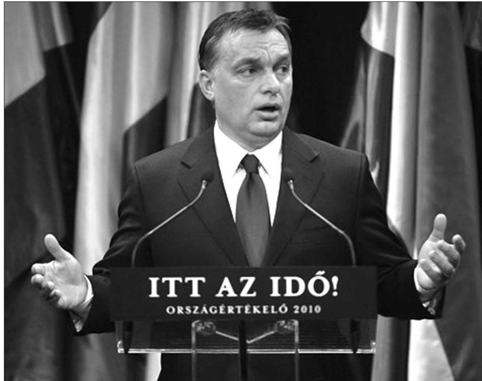
Orbán Viktor, a győző

A nem hivatkozott idézetek forrása: Újjá kell építeni Magyarországot, Orbán Viktor évertékeltő beszéde.