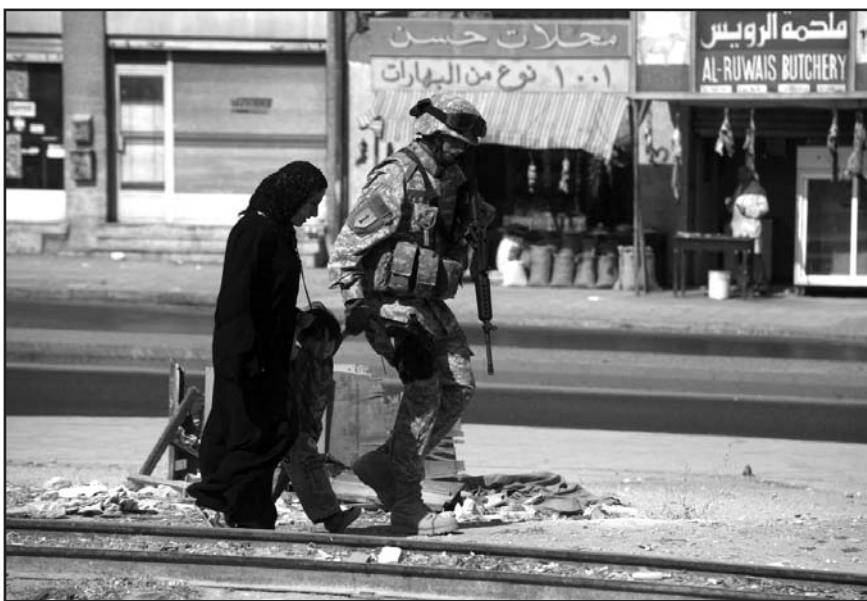
Botrányos befutó lehet az Oscar-díjazáson A bombák földjén , Kathryn Bigelow dícsért és vitatott filmje

Hogy az idegen nyelvű film kategóriában mi lesz, szinte lehetetlen megjósolni, de tény, hogy a franciák küldötte, az európai Keresztapának tartott A proféta (r. Jacques Audiard) nagy eséllyel indul, amit a számos Cesar-díja is (előre)jelez.