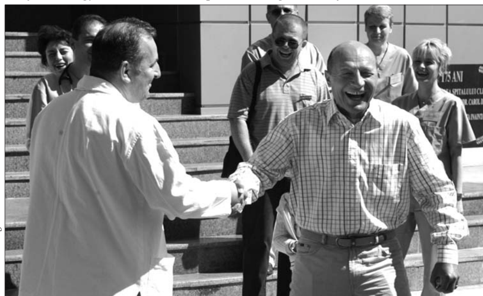
Traian Băsescu – az egészséges antikommunista

lyak! Băsescu az ősszel nem azért hívta magához, mert nagyrabecsülné, hanem mert szüksége volt egy PSD-s szolgálóra, aki a pofájába kapja a kotlós tojásokat. Sárbu zsíros kenőpénzért teszi a dolgát. Nem kell neki kétszer mondan. Semmi kétségem afelől, hogy sikerrel jár, Băsescu. Beleértve az alkotmány felborítását és a parlament szétverését. Falánk, telhetetlen piránja-rajok állnak rendelkezésedre. Ezek képesek felfalni a költségvetés elefántját, az IMF pénzét, anélkül, hogy te bemocskolnád magad. (...) (Fordította: K. B. A.)