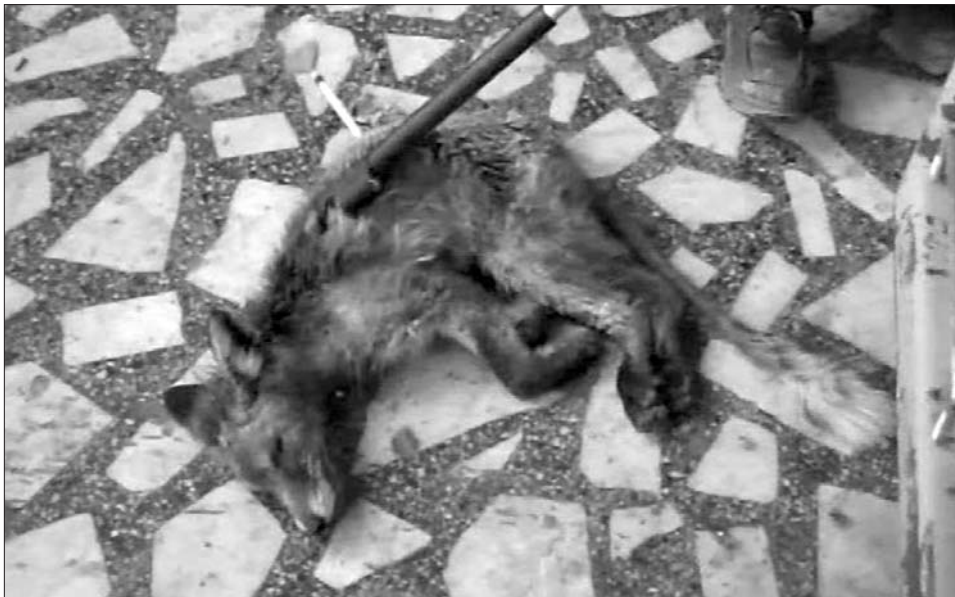
Ott terjed rendkívüli mértékben a vesztésgyár, ahol elhanyagolják a vadállomány gondozását