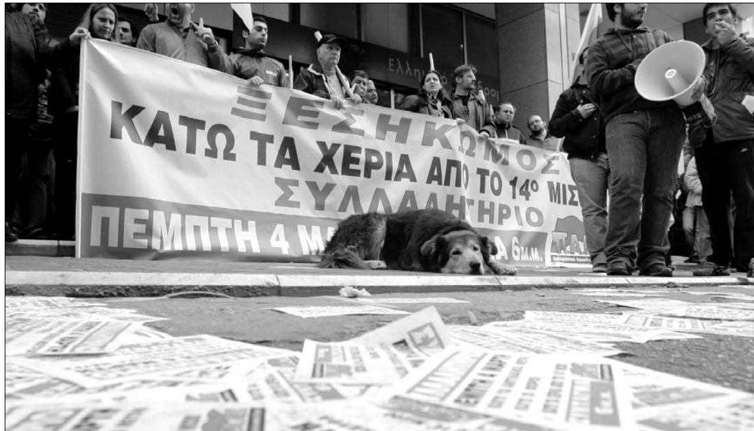
A görögországi tüntetők nem engedték be az épületbe a munkába igyekvő minisztériumi dolgozókat