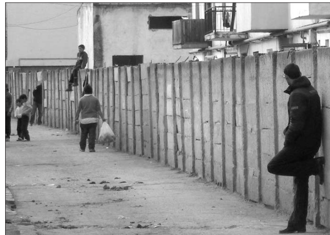
Abban bíznak, hogy eltűnik a sepsiszentgyörgyi szegényfal