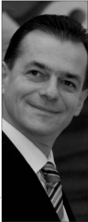
Ludovic Orban, Viorel Cataramă és Crin Antonescu – két hivatalos és egy potenciális pártelnök-jelölt

Mircea Ionescu-Quintus ugyan megpróbálta az utolsó pillanatban összebékíteni a két tábor, kétségbeesett erőfeszítése, amellyel kompromisszumos megoldásként a listás és a név szerint szavazás helyett a nyitott listás voksolást javasolta, visszhangtalan maradt.