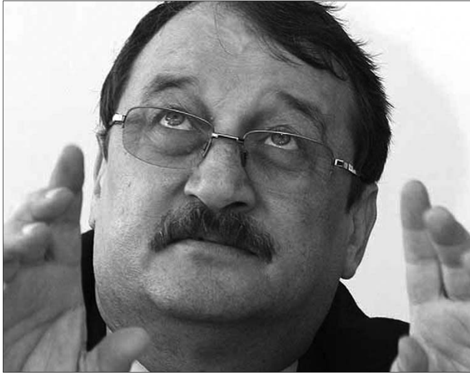
Mircea Băsescu. A kétes ügyletek karmestere?

Tavaly széllőztette meg a sajtó Mircea Băsescu fegyvergyűleteit is. Az államfő fivére harminc százalékkal lett részvényes a Defence Security and Intelligence Co. nevű cégben, amelybe üzlettársai – zömmel a honvédelmi és a gazdasági tárca tisztviselői – azért vették be, hogy „kaput nyisson az elnöki palotában” a pénzes szerződések előtt. Lapforrások szerint az amerikai kongresszus 53 tagja levélben kért hivatalos kivizsgálást Barack Obama elnöktől, a cég törvényellenes fegyverexportjai kapcsán, amelyek az Egyesült Államokat is érintették. ◀