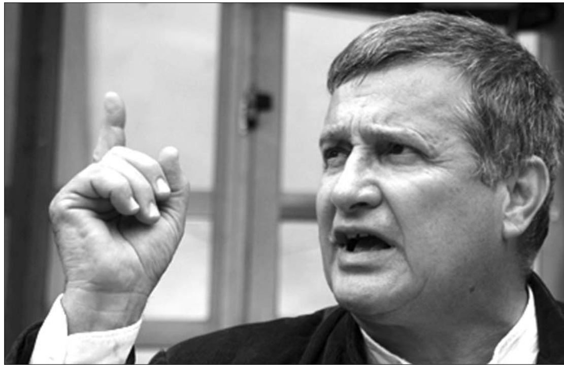
A szókimondásáról híres Mircea Dinescu számos ellenséget szerzett a hatalom mostani birtokosai között