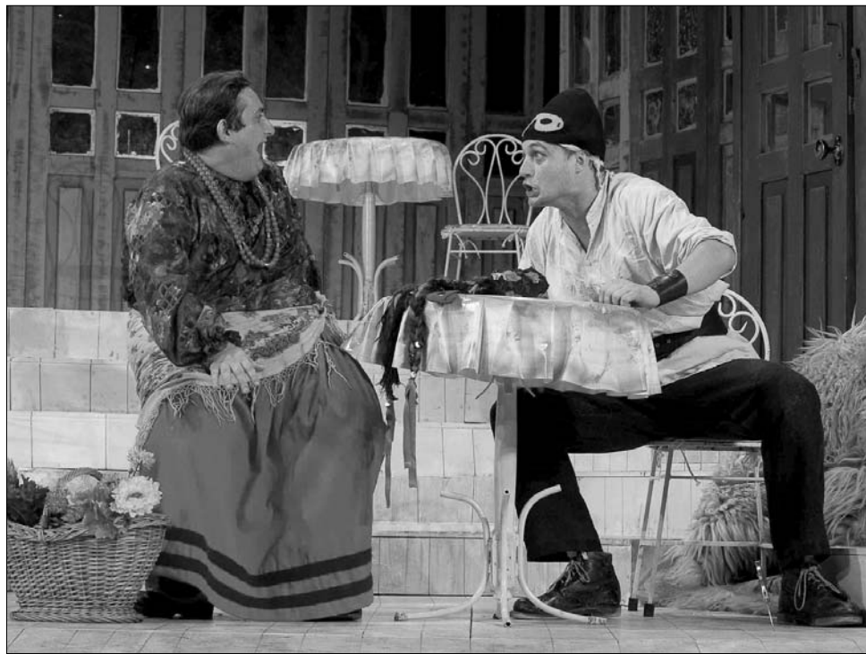
A Ion Luca Caragiale darabja alapján készült Karnebál a társulat legfrissebb „termése”

A turné keretében bemutatott előadások közül a feb-