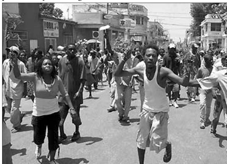
A haiti főváros lakói tegnap munkát és élelmet követeltek

Egy férfi hatalmas kőkockával a kezében azt kiabálta, hogy kész a tüntetőkért harcolni. „Ha rendőrség löni fog ránk, gyűjtögetünk” – üvöltözték a tüntetők. A feldühödött emberek az újságírók és a fotóriporterek távozását is követelik, „nem akarunk itt újságírókat látni” – kiabálták. ◀