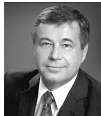
Ján Mikolaj oktatásügyi miniszter

nák a diákoknak. A képviselőtestületek tagjaiminden ülés elején el is énekelnék a himnuszot. A jogszabálytervezet a nyelvtörvénnyel ellentétben nem tartalmaz szankciókat, így gyakorlatilag „önkéntes” lenne a betartása. A javaslat továbbá azt is tartalmazza, hogy a fiatal állampolgárok az első személyi igazolvány átvételekor hűséget esküdjenek a Szlovák Köztársaságnak. A közszolgálati televízióban és rádióban éjjelkor kötelezően eljátszanák a szlovák himnuszot. Ha a szlovák parlament ígért mond a javaslatra, a törvény április elején lép életbe. ◀