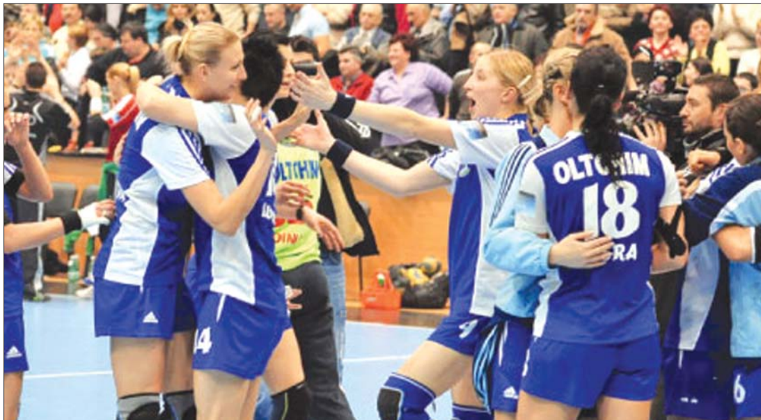
A Râmnicu Vâlcea-i Oltchim holnap utazik Bécsbe, hogy a megkezdje főtáblás szereplését

A férfi élvonalbeli bajnokságban már ma pályára lép a címvédő és egyben listavezető Konstancai HCM, és 16 órától a Temesvári Polit látja vendégül a 15. fordulóban. Holnap Szatmárnémeti–Bákó összecsapás lesz 17 órától, míg szombaton Steaua–Székelyudvarhely (13 óra, DigiSport ), Tg. Jiu–Resicabánya (17 óra), Nagyvárad–Suceava (17.30 óra) találkozók szerepelnek a programban. A Brassó–Dinamo meccset vasárnap 11 órától rendezik. ◀