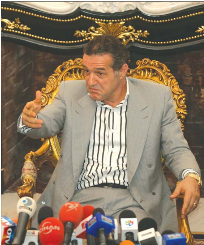
George Becali 1,7 millió eurója zárolva marad

A Legfelső Semmítő- és Ítélszék tegnap március harmadikára napolta el a tárgyalást. ◀