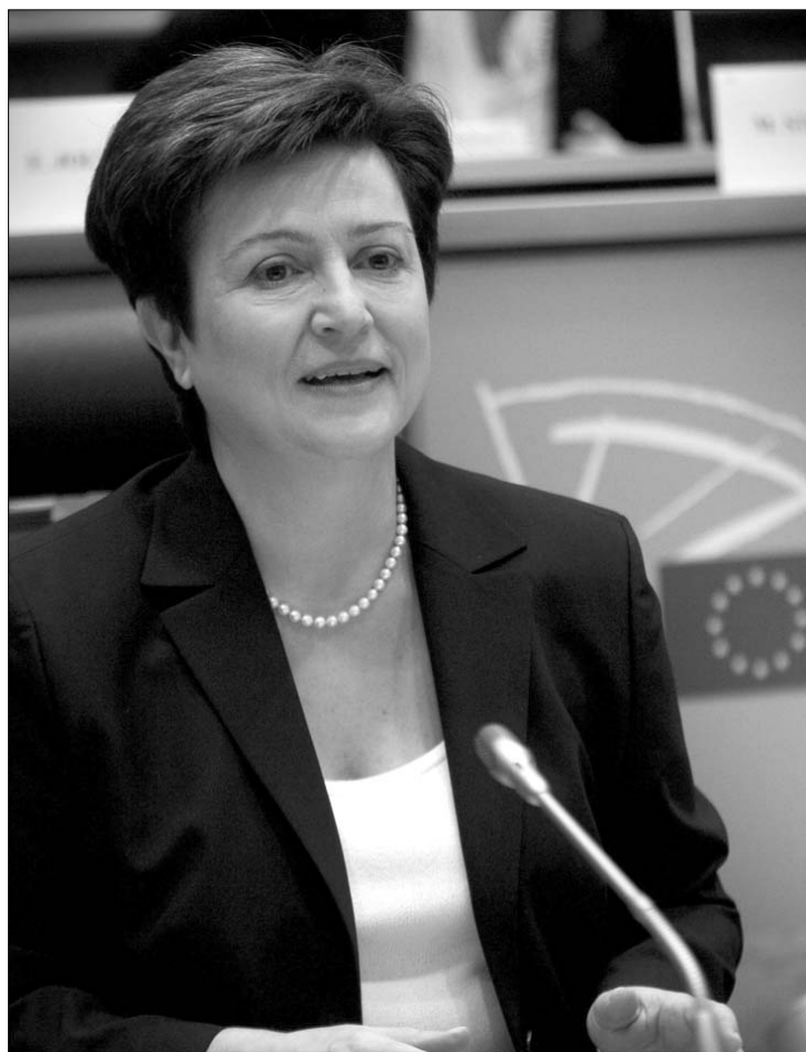
Krisztalina Georgieva meggyőzte alkalmasságáról a képviselőket

bourgban szavazhat az új bizottság egészéről. Mivel a többi 25 jelölt kinevezését az EP – elvben – már régebben elfogadta, szinte bizonyossá vált, hogy a portugál José Manuel Durao Barroso vezette második testület jóváhagyást nyer a szavazáson. A jóváhagyás aránya ugyanakkor kérdéses, mert az egyes frakciók a meghallgatások lezárulása után hagyják végső döntésüket. ◀