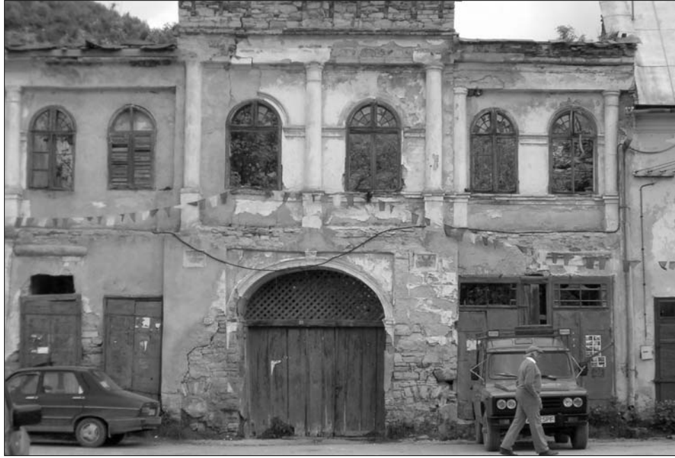
Verespatak egyelőre az ígért földje marad a Rosia Montana Gold Corporation vállalatnak

okoz szerinte a tőkeemelés mértéke is, hiszen jóval nagyobb összegről van szó, mint amekkorára a felszámolás megakadályozása miatt szükség lenne, ennyiből akár a bányászat elindítására is kitelik. Ráadásul nem tőzsdei cégek esetében – folytatta nyilatkozónk – az államra jutó tőkerész harminc százalékának a befizetése is elegendő lett volna, amennyiben a fennmaradó részt a következő három éven belül letétbe helyezik. Nem lehet tudni, hogy hitelező és hitelezett egymás között miben állapodott meg, ki vállalta a kockázatot arra az esetre, ha a Minvest nem tud fizetni, az ügylet azonban az államot kényszerpályára küldené. A szakember úgy látja, hogy nincs veszélyben az RMGC, ugyanis ha valaki kezdeményezné is a felszámolását (erre van is esély), mire az megvalósulna, újabb közgyűlést hívhatnának össze és megvalósíthatnák a tőkeemelését. „Összetett az iratanyag, nekem is nehéz volt megérteni... Kissé bonyolult kérdéstről van szó” – mondta a témában Dragoş Tănase az internetes beszélgetés során. És ez nem vitás. Többször hangsúlyozta, hogy az állam érdekeltsége a projektben nem csökken tovább (az eredeti harminc százalékról 19 százalékra módosult korábban). A Bursa című lap információi szerint, a zavaros tőkeemelési eljárással 19-ről 0,6 százalékra zsugorodhat az állam súlya a projektben, de ezt nyilatkozónk nem tudták megerősíteni. ◀