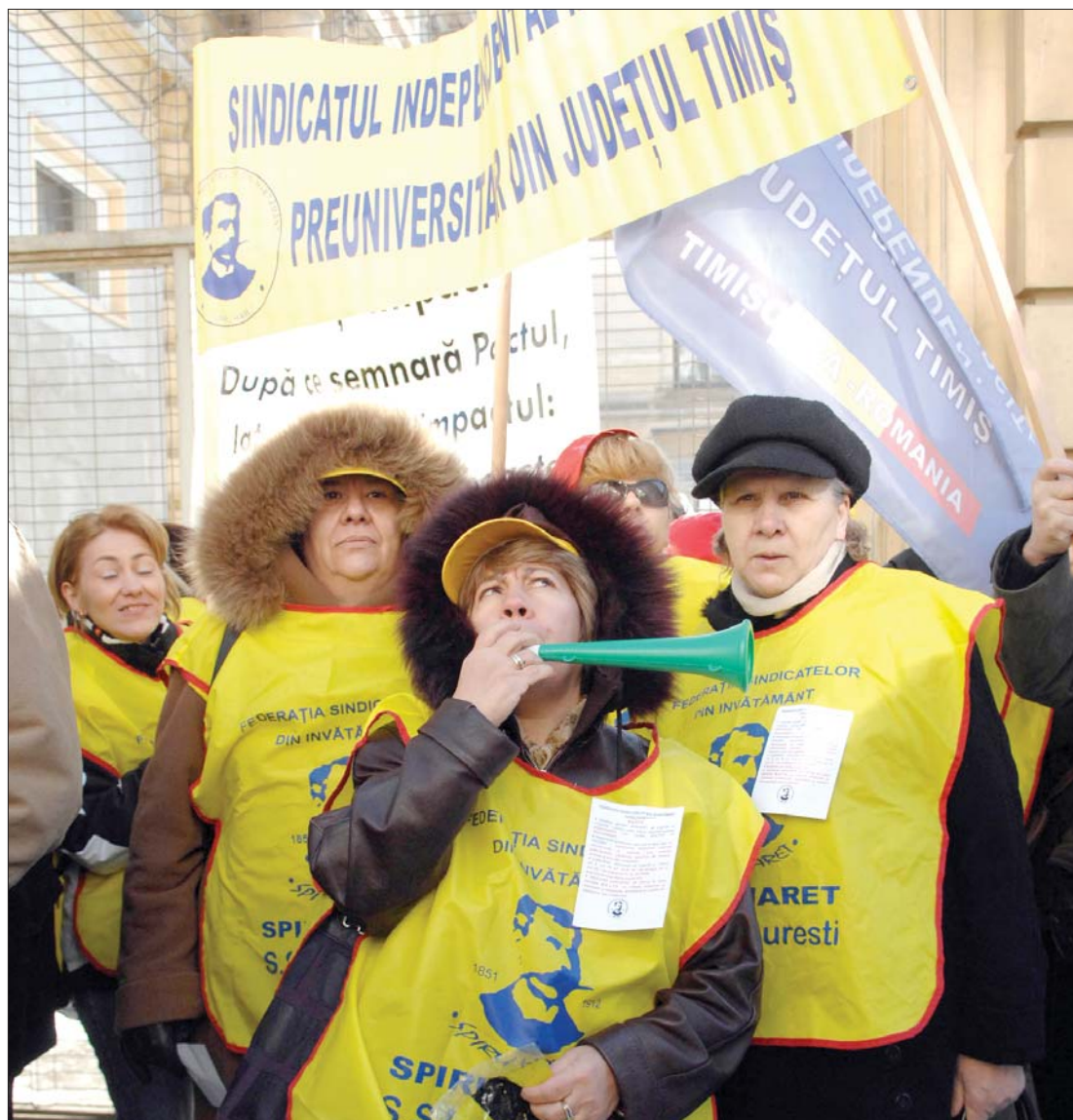
A tegnapi akció csupán sztrájkórság volt, hamarosan utcai megmozdulások következhetnek