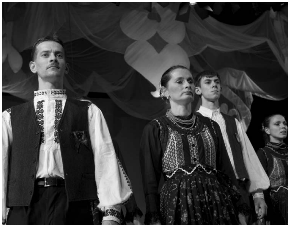
A Háromszék Táncegyüttes Bőjtől bőjtig című táncelőadásával indul turnéra

A heti rendszerességgel jelentkező táncházat február 13-án, szombaton a farsang szellemében szervezik meg Sepsiszentgyörgyön is. Az érdeklődőket a Városi Művelődési Házba várják, ahol a Háromszék Táncegyüttes ze-