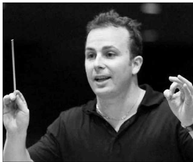
Yannick Nézet-Séguin dirigálta Kurtág György művét

Az 1975-ben Montréalban született Yannick Nézet-Séguin számára kihívást, egyszerűsége nagy megtiszteltetés is jelent, hogy Salzburgban ez utóbbit dirigálhatta.