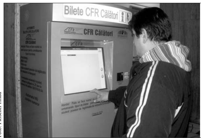
Gyorsan jut jegyhez az, aki automatából vásárol menetjegyet

A következő három héten az automatába betáplálják az utazási költségeket – jövet-menet jegyárak, csoportos utazások – illetve, a hálófülkék foglalási rendszerét. Ha az automata jól vizsgázik, akkor a tervek szerint, az ország nagyobb városaiban további tíz hasonló gépet szerelnek majd fel. „Mégvár-