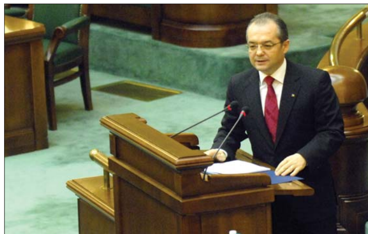
Tegnap a szenátusban, ma a képviselőházban szólal fel Emil Boc

között a soron következő parlamenti ülészakban – mondta el tegnap szenátusi felszólalásában Emil Boc miniszterelnök. 3. oldal ▶