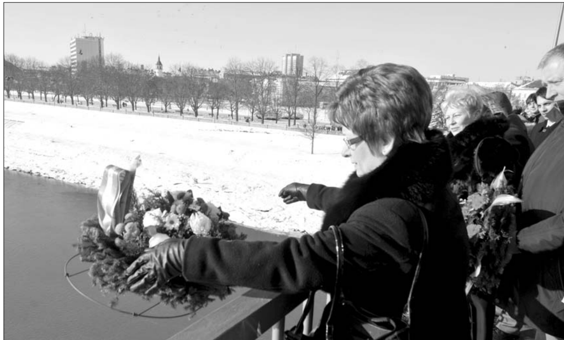
A megemlékezésen koszorúkat helyeztek a vízre, hogy így üdvözöljék az azóta ismét életerős Tiszát

A budapesti Országgyűlés február elsejét a 2000 júniusában hozott határozatával nyilvánította a Tisza élővilágának emléknapjává. ◀