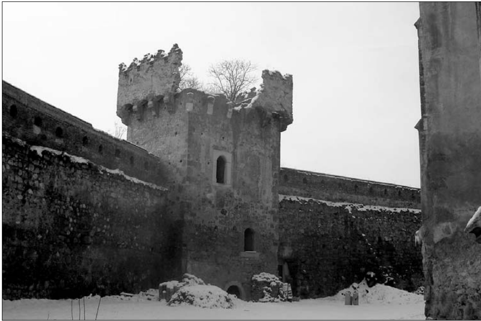
A nagyenyedi vár állapota folyamatosan romlik: leomlott a Szűcsök bástyaszegélyének tartópillére is

Az utóbbi években több tucat államosított ingatlan, nemesi udvarházat és kastélyt árusítottak ki Fehér megyében. Anyagi fedezet hiányában a megyei hatóságok csupán egy parasztházat tudtak megvásárolni a Nagyenyedi Történelmi Múzeum számára. Az illetékek elmondása szerint a visszaszolgáltatót államosított épületeket, sok esetben műemléknek nyilvánított ingatlanokat, később tulajdonosuk adta el. „Történel-