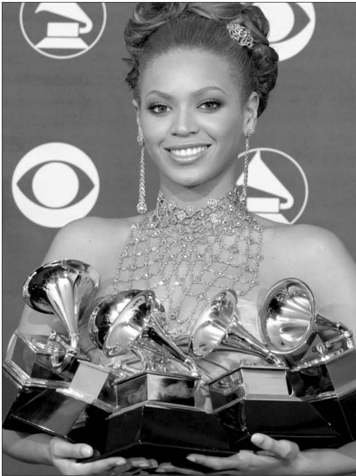
Az 52. Grammy-gálán bezsebelt hat díjjal Beyoncé zenetörténelmet írt

A legjobb felvételért járó díjat a Kings of Leon rockegyüttes romantikus ódája, a Use Somebody kapta – az együttes összesen három díjat zsebelt be. „Nem akarok hazudni, egy kicsit mind be-