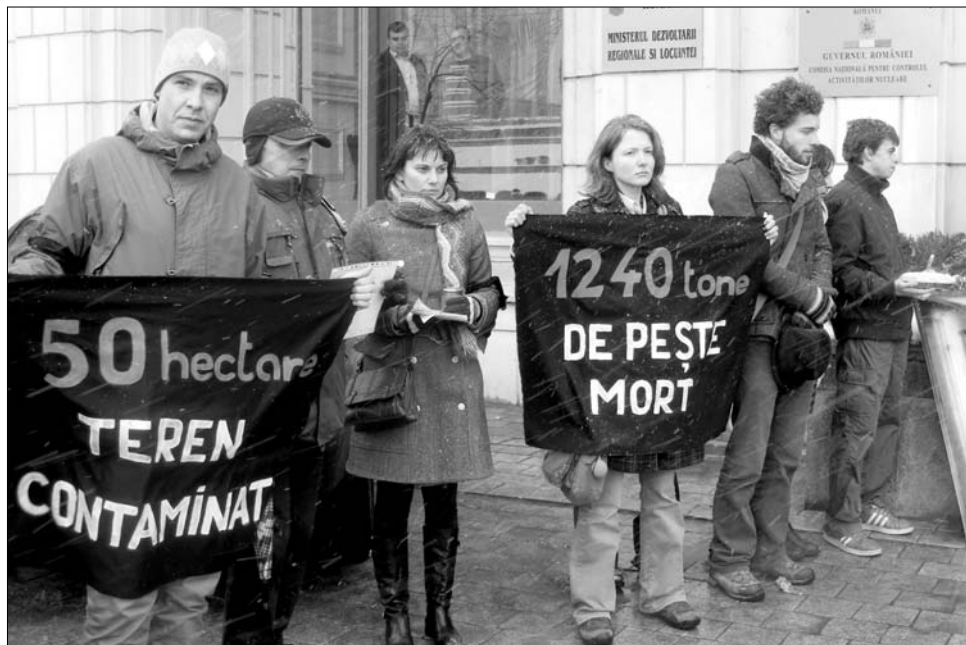
Egyértelmű üzenetekkel vonultak tegnap Bukarestben a szaktárca elé a környezetvédők.

Az akciót szervező Salvați Delta Dunării (Mentsük meg a Deltát) szervezet tagjai a minisztérium elé egy fekete zászlót is kifeszítettek. „Hiába haltak meg” felirattal, a