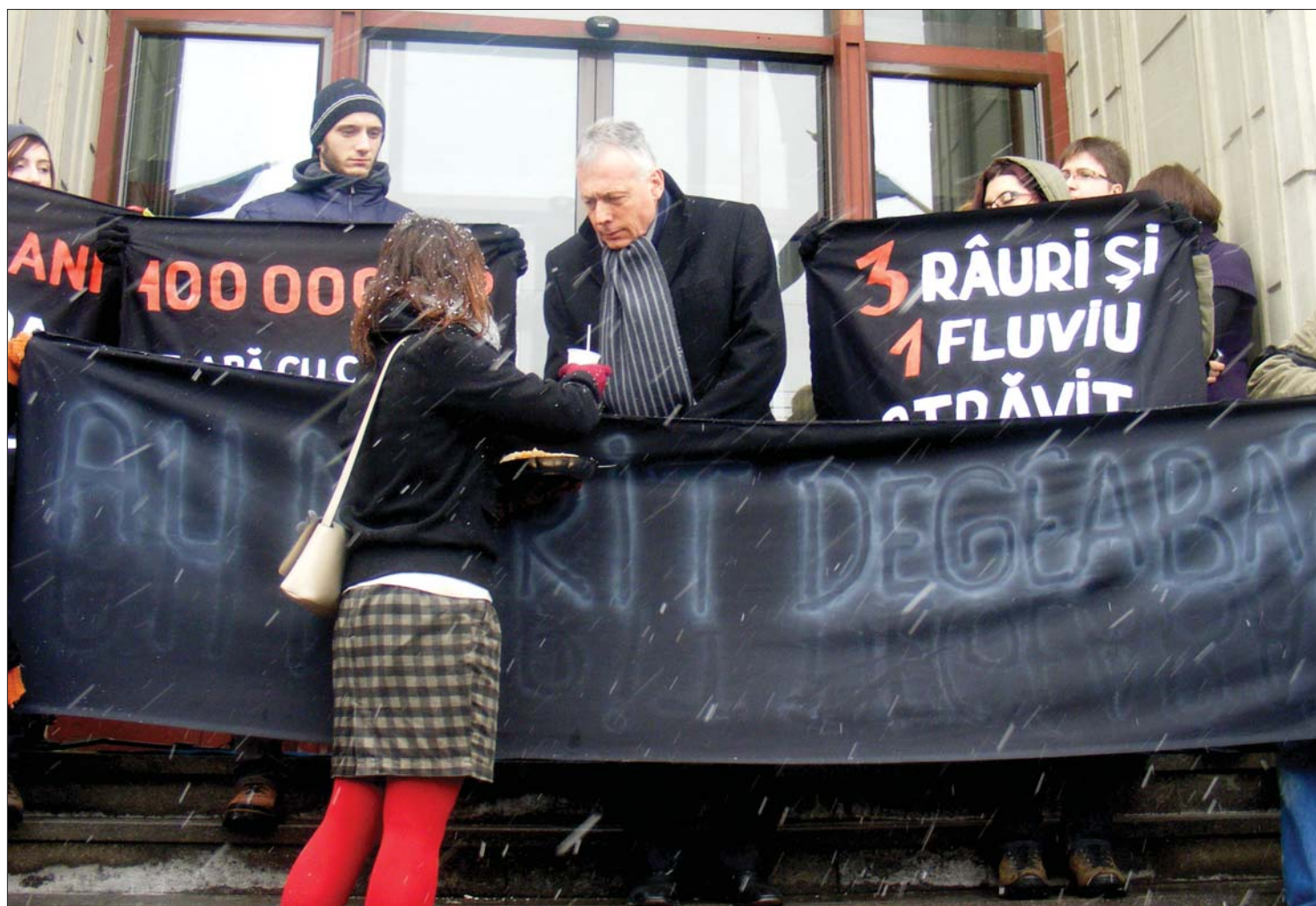
Egyértelmű üzenetek a tiltakozók tábláin: „1240 tonna elpusztult hal!”, illetve „Három folyót és egy folyamot mérgezték meg!”

Romániában és Magyarországon is megemlékeztek a nagybányai szennyezésről