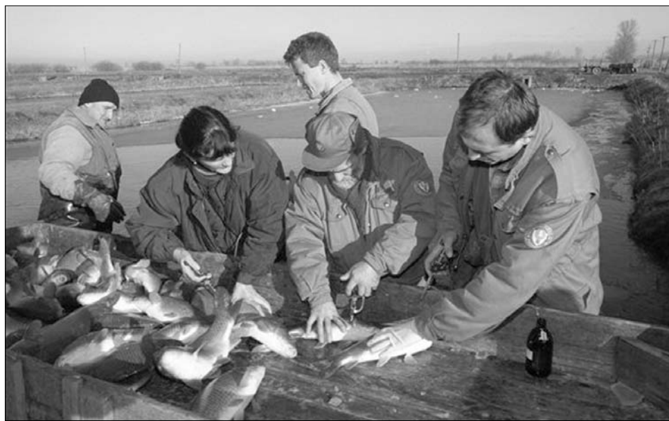
A környezeti katasztrófa nyomán a Tisza érintett szakaszain minden halfaj állománya sérült.

Magyarország a cian-szennyezés miatt 29,3 milliárd forintos kárigényt jelentett be, amely az élővilágot ért károkat és ezek helyreállítási költségeit is tartalmazta. Románia az Aurul tette felelőssé a környezeti katasztrófaért, az ottani vizsgálat szerint a katasztrófát „előre nem látható körülmények” okozták. A magyar állam 2001-ben kártérítési pert indított az Aurul ellen, mivel az nem válaszolt a peren kívüli meg egyezés iránti ajánlatra. Az elhúzódó perben 2006-ban a Fővárosi Bíróság közbenső ítéletként kimondta, hogy a ciankatasztrófaért az Aurul jogutódját, a Transgold céget terheli a felelősség. A per még ma sem zárult le, a román felelősök között megtesznek a felelősségre vonás elkerüléséért, főleg miután az ausztrál tulajdonos minden kártérítés kifizetése nélkül kivonult a cégből. A Transgold tovább folytatta tevékenységét, bár saját állítása szerint jelentős fejlesztéseket végzett a szennyezés visszafogása érdekében. A vállalat 2005-ben csődöt mondott, jelenleg azonban Romalty Mining néven ismét működik, a legnagyobb oroszországi aranykitermelő vállalkozás, a Polyusgold tulajdonában. Az új tulajdonosok a közelmúltban kérték az illetékes román hatóságoktól működési engedélyük megújítását. ◀