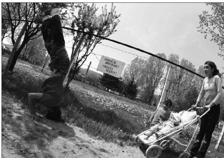
Élet a fertőben. Roma szülő gyerekeivel a szennyvíz-ülepítő szomszédságában