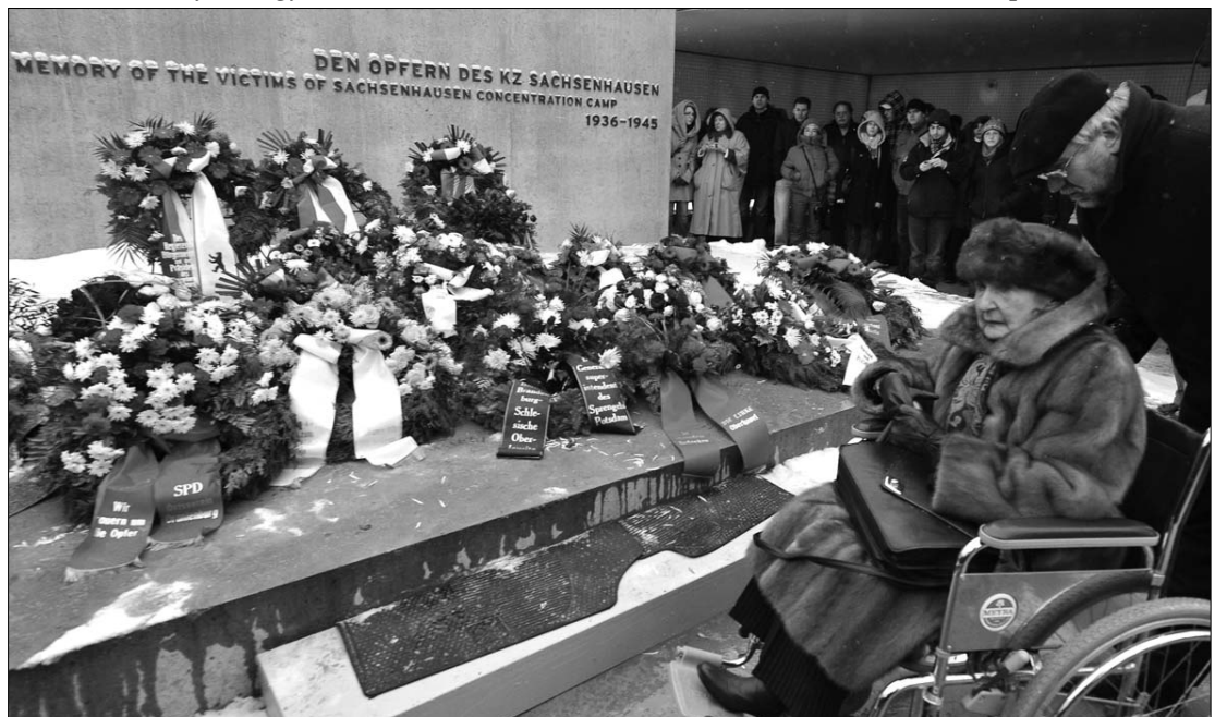
Az auschwitzi megemlékezésen a politikusok mellett a náci haláltábor túlélői is koszorúztak

met parlamentben mondott beszédet. „Olyan jövőről álmodom, amelyben nincs helye a gyűlöletnek, a háborúnak és az antiszemitizmusnak” – jelentette ki Simon Peresz. A Bundestag 1996-ban az akkori államfő, Roman Herzog kezdeményezésére nyilvánította a holokauszt emléknapijává január 27-ét. Izraeli elnök első ízben szólalt fel a németországi holokauszt-emléknapon. ◀