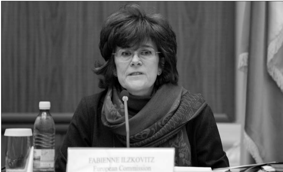
Fabienne Ilkowitz szerint teljesültek a megcélzott makrogazdasági mutatók Romániában

„A kiadásokat a lehetőségekhez kell szabni. Minél többet költ az állam az alkalmazottakra, annál kevesebb marad közberuházásra. Két lehetőség van a kiadások lefaragására: csökkenteni kell a fizetéseket, vagy elbocsátani az alkalmazottakat. A kor-