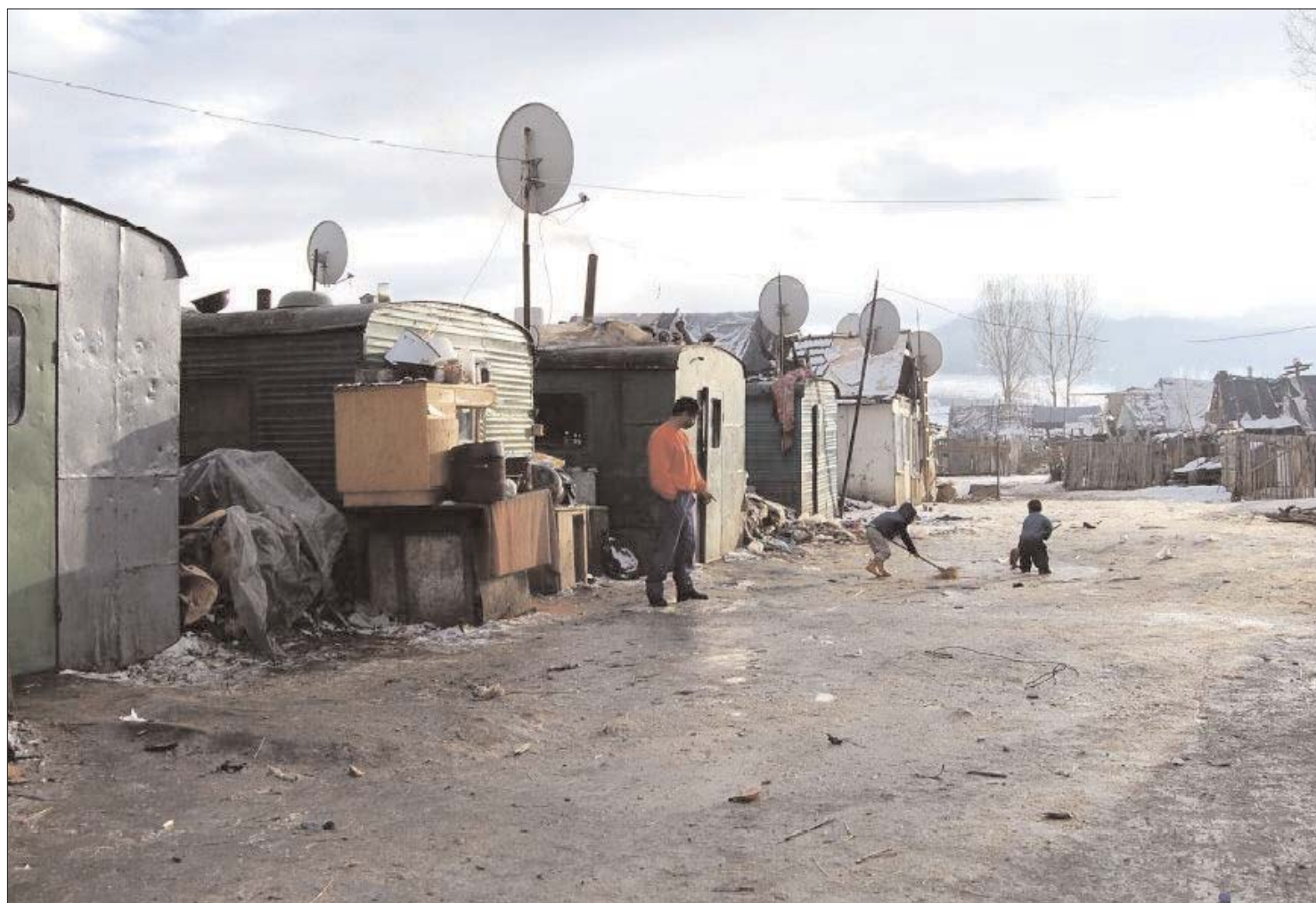
„Szargyári” csendélet. A csíkszeredai városvezetés a helyi szennyvízülepítő mellé, fémbarakkokba költöztetett roma családokat

Faji diszkriminációval vádolják a romákat kitelepítő csíkszeredai önkormányzatot