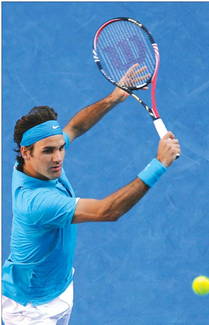
Roger Federer simán intezte el az orosz Nyikolaj Davigyenkót.