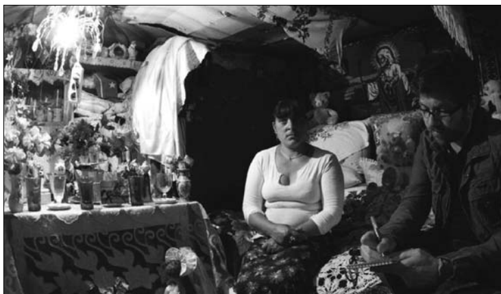
Csendélet a „szargyárban”. Roma házaspár hétköznapjai