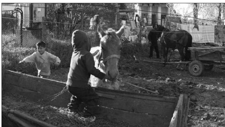
Cigánypurdék és lovasszekér. Ember és állat együtt viseli el a körülményeket