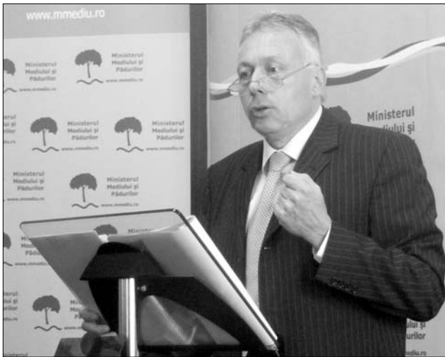
Borbély László: prioritás lesz idén a roncsprogram

► Csigalassúsággal haladtak eddig a munkálatok és projektek a Környezetvédelmi és Erdőgazdálkodási Minisztériumban – fakadt ki tegnap Borbély László, a tárca vezetője. „A minisztérium költségvetése a tavalyi évre nyolcszázmillió lej volt. Ezt az összeget egyáltalán nem használták ki, összesen háromszázmilliót költöttek el, és azt is a környezetvédelmi adókból. Hát mi ez, ha nem nagyon rossz menedzsment?” – fogalmazott Borbély, aki azt is elmondta, hogy a tárca idején vezető projektjei közül a roncsprogram, valamint az európai uniós pénzek lehívása jelent prioritást. „Ezek mellett, fontosnak tekintjük azt is, hogy a környezetvédelmi alapról, olyan új tervek finanszírozásunk idén – erdősítés, a rossz szervezés miatt még mindig be nem indult Zöld ház program –, amelyek új energiákhoz juttatják majd az országot. Itt tavaly minden megállt, remélem, idén a teljes összeget el tudjuk, nyilván hasznosan, költeni” – nyilatkozta lapunknak Borbély.