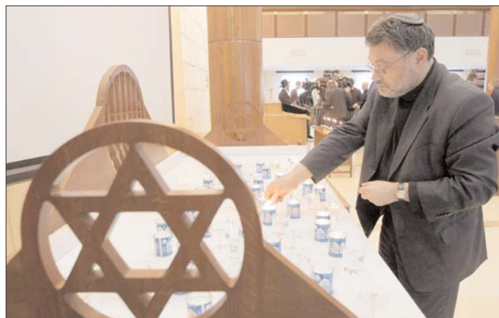
Az auschwitzi láger helyszínén tegnap gyertyák gyújtak

▶ Auschwitz túlélők, politikusok emlékeztek tegnap a auschwitz haláltábor helyszínén a tábor 65 évvel ezelőtti felszabadulásáról, miközben 35 állam kormányzati képviselői a holokausztról kezdtek nemzetközi értekezletet. 2. és 4. oldal ▶