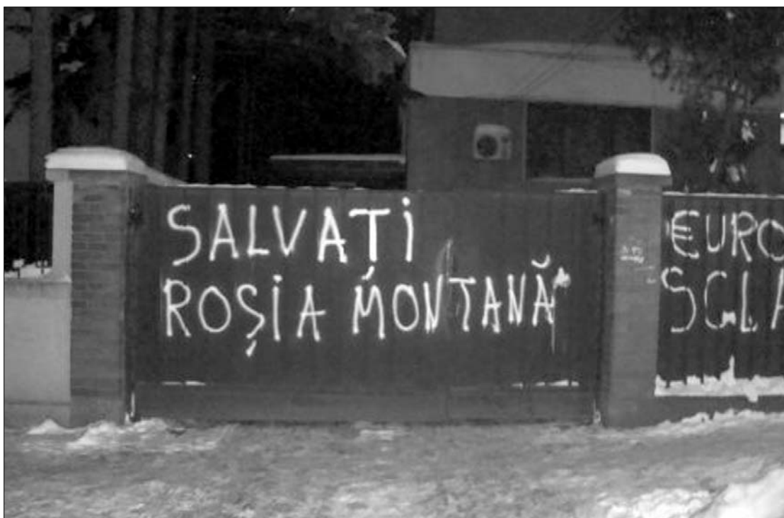
Környezetvédő partizánakció? A PNL bukaresti székháza „bánta” Adina Vălean brüsszeli szereplését

A liberális pártban csalódhattak azok is, akik tegnap hajnalra összefirkálták Bukarestben a PNL központi székházát. „Mentsétek meg Verespatakot!”, „Euro-Vălean, a kanadaiak rabszolgája!” – díszelgett tegnap reggel az alakulat Aviatorilor utcai ingatlanának kerítésén.