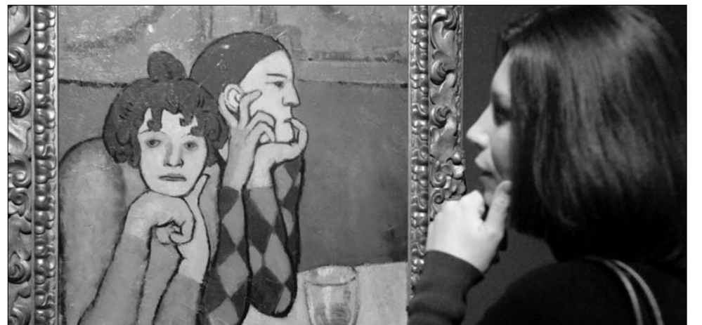
A kiállított munkák a moszkvai Puskin Múzeumból érkeztek

üdvözlöli a látogatót, majd végigsétálva a realizmus, a Barbizoni iskola és az impresszionisták tájképeinek színes világán, eljut Cézanne egészen egyedi ábrázolásához, aki naturalista szemléletével a korábbi folyamatok lezárójának, s mintegy az új elindítójának tekinthető, így tökéletes átvezetés a következő terembe és a modernizmusba. A Ión piramisban Gauguin Tahitin készült csupaszín festményei fogadják a látogatót, majd a szimbolizmus irányzata, a Fauve-ok, vagyis a „vadak” következnek, hogy végül bepillant-hassunk az avantgárd elindulásába is, például Henri Rousseau vagy éppen a két korszakába még nem lépő Pablo Picasso asztalra támaszkodó akrobatáinak segítségével. ◀