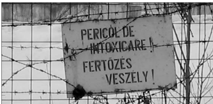
A fertőzésveszélyre figyelmeztető tábla az ott lakókra nem érvényes...