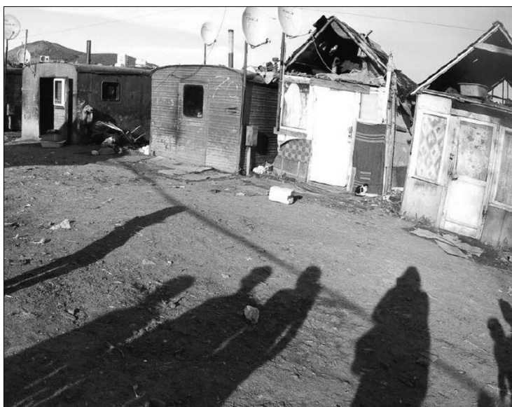
Melyik a legvidámabb barakk? A tákolmányok roma családoknak adnak otthont