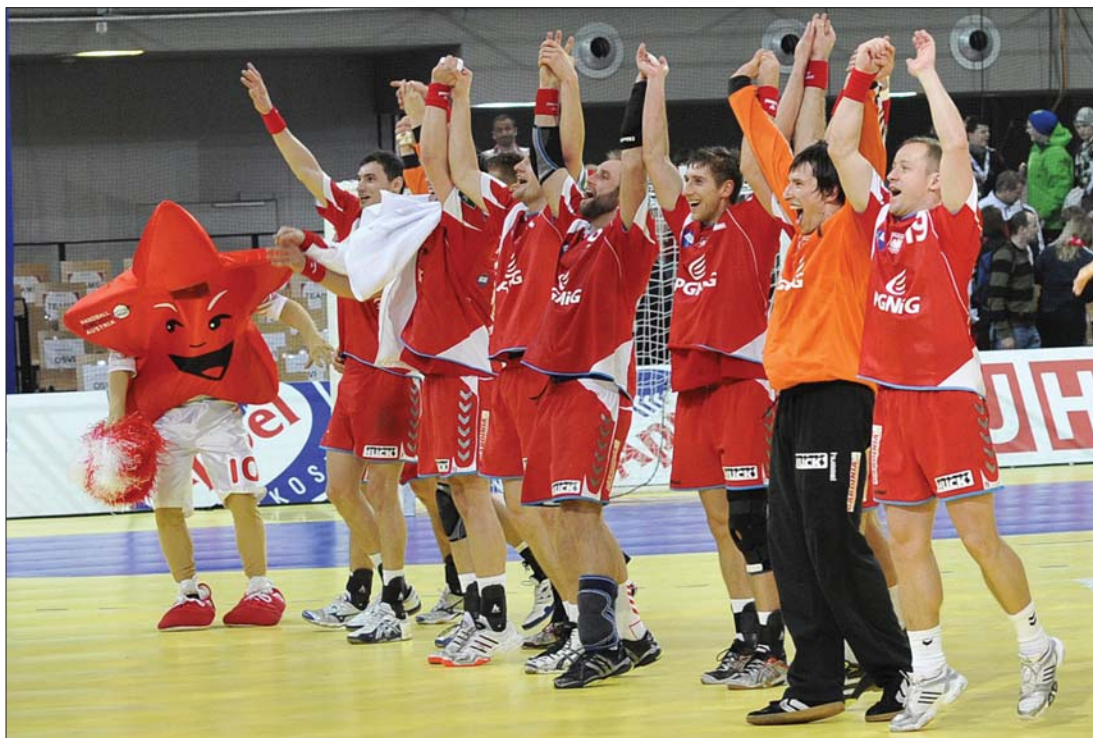
A lengyel kézis fiúk a középdöntő keddi játéknapján hatalmas csatában 35-34-re nyertek a cseh csapat ellen

(6p, 128-115), Dánia (6p, 113-107), Norvégia (4p), Ausztria (1p) és Oroszország (0p) előtt, a norvég-izlandi és horvát-dán összecsapások döntenek a két elődöntős felől. ◀