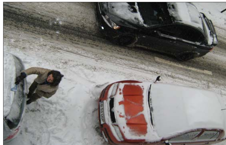
A második nagy havazás is „meglepte” a hatóságokat.

is. Tegnap több település maradt áram nélkül, és utak váltak járhatatlanná, a közlekedést a viharos erejű szél is nehezítette. 2. oldal ▶