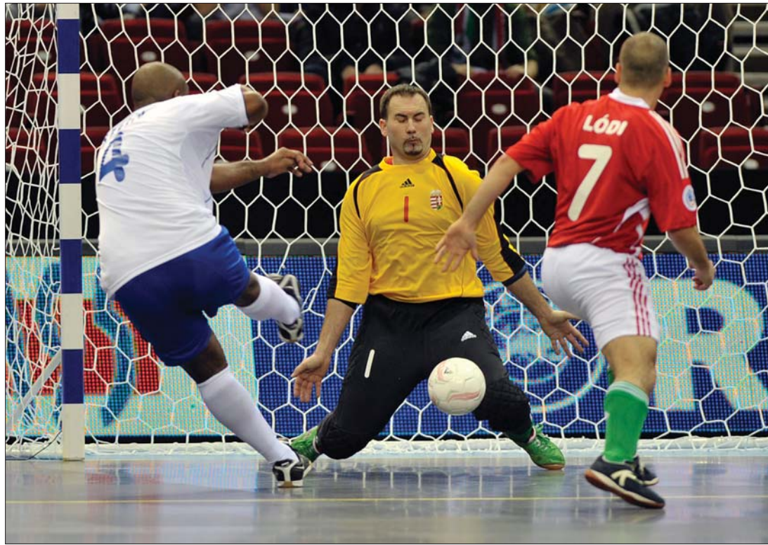
Kötény. Az egyik „azeri brazil” csatár éppen az exszovjetek három góljának egyikét lövi a magyar kapuba

A magyarok tegnap este 3-1 arányban vereséget szenvedtek a honosított brazilokkal felálló azeriekkel szemben; Kozma Mihály szövetségi kapitány játékosai szombatán a csehekkel játszanak. Kozma eredetileg a legjobb nyolc közé várta csapatát. ◀