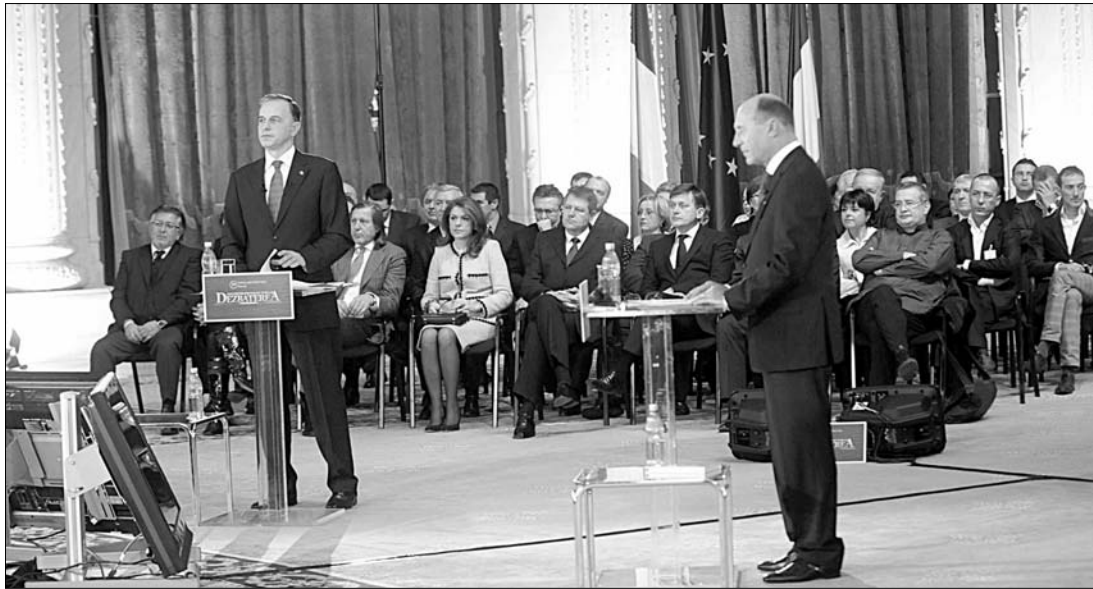
Mircea Geoană szerint a választási kampányt záró tévétán Traian Băsescu paranormális erők segítségét vette igénybe

Ironikus hangvételű nyilatkozatban szólította fel tegnap az Active Watch Médiafigyelő Ügynökség (AMP) a hazai médiát, hogy hagyja abba a nagyközönség félrevezetését, ne töltsön meg műsoridejét, újságoldalait paranormális erőkről szóló anyagokkal, ne szegje meg nézettségének, olvasottságának növelése érdekében a szakmai és etikai szabályokat. A médiafigyelő ügynökség gesztusát az váltotta ki, hogy a hét elején Mircea Geoană, a tavalyi államfőválasztáson alulmaradt szociáldemokrata jelölt bejelentette: a választási kampány során, illetve az azt záró televíziós vitán Traian Băsescu jelenlegi államelnök paranormális erők segítségét vette igénybe második mandátuma elnyerése érdekében. Ennek kapcsán a hazai sajtót előzőlötték az ország „energetikai megtámasztásáról” szóló hírek, és több, a média által közvetített demagóg szónoklat hangzott el Románia megmentéséről, energetikai önállósodásáról. A hírt a külföldi média is azonnal felkarolta, ami a sajtóegyesület szerint még nevetesebbé teszi az amúgy sem a legjobb nemzetközi megítélésű Romániát.