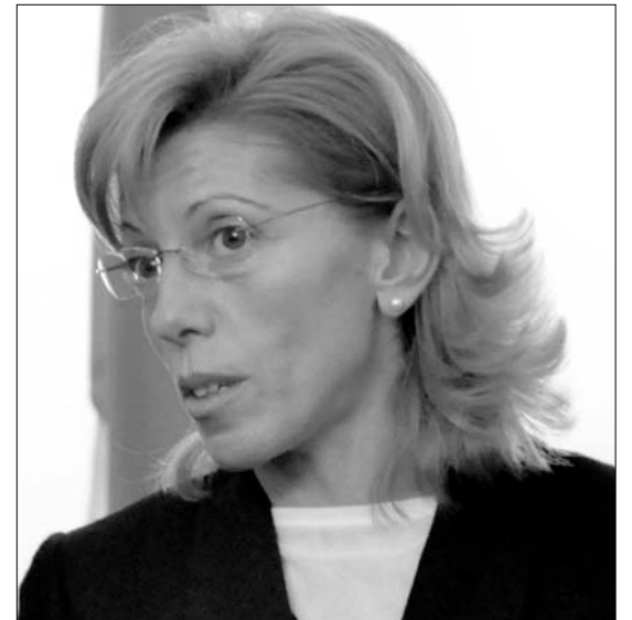
Az új bolgár EU-biztosjelölt, Krisztalina Georgieva a visszalépett Rumjana Zseleva helyére „került képbe”

Európai Bizottságot mielőbb létre kell hozni.