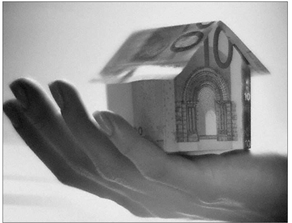
Míg egy évvel ezelőtt szinte lehetetlen volt kölcsönhöz jutni, mára a bankok szinte tálcán kínálják azt

Kérdésünkre, hogy meddig folytatódhat a kulcsok