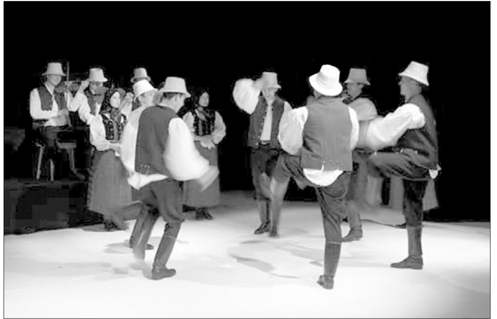
A Hol jársz, hová mész? című táncelőadás Kádár Kata balladájára épül

Ezzel azonban még korántsem ért véget az előadá-