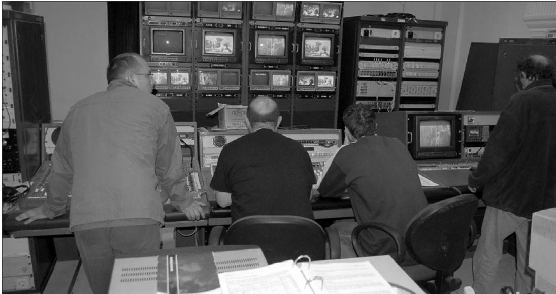
A román köztvév évek óta veszteségesen működik, az állam pedig évről évre egyre jobban támogatja

A Román Televízió Társaság (SRTV) idén 13,5 százalékkal több pénzt kért a kormánytól, annak ellenére, hogy jó ideje veszteségesen működik. Az intézmény utolsó nyereséges éve 2005-ben volt, akkor 8,9 millió eurót „termeltek”. Ezzel ellentétben például a franciaországi France Télévision tévétársaság – mely négy országos tévécsatornát és egy nemzetközi rádióadót működtet – a válság ellenére is nyereséges, akárcsak Nagy-Britannia köztvévéje. A Variety című magazin nemrég arról számolt be, hogy a francia köztelevízió 2009-ben 393 millió eurós reklámbevételt könyvelt el, ami 51 százalékkal túl a társaság szakembereinek a számításait. Mindez azért is tekinthető óriási sikernek, mert Franciaországban 2009. január elsejétől ti-