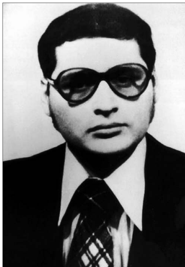
A Szudánban elfogott terrorista, igazi nevén Ilich Ramirez Sanchez

A sikeren felbuzdulva a nyolcvanas évek végéig merényletek egész sorozatát követte el a világ több országában. „Virágkora” Szudánban ért véget, ahol 1994. augusztus 14-én letartóztatták és átadták a francia hatóságoknak. ◀