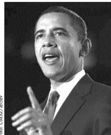
Barack Obama amerikai elnök