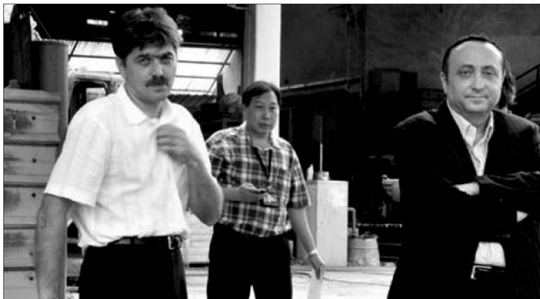
Silviu Ionescu (jobbra) állítólagos tettét már nem csak a szingapúri, hanem a román hatóságok is vizsgálják

Az eset nagy port vert fel a távol-keleti városállamban, annál is inkább, mert a diplomata mentelmi jogot élvez. A helyi sajtó azon háborgott, hogy a szingapúri rendőrség a mai napig nem tudta kétségeket kizáróan feltárni a baleset körülményeit. ◀