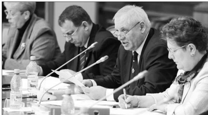
A szakbizottságban tartózkodott tegnap a szavazástól az RMDSZ

A társadalombiztosítási költségvetést módosító indítvány a magyarok nélkül is átment a munkaügyi bizottságon, de kérdés, mi lesz a sorsa a végső szavazáson. 6. oldal ▶