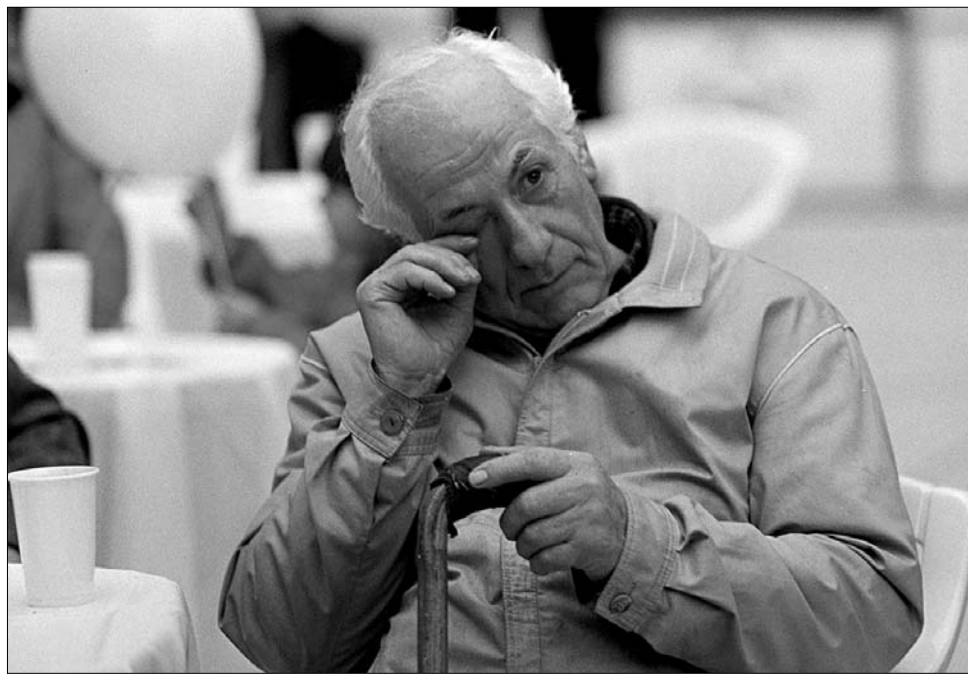
Aggódó idősek. Vajon megszavazza-e a plénum is a száz lejes nyugdíjpont-emelést?

Emil Boc kormányfő a munkaügyi bizottság által hozott nyugdíjemelési határozattal kapcsolatban elmondta, hogy a költségvetéstervezet jelen pillanatban nem tudja finanszírozni a többletet. Így egyelőre még kérdéses, hogy az idős embereknek kedvező módosító indítvány érvényre jut-e a költségvetési bizottság ülését követően, a büdzséről történő végső szavazáson a plénum előtt január közepén. Elemzők szerint sincs keret a százalékos nyugdíjpontnövelésre, már így is másfél milliárd eurós hiánnyal küszködik a nyugdíjalap. ◀