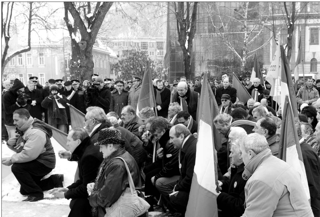
Forradalmi megemlékezések Brassóban. A hozzátartozók nem tudják, kik voltak az áldozatok gyilkosai.

Kereken húsz évvel ezelőtt, december 22-én a kora reggeli órákban hatalmas munkástömegek indultak meg Bukarest központja felé, áttörték a rendfenntartó erők kordonjait (több katona átállt a felkelők oldalára), és a kommunista pártszékház előtti teret ellepték a tüntetők százezrei. A téren ünnepi hangulat lett úrrá, a tömeg behatolt a pártszékházba; Mircea Dinescu és Ion Caramitru az időközben a tömeg által szintén elfoglalt román televízió épületében bejelentették a diktátorpár elmenekülését, a népi felkelés győzelmét. ◀