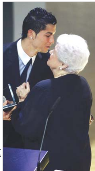
Ronaldóé a Puskás-díj

a mai fiatalságnak. A magyar Aranycsapat három évvel ezelőtt elhunyt legendás Puskás Öcsijéről elnevezett díj átadásán jelen volt Bajnai Gordon miniszterelnök, Orbán Viktor, a Puskás Ferenc Akadémia alapítója, továbbá Kisteleki István, a Magyar Labdarúgó-szövetség elnöke is. Bajnai és Kisteleki amúgy még a gála előtt külön megbeszélést tartott Blatterrel, miután a miniszterelnök kijelentette: „Nemcsak a magyar emberek, de Magyarország is képes lehet világszínvonalú teljesítményre hittel, szorgalommal, kitartással és jó értelemben vett vagánysággal. És nemcsak futballban, hanem élet más területein is. Puskás mai napig példaként szolgál a fiataloknak.”