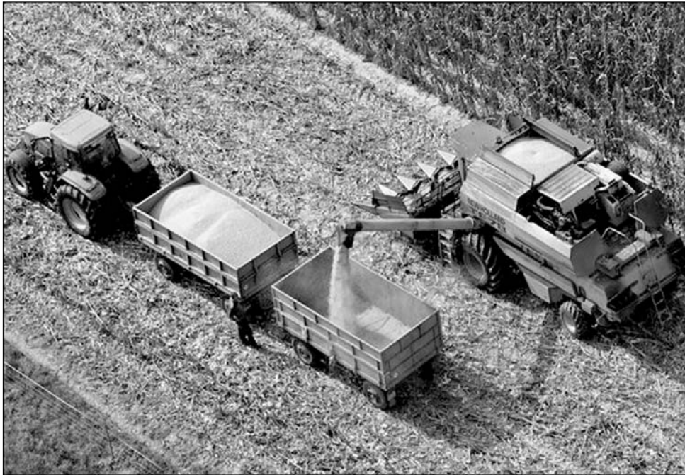
Miközben Magyarországon tilos külföldieknek földet venni, egyre több olasz „telepes” érkezik Romániába Feldarabolt földek

► „Ha így megy tovább, legtöbb napszámosként dolgozunk saját földjeinken, s ráadásul olyan embereknek, akikkel csak tolmacsokkal érthetjük meg magunkat” – mondta az ÜMSZ-nek egy szamosdobi gazda, azzal kapcsolatban, hogy községük határának már legalább negyede, mintegy öt-hatszáz hektár külföldiek kezében van. A helyzet e pillanatban még nem ennyire „tragikus”, mint a példából következne, de tény: a Bán-ság és a Körösök vidéke után Szatmárt is elérte az olasz „területhódítás”. A megyei szakigazgatóság adatai szerint a külföldiek által felvásárolt mintegy hétezer hektár termőföldnek (a művelhető terület öt-hat százaléka) nagyobb része olasz vállalkozók tulajdonában van. Utánuk a németek és osztrákok vásároltak a megyében nagyobb területeket. A legjobban Nagykároly környékén – ott is elsősorban a Szatmárnémeti–Nagyvárad közti műút, illetve az országhatár közelében – elhelyezkedő földterületek „kérőinek” kell a zsebükbe nyúlni, itt 15 ezer eurót is adhatnak egy hektárért, csak nem sokan kínálják. Legolcsóbban (két-három ezer euró) a nehezebben megközelíthető Bükkvidéken juthatnak földhöz a vevők. Eközben Magyarországon egy 2011-ig érvényben lévő moratórium szerint külföldieknek egyenesen tilos a földvásárlás, amelyet Jakab István, az ot-tani gazdaszervezet elnöke – egyben fideszes parlamenti képviselő – az MTI által tegnap kiadott hír szerint meghosszabbítana.