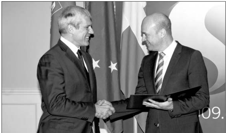
Boris Tadic szerb elnök és Fredrik Reinfeldt svéd kormányfő.

Bildt úgy vélte, a következő – „spanyol”-félévben döntő haladást lehet elérni a Horvátországgal folytatott csatlakozási tárgyalásokon. Ugyancsak haladásra számolt a külügyminiszter a török, az izlandi és a macedón csatlakozási folyamatban, míg Szerbia kapcsán leszögezte, hogy az EU kész fogadni a csatlakozási kérelmet. ◀