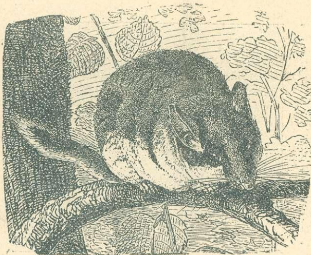
3-ik ábra. KERTI PELE.

( Eliomys puercinus L. = Myoxus nitela Schreb.). E két faj úgy a testnagyság s az egész külső, mint az életmód tekintetében is közel áll egymáshoz. Kisebb testnagyságuk folytán, daczára, hogy ezek is részint mókus-, részint egéralakok, az egértipushoz már közelebb állanak.