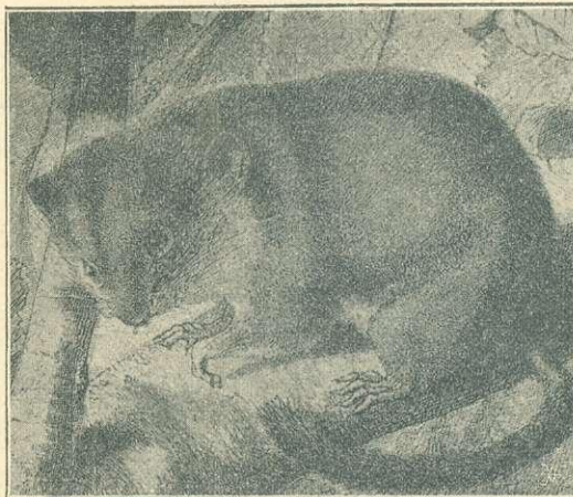
4-ik ábra. MOGYORÓS PELE. Müller A. rajza.

A kerti pele jellemző tartózkodó helyei a dombvidékek fiatal lomberdei s cserjés helyei; megfordul az ilyenek közelében elterülő gyepükben, kertekben,