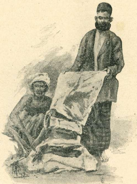
A „tampi“ (Ferguson nyomán).

Délután 3 órakor a bungalow felé három ember közeledett. Azt hittük eleinte, hogy a környékbeli tanítók megint hoznak valamit. A tamil rendesen harmad, negyed, ötödmagával, de egymagában sohasem szokott beállítani, még akkor sem, ha csak egyetlen bogárról, vagy lepkeről volt is szó. Egy ízben öten tisztelegtek. Meglehetősen távol vidékről jöhettek s az egyik kezében egy közönséges élő fehér lepke kalimpászott, míg a többi üres kézzel a baksist várta. Egy más alkalommal szintén öten jöttek, amikor pedig egy pálczikához hurkolt gyíkkal kedveskedtek. Az ilyen látogatókhoz hozzá voltunk már szokva s a közelgő három embert is hasonló járatú tanulóknak