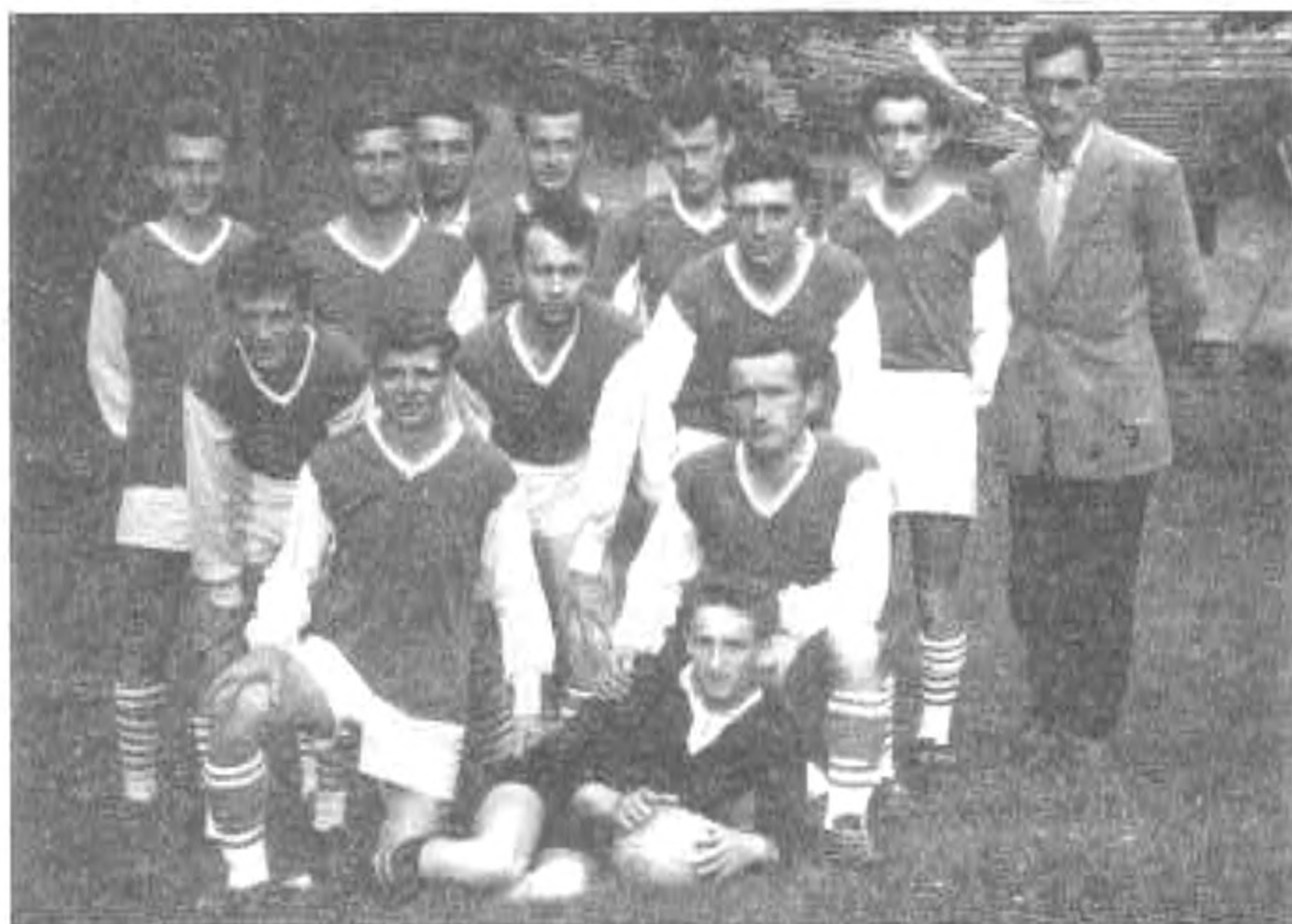
1961. június 11. Hunyadi - Békési S. 1:1