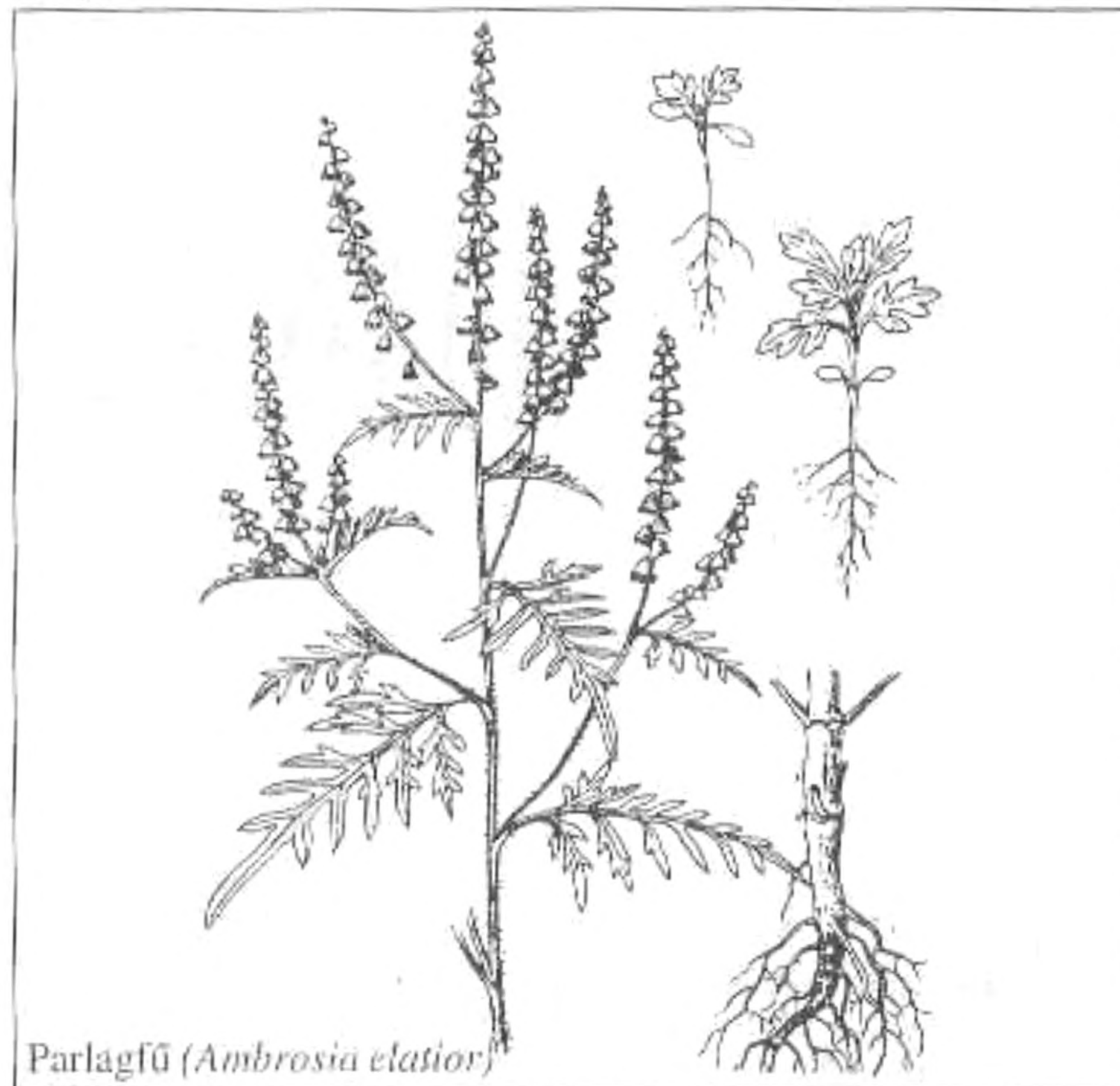
Parlagfű ( Ambrosia elatior )

az Állami Népegészségügyi és Tisztiorvosi Szolgálat Békés Megyei Intézete