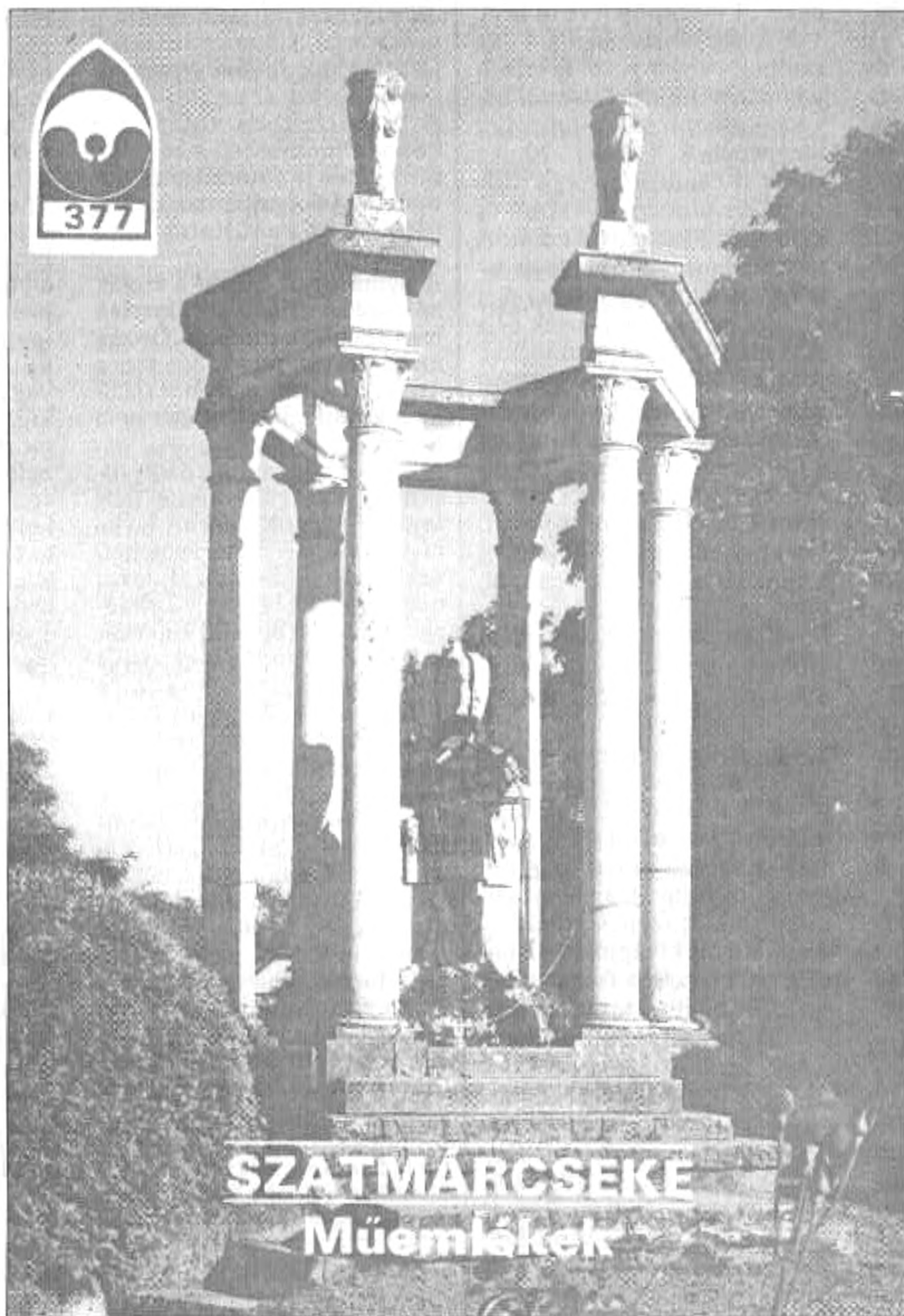
Kölcsey Ferenc síremléke a szatmárcsekei temetőben

hasonlóról is beszámolnak. A Túr vize 3 vízkereket hajt, ezek a malmot működtetik, mely óránként 2 q búzát tud így megőrölni. Az európai hírű ipari műemlék környéke szépen kialakított pihenőhely, padokkal, asztalokkal. A közeli panzióban megszállhatunk, ahol a táj konyháját is megismerhetjük az itt lakók jóvoltából. A falu iskolájába járt Móríc Zsigmond, aki