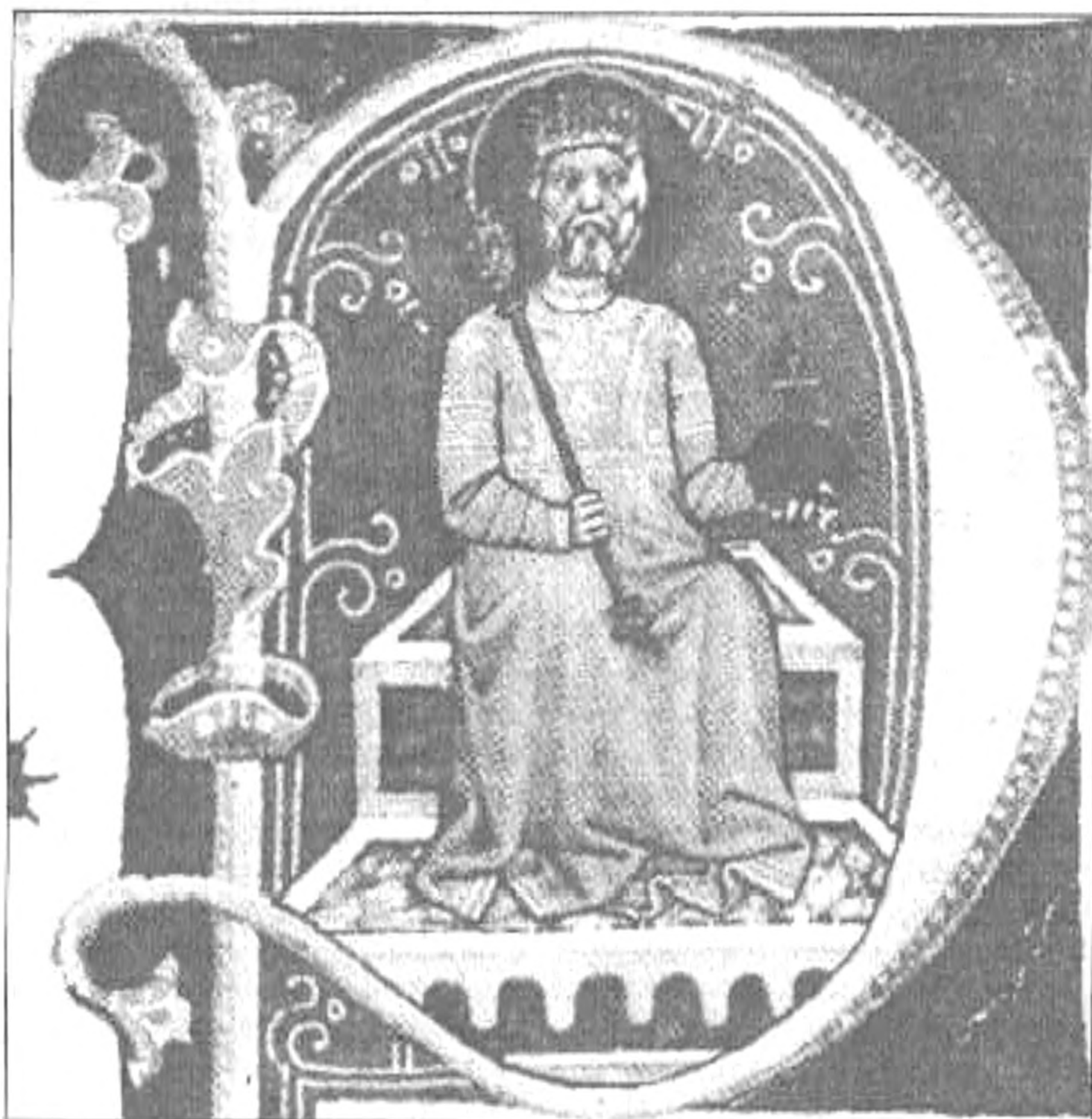
Az öreg István király