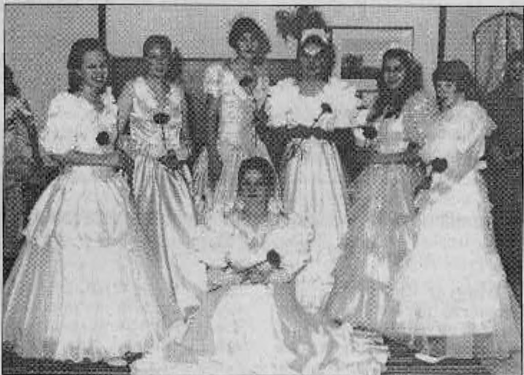
A „hölgyek” egy csoportja