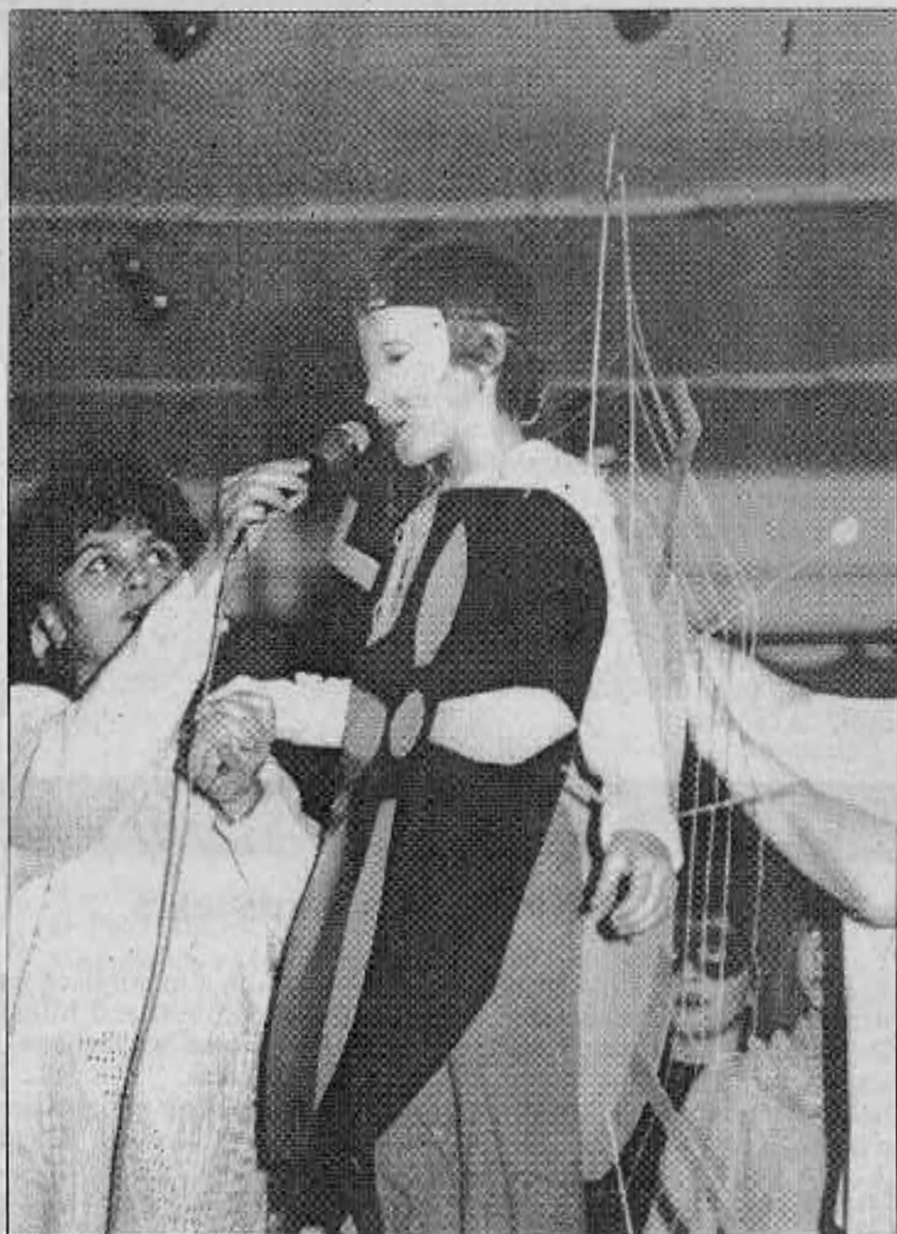
Keresztspók - Lénárt Anikó