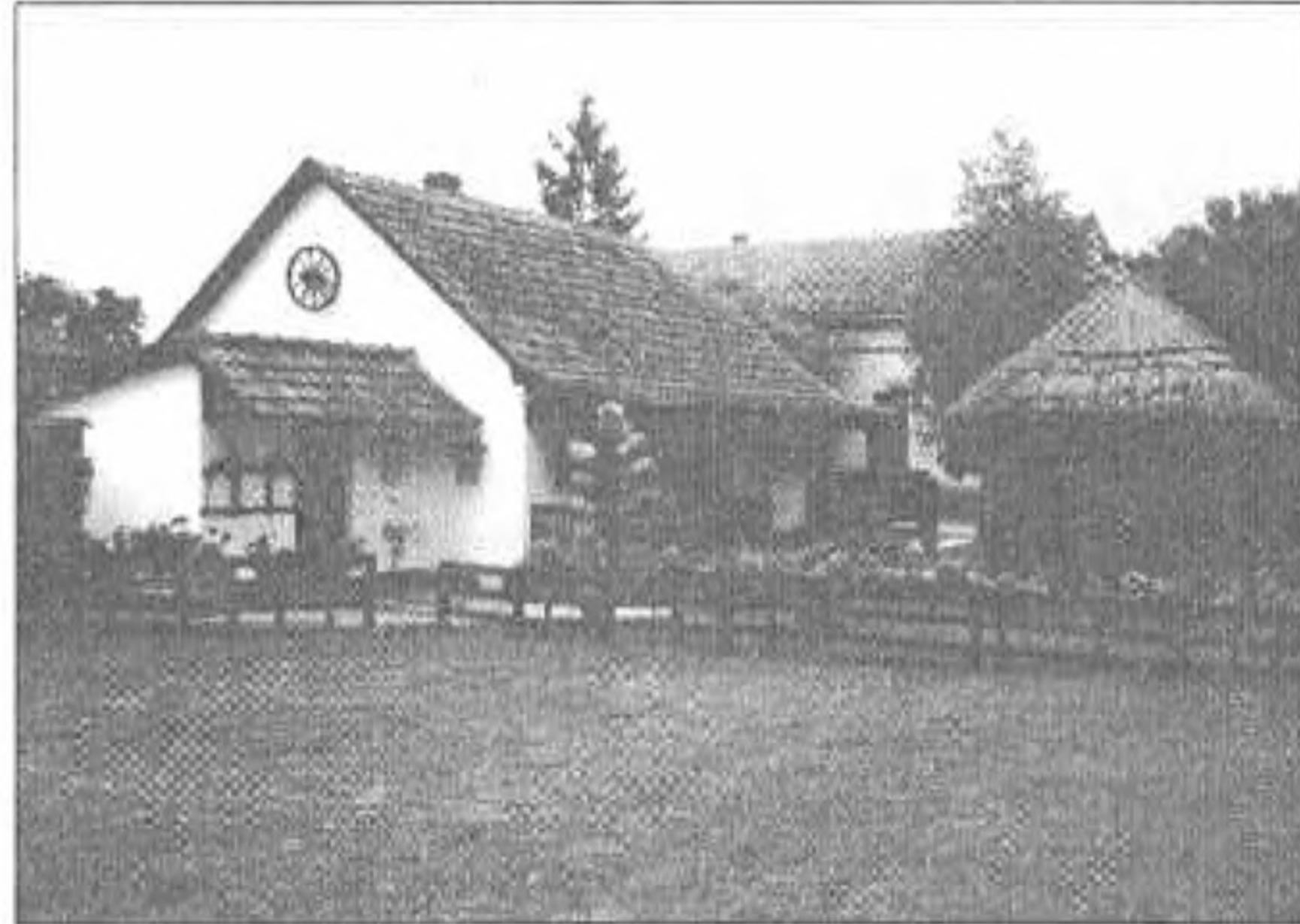
Csaroda, a kedves pihenőhely

nagy víztől meghökölt lovát: „Ugorj, na!” Ebből lett Ugornya. Mikor átúsztatott a túlsó partra, azt mondta a paripának: „Na, menj!” Így született Namény, melynek nevéhez később kapcsolódott a vásárjogot jelentő Vásáros előtag.