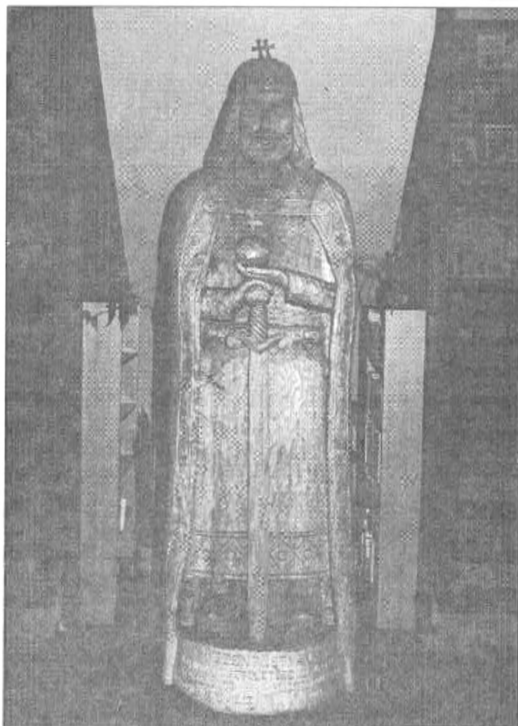
Szent István 2,5 magas szobra

- Köszönöm a beszélgetést! Jó egészséget és sok sikert kívánok az új esztendőben!