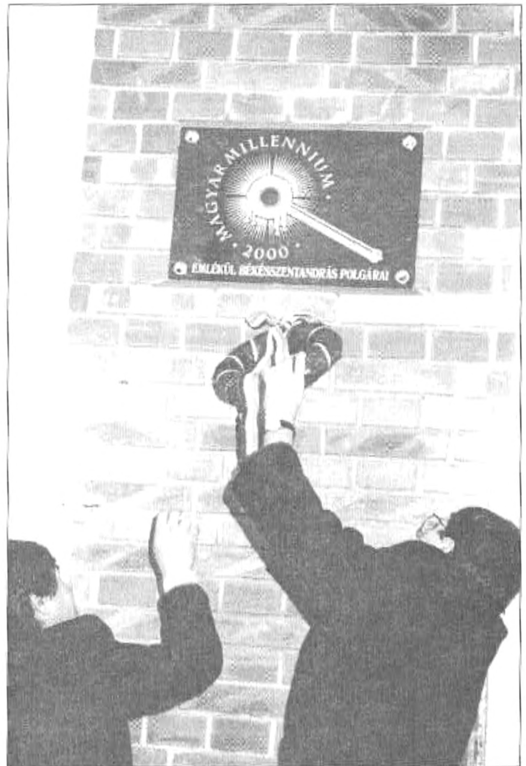
A Millenniumi emlékmű koszorúzása

melyet a Szentandrások mutatnak. Példáztatul valamennyiünknek. A millenniumi év magaslát, kilátó, ahonnan visszatekinthetünk az elmúlt ezer évre. Jól láthatjuk innen a múlt valamennyi erényét, hibáját, sikerét és kudarcát. Van mit tanulnunk ebből az ezer évből, és van mire büszkének lennünk. Egy gondolatra koncentrálnék, mégpedig az össze-