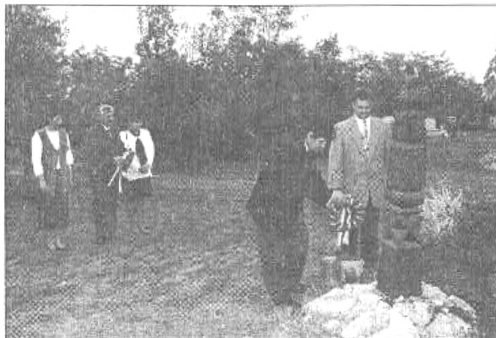
Koszorúzás a Református temetőben