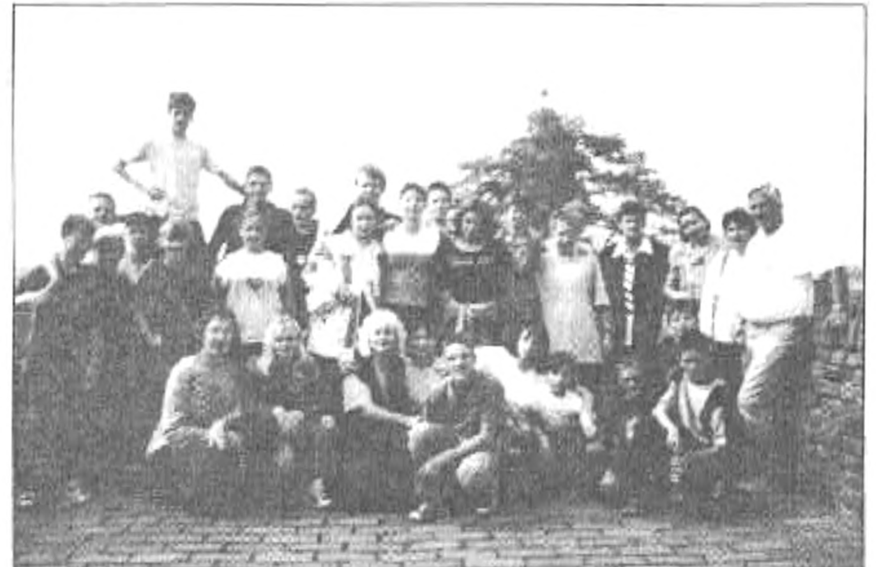
A péterváradai erődben a csapat