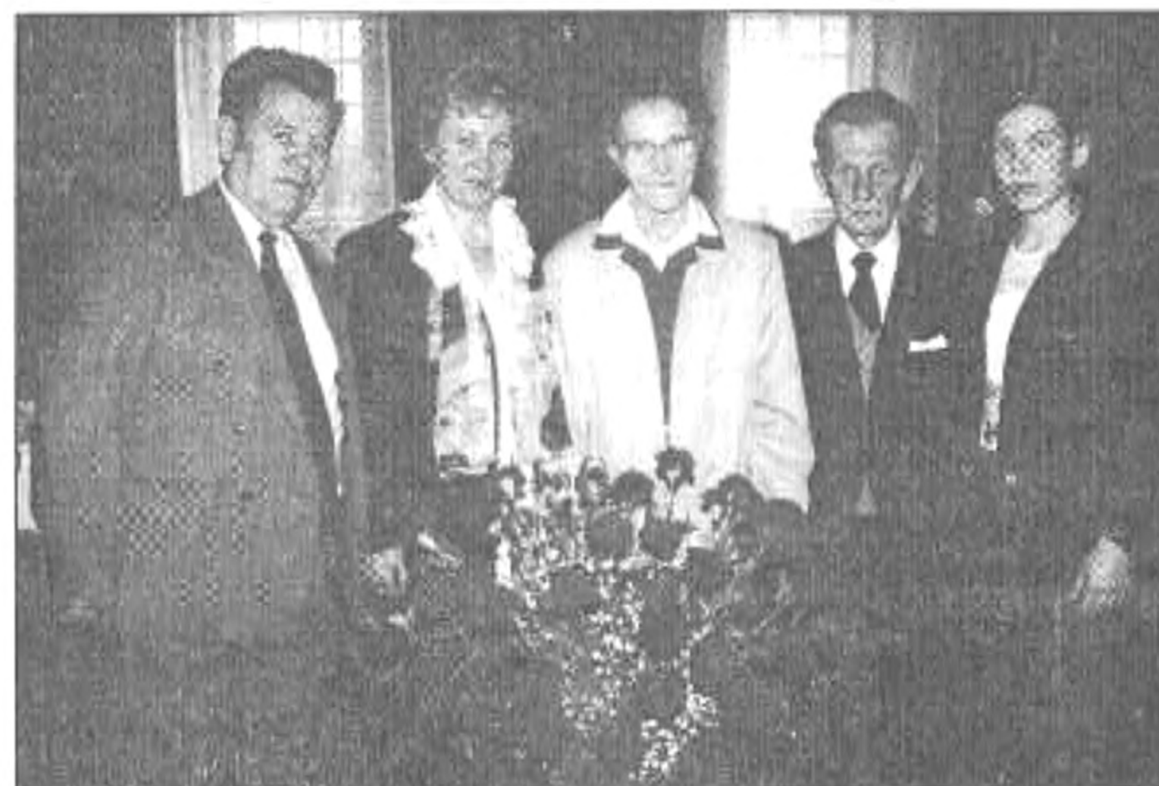
Az ünnepeltek családjuk körében