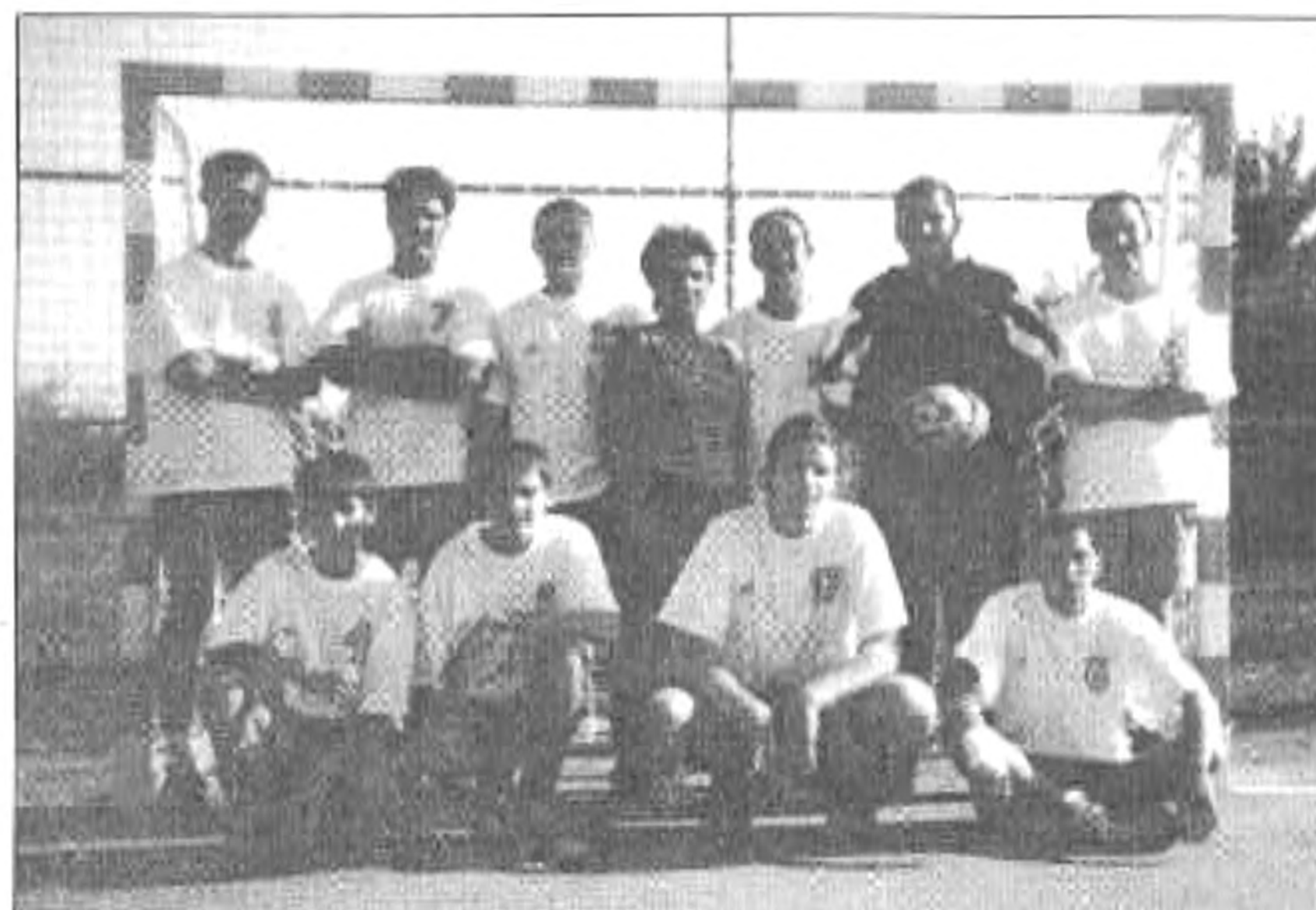
Az alakuló férfi csapat