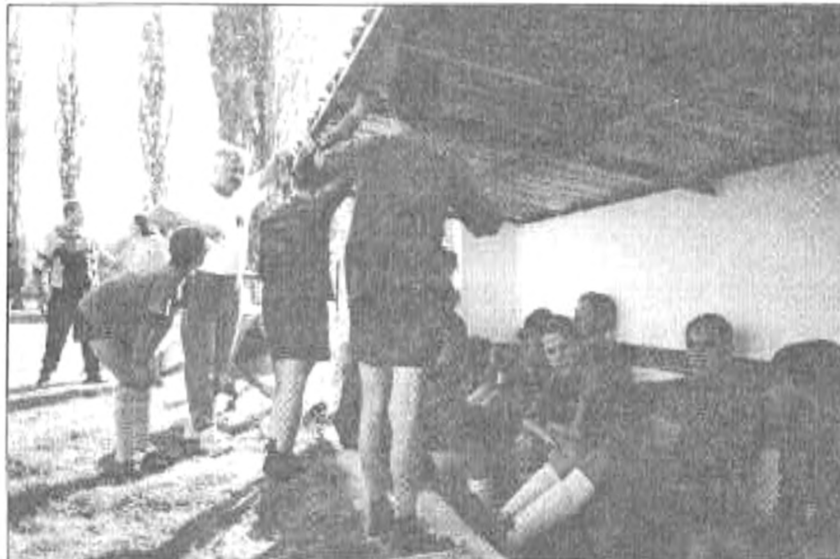
Megbeszélés a szünetben

meget, majd lesétáltunk a Duna partra, ahol már újonnan épített hidak fogadtak minket. Innen megleshettük utunk következő állomását, Péterváradot is. Péterváradon a várat láttuk, ahol mindenki vehetett magának egy emléket, valamint