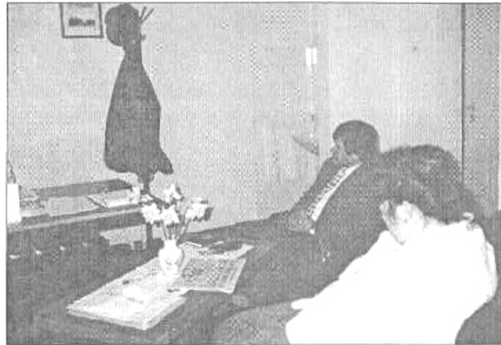
A Polgármester Úr és a Jegyző Asszony vendégségben a diákigazgatónál

15.30 órakor kezdődött a várva várt Tanár-Diák futballmérkőzés. A játék izgalmas volt, a diákok nagyon szerettek volna győzni, de ez kevésnek bizo-