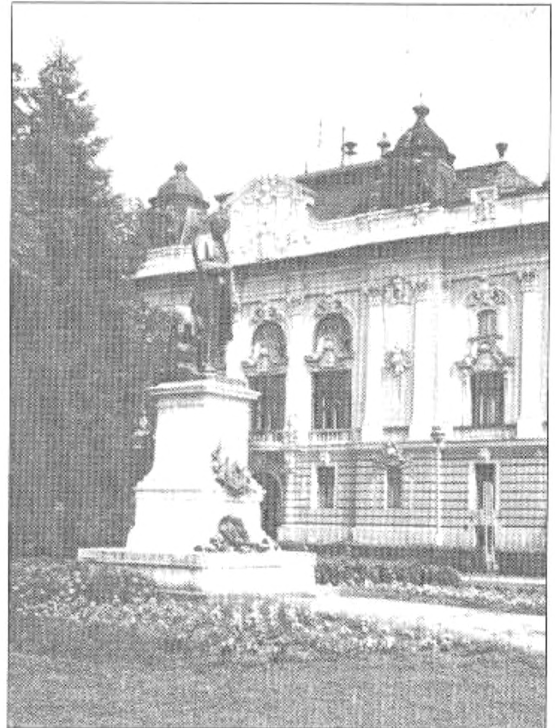
Tompa Mihály szobra

alatt.” A timpanon címere mellett büszkélkedik a római jogra utaló 4 betű: S.P.R.SZ. (Rimaszombat város tanácsa és népe) Hirdetvén a magisztrátus tisztségét, és a polgárok szent akaratát. Az egykori Fekete Sas Szálloda volt a megye legnagyobb klasszicista épülete. 1840-44 között épült Miks Ferenc, kiváló gömöri mérnök tervei alapján. Ma bankpalotaként emlegetik a helybeliek. A Losonc felé vezető Cukorgyár utcában áll az 1786-ban épült copfstílusú evangélikus templom. Értékes képeit és a beren-