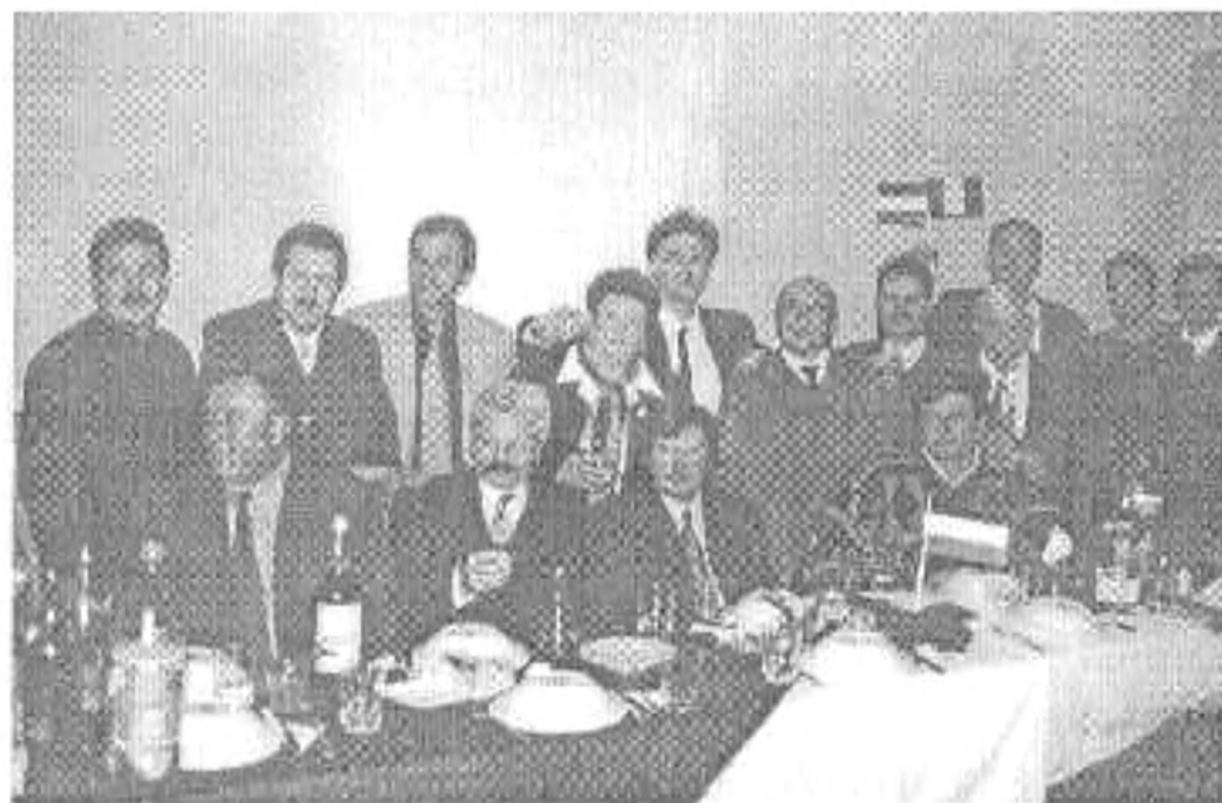
Csoportkép a résztvevőkről

Az igazi nagy ünnepséget 2001. november 29-én tartották. Izgalommal vártak bennünket és igen kedvesen fogadták a hazai Szentandrások közül rajtunk kívül Rába- és Jászszentandrás küldöttségeit. Erdélyből csak Biharszentandrás jelent meg. Sajnos Ausztriából Moson, továbbá a Felvidékről Garam és Liptó sem képviseltette magát. Az ünnepség az ortodox templomban kezdődött. Azt, hogy kedves vendégek voltunk leginkább az bizonyítja, hogy a templom ajtajában bánáti népviseletbe öltözött leányok friss kálással és sóval kínáltak bennünket, s a bejáratnál pedig a papok kézfogással üdvözölték