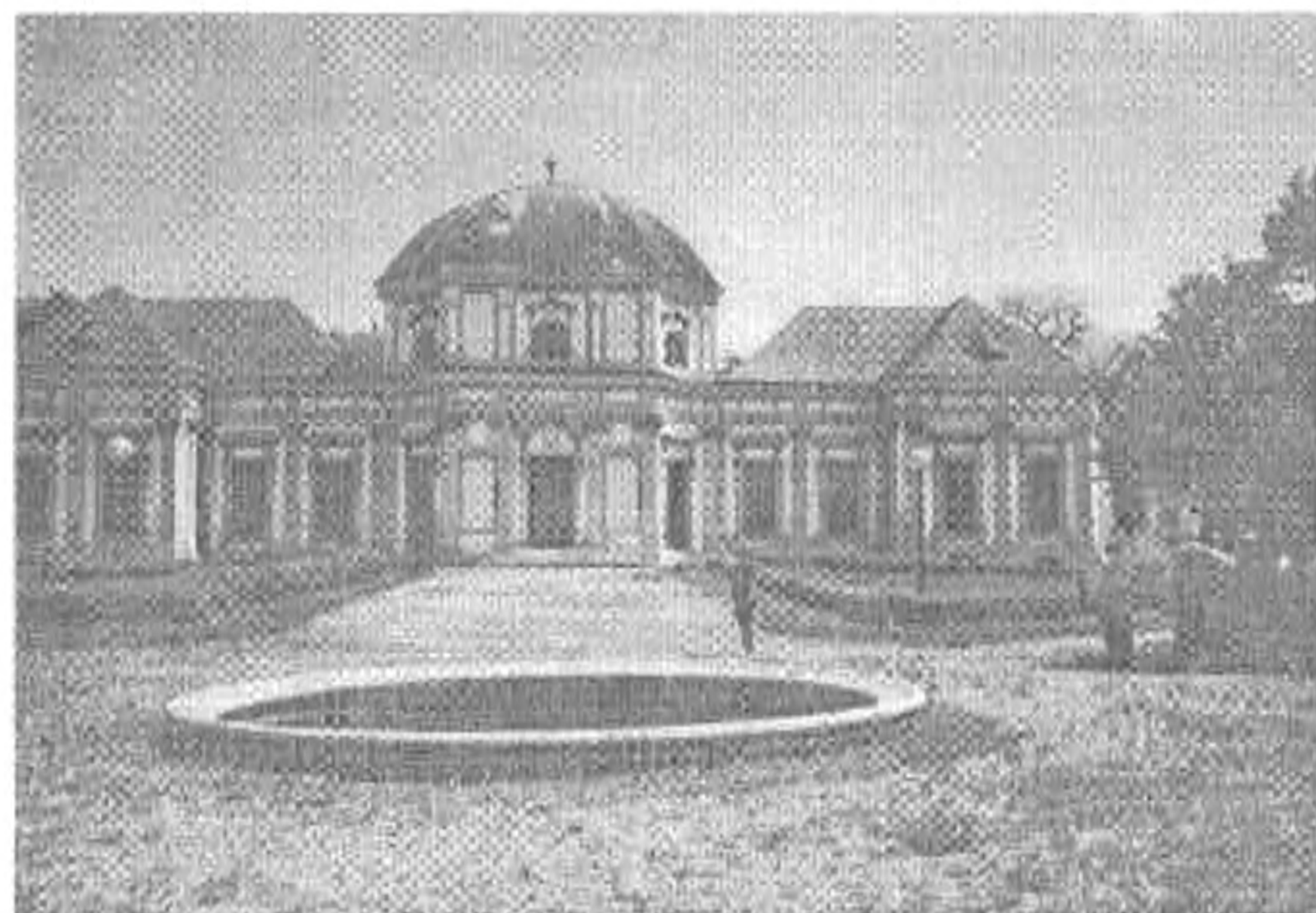
A kastély a kert felől

tartanak. A kastély melletti kis téren áll Szász Gyula alkotása, az egyetlen vidéki Árpád-szo-