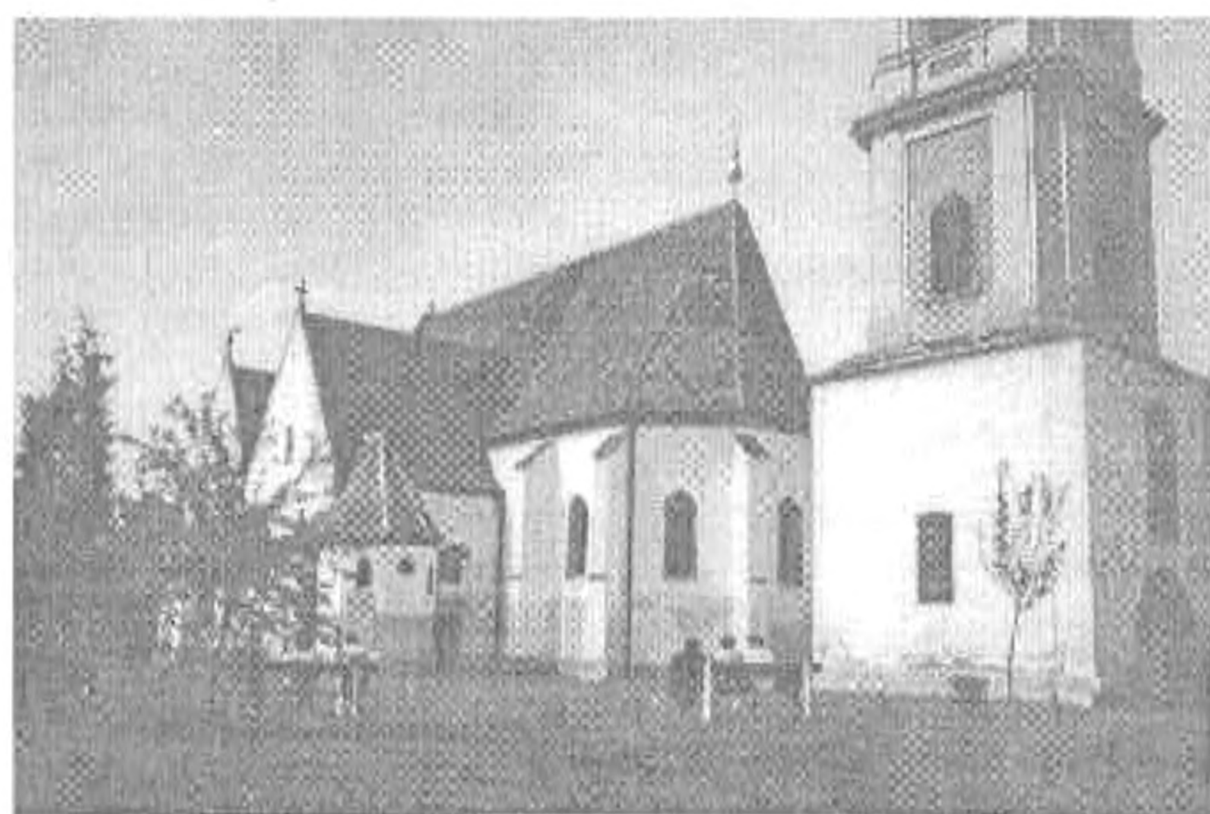
A szerb templom

A város másik büszkesége az a barokk római katolikus templom, melyet Keresztelő Szent János tiszteletére szenteltek. A templombelső teljes falfelületét Patai László festőművész 1994-ben készült óriási méretű seccói díszítik. Az épület előtti kis téren lévő díszkút oldalán Petőfi János vitéz című elbeszélő költeménynek jeleneteit