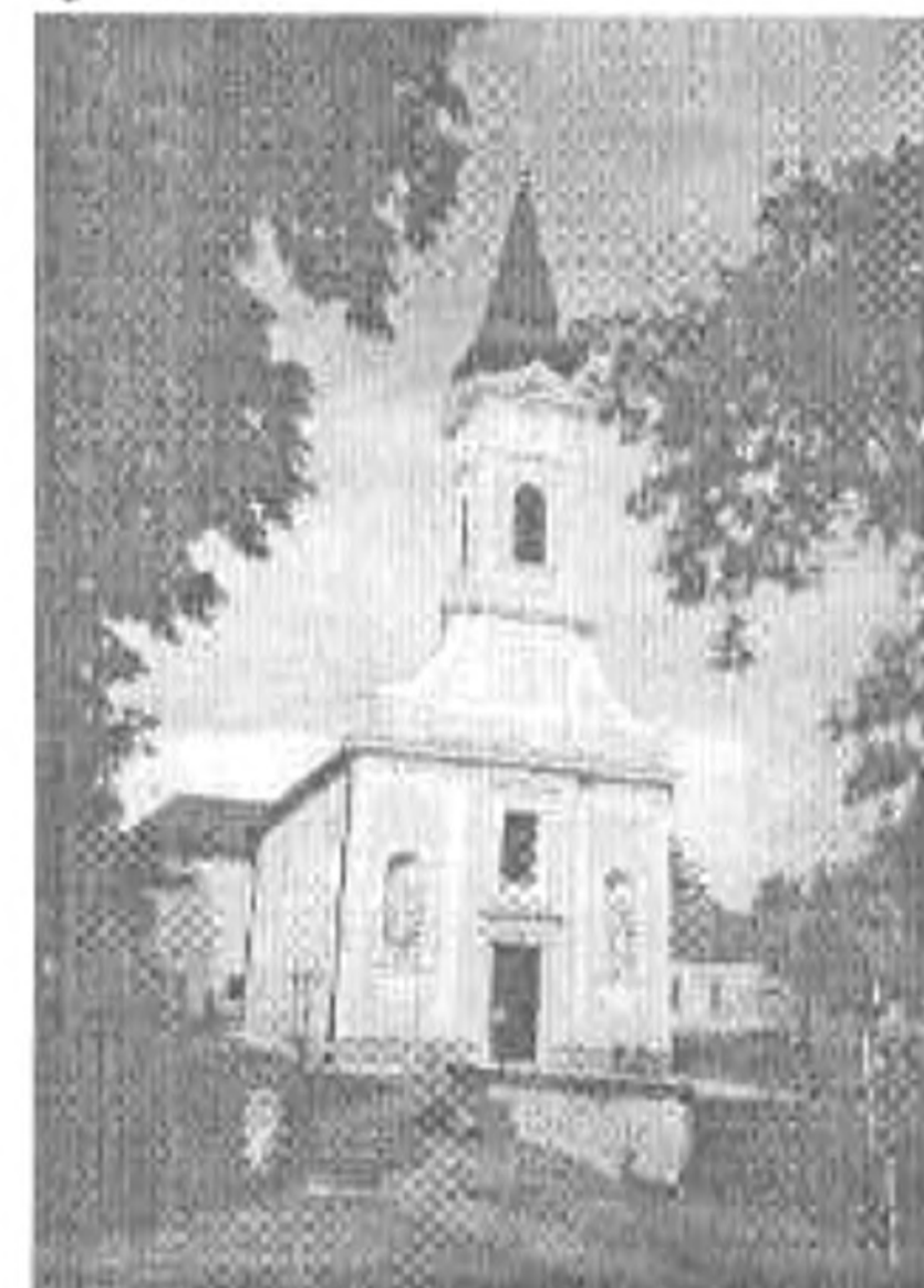
A Szent Mihály templom

A falu határában kristálytiszta bányató található, de bársonyos vizét csak a jól úszóknak ajánlom.