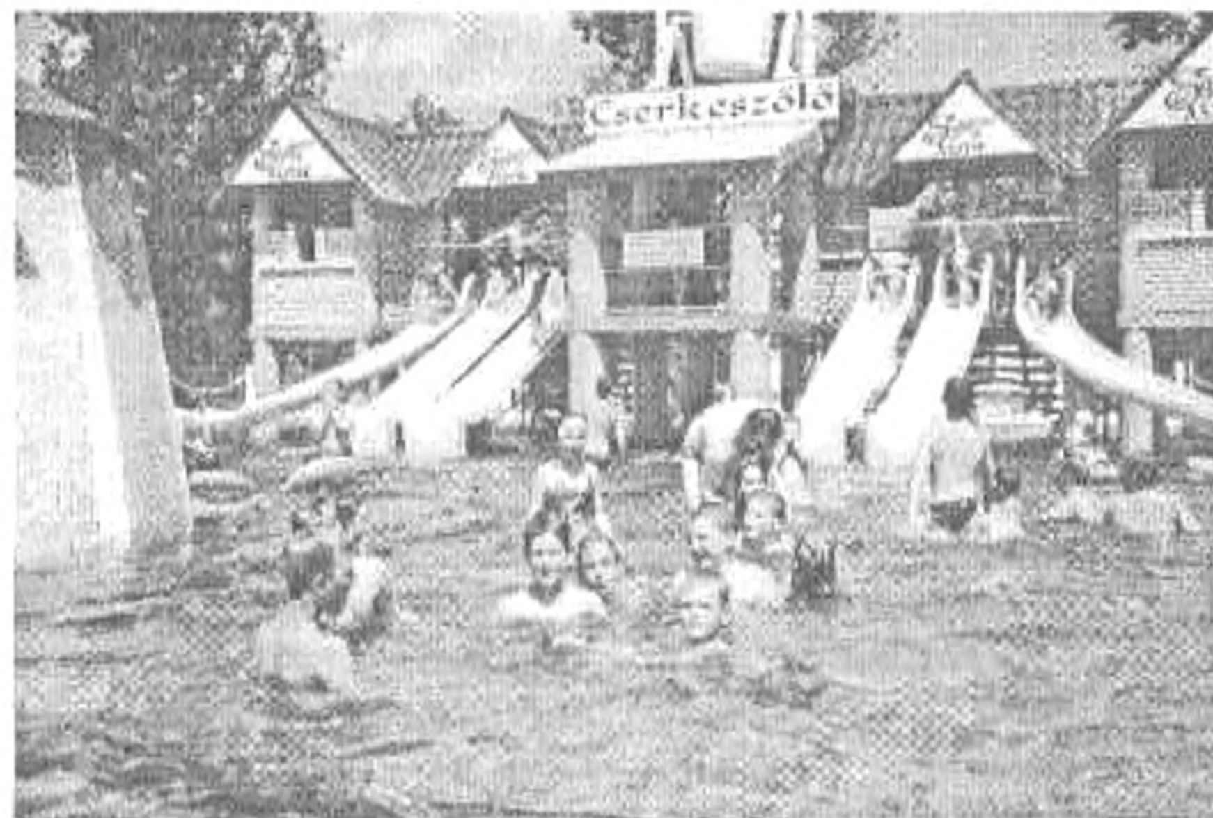
A cserkeszölői fürdőben

A tábor leginkább várt napja a szerdai cserkeszölői fürdőzés volt, ahová autóbusszal mentünk. Csütörtökön ismét kerékpárra ültünk. Ezúttal az Anna-ligetbe, s az