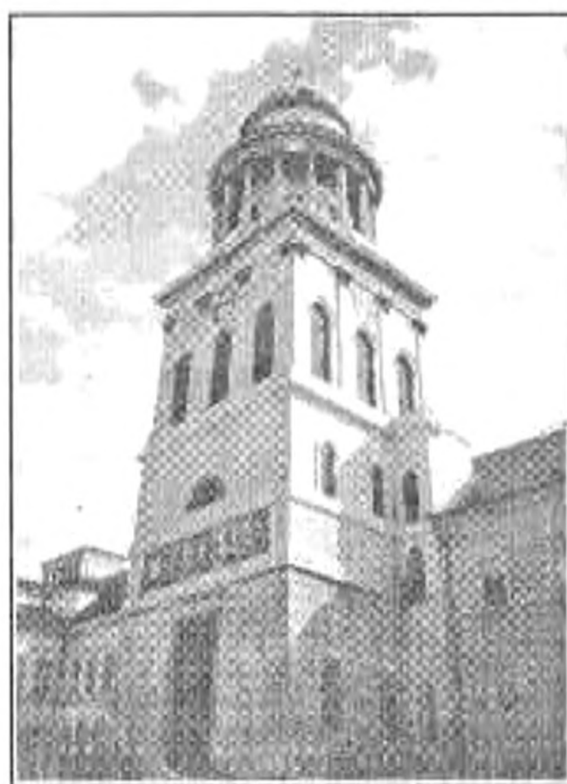
Az apátság tornya

kiváltságlevelet nyújt át az első apátnak, Anasztáznak. Jobbról a rendet visszaállító II. Ferenc császár oklevelén a „Praedicate, docete” felirat olvasható. Prédikáljatok és tanítsatok! Az 50 m hosszú