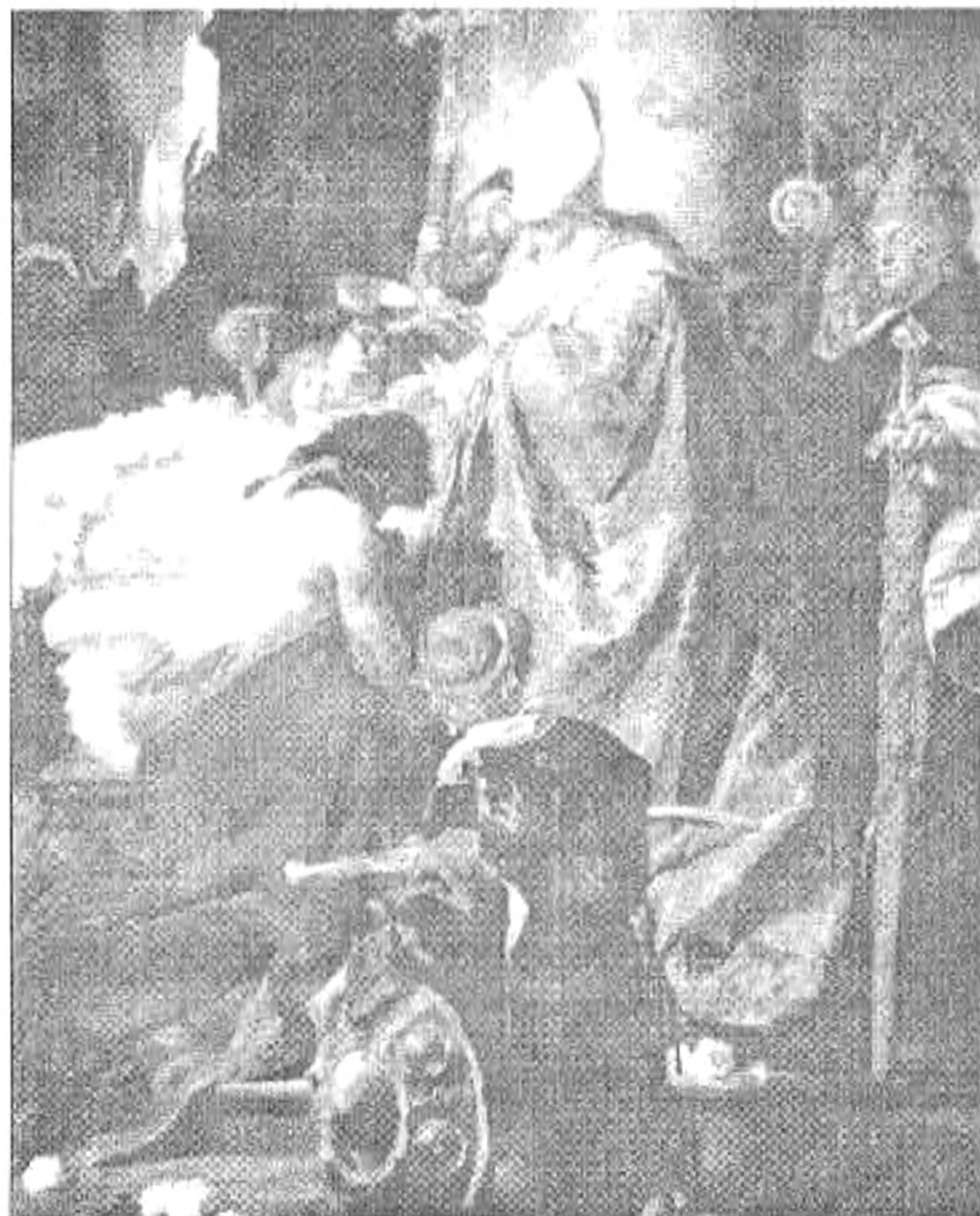
Benczúr Gyula: Vajk megkeresztelése