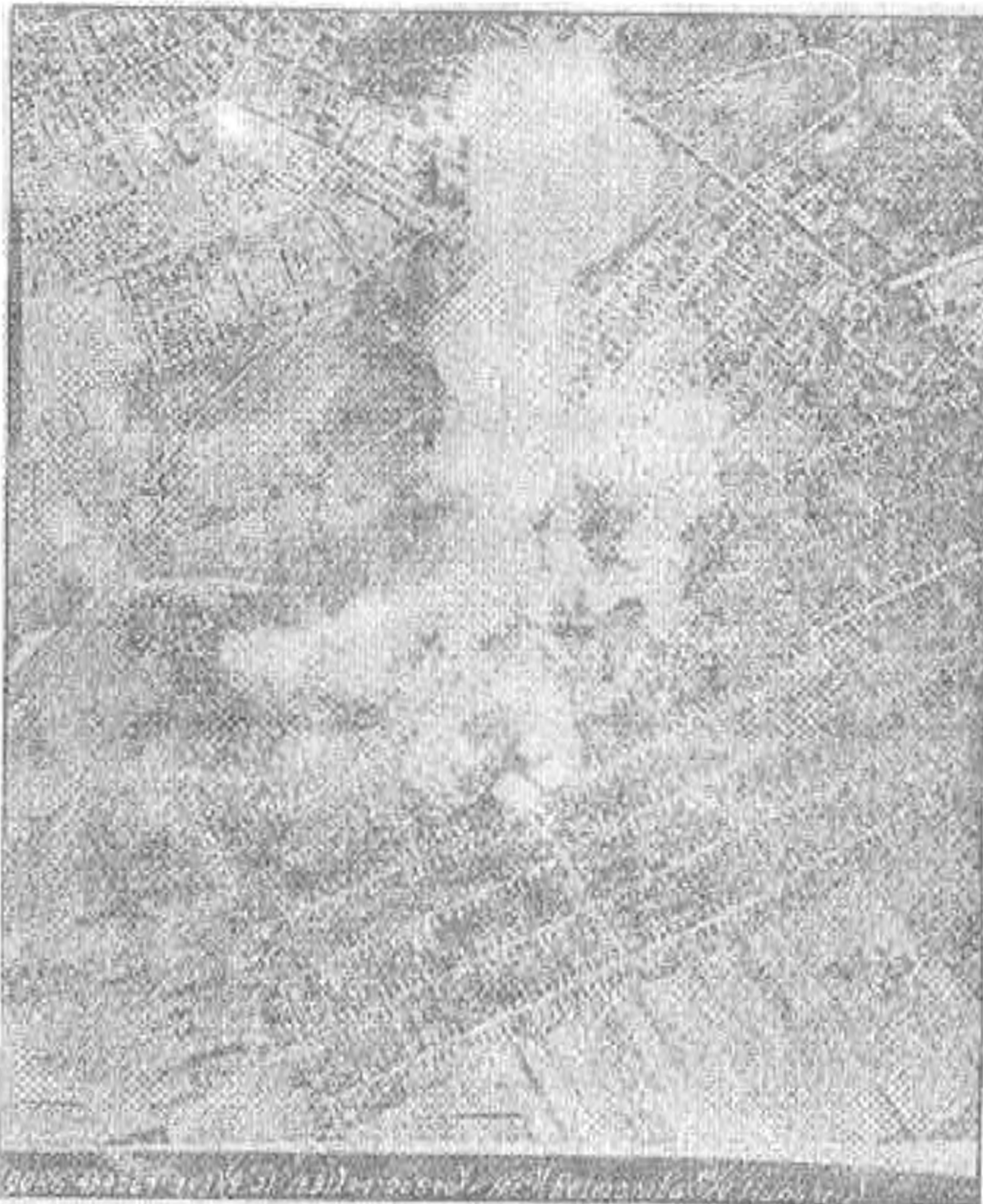
A bombázás után készült amerikai légifelvétel Jaminárról

kor vették teljesen komolyan a szirénát.