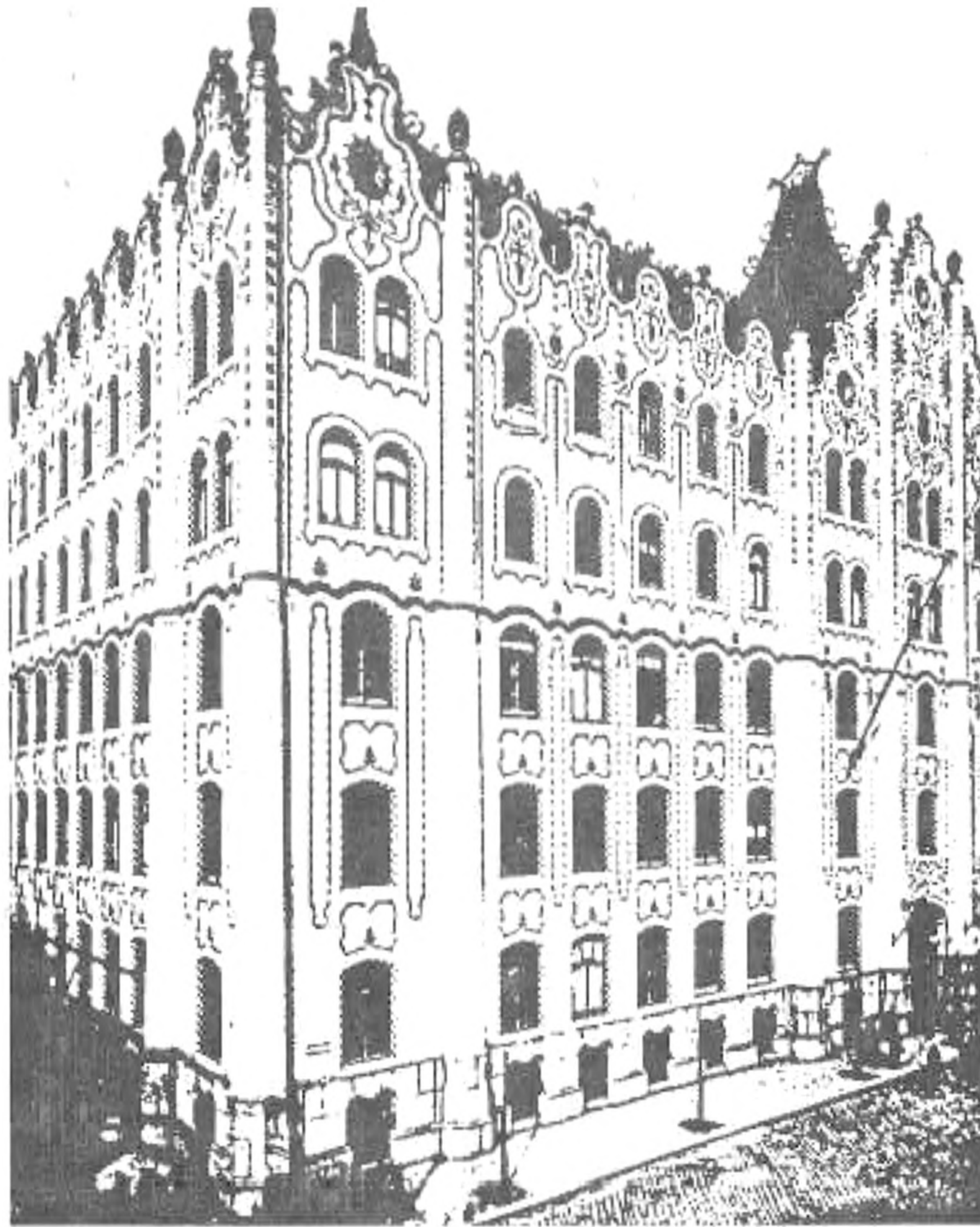
A budapesti Postatakarék épülete

Az új művészeti áramlat kiindulópontja Nagy-Britannia. Az angol ág inkább a célszerű, hasznosra törekvő irányzatát képviselte. A belgák inkább a funkciót emelték ki. A franciák a virágdíszes, stilizált stílust alkalmazták. Az építészet a szobrászathoz közelít, a házakat növénytörzsek díszítik. A drágaság fontosabb, mint a funkció. Ugyanez jellemző a festészetre és a könyvművészetre is. A bécsi alkotók inkább a letisztult formavilághoz vonzódtak.