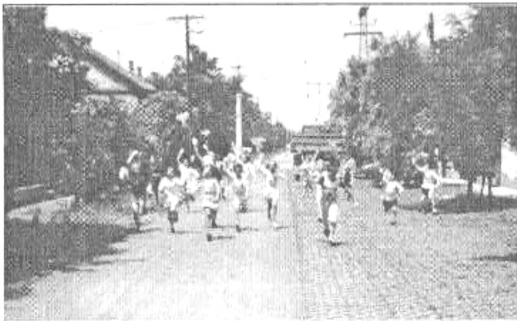
Kié repül magasabbra?