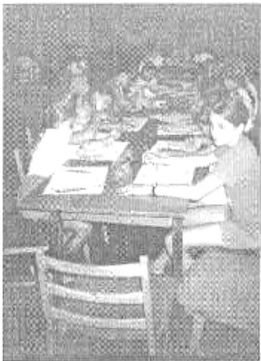
Készül a sárkány