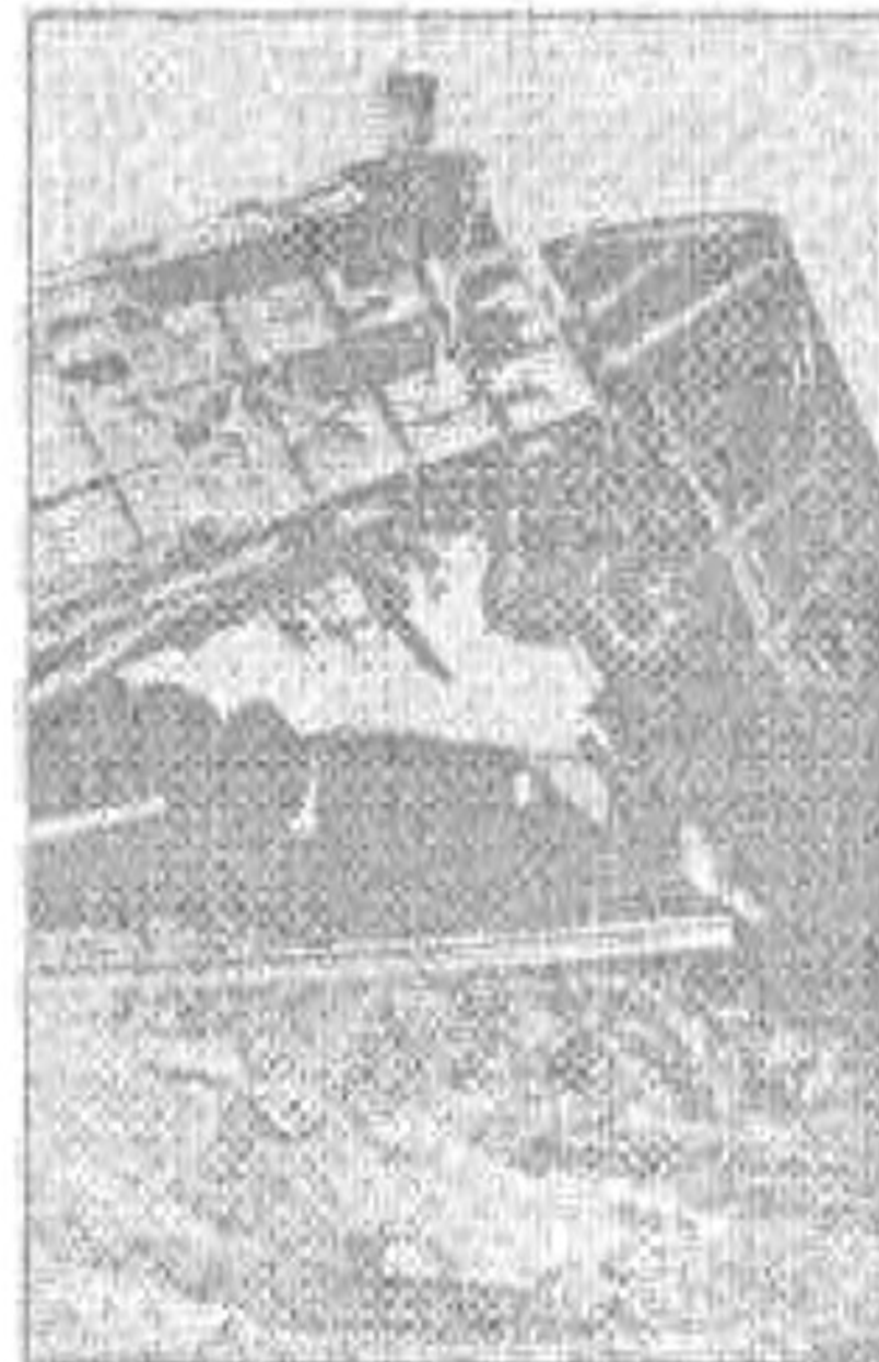
Ágaskodó vagonok a megrongált pályán

A nagy pusztulás közepette volt egy kis szerencséje is a város-