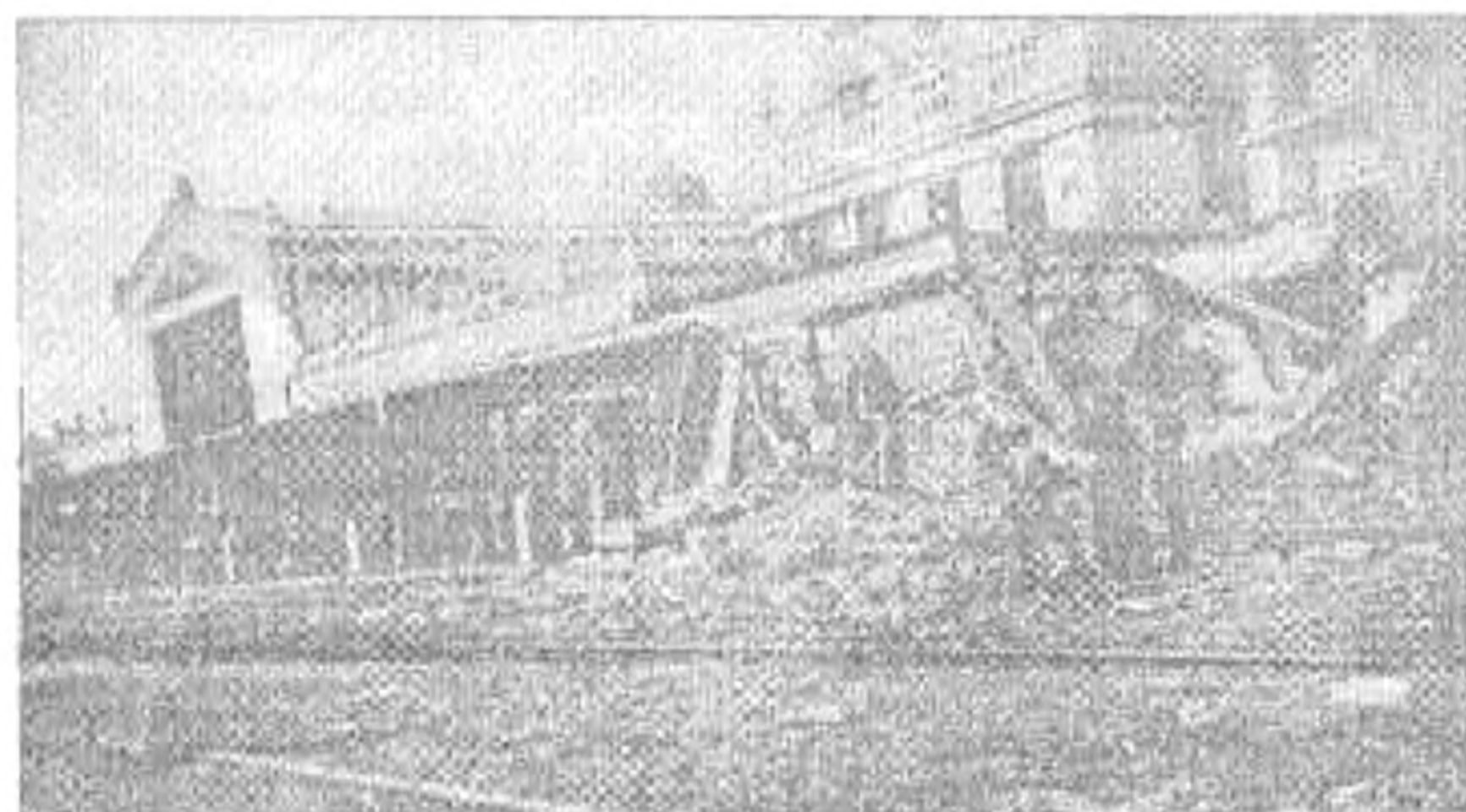
Az állomás épülete a támadás után

Békéscsabán a gyakori légiriadók és az ország távolabbi városából érkező hírek ellenére sem nagyon hittek abban, hogy a települést bombázni fogják. Az emberek hajlamosak azt hinni, hogy minden rossz csak mással történhet meg. Reményeinket táplálta egy képtelen legenda (a háborúban veszítésre álló, a kiszolgáltatott fél lelkivilágától nem idegen az ilyesmi!) arról, hogy valamikor ott élt Sztálin anyósa, és ezért a halált hozó égi utasok elkerülik a várost. Megerősíteni látszott azt az is, hogy a hátuk mögött volt már egy bombamentes tavasz és nyár. 1944. szeptember 21-e azonban fülsiketítő dörrenések közepette ébresztette rá az embereket arra, hogy mi van a világon, és pont olyan védtelenek, mint sok-sok millióan még rajtuk kívül, akiknek otthona lőlött