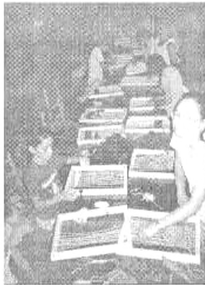
A szövés is jól megy