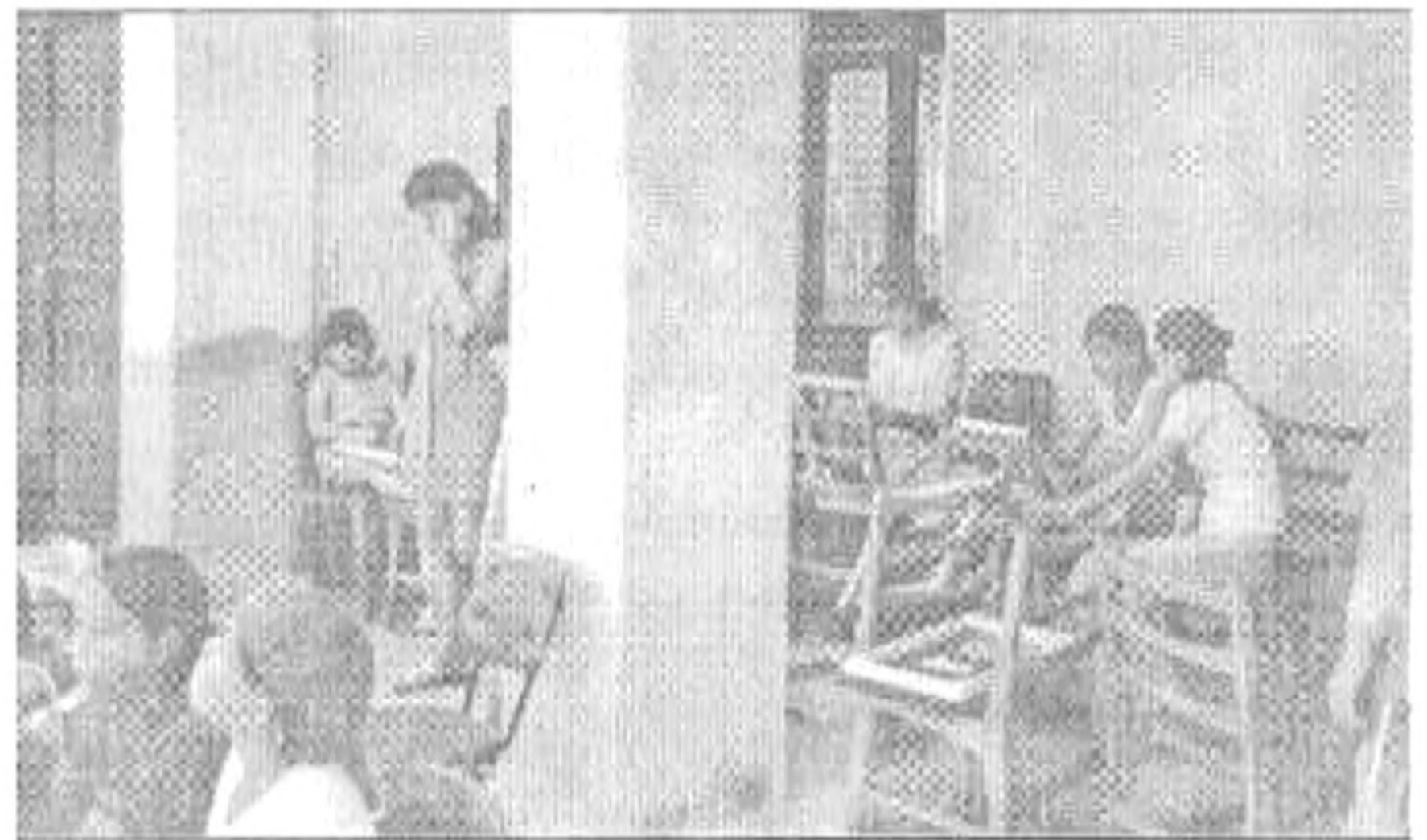
Volt aki ebéd helyett is inkább dolgozott