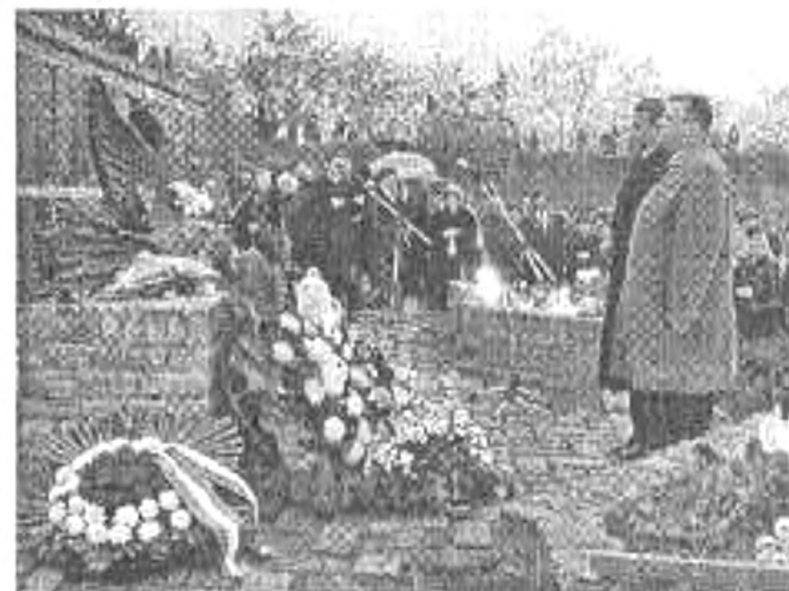
A Vergődő madár emlékműnél

1944-45-ben közel kétezer embert végeztek ki. Nem volt igazi ok a tömegmészárlásra. „Nem kellett semmilyen bűnt elkövetni, pusztán magyarnak lenni.