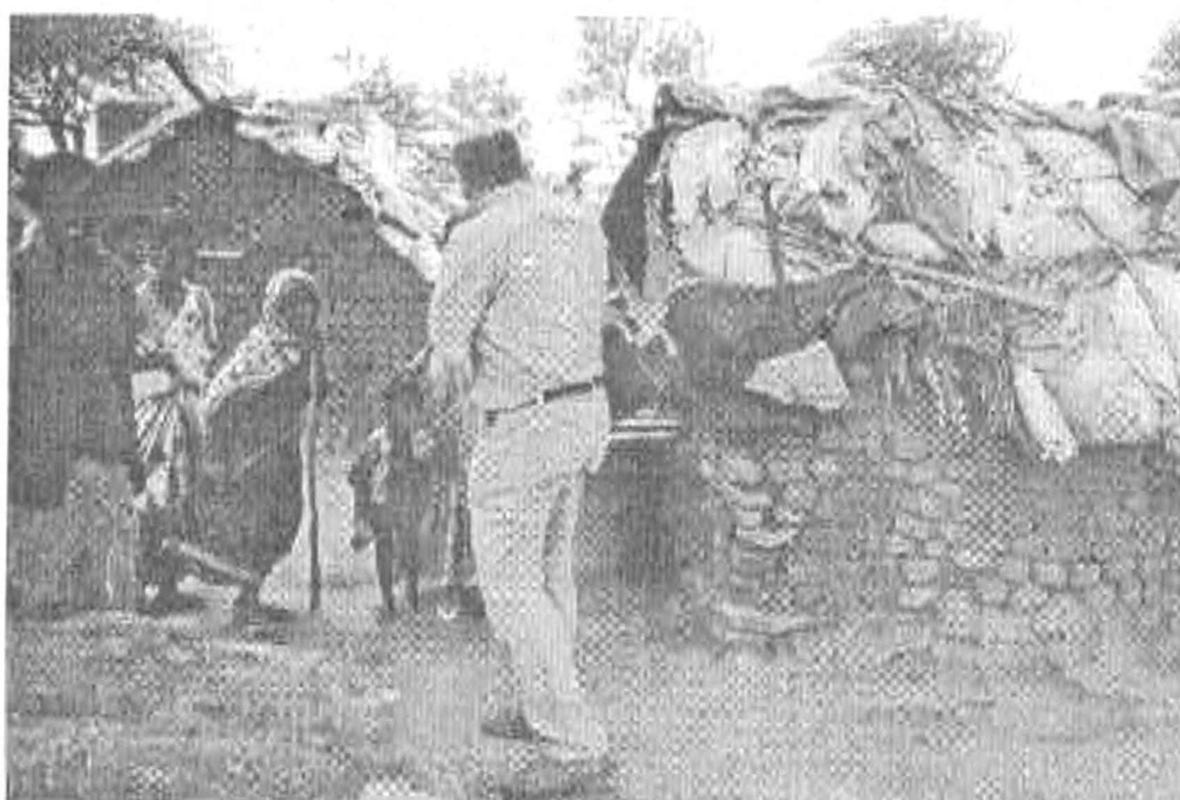
Mosolygó dalitok falujában a lakóházak előtt

bilization - ezt jelenti: Működés és mozgósítás. E két szó tömören kifejezi a társaság misszióhoz való hozzáállásának fő jellemvonásait. Az OM a misszióért elsősorban gyakorlati, konkrét lépéseket akar tenni, másrészt erre mozgósítani akarja a misszióban még