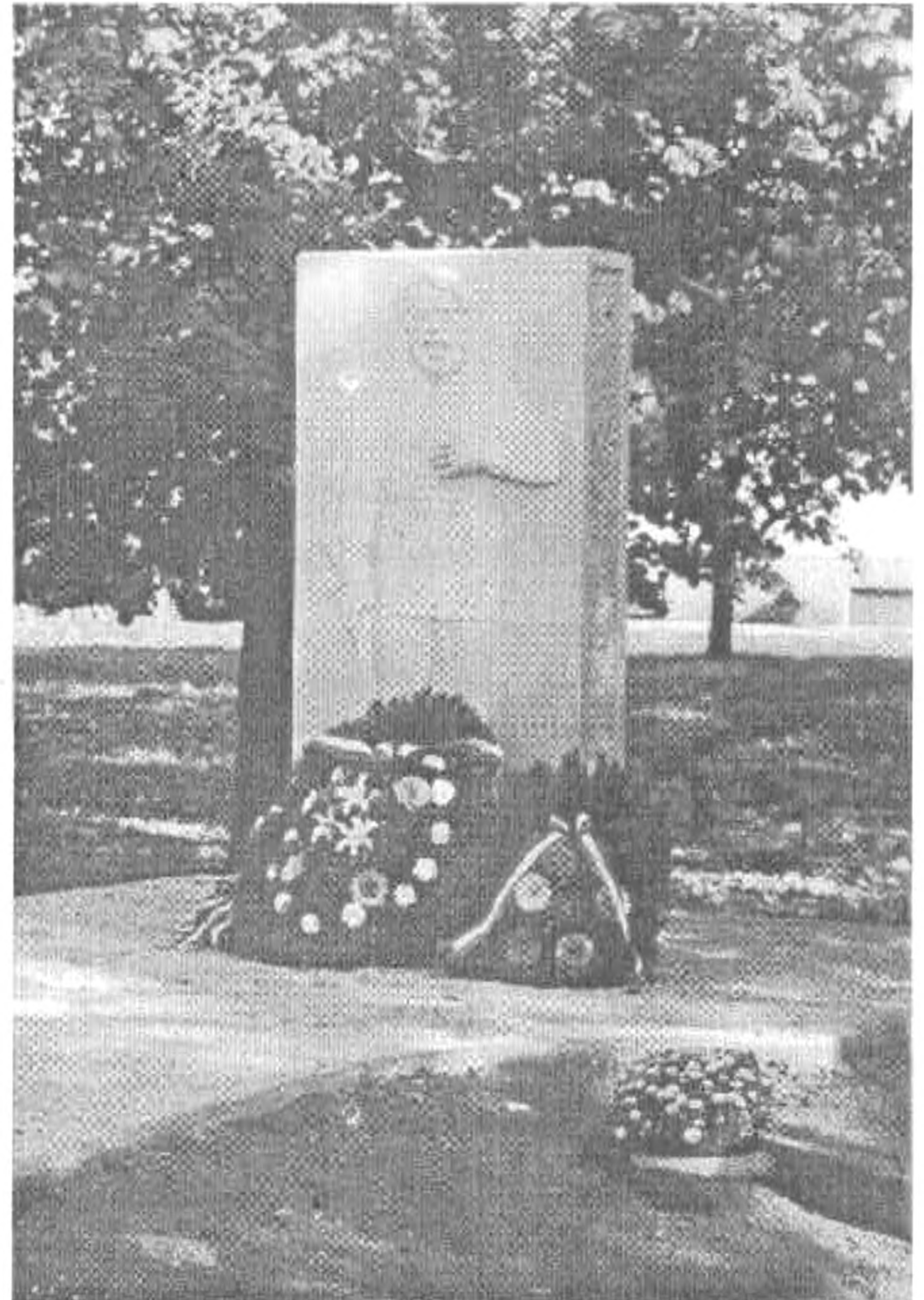
Lengyel Péter: Kossuth Lajos

a szabadság liliom-illata, ezerhétszázhárom, nyolcszáznegyvennyolc, és ötvenhat; egyszer minden száz évben talpra állunk kínzóink ellen; bármi történjék is, boldogság, hogy megértem, és újra péntek; a Dunánál állunk, a Nap áttör, füstön, ködön; talán sikerül minden s az alkonyat bíbor brokátja Zsuzsa lenszőke haján, és szombat; a hajnalban csupa reménység, estére tudni; nyakunkon a kés, a keleti szemhatár mögött mocskos felhők, nyugatról álszent rőfögés, mentünk a kétszázézerrel, nem bírnék több börtönt, és ha nem is jön velem; Árpád óta bennem lakik az ország minden völgyét meg dombját ösmerem, akkor is hazám, ha távol lesz tőlem. (...) Ezerkilencszázötvenhat, sem emlék, sem múltam nem vagy, sem történelem, de lényem egy kioperálhatatlan darabja testrészt, ki jöttél velem, az irgalmatlan mindenségbe, hol a Semmi vize zubog a híd alatt, melynek nincs korlátja; - életemnek te adtál értelmet, vad álmokat éjjelre és kedvet a szenvedéshez meg örömet; mindig te fogtál kézen ha botladoztam, magasra emeltél s nem engedted, hogy kifulladás vénen, ezerkilencszázötvenhat, te csillag, a nehéz út oly könnyű volt veled! Oly régesrégén sütsz fehér hajamra, ragyogj sokáig még sírom felett!