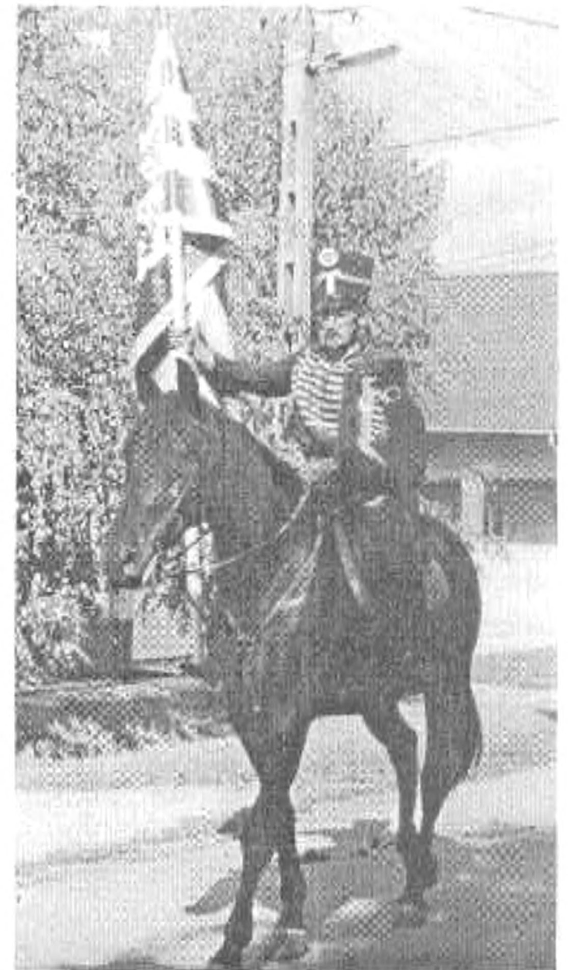
„Éljen a magyar szabadság”