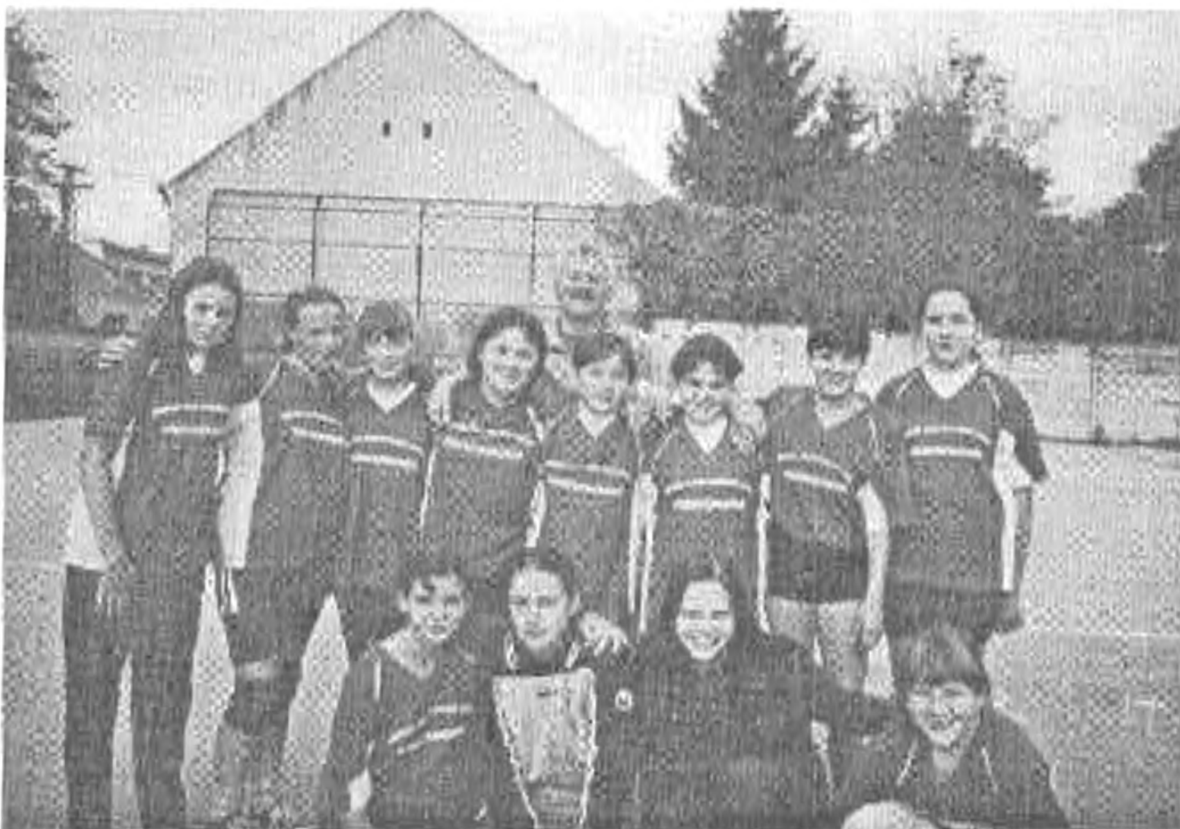
A lányok csapata