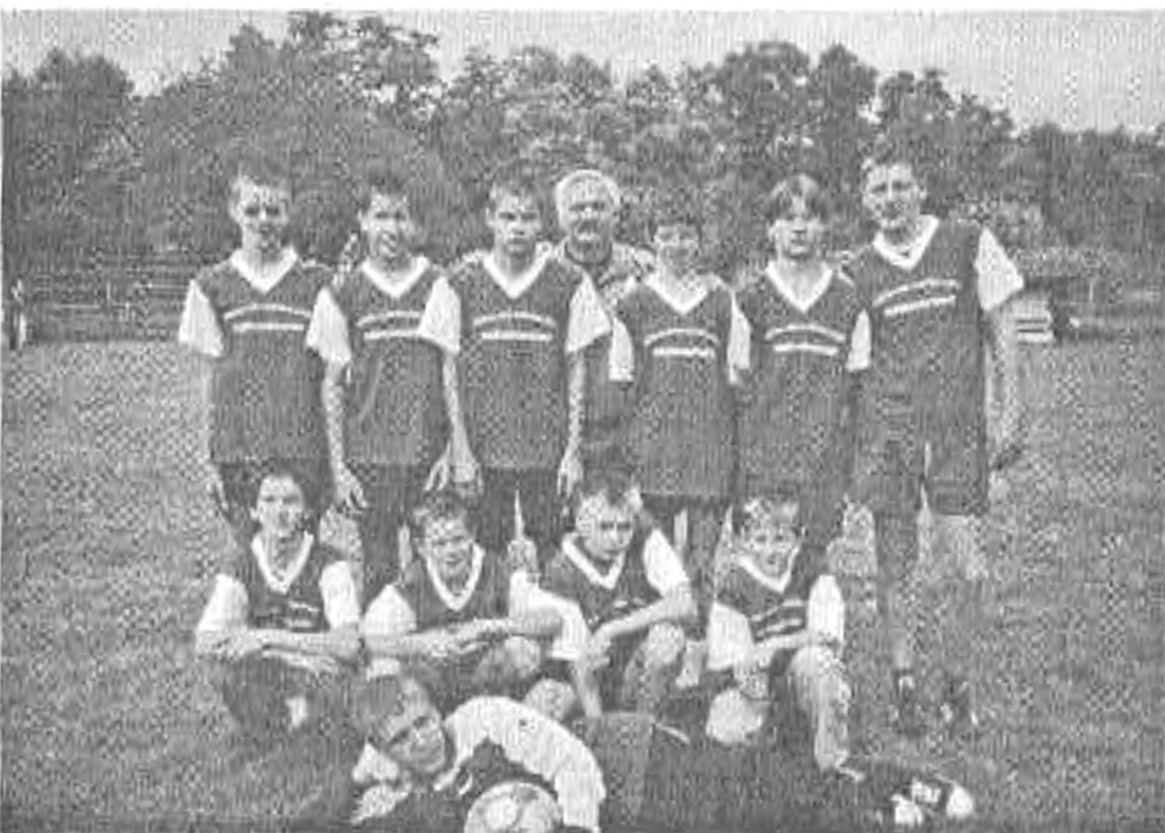
A fiúk csapata