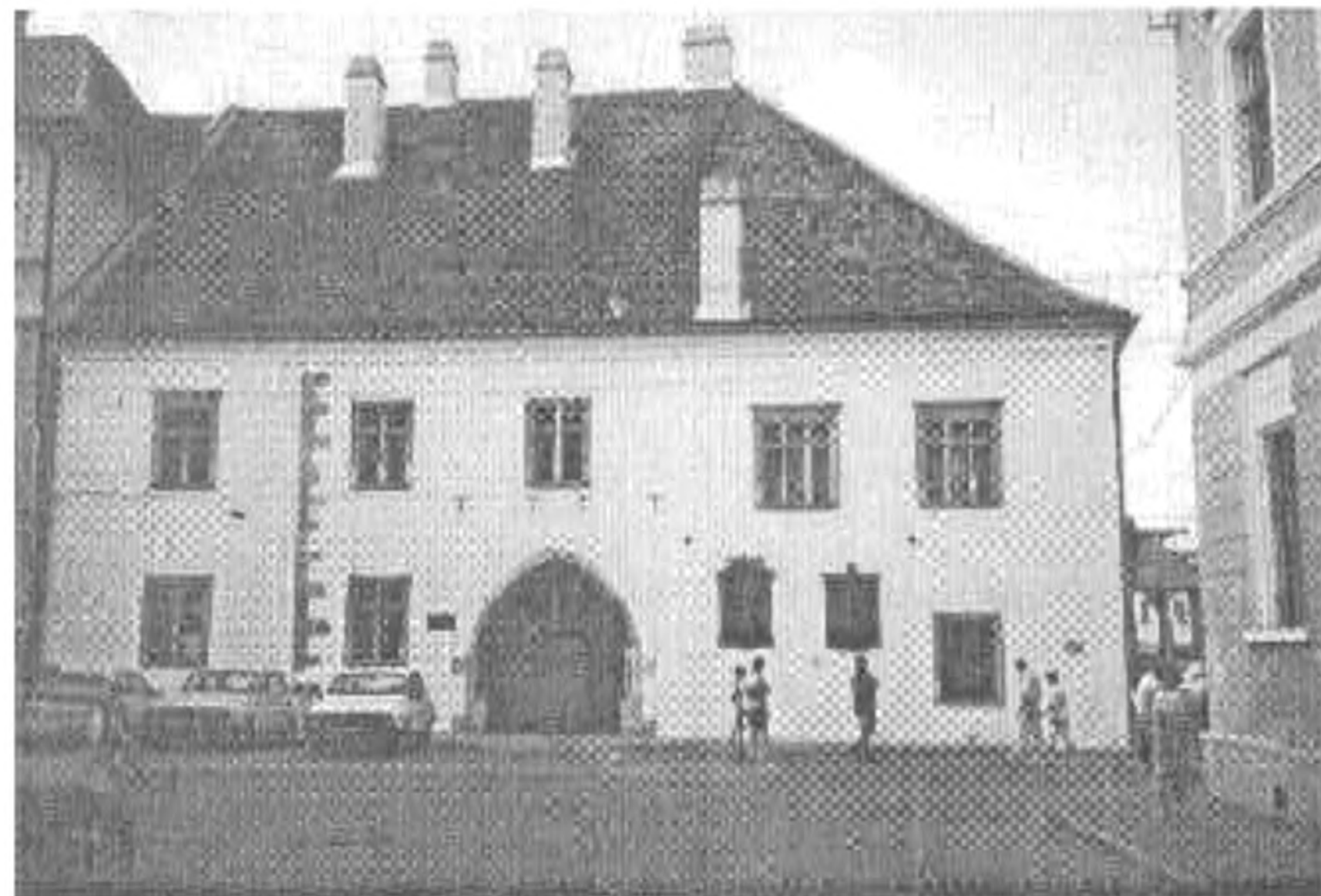
Hunyadi Mátyás szülőháza

Ha kipihentük magunkat nem szabad kihagyni a Farkas utcát. Elején az Egyetem monumentális épületömbje, lejjebb a Református Kollégium és a templom. A gótikus falak az erdélyi nemesi családok halotti címereit őrzik. A szomszédos Petőfi utcából nyílik Európa egyik legrégebbi és egyben legszebb temetőjének egyike, a híres Házsongárdi temető, melyet az erdélyi magyarság panteonjának is nevezhetünk. Itt csak meghatódottsággal lépdélhet az ember, „tört kővön és porladó keresztén” - ahogy Áprily mondja gyönyörű versében - Apáczai Csere János, Szenczi Molnár Albert, Jósika Miklós, Brassai Sámuel, Misztótfalusi Kis Miklós, Kós Károly, Dsida Jenő, Mikó Imre és még nagyon sok ismert személy neve olvasható. De szomorúan látom, hogy a művészi kivitelű sírkövek lassan nevet és nyelvet váltanak. A