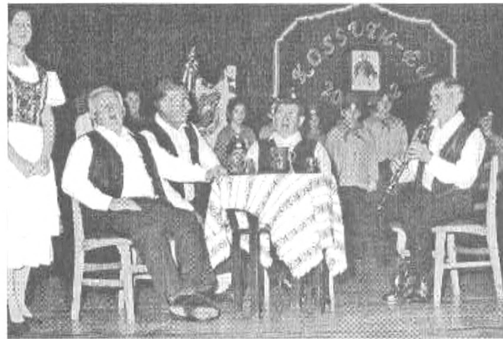
A csabacsüdi pávakör

aki fel meri venni a kétségbeesett harc kesztyűjét, aki nemzete számára Danton és Carnot egy személyben - s ez Kossuth Lajos" - írták a korabeli külföldi újságok. Szervezte a tömegfelkelést, a nemzeti fegyvergyártást, a papírpénzt, rövid úton való elintézését mindenkinek, aki a forradalmi eseményeket gátolja és lelkesítette Magyarországot. De Kossuth nem háborús kalandokra törekedett, nem más országok meghódítására készült, hanem békét akart. Békét, amely lehetővé teszi a márciusi forra-