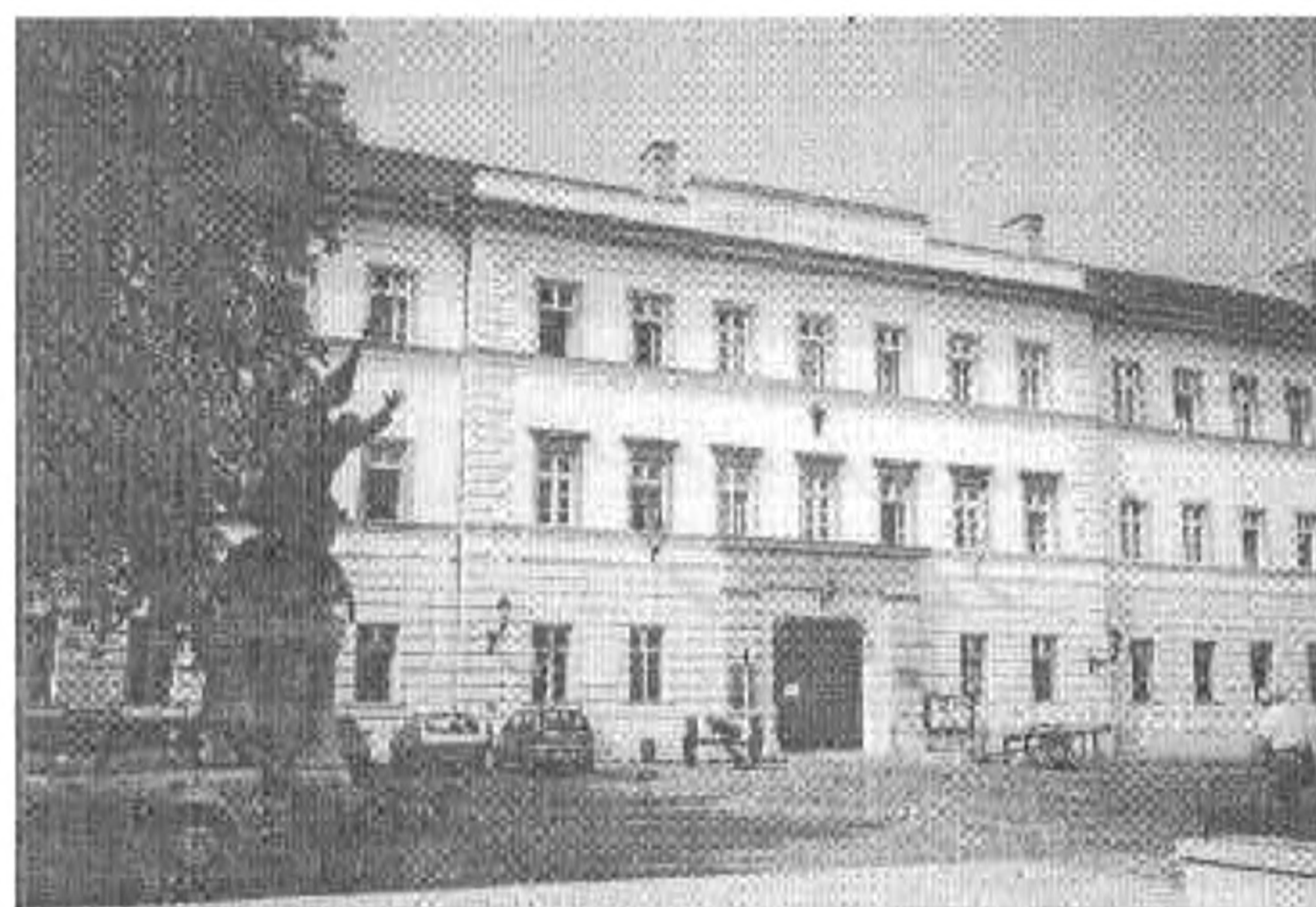
A Hadtörténeti Múzeum

néznie a pazar berendezését még az elnöki beköltöztetés előtt. A szomszédos Várszínház mögötti árnyas fák alól pom-