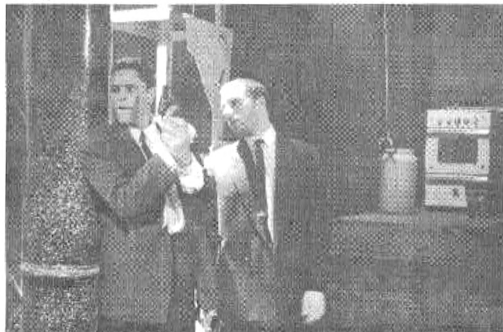
Jelenet a darabból

Mi születetett, mi született ebből a fiatal színészeket önfelédlt szárnypróbálgatásra, sőt repülésre készítő kísérletről?