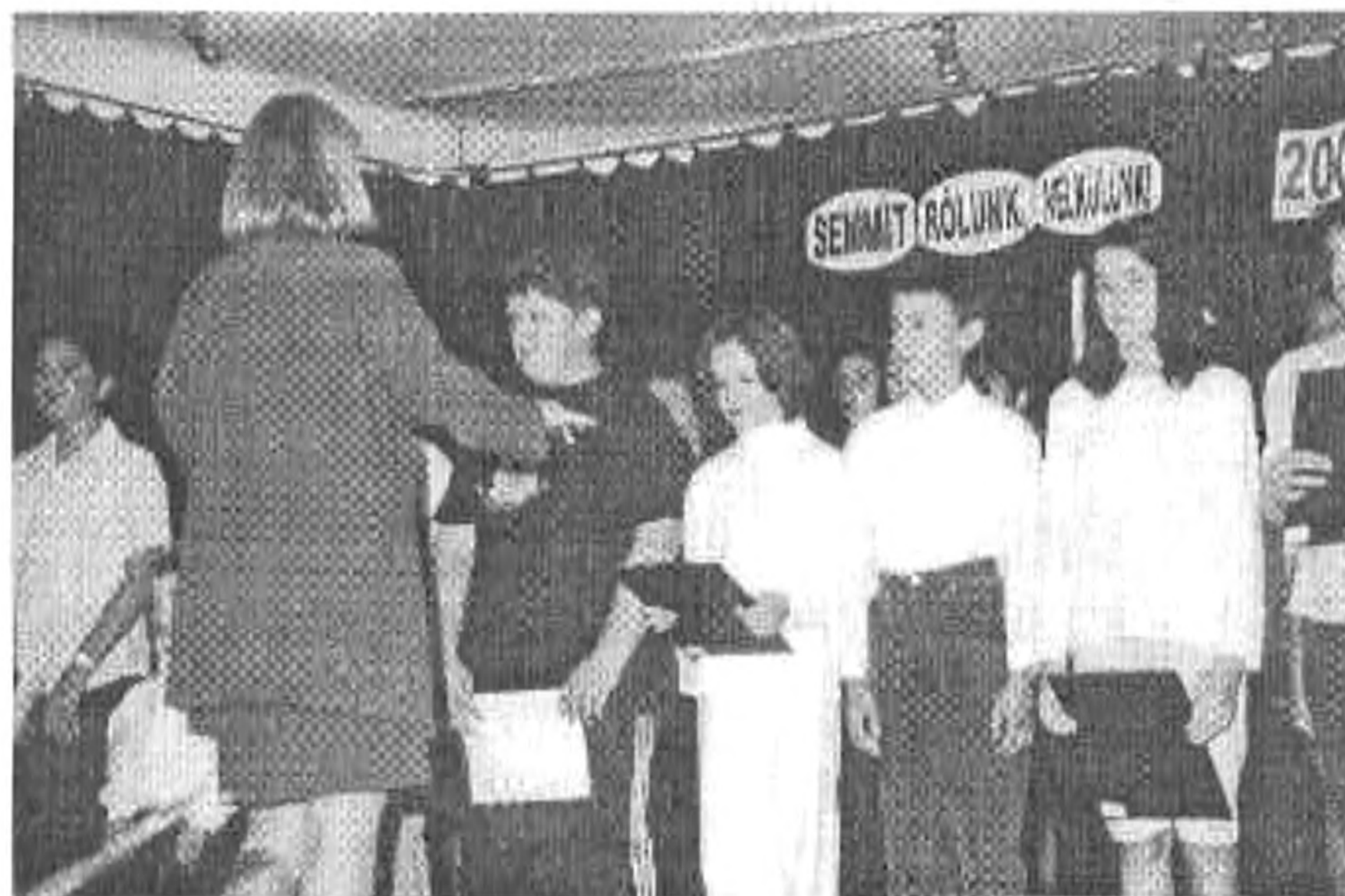
Az énekkar műsora

Szeptember 20-án a Szigetszentmiklósi Virágkiállítás 88 sorstársat csábított el otthonról. Köszönjük a Szarvasi Körös VOLÁN Rt. vezetőjének, hogy biztosította a buszokat. Egy virágkiállítást leírni nem lehet, azt látni kell.