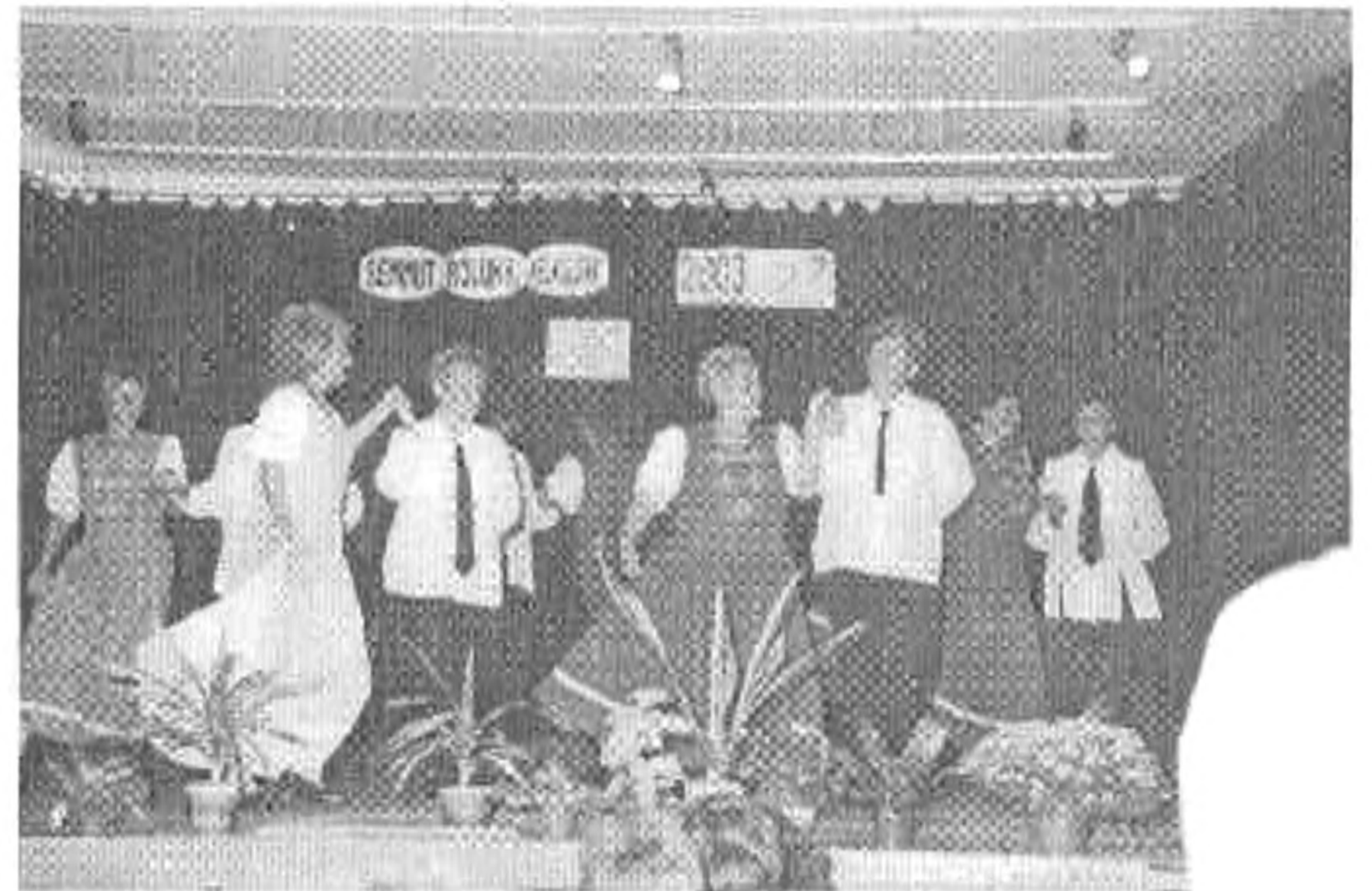
A Mesterszállási Tánckör