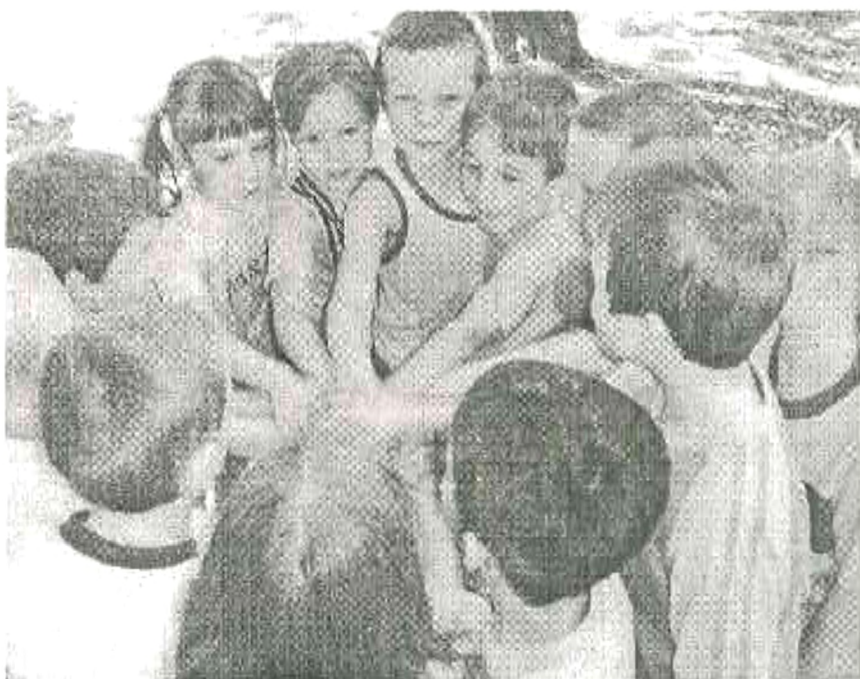
„Mi leszünk a győztesek!” – 1-b osztály

16-án megválasztottuk az év tanárát. Ezután megkezdődött a diákigazgató jelöltek kampánya. Lázasan folytak a bemutatkozások, plakátokat készítették, ismertették programjaikat, próbálták meggyőzni társaikat, hogy rájuk szavazzanak.