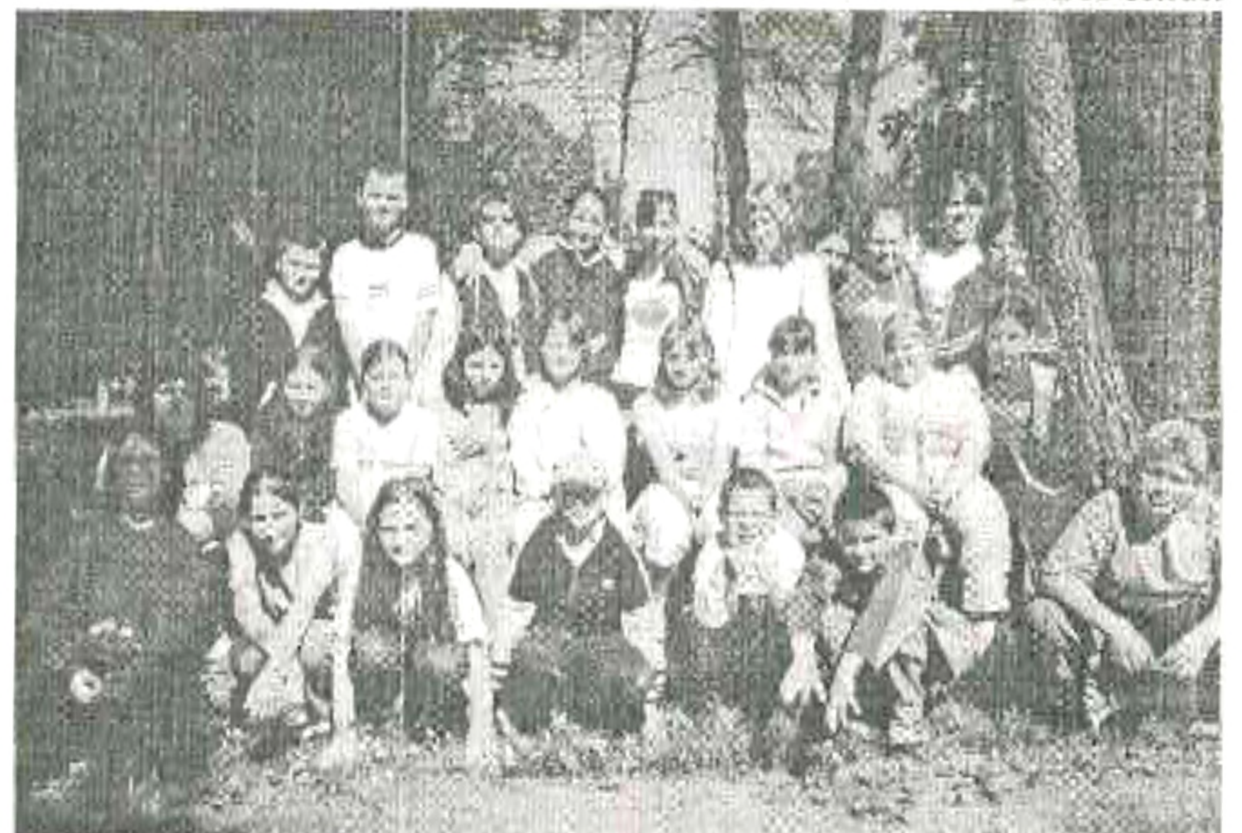
A Fűvészkert fái alatt