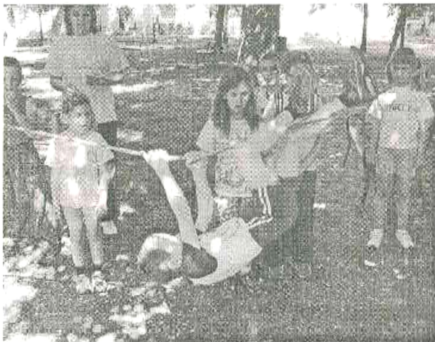
Kötélmászás a „mocsár felett”

A május mozgalmasan telt iskolánkban. Az alsó évfolyamok az utolsó házi tanulmányi versenyre készültek, közben a Fordított nap előkészületei zajlottak.