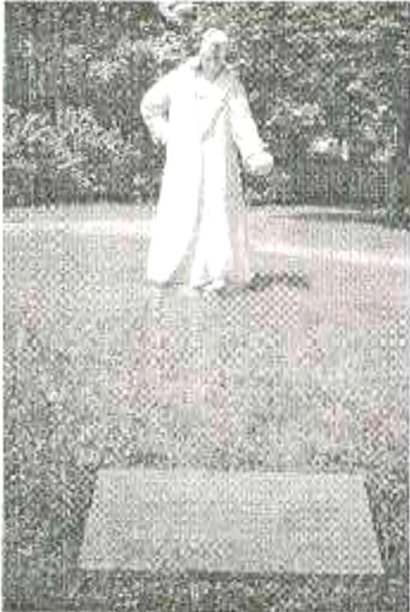
Copernicus szobra Ógyallán

Egy hónapja már, hogy személyigazolvánnyal utazhatunk a Felvidékre. Nem mondom, hogy határátlépés, mert egy 1000 éves államot utólag, csak úgy nem érdemes darabolni. Hiszen a Kárpát-medence egy tökéletes egység. Isten áldotta föld ez, a magyarság hazája, ahonnan csak vendégségbe lehet elmenni, hogy azután visszatérve érezhessük megint milyen jó itthon lenni. Akkor hát ne késlekedjünk, irány a Felvidék!