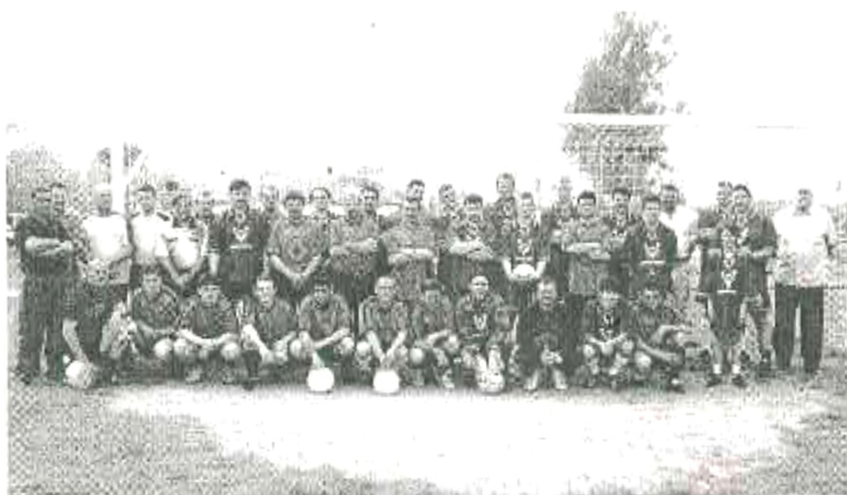
A fenti kép tavaly augusztus 20.-án készült, és mindkét csapat tagjai láthatóak rajta, mérkőzés előtt.