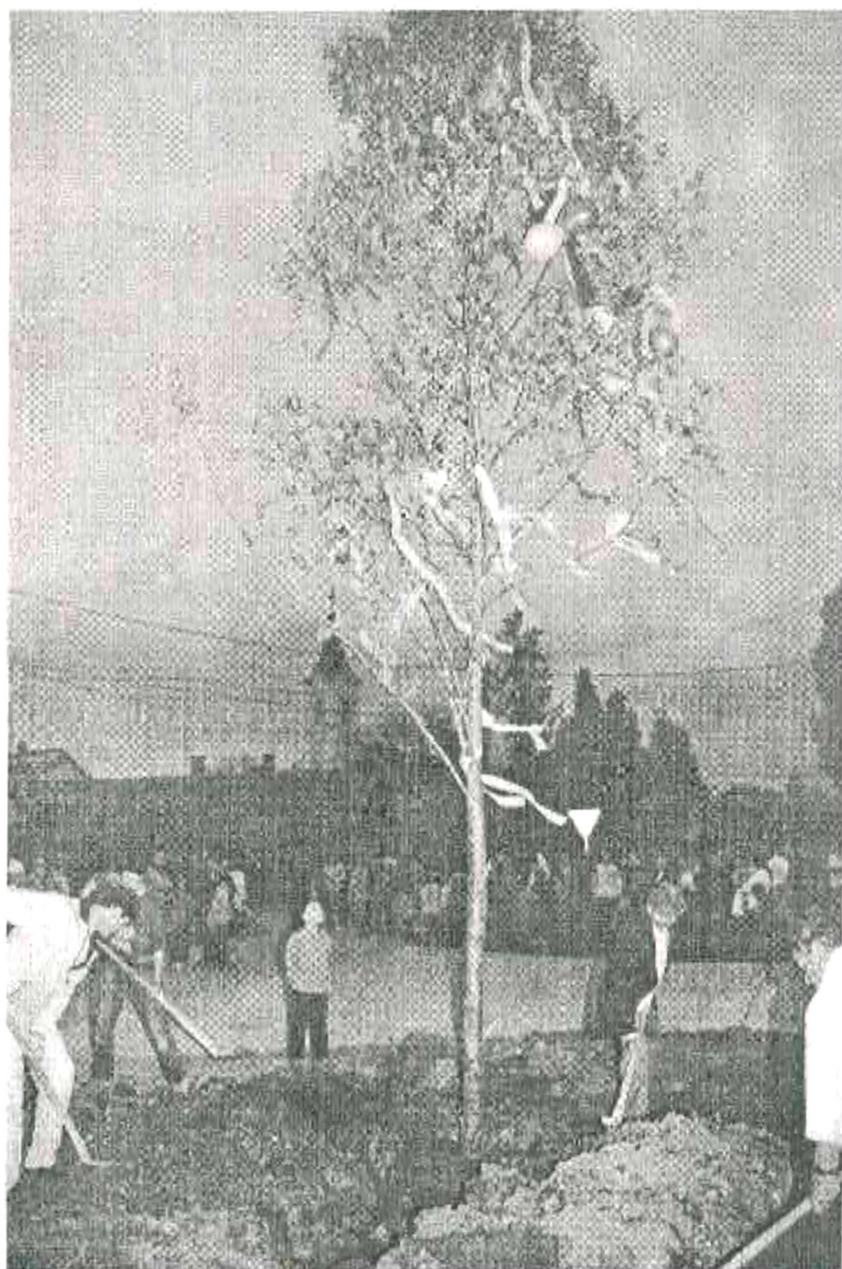
Májusfa állítás, a csatlakozás ünnepén