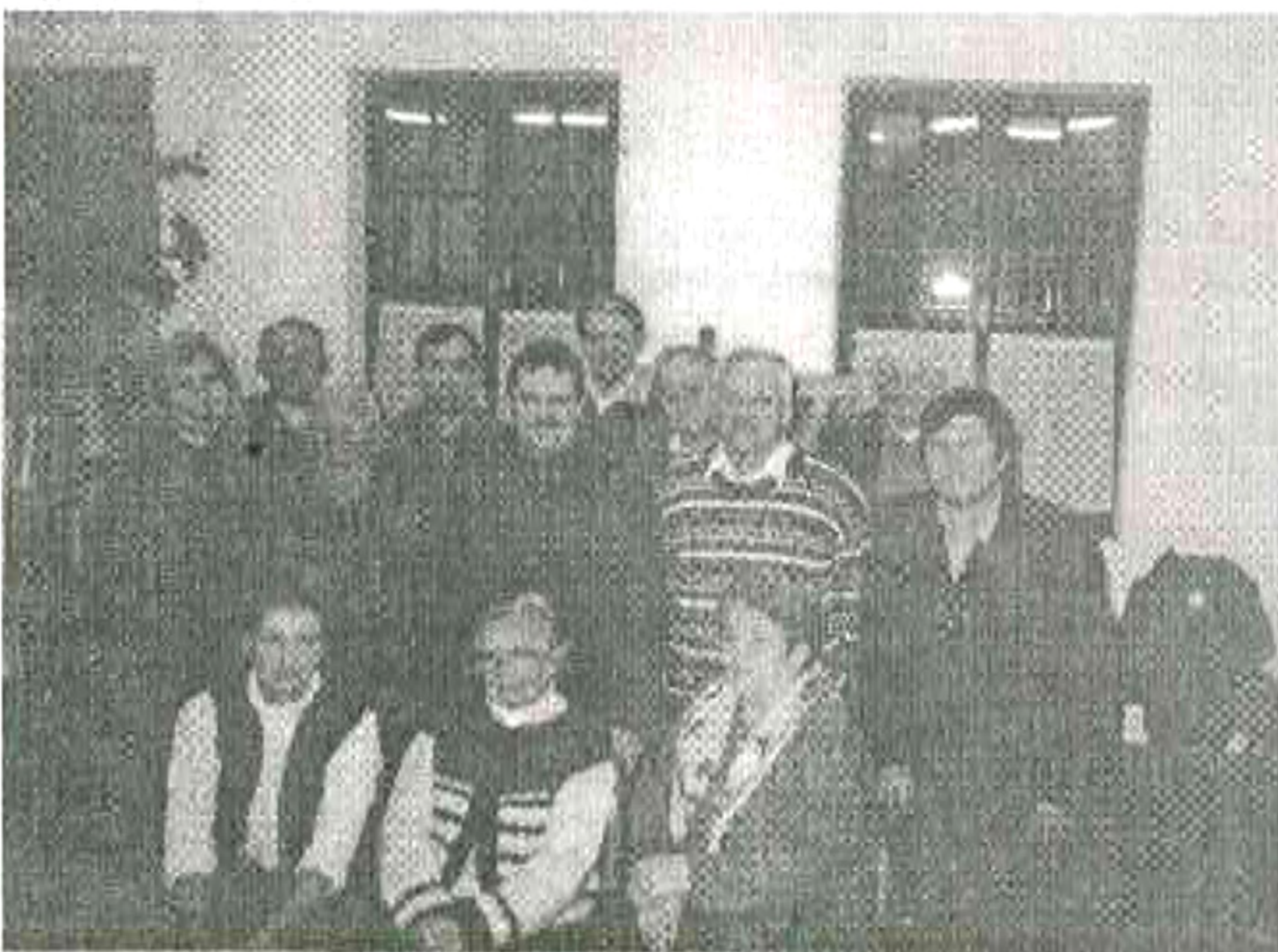
A közgyűlésen részt vevő egyesületi tagok

Békéssy János Helytörténeti és Hagyományörző Egyesület