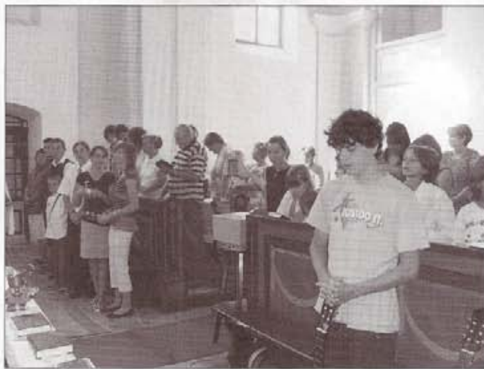
Záróistentisztelet a templomban

Összegezve, Isten nagyon megajándékozott bennünket ezzel a táborral, sok áldásban, és csodálatos élményben volt részünk. Meglepetés és öröm volt, hogy sokan jöttek, akikre nem számítottunk. Szomorúan tapasztaltuk, hogy sokan pedig teljesen távol maradtak, akiknek a jelenlétére számítottunk volna, akár a résztvevők, akár a segítők körében. Reméljük, hogy jövőre az Úr segítségével a mostani tapasztalatokra is építve, még az idei tábornál is jobb bibliai hetünk lesz. Kívánjuk, hogy akik megéreztek Isten közelségének jó ízét a táborban, azok vágyakozzanak év közben is a Biblia, Isten szava, az istentiszteletek, hittanórák, bibliai beszélgetések, az egyház közelségére. Addig is ne hagyjon minket nyugodni a záró istentisztelet bibliai idézete, amit valaki annakidején Jézustól kérdezett: „Jó Mester, mit tegyek, hogy elnyerjem az örök életet?” (Mk 10:17). Nyugtasson meg minket maga a Megváltó Úr Krisztus szava: „Az embereknek ez lehetetlen, de az Istennek nem, mert az Istennek minden lehetséges” (Mk 10:27)