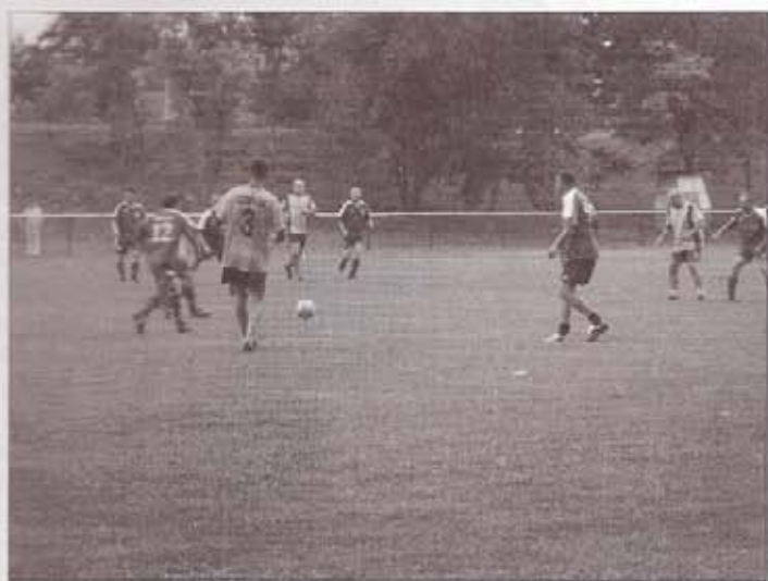
Békésszentandrás - Csorvás örgfiúk mérkőzés