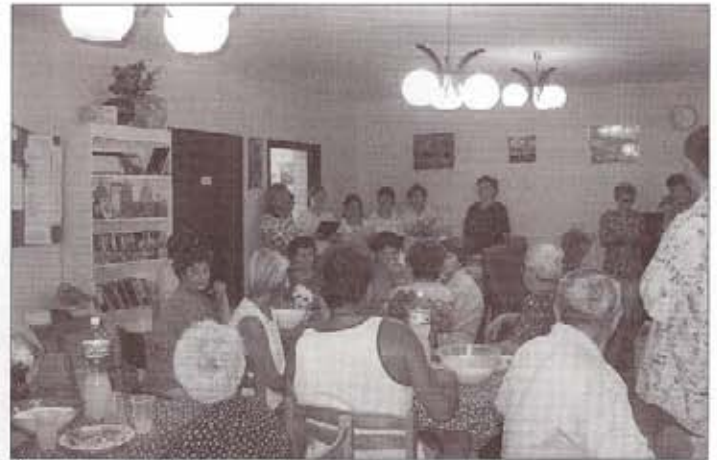
Üdítővel, szendviccsel kínáltak a furugyi klubban

Július 21-én hétfőn a mozgássérült, fogyatékkal élő embertársainkon szeretnénk volna segíteni. Gyógyászati segédeszközök felírására nyílt lehetőség az intézmény ebédlőjében. Az ortopéd szakorvos jött el hozzánk, így nem kellett utazni az egyébként is nehezen mozgó betegeknek.