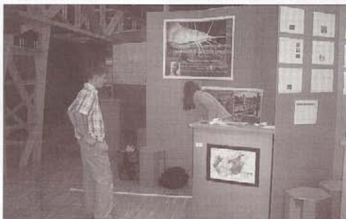
Előkészületek a papír pavilonban

Július 14-én reggel indultunk Budapestre és a délelőtti folyamán regisztráltattuk magunkat a Millenáris Parkban, a Jövő Házában, mert itt volt megrendezve az ESE 2008. A megnyitó előtt mindenki berendezte a kis pavilonját és belesöpöpentünk egy nagyon érdekes világba.