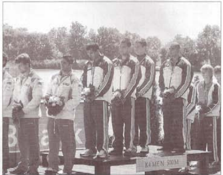
Meghatódva hallgatják a magyar Himnuszt