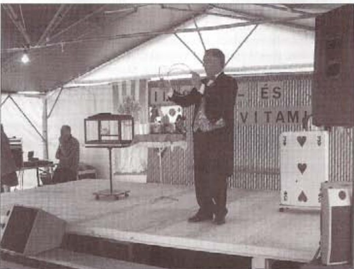
Molnár Imre illuzionista műsora