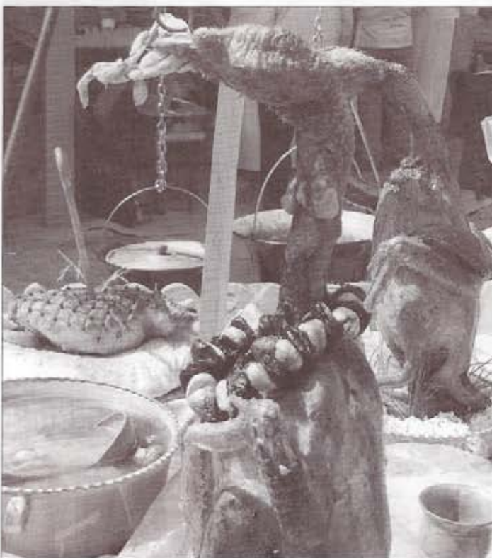
Az elkészült „alkotások” egy része