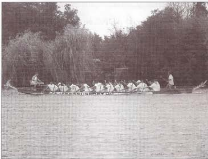
Versenyben a sárkányhajó