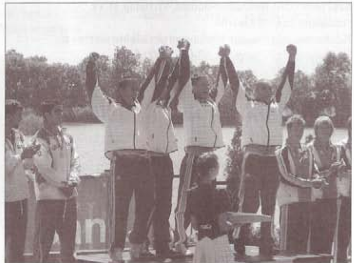
A győzelmi dobogó tetején