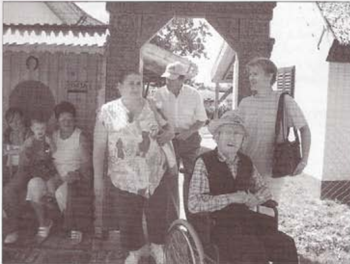
Agyönyörű székykapu mellett