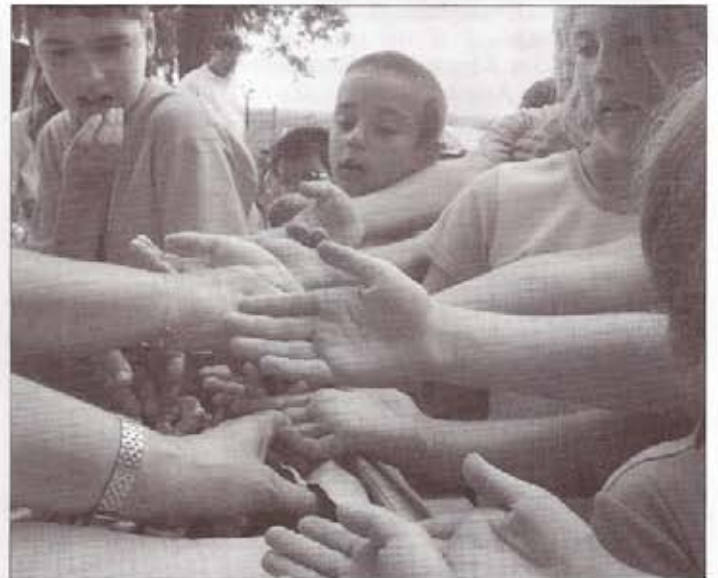
A kezek a frissen sült percre várnak