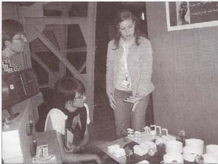
Az érdeklődőknek németül beszéltek a halelepek makettjéről