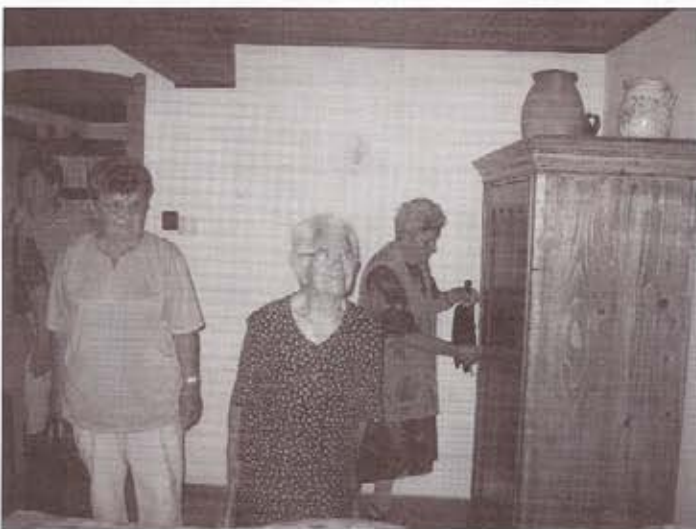
Még a szekrénybe is benéztünk

Innen elsétáltunk a közösségi házba, ahol már vártak minket az Ótemplomi Evangélikus Egyház furugyi nappali klubjának a tagjai, vezetői. Süteménnyel, szendviccsel, üdítővel kínálták a "nagy utazókat". Jól esett megpihenni, és jól esett a szeretet, amellyel fogadtak minket. Beszélgettünk, uzsonnáztunk, és közben hallgattuk a szép dalokat, melyet a népdalkör jelenlévő tagjai adtak elő. Közösen is énekeltünk, és megígértük, hogy legközelebb Szentendrácson találkozunk, rendszeressé téve ezt a kapcsolatot.