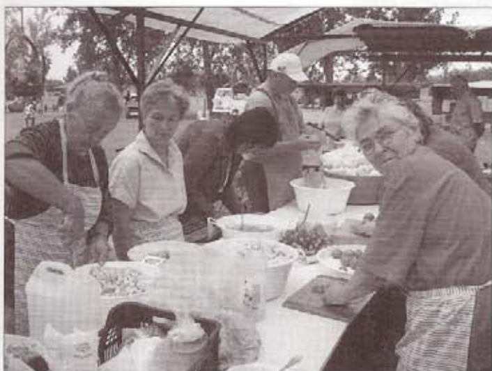
Készülnek a saláták