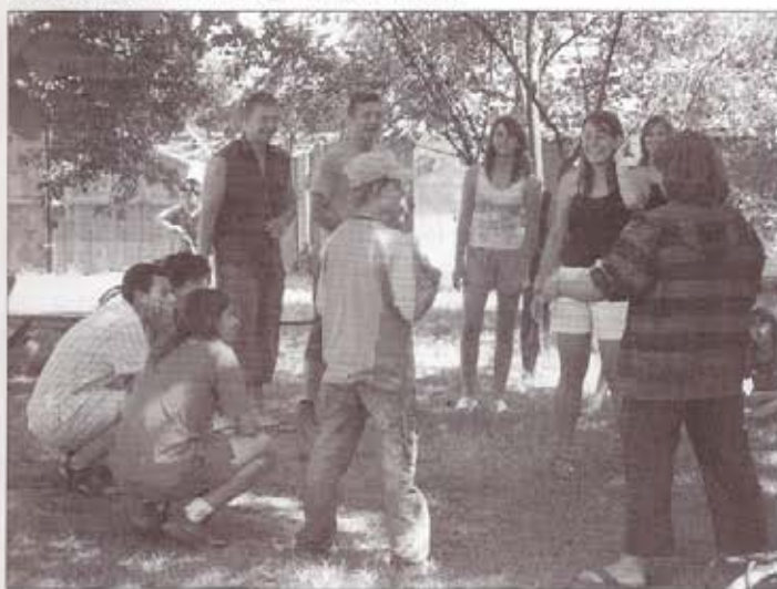
Vidám ifjúsági élet a parókián udvaron

A tábor igen jó hangulatban telt el, sokat jelentett a lelkes éneklés, gitárokkal, hegedűvel vezetve.