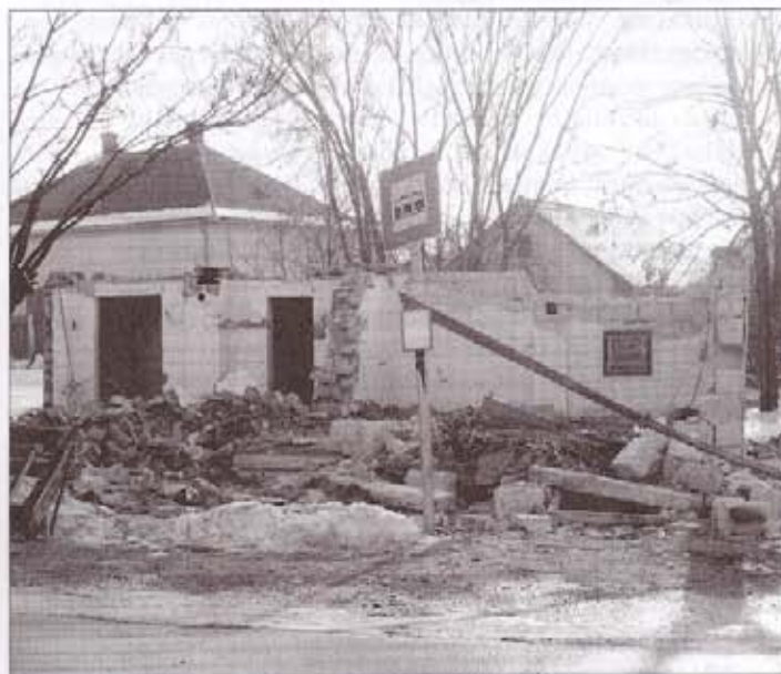
A kisbuszmegálló bontás közben