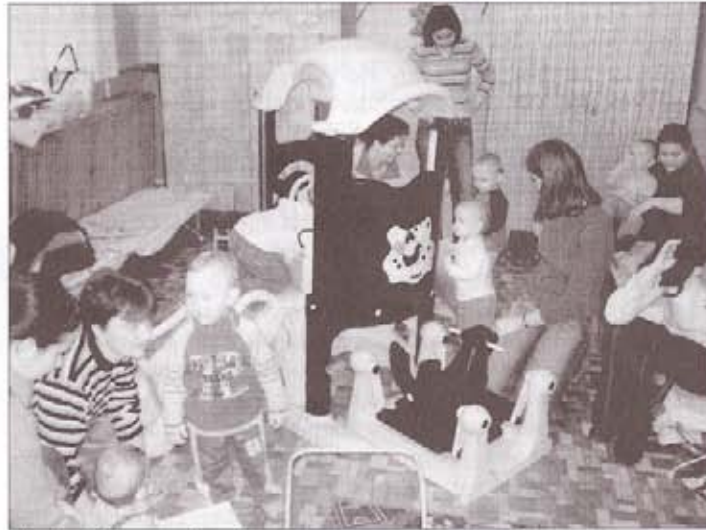
Az én házám az én váram