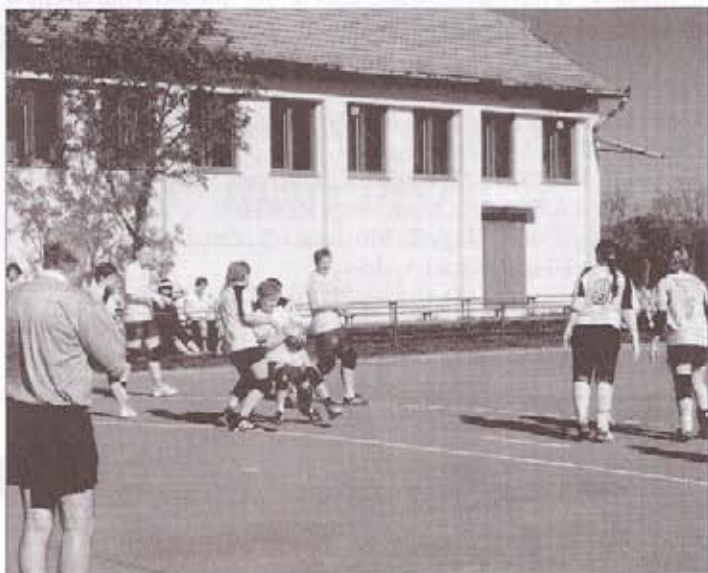
Kézilabdás lányaink meccs közben

A jelentéseket és beszámolókat a klubtagok egyhangúlag elfogadták. Az Önkormányzat részéről Hévízi Róbert alpolgármester úr gratulált a klub vezetésének és sportolójának az elért eredményekhez és arról biztosította a vezetést, hogy a jövőben is támogatják a klub működését, lehetőséget adva így a szentandrás lányoknak, asszonyoknak a mozgásra, sportolásra.