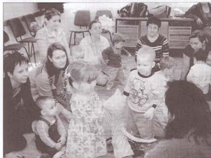
Cirmos cica hajj...