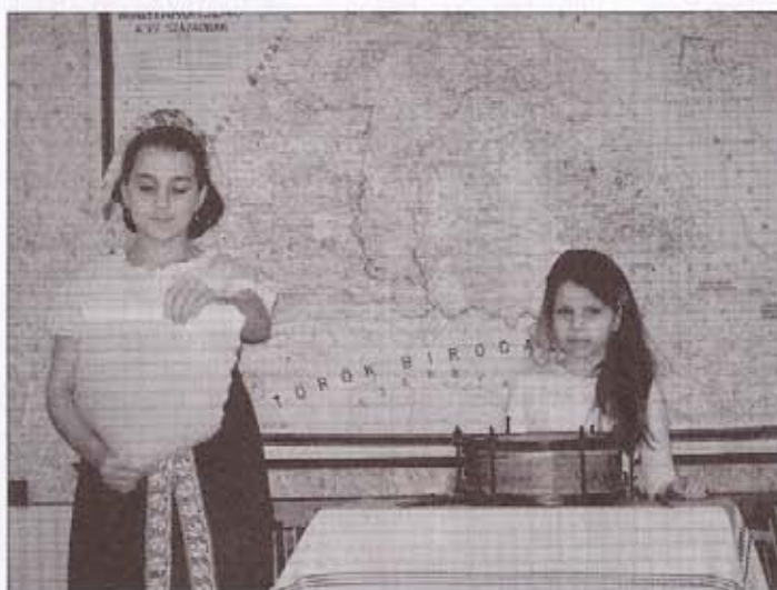
A pályázati felhívások kihirdetése

A rendezvénysorozat február 23-án, Mátyás születésének 565. évfordulóján kezdődött, amikor egy kiállítás megnyitására került sor. A tárlaton végigkísérhették az érdeklődők az igazságos nagy király életét és munkásságát, valamint izelítőt kaphattak az akkori kor művészeti stílusáról, a reneszánszról.