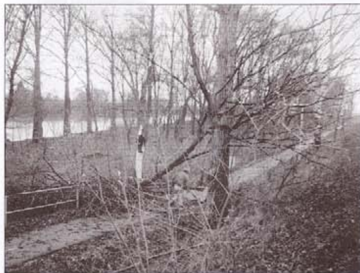
Fák dőltek a kerékpárútra