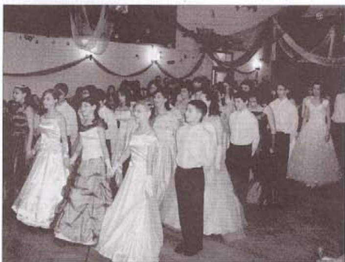
„Egyszer véget ér a lázas ifjúság” - hangzott a nyolcadikosok búcsúdala utolsó általános iskolai farsangjukon