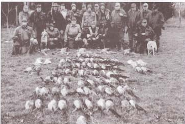
November 11-e, 21 vadász: 68 fácán, 4 nyúl, 5 róka a terítéken

A vadászatokon általában 15-20-an vettünk részt, ettől csak egy esetben volt eltérés, amikor vendég-hívási lehetőség volt. Ekkor több mint 30-an vadásztunk. A elmúlt évekhez képest az eredmények jobbra sikerültek, de azért nem „szálltunk el”, igyekeztünk mértékletességet mutatni, mert nagyon számítunk a jövő évi szaporulatra. A vadászatok végén általában önköltséges-majdnem mindig volt egy szerény ebéd, melyek után sokszor sokáig beszélgettünk, ápoltuk a barátságokat. Mert a vadászatnak a szenvedély mellett, a kulturált szórakozás a lényege!