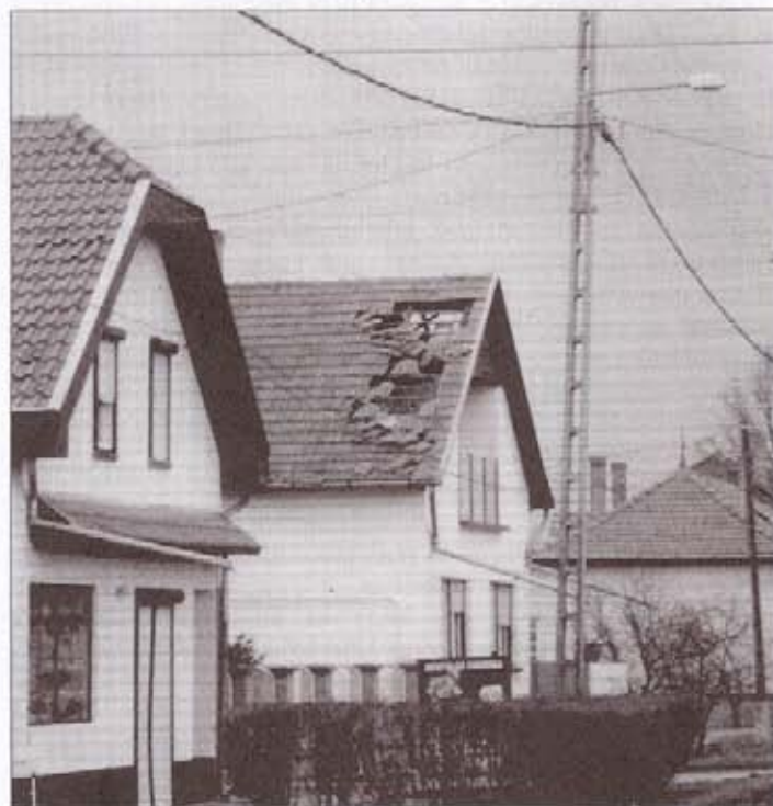
Háztetőt bontott meg az Emma orkán

A nem mindennapi természeti jelenség után egy kis ideig akadozott a telefonszolgáltatás és a villamosenergia-ellátás.