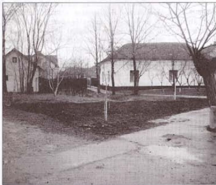
Megtörtént a fásítás