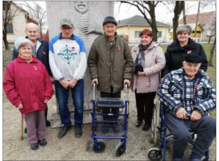
Időseinkkel a Kossuth domborműnél

Bízunk abban, hogy a felnövő nemzedék számára példamutató értékű ez a kezdeményezés!