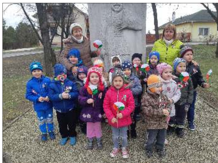
A Süni csoport is látogatást tett a Kossuth Emlékparkban