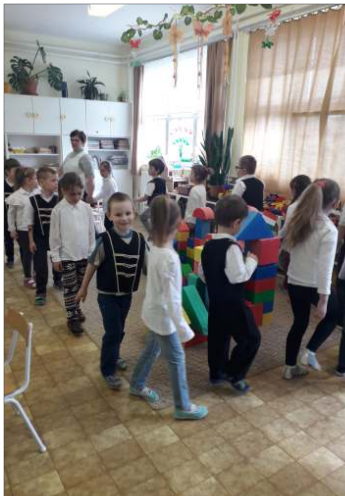
A Katica csoport ünnepi megemlékezése

Hagyományainknak megfelelően emlékeztünk meg az 1848-49 szabadságharcról.