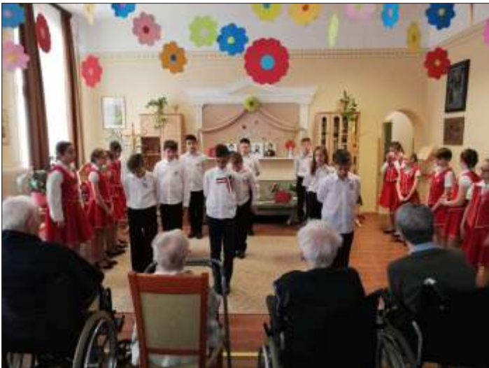
Az 5. osztályosok Március 15-ei műsora