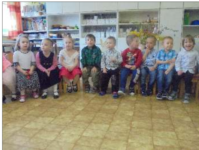
Húsvéti Családi Játsszóház az óvodában