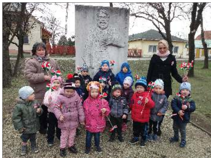
A Kossuth domborműnél járt a Körte csoport