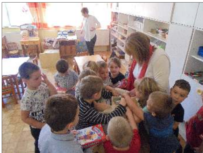
... és a Süni csoportban

A játékok megvásárlását a fenntartó és az óvodai SZMK tette lehetővé, ezúton is köszönjük mindkettejüknek a gyermekek nevében.