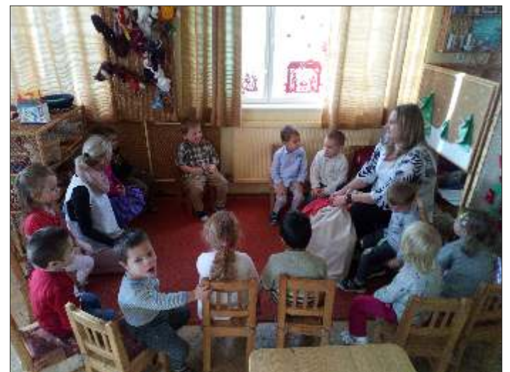
... a Körte csoportban, ...