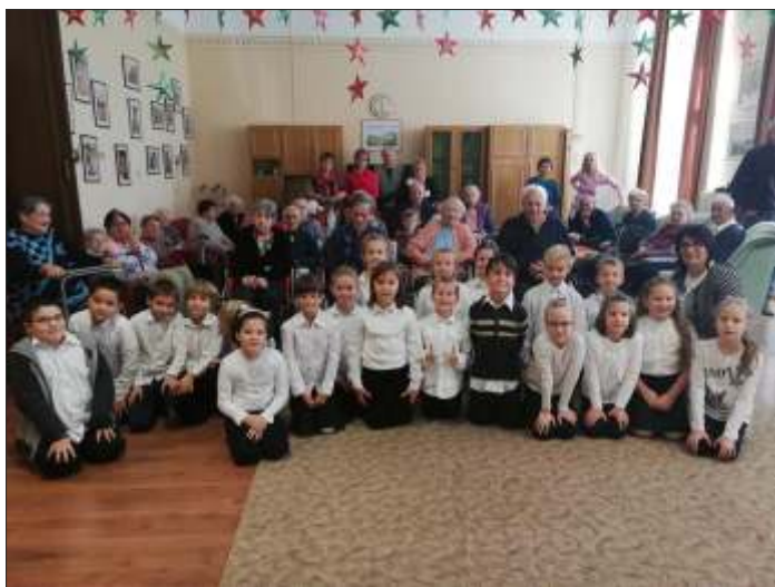
A 2. osztályosok az idősek körében

A 2. osztályosok műsorát tekinthettük meg. Kedves, érzelmekkel teli előadás volt. Köszönjük!