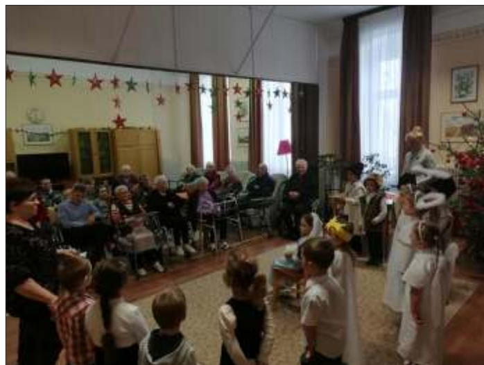
Az Katica csoport óvodásai betlehemi műsorral kedveskedtek az időseknek

Talán nem mindenki számára hozott lelki megnyugvást az ünnepi időszak, de sose felejtjük el, hogy nem vagyunk egyedül, és hogy mindig van honnan segítséget kérni.