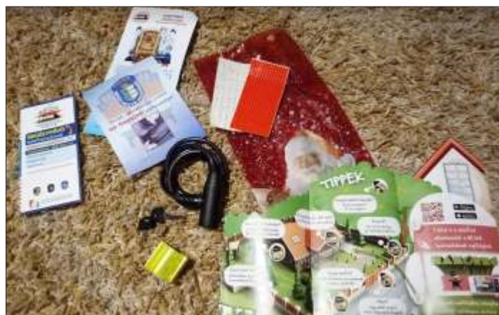
Ajándék a Mikulástól