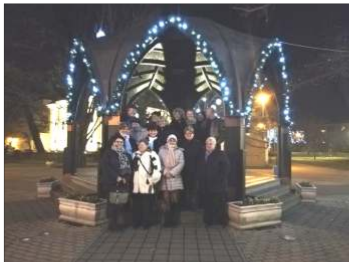
A zenepavilon előtt Szarvason

Köszönjük szépen! Jövőre is szeretettel várjuk Öket.