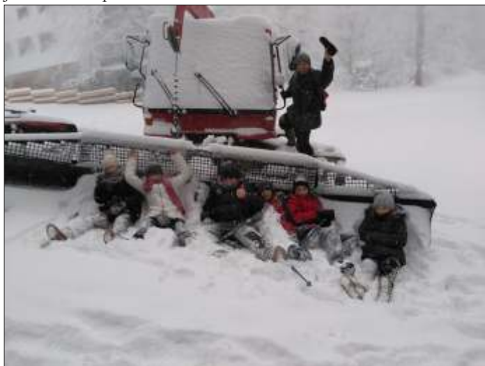
Békésszentandrás hittanosok a hegyi óriás hókotró ölelésében a Mátrában

December 15-én egynapos téli hittanos élménypedagógiai edző napra mehettünk a Kékesre és Mátraházára a Református Üdülőbe. Utunkat sok bibliai történet, idézet, keresztyén ének-zene, vegyes kulturális ismeretek, áhítat, finom ételek és persze óriási hó élmény gazdagította. Köszönjük mindazok támogatását, akik ezt lehetővé tették. Januárban szeretnénk újabb, ezúttal kétnapos kirándulásra menni családosan, nagyobb létszámban, aki szeretne jönni, kérjük, jelezze a lelkipásztornak.