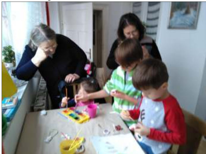
Adventi kézműveskedés a református parókián szobrászművészi segítséggel