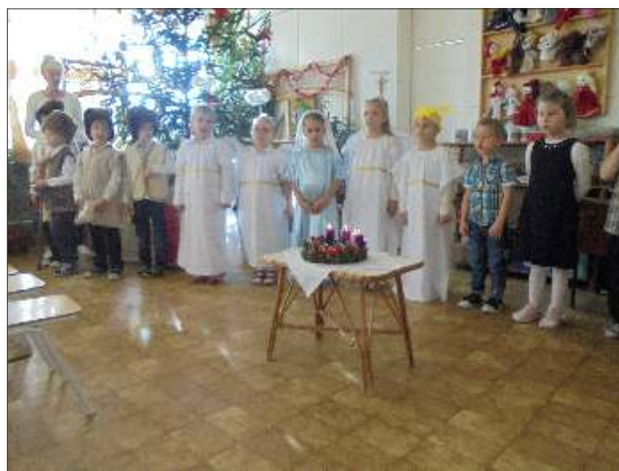
Ovikarácsony - Betlehemes

A Katica csoport a Gondozási Központba is ellátogatott karácsonyi műsorával.