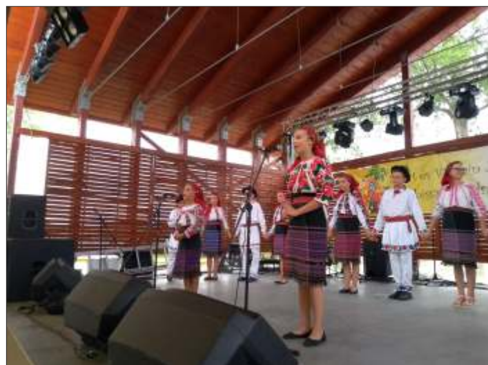
Fellépés a Sport- és Vitamin-napon