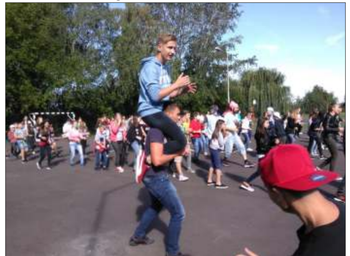
A békésszentandrásiak élenjáró kedvencei és kedvesinálói voltak a 170 fiatalból álló református balatoni Bárka tábornak