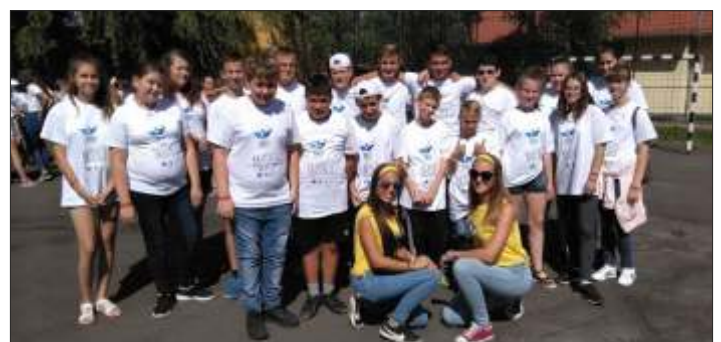
A számos kisebb csoport egyike, ahol a békésszentandrási fiatalok java része került más helyről érkezettekkel együtt - a tábor végére nagyon jó közösséggé formálódtak a kiscsoportok