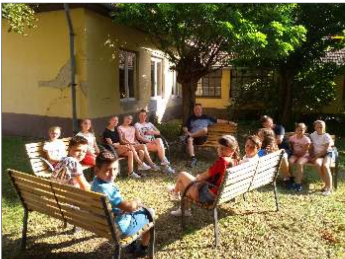
Közös tanulás a szálláshelyen

A legnagyobb meleg nyár közepén érkezett fiatalokat idén is megfelelő programokkal vártuk. Pedagógusok, oktatók