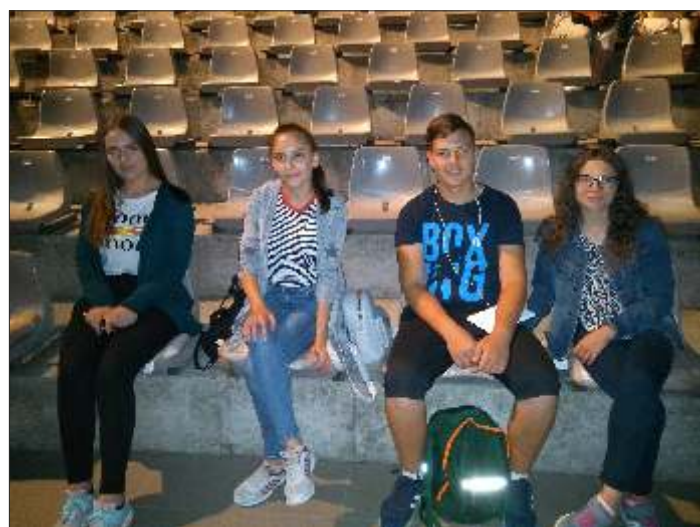
A Szarvasi Vizi Színházban

Evangélikus Egyháznak és a Szeretetotthon dolgozóinak, Gallicoop Zrt.-nek, Szarvasi Mozzarella Kft.-nek, Szarvasi Agrár Zrt.-nek, Mezőmag Kft.-nek, Geomark Kft.-nek, a helyi COOP