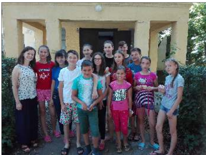
A csángó gyerekek