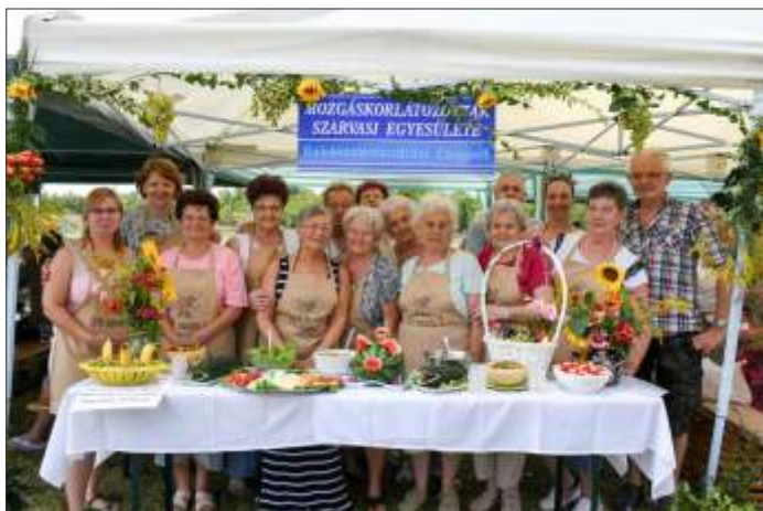
A lelkes csapat