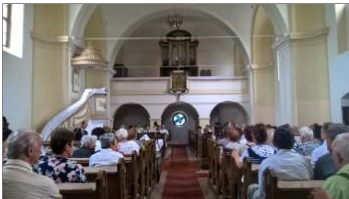
Ritka szép alkalom: tele padosorok a református templomban az Istent dicsérő hangversenyen 2018. június 17-én

Egyedülállóan szép kórus muzsikát hallhattunk 2018. június 17-én vasárnap a békésszentandrási református templomban: A Fóti Református Egyházközség történelmi vegyeskara, a Békésszentandrási Dalkör, és a Békésszentandrási Hunyadi R. Kat. Ált. Iskola kamarakórusa részesített bennünket közösen felemelő élményben. A Bibliában olvashatjuk: „Dicsérjétek az Urat” mindenféle hangszerrel, énekkel. Méltó is, hogy Istennek adjunk dicsőséget jóságáért, hatalmáért, szeretetéért egyéni csendességünkben és nagyobb szabású zenei rendezvényeken egyaránt. Jézus Krisztus megváltott minket, megszabadított a halál és a gonosz hatalmából, és azért jött, hogy életünk legyen, sőt bőségben éljünk. Ez az öröm és lelkiület hatotta át vendégeink énekes szolgálatát, amelyet időnként még emlékezetesebbé tett a fóti kórus tagok személyes bizonyágtétele, vallomása Istenről, hitükről. Sokan tettek azért, hogy ez a páratlan alkalom létrejöhessen, ezúton is köszönetet mondunk minden közreműködőnek, segítőknek a munkájáért, szolgálatáért. A koncerthez kapcsolódó templom felújításunkra kapott perselypéNZ adományokat is köszönjük. Szép templomi együttléttünk egy rendkívül vidám, közösség formáló valódi szeretetvendégséggel koronázott meg a parókia kertben. Éljen szívünkben a vágy, hogy más hasonló élményekkel gazdagodhassunk még a jövőben is, és éljen szívünkben a koncert után is Isten daloló dicsérete!