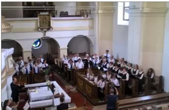
A három egyesített 50 fős kórus (Fóti Reformátusok, Békésszentandrási Dalkör, Békésszentandrási Ált. Isk. kamarakórusa) csodálatosan bezengte szép műemlék templomunkat és lelkünket